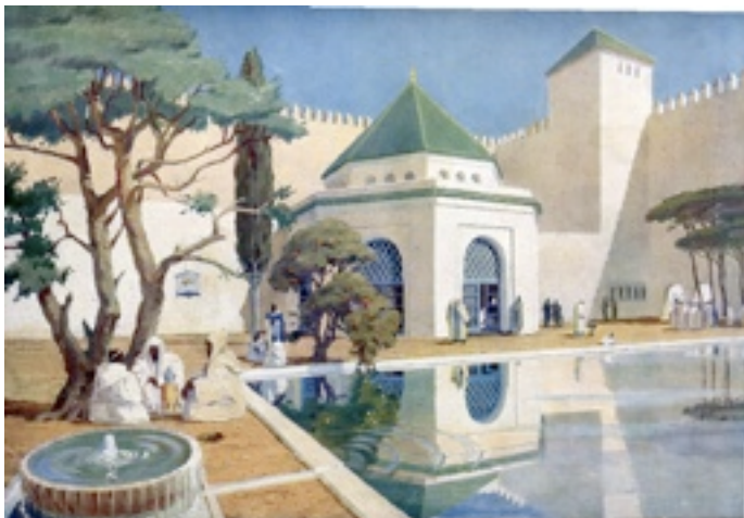
Le Pavillon du Maroc à l'Exposition Coloniale Internationale

Il faut hélas aussi rappeler que le Cartel des gauches arrivé au pouvoir en France en 1924 a poussé le Maréchal Lyautey à la démission en 1925, avant de commencer à détricoter ce qu'il avait réussi. Cette même obsession de dénigrement idéologique d'une période qu'on se refuse délibérément à situer dans son contexte historique peut contribuer à valider l'idée selon laquelle les incidents créés par le gouvernement français qui ont déclenché et entretenu un grave malaise pendant un an avec le Maroc, traduisent un état d'esprit. Dès 2012, le Président de la République avait ouvert la voie à une brouille en se rendant en visite officielle en Algérie avant le Maroc.