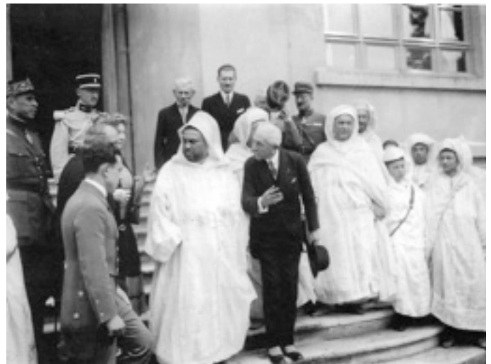
18 juillet 1926, au château Lyautey à Thorey (54115) le Maréchal reçoit SM le Sultan Moulay Youssef

C'était condamner par le mépris notre histoire commune dont on peut et doit parler car, le présent lorsqu'il assume le passé nous projette d'autant mieux dans l'avenir en termes d'estime réciproque, de projets et de prospective.