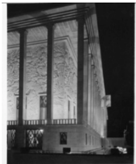
Palais de la Porte dorée (12ème)

Saturés que nous sommes d'assister impuissants et en permanence aux gesticulations écrites, visuelles et verbales - à la limite du lavage de cerveau - dont nous abreuvons bien des médias, beaucoup sont passés à côté de cette information peu ou mal relayée, malgré un message qui n'était pas anodin. Et, il faut noter que les commentateurs esclaves de l'immédiateté et de l'exclusivité n'y ont rien vu ou n'ont rien voulu y voir. Il faut concéder que le message délivré était suffisamment discret pour n'être apprécié que par les fossoyeurs de notre Histoire et pour ne pas réveiller ceux qui, faute de mieux, sont devenus fatalistes. Ce message n'a cependant pas échappé à ceux, trop rares, pour qui l'Histoire est le terreau nourricier sur lequel construire l'avenir.