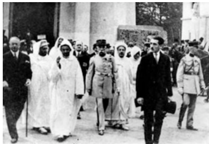
Le Maréchal Lyautey accueille le Sultan Mohammed à l'Exposition de 1931

Pour Lyautey, ce serait compter sans la lucidité de nombreuses personnalités marocaines, à commencer par SM le Sultan Mohammed ben Youssef, futur Roi Mohammed V. Accueilli à l'Exposition coloniale, il déclarait : « Il nous est particulièrement agréable de profiter de cette occasion solennelle pour apporter notre salut au grand Français qui a su conserver au Maroc ses traditions ancestrales, ses mœurs et ses coutumes, tout en y introduisant cet esprit d'organisation moderne sans lequel aucun pays ne saurait vivre désormais. »