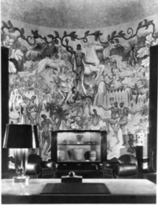
.... des chefs d'oeuvre de l'Art déco

En résumé , ce serait compter sans les résultats de la mise en œuvre du traité de protectorat dans sa lettre et son esprit par Lyautey qui ne s'est pas laissé détourner de sa ligne de conduite visionnaire par des changements et des pressions politiques défavorables à l'avenir du Maroc. Il a œuvré pendant treize ans dans le but de moderniser le Pays dans le respect de ses traditions et d'affermir l'autorité du Sultan dans la perspective de l'indépendance du Royaume chérifien.