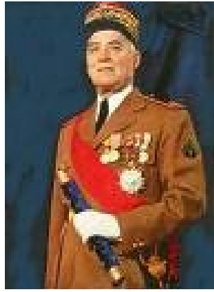
Maréchal Alphonse JUIN