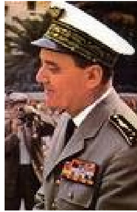
Général Edmond JOUHAUD