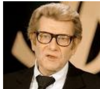
Yves Saint LAURENT