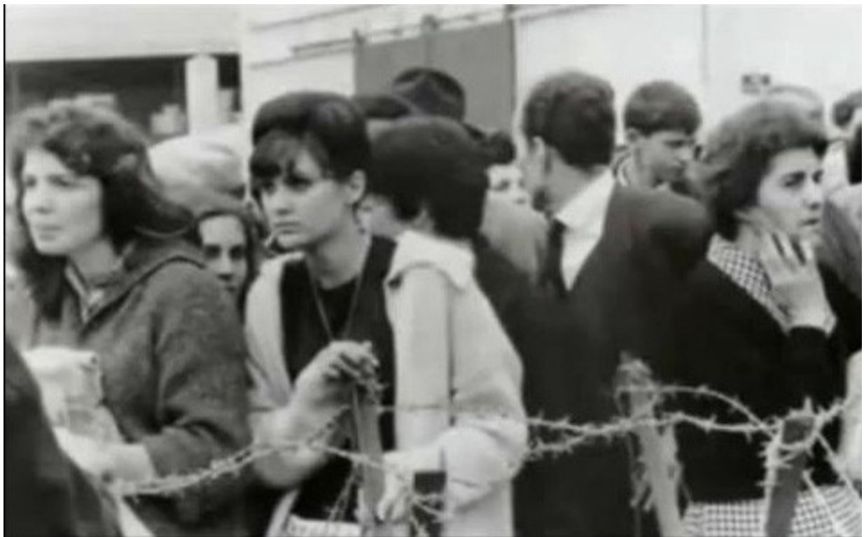
Contenus par des barbelés