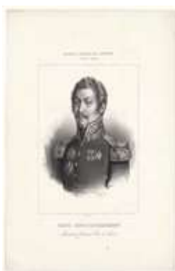
Charles-Marie Denys DAMREMONT (comte de, 1783-1837).

Le corps expéditionnaire embarque à Toulon le 11 mai, les troupes françaises sont le 14 juin, à Sidi-Ferruch pour combattre. Le dey (régent) capitule le 5 juillet. La guerre de conquête sera longue et brutale. A Paris, les partisans de l'occupation restreinte et ceux de l'occupation totale s'affrontent... En Décembre, le général Damrémont occupe définitivement Mers-El-Kébir et arrive à Oran par la montagne.