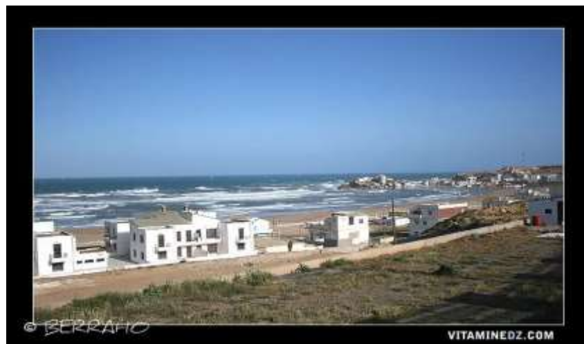
La plage TERGA

« Il existe une autre plage située seulement en partie sur la commune d'Er-Rahel, c'est la plage de Terga, près de Turgot. Une cinquantaine de villas y sont situées qui dépendent de la commune. Cette portion de plage est reliée à celle de Turgot par un pont qui enjambe la rivière Rio-Salado.