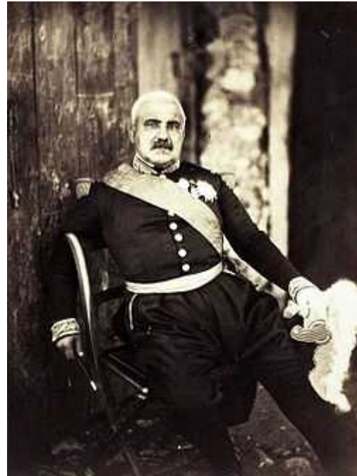
Maréchal Aimable PELLISSIER (1794/1864)

http://alger-roi.fr/Alger/cdha/textes/21_monseigneur_pavy_cdha49.htm