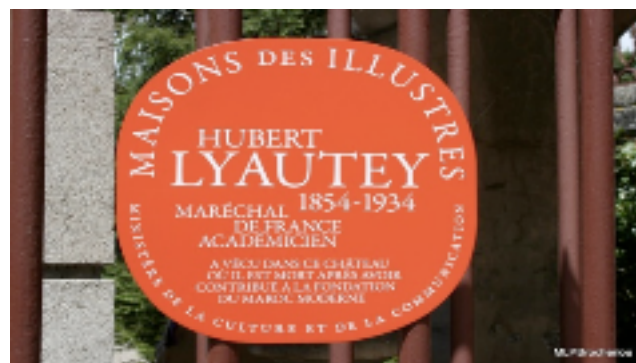
Le château est labellisé "Maisons des Illustres"