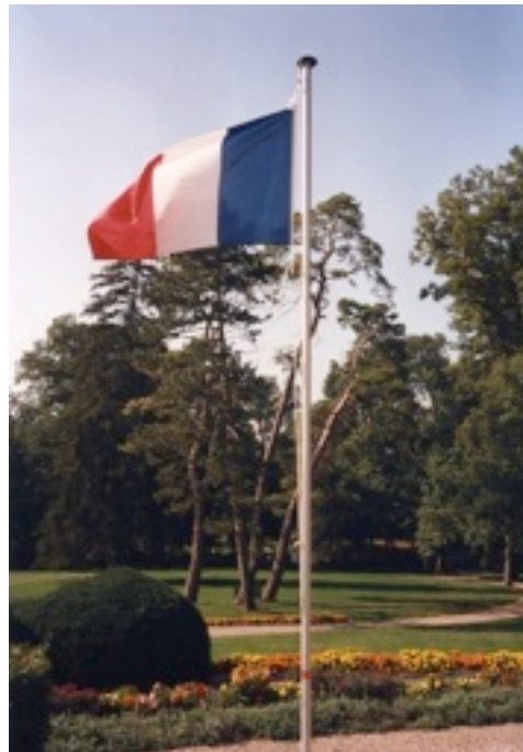
Dans le parc du château de Thorey-Lyautey

L'ASSOCIATION NATIONALE MARÉCHAL LYAUTEY FÉDÈRE CELLES ET CEUX QUI SONT FIERS D'AVOIR PARTICIPÉ À LA GRANDEUR DE LA FRANCE OUTRE-MER ET N'ACCEPTENT PAS D'ÊTRE TRAITÉS DE CRIMINELS. ELLE CONDAMNE LE DISCRÉDIT IMPARDONNABLE JETÉ SUR LA FRANCE ET SON OEUVRE INCONTOURNABLE SOUVENT CONTRARIÉE PAR L'OBSCURANTISME ET LE SECTARISME.