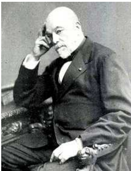
Ismaël URBAIN (1812/1884)

Inspiré par Ismaël URBAIN dans le cadre de la politique du « royaume arabe » de Napoléon III