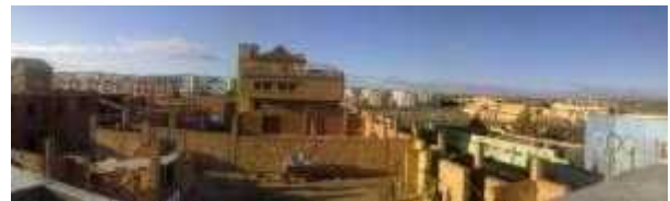
Vues de BENI SLIMANE