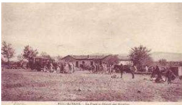
Autobus de BENI SLIMANE en 1950