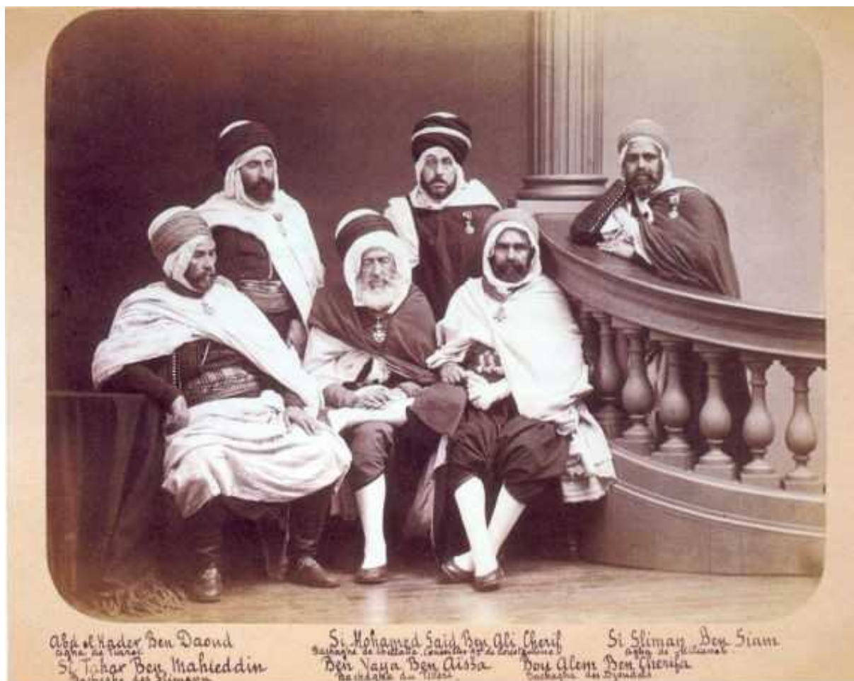
La légende porte : « Chefs de tribus décorés de la Légion d'honneur à l'occasion du voyage de Napoléon III en Algérie - 1860 »