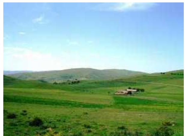
BENI SLIMANE au printemps