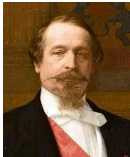
Charles Louis NAPOLEON (1808/1873)

https://fr.wikipedia.org/wiki/Isma%C3%BEl_Urbain