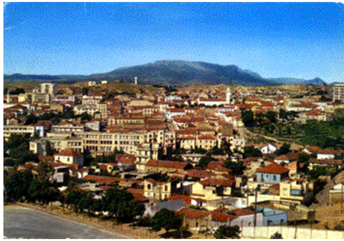
Vue de SOUK-AHRAS

https://fr.wikipedia.org/wiki/Franciade_Fleurus_Duvivier