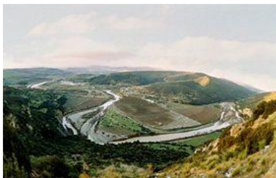
La SEYBOUSE (région de GUELMA)