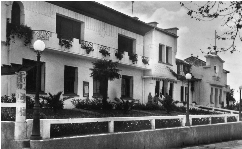
LAVERDURE : Siège de la commune mixte de LA SEFIA peu après sa construction en 1935.

Dès lors des centres agricoles furent créés dans la région de GUELMA : en 1848, MILLESIMO. PETIT, HELIOPOLIS ; en 1856 : KELLERMANN et GUELAA BOU SBA ; en 1857, DUVIVIER et en 1863, OUED ZENATI. Plus tard d'autres centres s'ajoutèrent aux anciens, dont en 1874, LAVERDURE qui deviendra chef lieu de la commune mixte de la SEFIA.