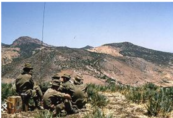
Surveillance de la ligne MORICE par des soldats français à SOUK AHRAS

La bataille des Frontières, ou bataille du barrage, est l'ensemble des opérations militaires menées principalement sur la frontière algéro-tunisienne pendant la guerre d'Algérie, du 21 janvier au 28 mai 1958, par les unités parachutistes de l'armée française contre les tentatives de franchissement en force du barrage de la ligne MORICE par les combattants algériens de l'Armée de libération nationale (ALN), la branche armée du FLN, stationnés en Tunisie. Elle fut la plus grande bataille de toute la guerre d'Algérie.