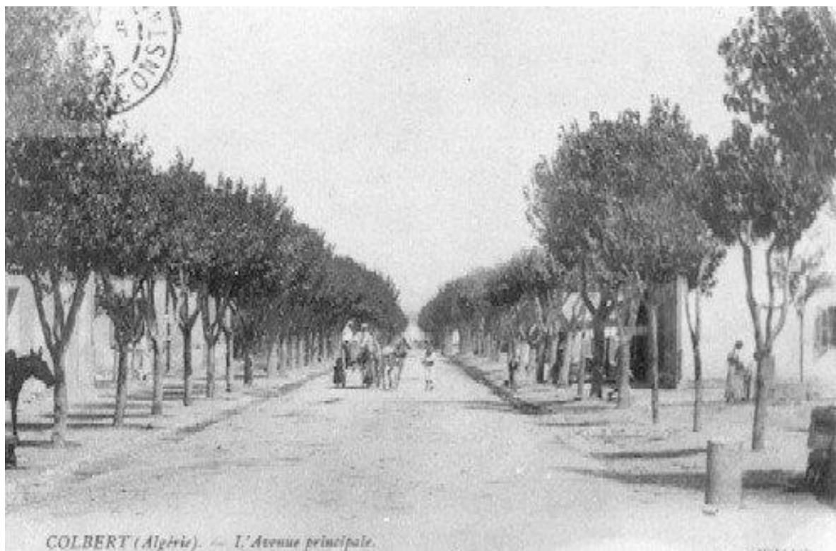
COLBERT : chef lieu de la Commune mixte des RHIRA

L'Arrondissement de SAINT ARNAUD comprenait 11 centres : AMPERE - BEHAGLE - BELLAA - CHASSELOUP LAUBAT - COLBERT - GUELLAL - NAVARIN - PASCAL - PIERRE CURIE - SAINT ARNAUD - SILLEGUE