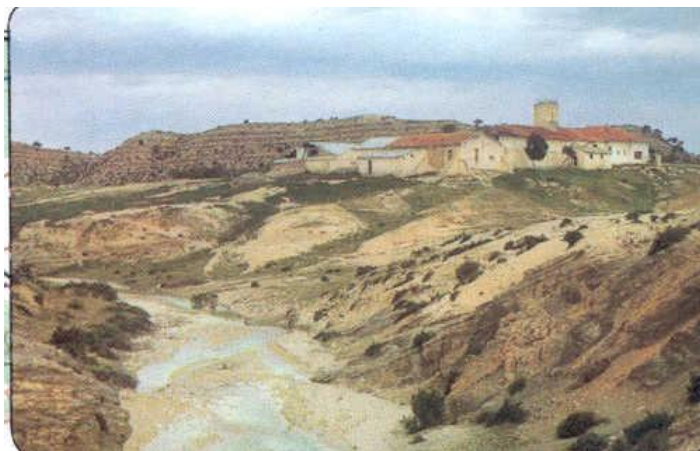
Le village de Sakiët-Sidi-Youssef

A 8 h 45, les renforts arrivent de SAKIET. Une section, qui est prise, dès sa descente de camion, sous le feu des rebelles tirant depuis un piton tunisien, le djebel Arbained OULI. La 9 e compagnie du régiment, venue de Bordj M'RAOU avec le lieutenant HUC, débarque à 2 km au nord du fortin où se trouve ALLARD. Elle aussi est prise sous le tir venu de Tunisie, qui la cloue au sol. ALLARD raconte :