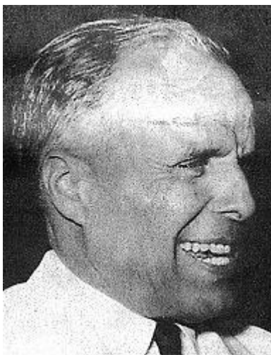
Habib BOURGUIBA (1903/2000)

http://fr.wikipedia.org/wiki/Habib_Bourguiba