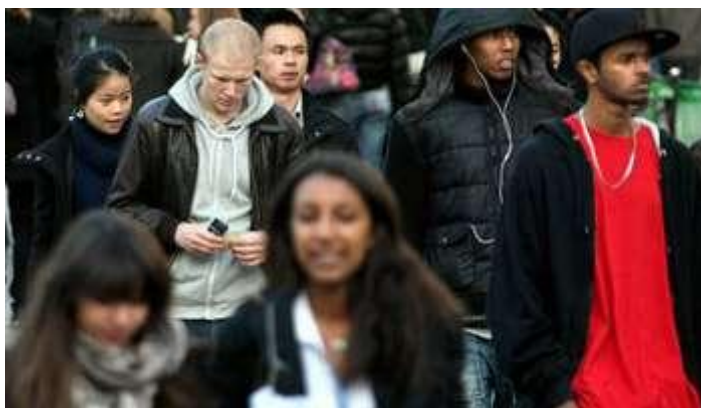
Une rue de Paris en 2009.

En France, le président de la République, François HOLLANDE, a rejeté la mise en place de statistiques ethniques lors de la 5 e grande conférence de presse de son quinquennat, jeudi 5 février. Voici cinq clés pour mieux comprendre les enjeux de ce débat.