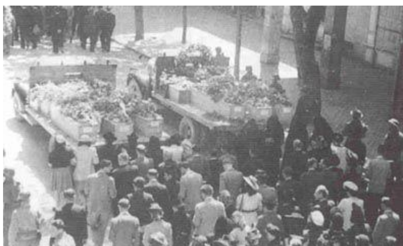
Enterrement de victimes

A partir de 15 heures, des armes sont volées au Bordj, avec la complicité de ceux qui les gardaient et 13 Européens de ce village périssent sous les coups des assassins, il s'agit de :