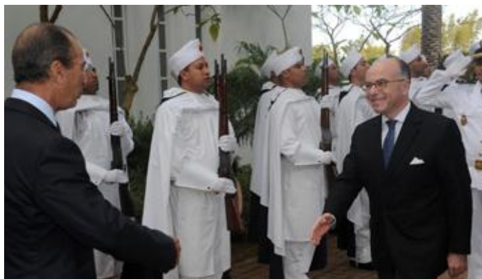
Le ministre français de l'Intérieur Bernard CAZENEUVE et son homologue marocain Mohamed HASSAD

Le ministre français de l'Intérieur Bernard CAZENEUVE, en visite au Maroc, a annoncé samedi que Paris décorerait prochainement le patron du contre-espionnage marocain, visé par une plainte pour "torture" en France, ce qui avait entraîné une crise diplomatique entre les deux pays.