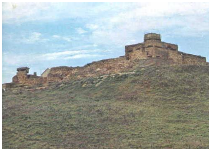
Poste Sonnette du 23° RI

« Jusqu'à la dernière cartouche, dit-il. Il n'y aura pas de survivant ».