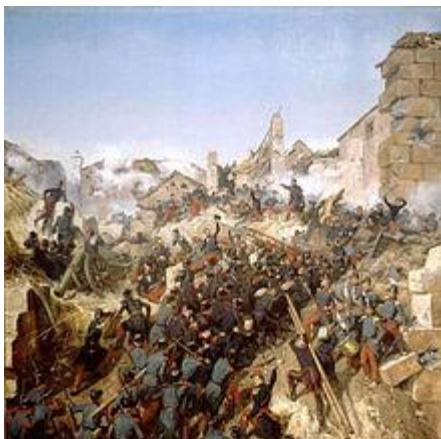
La prise de Constantine (1837), par Horace VERNET.

En 1832, le colonel PERREGAUX est mis à la disposition du Maréchal de Camp, Commandant supérieur de BÔNE. En 1837 il est nommé Chef d'état-major général de l'Armée d'Afrique et prépare la deuxième expédition de CONSTANTINE où il est grièvement blessé lors de l'assaut de la ville le 12 octobre 1837.