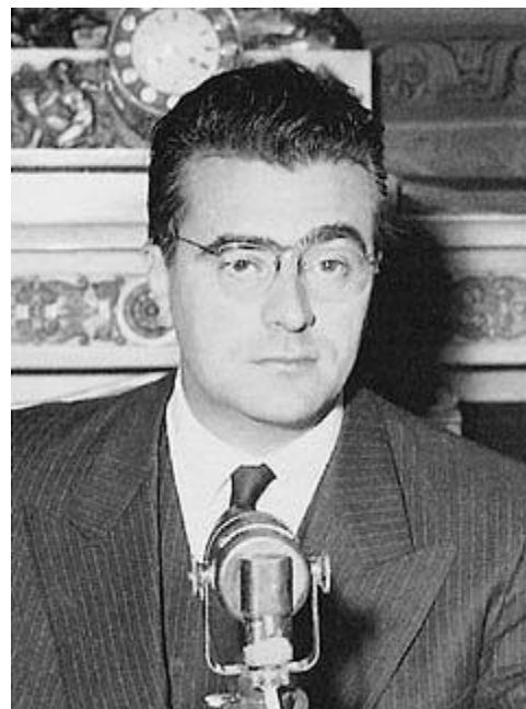
Félix GAILLARD (1919/1970)

http://fr.wikipedia.org/wiki/Habib_Bourguiba