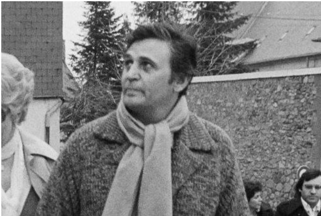
Un cliché de 1978.