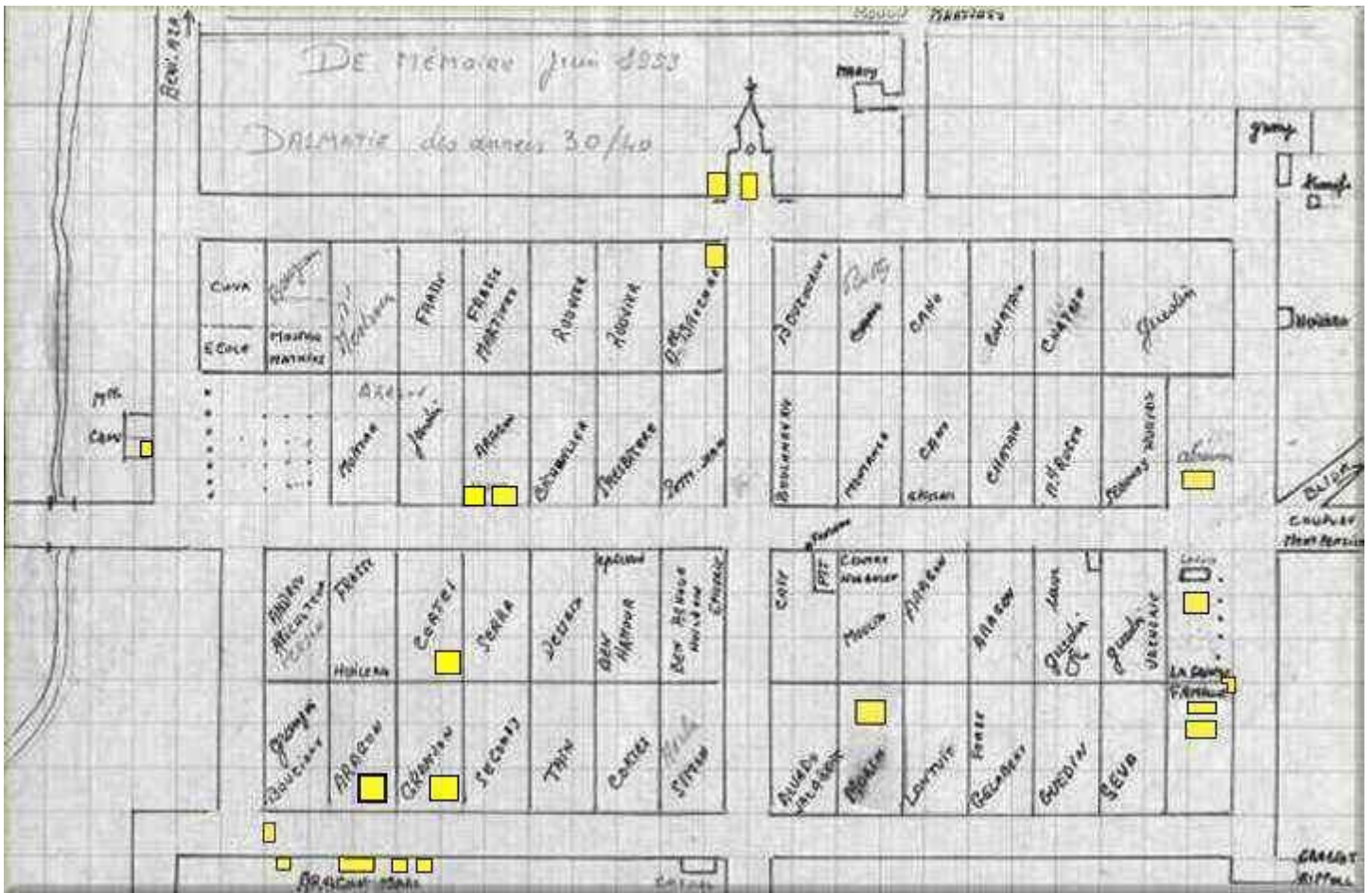
Plan d'une partie de la zone irrigable du village.