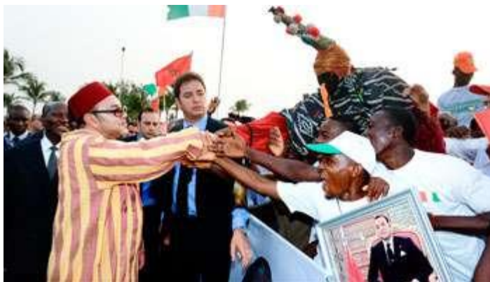
Le souverain chérifien saluant la foule à son arrivée à Abidjan, le 23 février 2014.

Extrêmement sévère à l'égard des anciennes puissances coloniales, la dernière allocution de Mohammed VI devant l'Assemblée générale des Nations unies a beaucoup surpris.