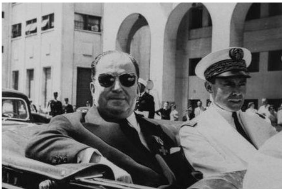
Robert LACOSTE (1898/1989)