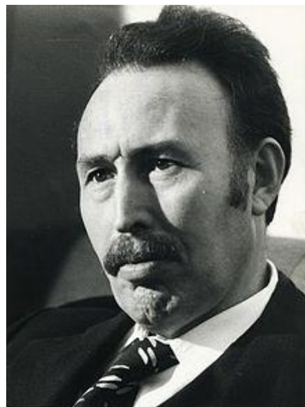
Houari BOUMEDIENE (1932/1978)

http://fr.wikipedia.org/wiki/Ahmed_Ben_Bella