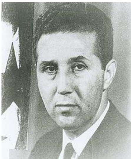
Ahmed BEN BELLA (1916/2012)

La manière même dont la constitution a été préparée est fort éloignée des procédés classiques en la matière. En effet l'Assemblée constituante, dont le nom indique bien la nature essentielle, n'a joué qu'un rôle secondaire dans l'élaboration du texte constitutionnel : elle l'a discuté et voté à peu près tel quel, mais ne l'a pas préparé. Le président BEN BELLA a chargé une commission non parlementaire de diriger un projet et avant d'être présenté à l'Assemblée, ce projet a été soumis à l'examen des cadres du FLN. Ainsi l'Assemblée s'est-elle trouvée devancée par un organisme irresponsable et non prévu dans le référendum du 20 septembre 1962, par lequel le peuple algérien avait décidé que l'assemblée élue serait constituante. De plus le texte voté devait être et a été présenté à l'approbation du peuple lors du référendum du 8 septembre 1963. C'est dire que l'Assemblée a joué un rôle secondaire en l'occurrence.