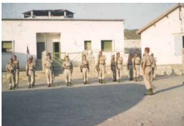
Le makhzen de la SAS de Bouzeguene

Comparés aux Mokhaznis et aux gardes GMS, les Harkis étaient considérés par l'armée comme des supplétifs de second rang. En 1957, ils n'avaient droit qu'à un fusil de chasse et à 25 cartouches. Puis peu à peu, et d'abord dans la limite de 50 % de leurs effectifs, ils reçurent des fusils de guerre de 8 mm, arme il est vrai désuète. On en vint en 1959 à les doter de fusils à répétition de 7,5 mm et même d'armes collectives, mais ils se plaignaient d'avoir à les utiliser sans avoir été instruits de leur maniement. On leur reconnut même des grades militaires : il y eut des caporaux harkis, quelques sergents (percevant 11 F par jour) et un sergent-chef pour 100 hommes avec une solde journalière de 13,20 F. En juin 1961, on décida qu'il y aurait désormais 2 sergents-chefs, 6 sergents (au lieu de 4) et 12 caporaux (au lieu de 8) pour 100 Harkis.