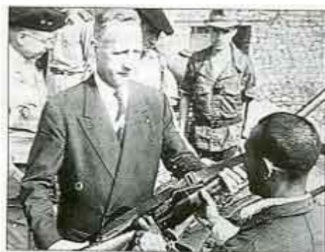
En juin 1960, Pierre Messmer remet son arme à un volontaire musulman. Deux ans plus tard, en 1962, devenu ministre des Armées, il interdira le sauvetage des harkis vers la France et imposera même le retour en Algérie des harkis qui avaient pu s'échapper clandestinement, livrant ainsi à une mort certaine des milliers d'hommes et de femmes.

Les effectifs des Harkas qui devaient être de 50 à 60 hommes pouvaient varier considérablement selon les besoins : on voit, par exemple, que telle harka rattachée au 1 er REC comportait 17 harkis le 12 octobre 1959, 34 le 31 décembre et 19 le 30 septembre 1960. Toutefois, certains harkis devenaient de facto des permanents sans contrat qui demeurèrent dans leur unité pendant six mois, un an, voire même deux ans. Les conditions de recrutement étaient laissées à l'initiative de l'officier responsable. Il semble n'y avoir eu, au début surtout, que peu d'enquêtes préalables. On privilégiait pourtant les anciens combattants, ce qui peut expliquer que, selon le bachaga BOUALAM, « l'âge moyen de ces jeunes combattants était de 35 ans ».