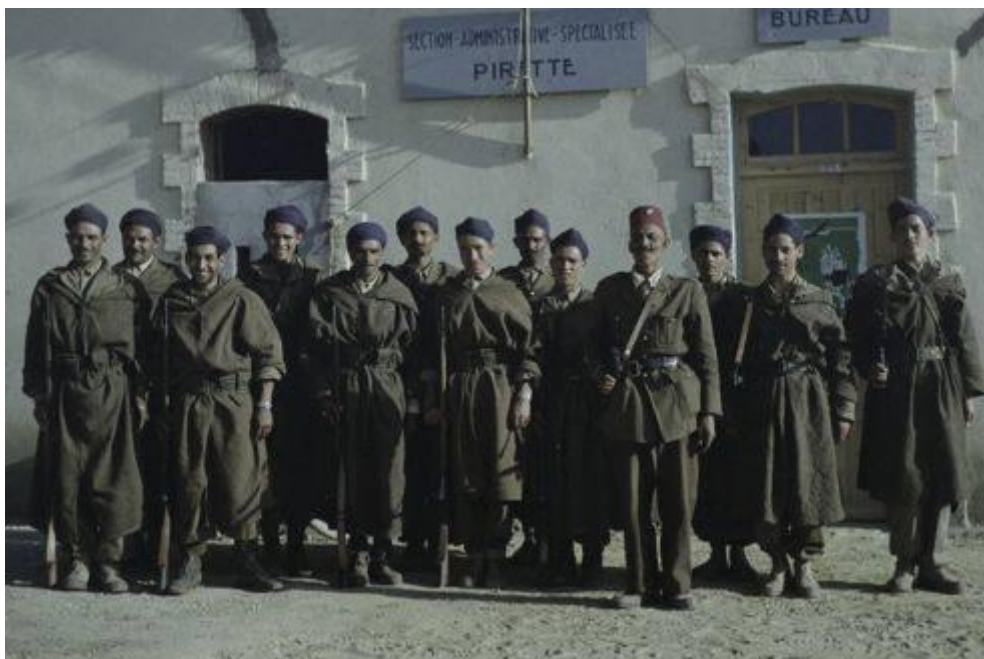
Mokhzanis de la Section administrative spécialisée (SAS) de Pirette en Kabylie, en 1956.

-Episode 1 = Les Mokhzanis, les SAS et les GMS (INFO 481)