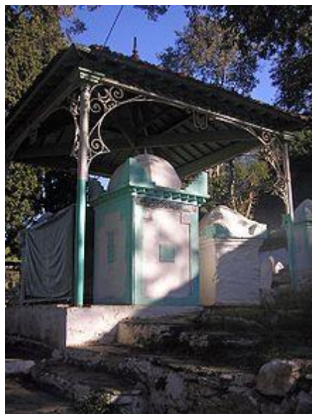
[Tombeau de Sidi-Ahmed El-Kebir, fondateur de la ville]

La ville de Blida est fondée au 16 e siècle par le marabout Sidi Ahmed el Kebir avec la participation de musulmans andalous qui s'installent à Ourida (premier nom de Blida) et transforment alors les terres incultivables en vergers grâce aux plantations d'orangers et l'art de l'irrigation. Ils apportent également à la région, l'art de la broderie sur cuir.