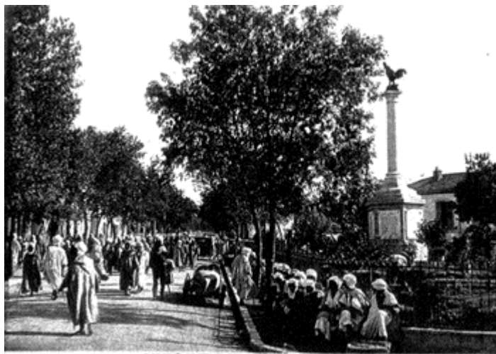
1 – CONDE-SMENDOU – Rue Principale et Monument aux Morts.