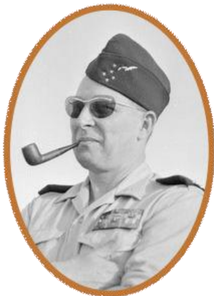
Général d'Armée Aérienne Maurice CHALLE (1905/1979)

Outre l'organisation, le cadre d'emploi de la gendarmerie mobile est aussi révisé. En 1959, le général CHALLE a parfaitement défini ses trois domaines d'action :