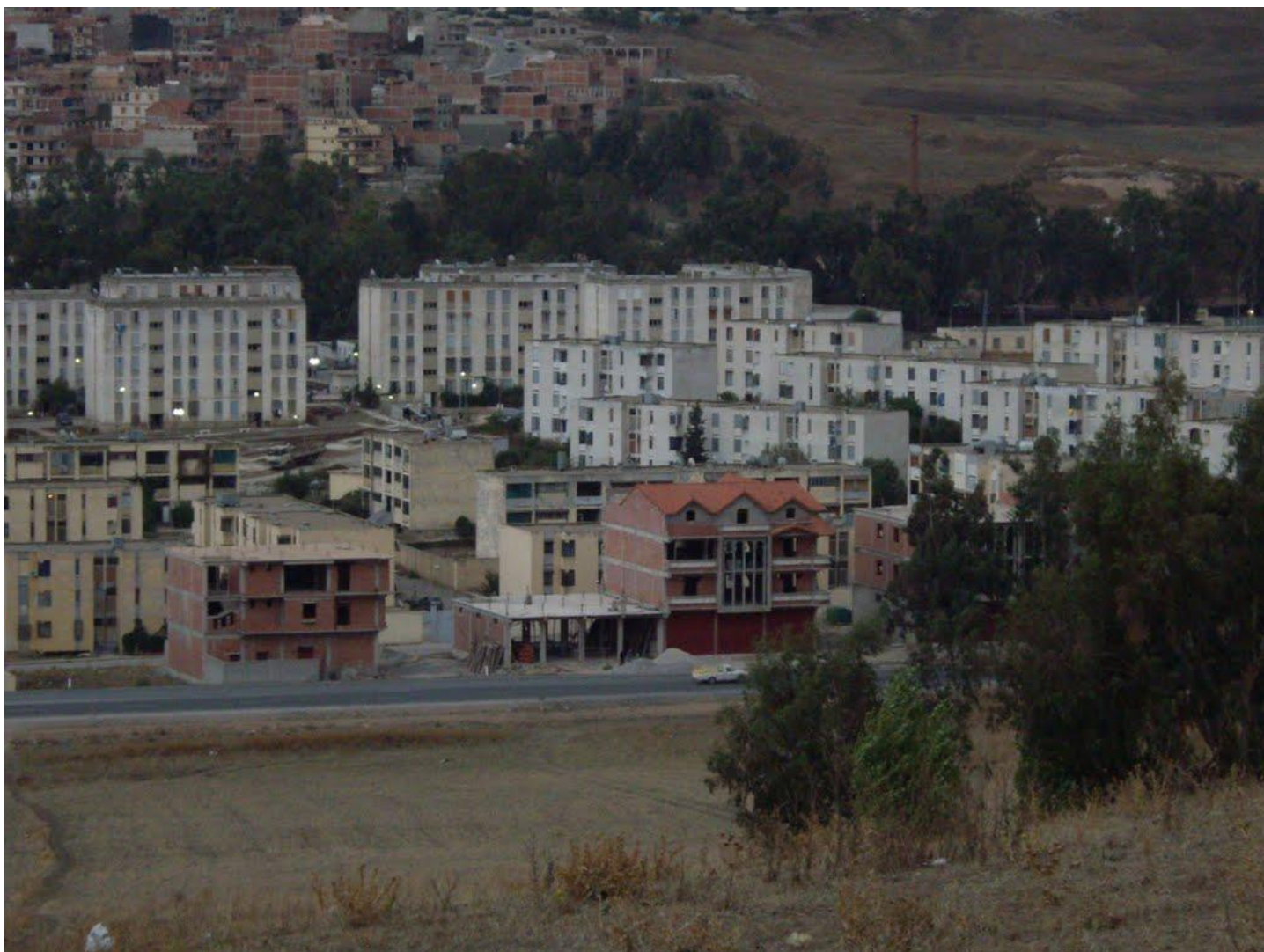
BIZOT de nos jours

AÏN ABID - AÏN REGADA - AÏN SMARA - BIZOT - CHATEAUDUN du RHUMEL - CONDE SMENDOU - CONSTANTINE - DJEBEL AOUGUEB - DJEMILA - EL ARIA - EL GUERRAH - EL MALAH - GUETTAR EL AÏCH - HAMMA PLAISANCE - LE KROUB - MONTCALM - OUED ATHMENIA - OUED SEGUIN - OUED ZENATI - OULED RAHMOUN - RAS EL AÏOUN - RAS EL AKBA - RENIER - ROUFFACH - SAINT DONAT-