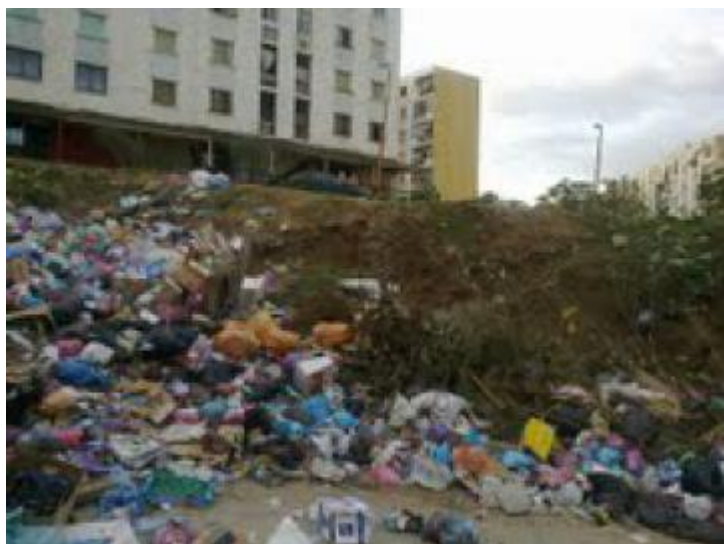
[De nos jours, en 2012 :

Dès la proclamation officielle des résultats du référendum, le 13 avril, fut installé à Rocher Noir l'Exécutif provisoire franco-algérien présidé par Abderrahmane Farès ; et à Paris, le Premier ministre Michel Debré démissionna le 14 et fut remplacé par Georges Pompidou, alors considéré comme un simple exécutant de la politique du président Charles de Gaulle. Le 15 mai, la date du référendum algérien fut avancée au 1er juillet, et ses résultats, ratifiant massivement les accords d'Evian (par 91,23% des inscrits et 99,72% des suffrages exprimés), furent proclamés le 3 juillet.