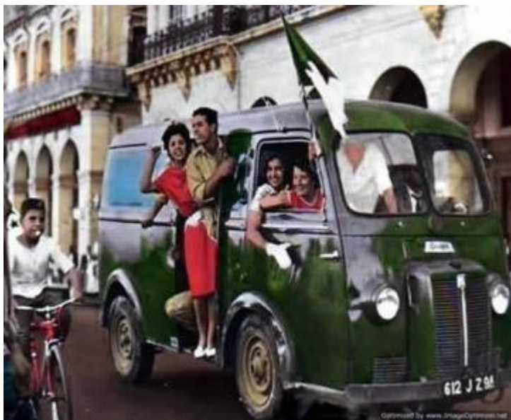
[Derrière la liesse, la laisse]