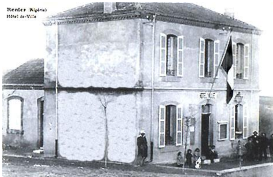
[RENIER : Un hôtel de ville bien modeste]

Une population, de 4 118 habitants dont 242 français d'origine savoyarde, vivait dans le paisible village de RENIER. Quelques années plus tard en 1908 le nombre de ses habitants était de 4 248 habitants dont 242 européens.