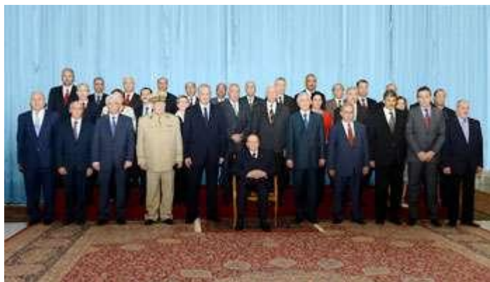
[Photo officielle du gouvernement Sellal II, en septembre 2013.]

Alors que l'élection présidentielle algérienne a enfin été fixée au 17 avril, la classe politique, paralysée, attend toujours de connaître les intentions du président sortant, Abdelaziz Bouteflika.