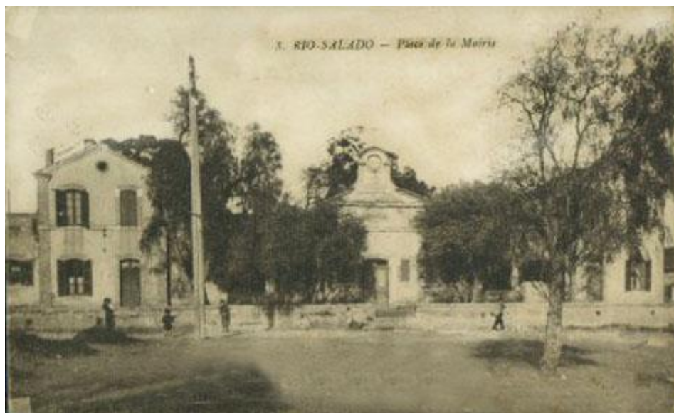
[Rio Salado : La Mairie]

Au cours de l'année 1880 sont construites la mairie, l'église avec son presbytère et l'école.