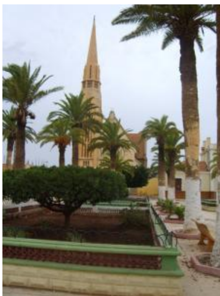
[Rio Salado : Vue de l'Eglise]

Sacré bourg ! L'un des lieux les plus coquet de l'Oranie, sorti d'une terre ingrate, inculte depuis toujours, devenu une magnifique entité dotée de toutes les nécessités d'une grande cité et ce sur tous les plans : culturel, social, commercial, industriel, artisanal et sportif.