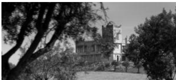
[Rio Salado : Une ferme de l'époque]