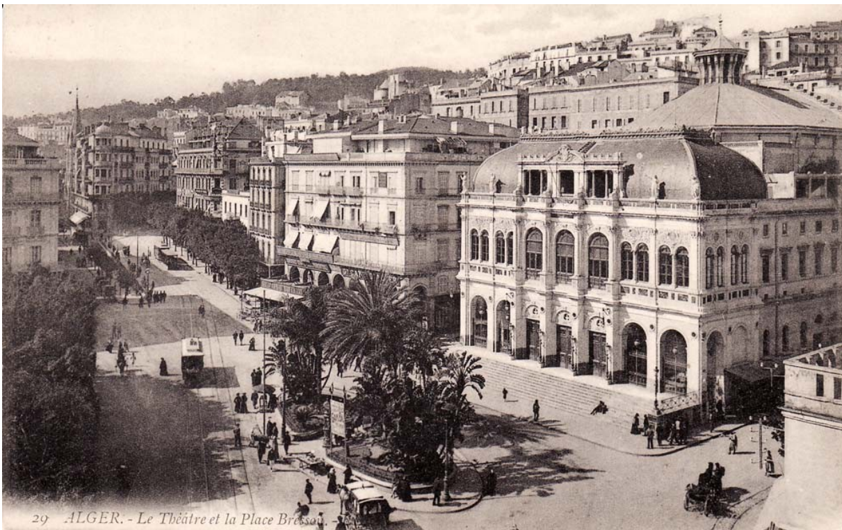
29 ALGER. - Le Théâtre et la Place Bresson.