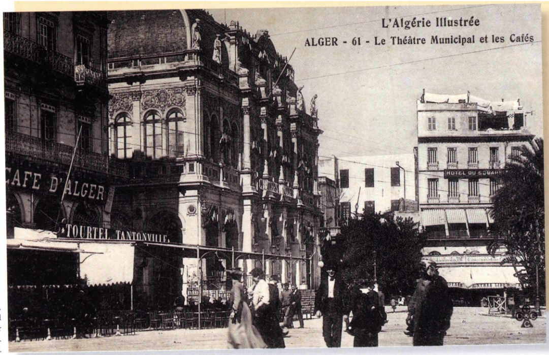
L'Algérie illustrée, Le Théâtre Municipal et les Cafés, Alger [début XX e siècle].