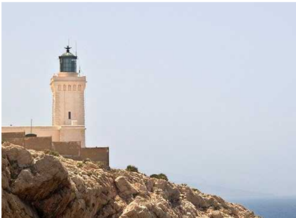
Le phare de TENES

par leur beauté, envergure et surtout histoire. Un patrimoine effarant !