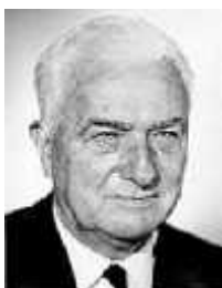
Louis JOXE (1901/1991)

Sur le fond, portée par une culpabilité qui préface l'effondrement narcissique français, l'élite administrative de l'époque a mené une véritable guerre intérieure aux Pieds-Noirs et aux Harkis. Ce fut notamment le cas de Louis JOXE, secrétaire d'Etat aux affaires algériennes, qui donna, en juillet 1962, des instructions pour la chasse aux harkis et pour leur reconduite en Algérie en cas d'arrivée intempestive en métropole.