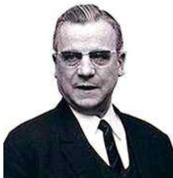
Le Père (1913/1995)

Gaston PLISSONNIER : Chargé de la « montée des cadres » c'est à lui que revient le choix de promouvoir — ou de rétrograder — les cadres militants au sein de la hiérarchie communiste. C'est une personnalité omniprésente dans le fonctionnement du Parti : il assure l'intérim du Secrétariat Général quand Georges Marchais est frappé d'une crise cardiaque en 1976. Les meilleurs connaisseurs du PCF le qualifiaient de « mémoire vivante » du communisme international. La presse le surnommait le " secrétaire perpétuel " du Parti.