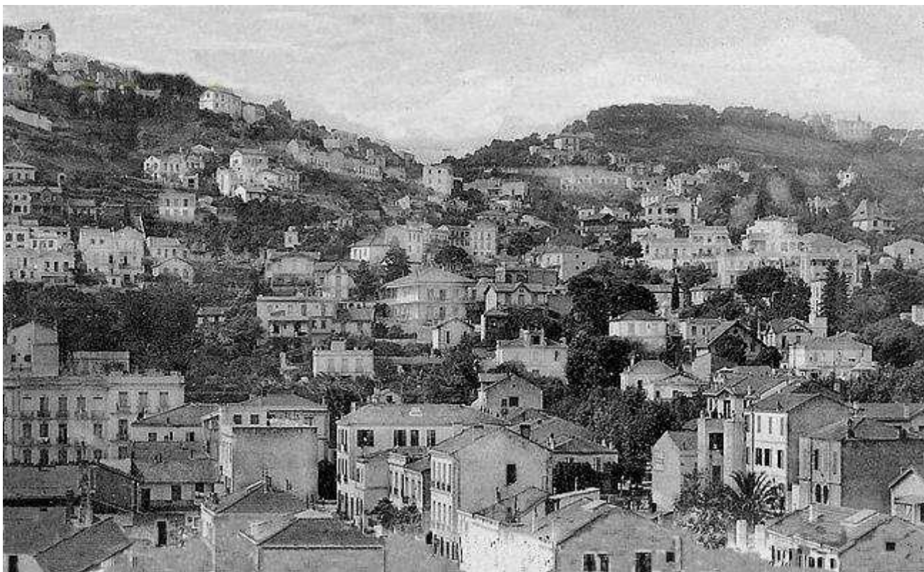
Vue générale de BELCOURT