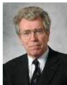
Pierre JOXE (1934/.....)