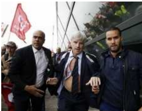
Le fils (au milieu)

notre temps, en raison de la trahison de classe dont il se serait rendu coupable, lui qui était issu d'une famille exemplaire de la nomenklatura stalinienne française ?