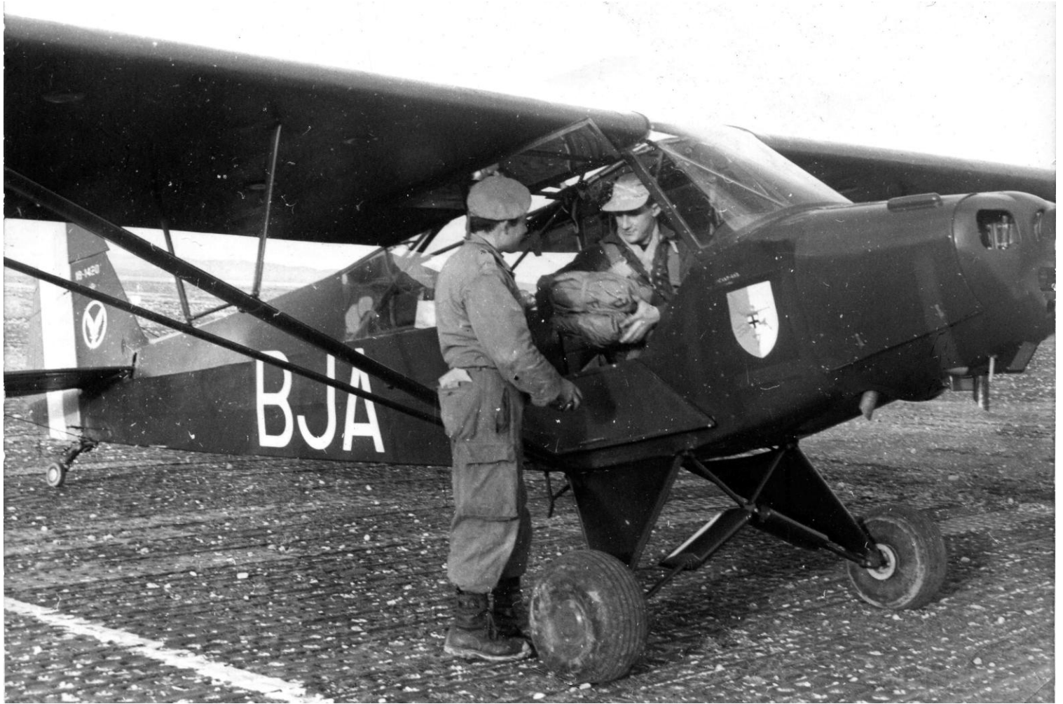
Piper L-18 n° 18-1420/BJA du PA de la 7 e DMR (photo Jacques Jaloux).