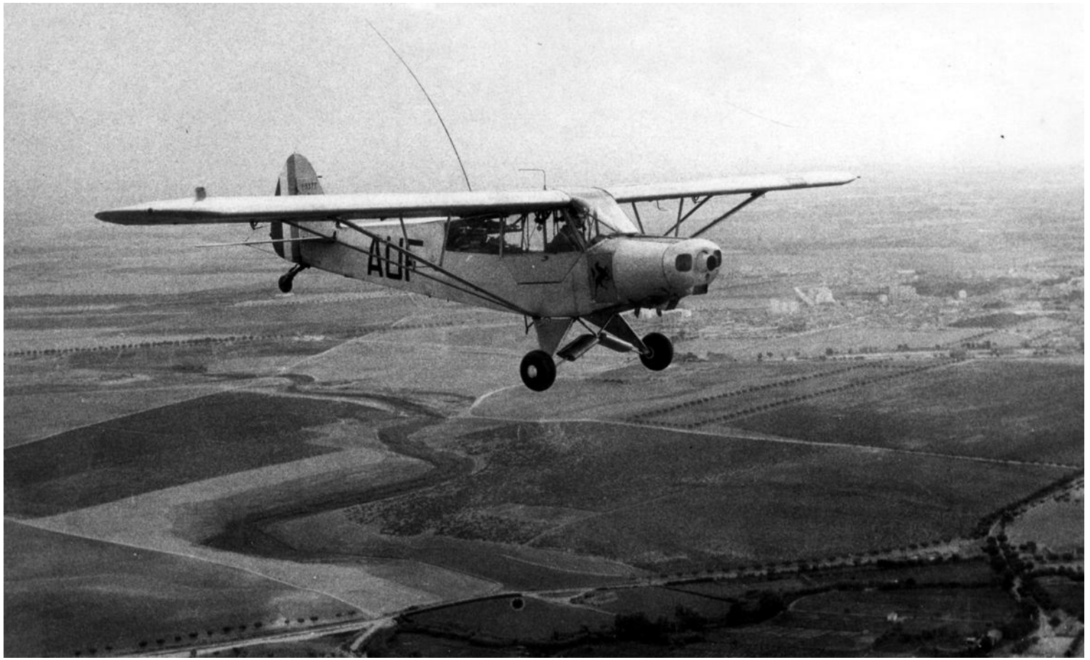
Piper L-18C n°51-15377/AUF du PMAH de la 5 e DB, en fin d'année 1962.