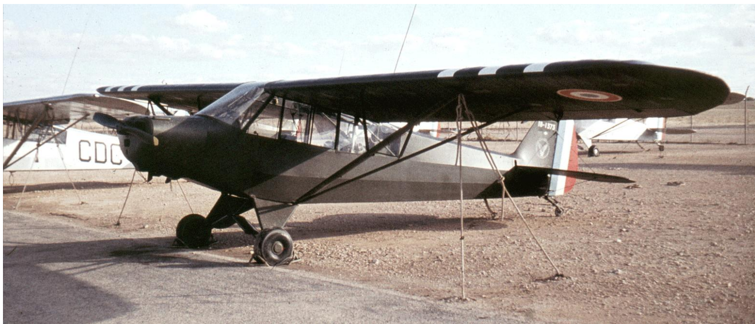
Sidi Bel Abbès en 1960 ou 1961. L-18C n°18-1373/51-15373.