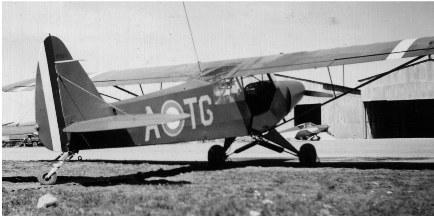
Bou-Chékif, en 1958, L-18C n°18-1371/ATG du PMAH de la 4 e DIM.