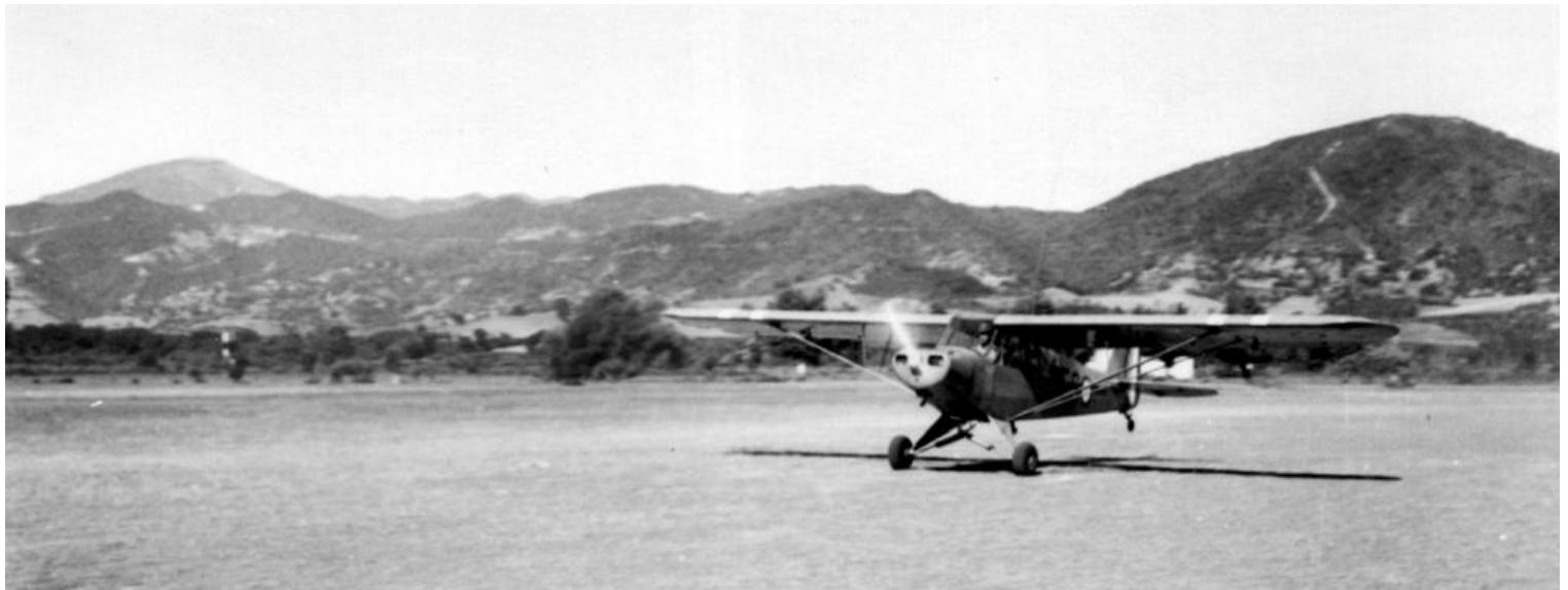
PA de la 14 e DI, L-18C n° 18-1341/ES, à El-Milia en 1956.