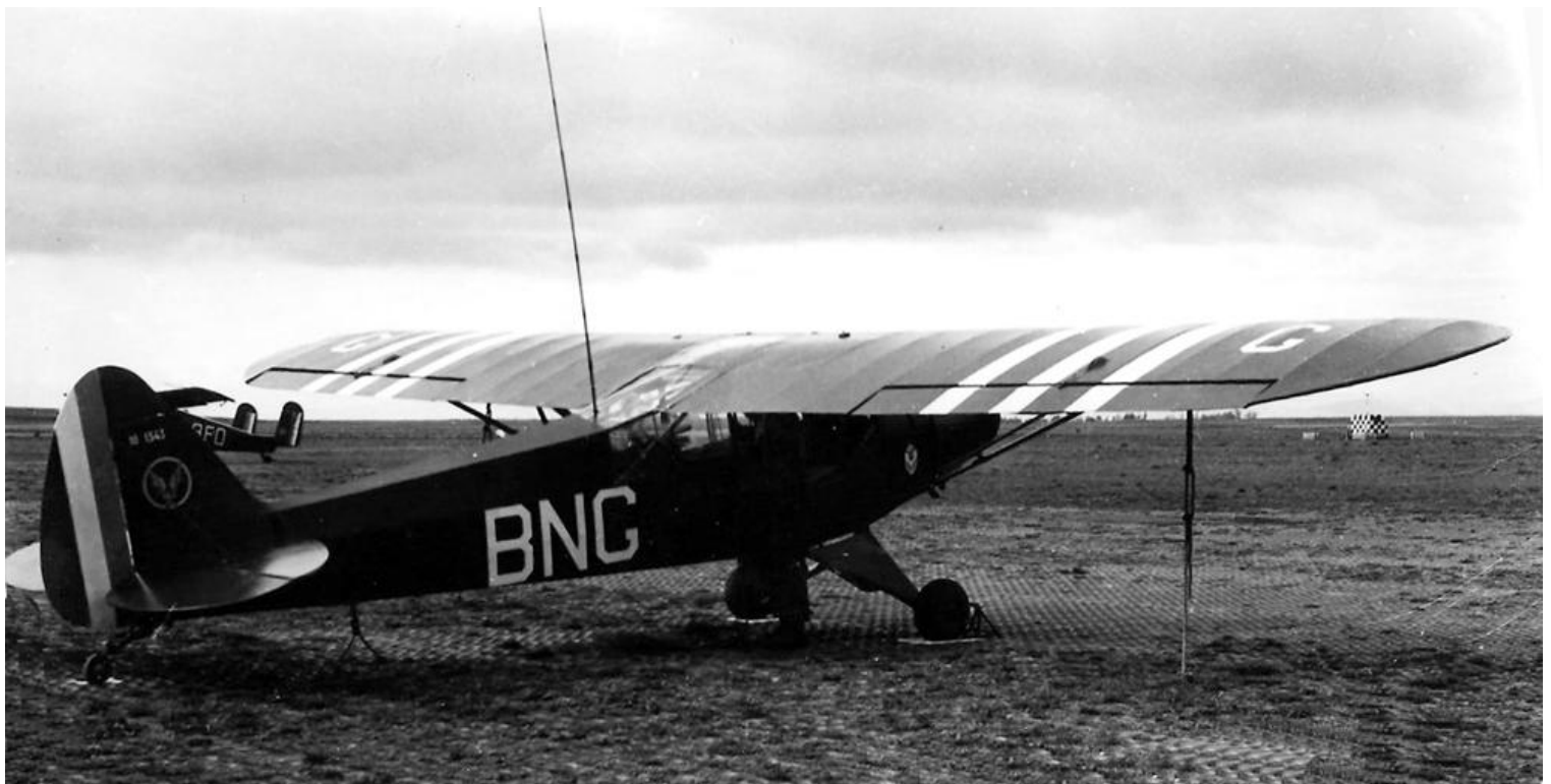
Piper L-18C n° 18-1343/BNG du PA de la 19 e DI.