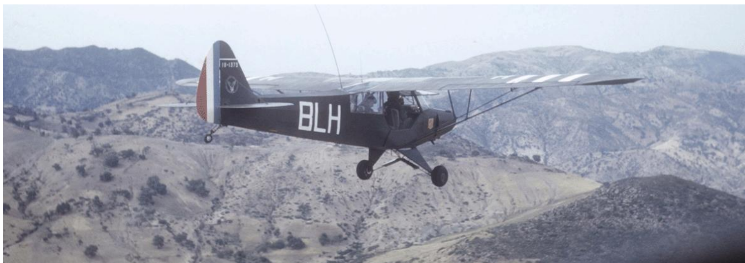
PA de la 12 e DI à Tlemcen, en 1961, L-18C n° 18-1373/BLH.