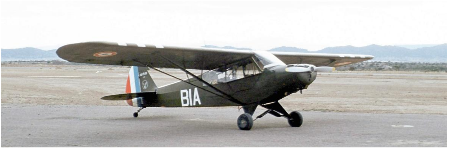
1 er PMAH de la 2 e DIM, L-18C n° 18-1340/BIA, à Guelma, en 1961 (photo Gérard Godot).