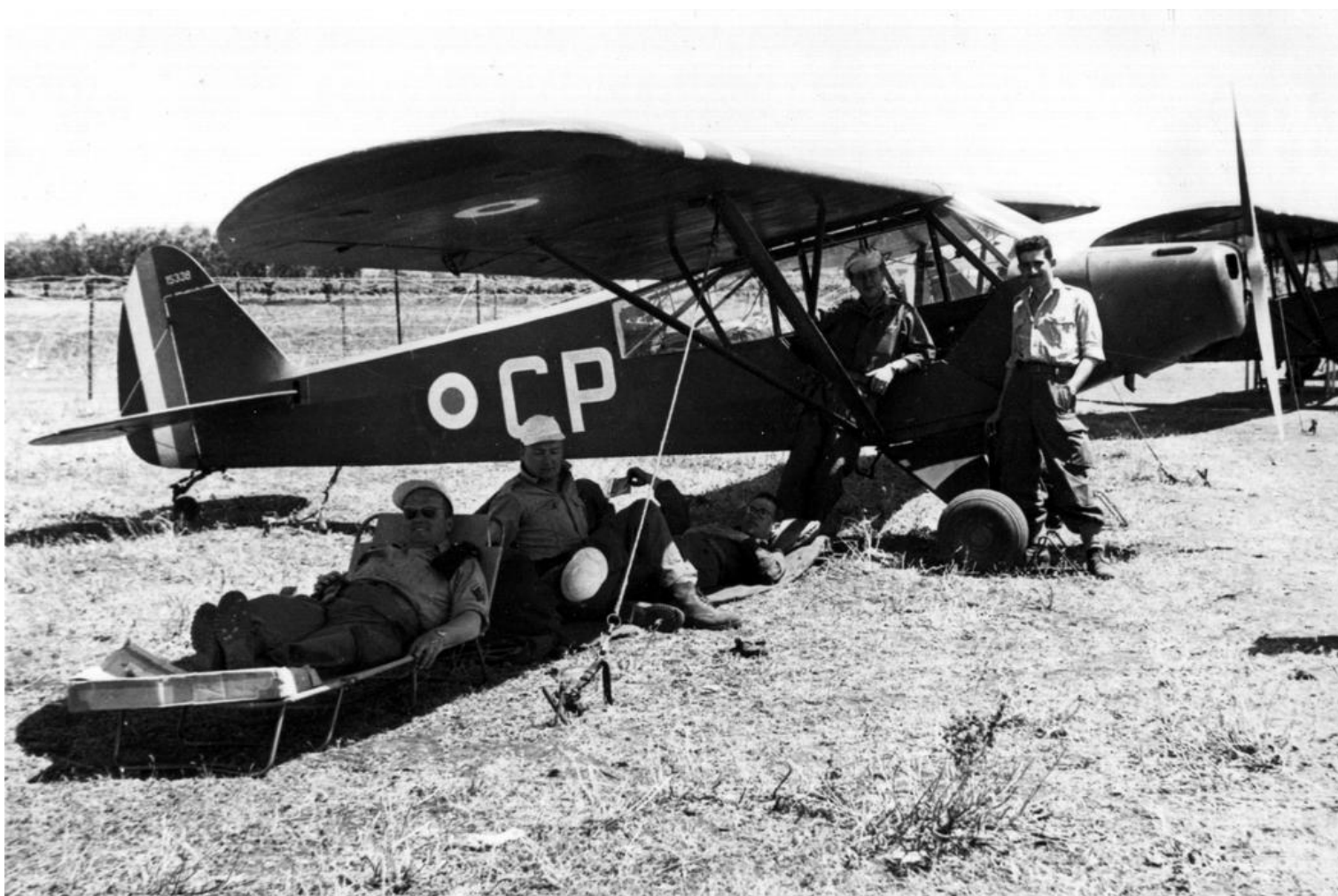
Repos à l'ombre, au PA de la 29 e DI, Aïn-Témouchent, en 1956, L-18C n° 15338/CP.