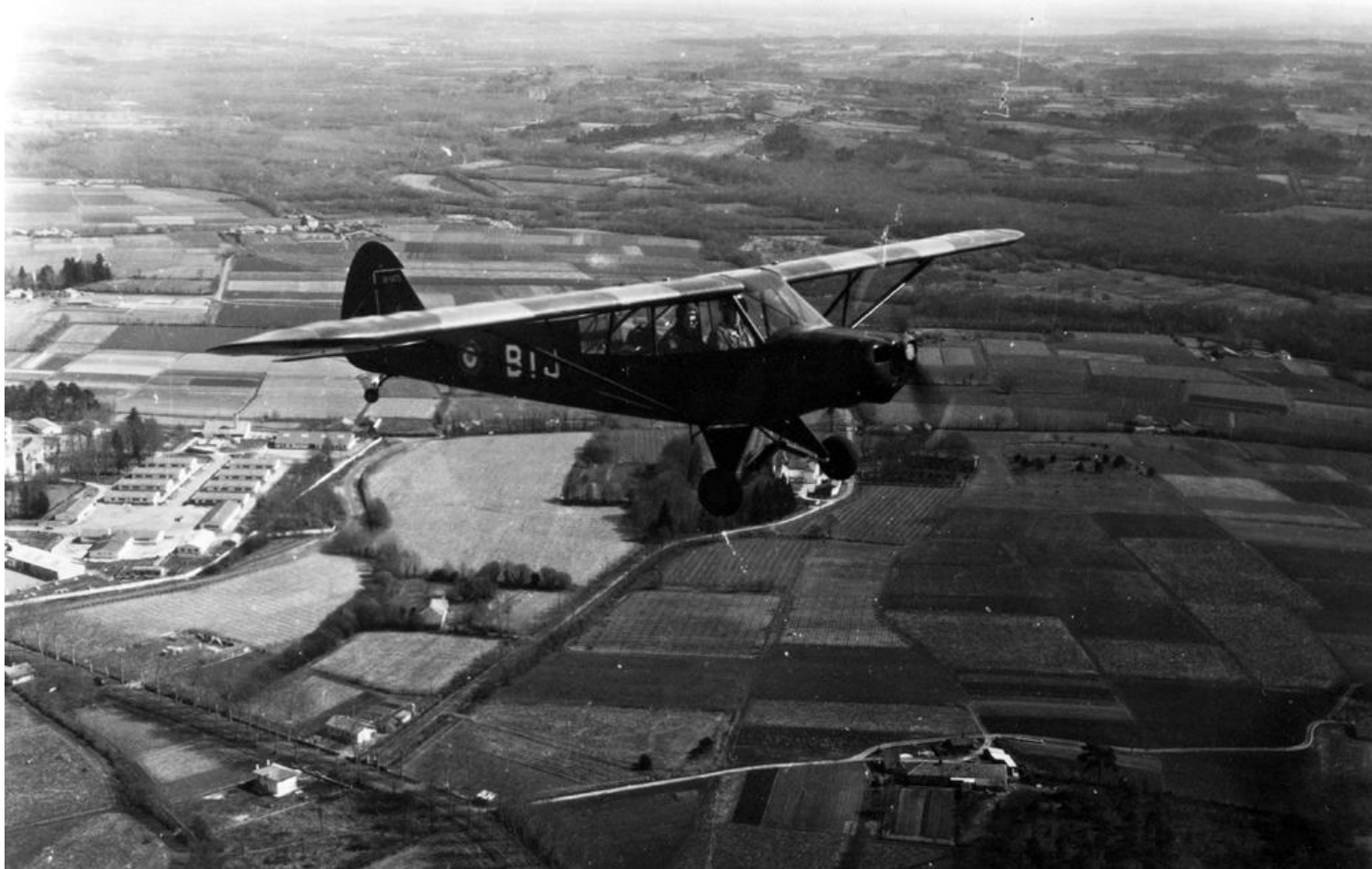
ES.ALAT, Dax, Piper L-18C n°18-1475/BIJ.