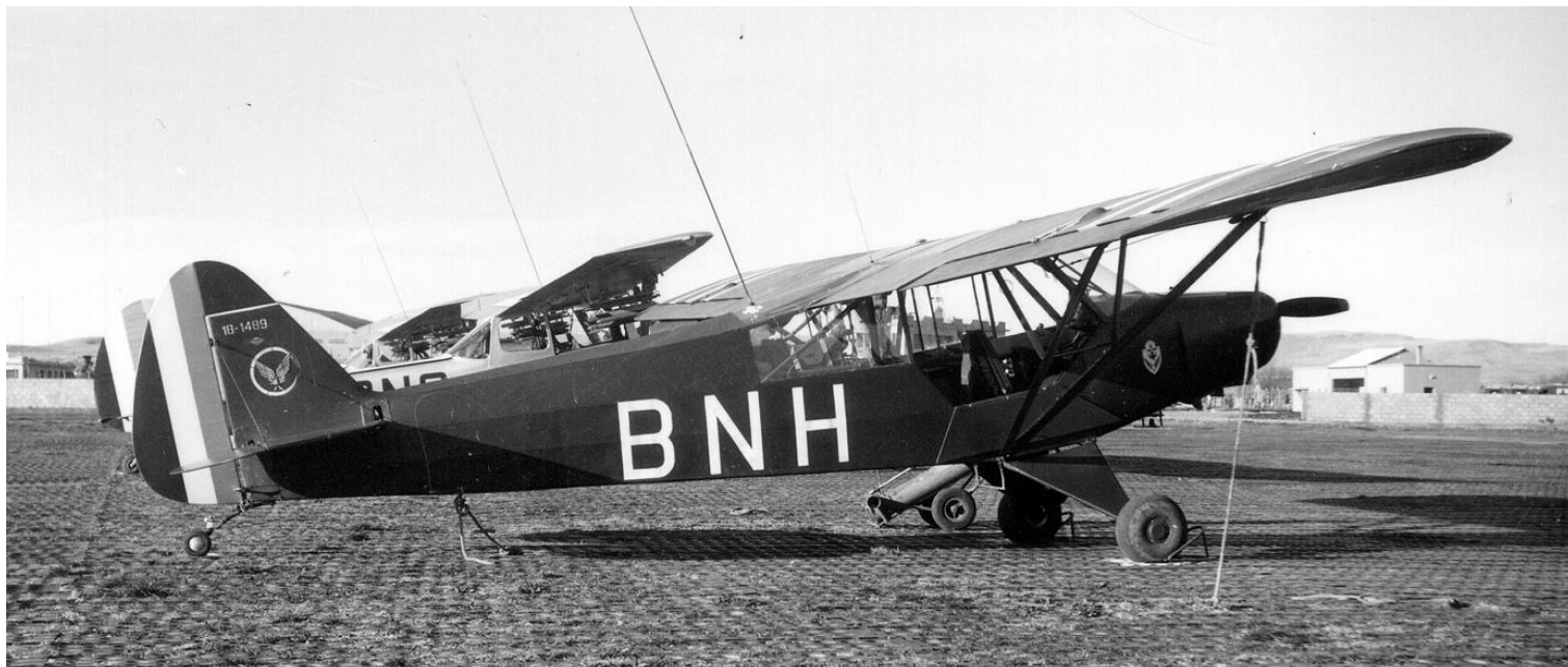
Piper L-18C n°18-1489/BNH, du PMAH de la 19 e DI, le 1 er janvier 1960 à Sétif.