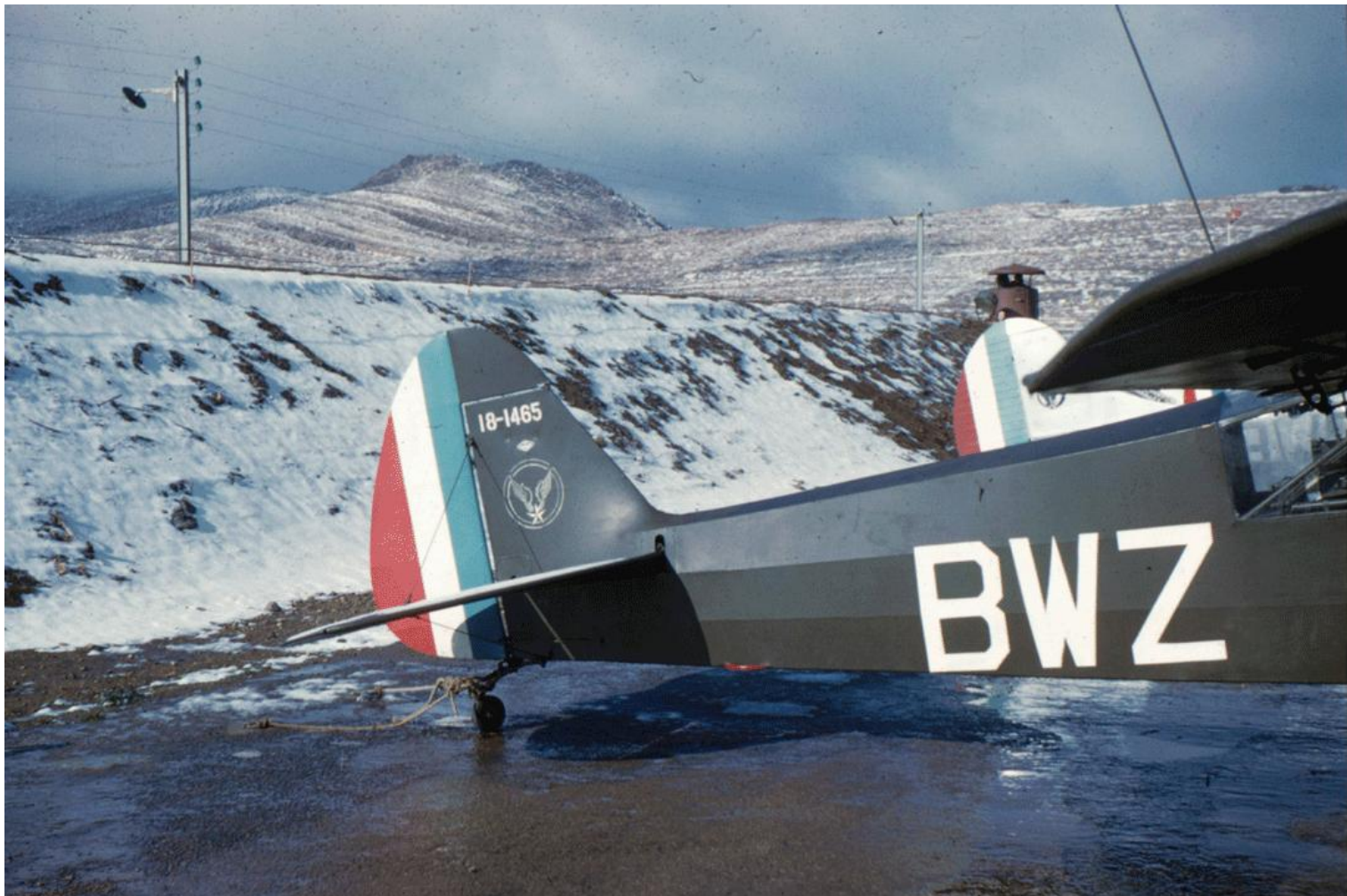
2 e PMAH RG à Khenchela, en février 1962, le L-18C n°18-1465/BWZ (photo Bertrand Lassalle).