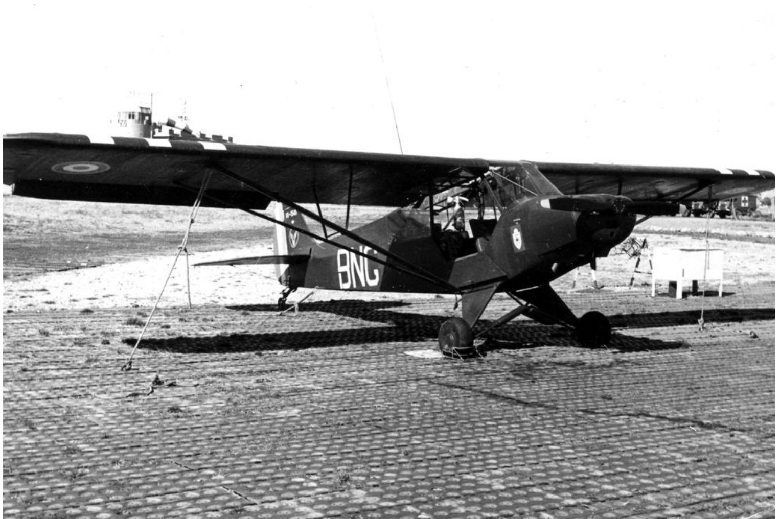
Sétif 1961, L-18C n° 18-1543/BNG, du PMAH de la 19° DI (photo Louis Jaccon).