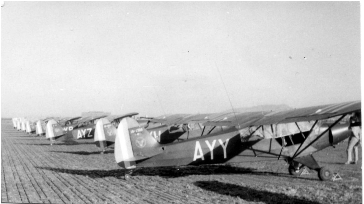
Piper L-18C n°1396/AYY et 1518/AYW de l'EA.ALAT à Sidi-bel-Abbès en 1962. La tranche de codes AYx correspond aux appareils destinés au cours CPAP.