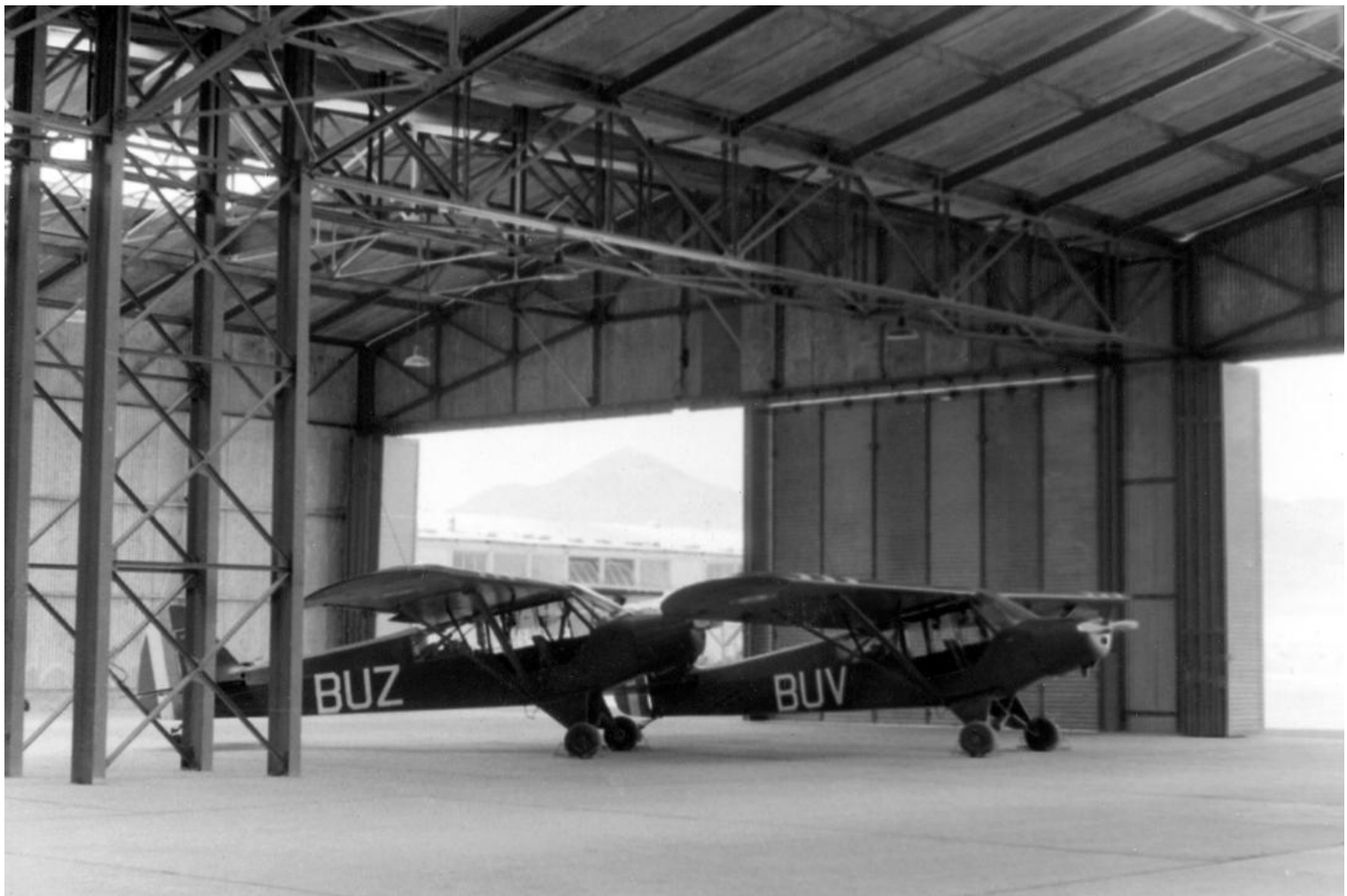
1 er PMAH de la 21 e DI, en 1960. Au premier plan, le Piper L-18C n°18-1405/BUZ.