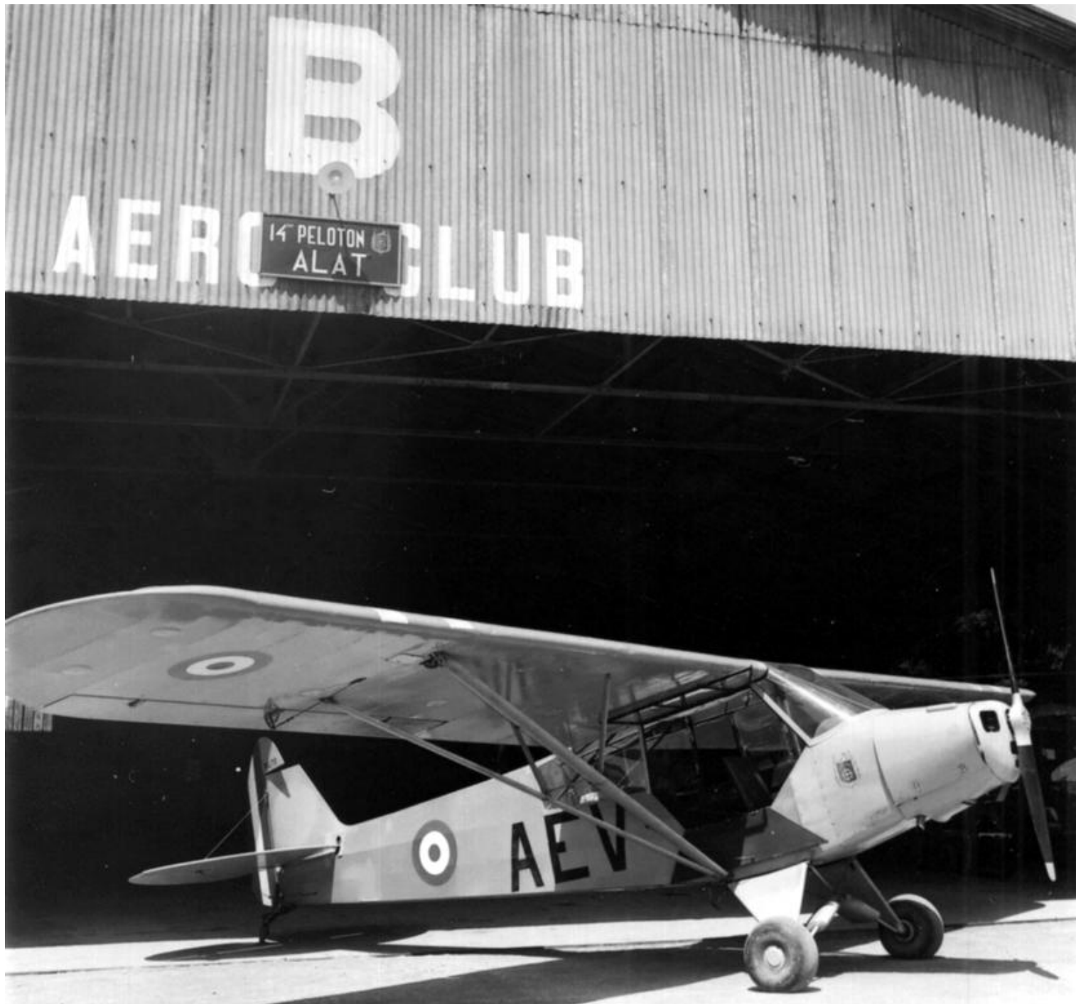
PMAH de la 14 e DI à El-Milia, début 1957, L-18C avec l'immatriculation du GAOA N°6 AEV/18-1479.