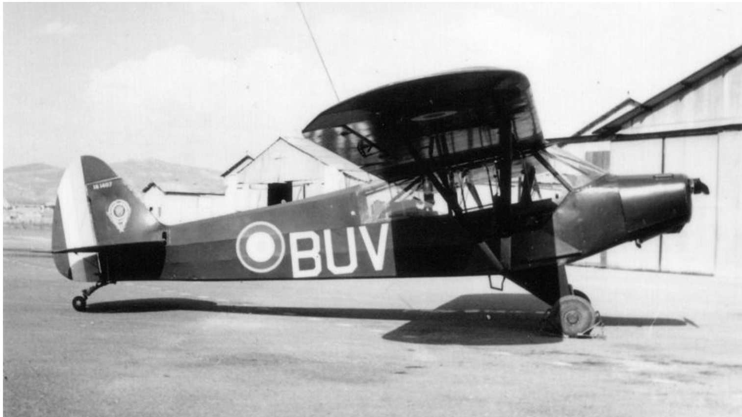
Batna, 1958. Piper L-18C n° 18-1407/BUV, du PA de la 21 e DI.