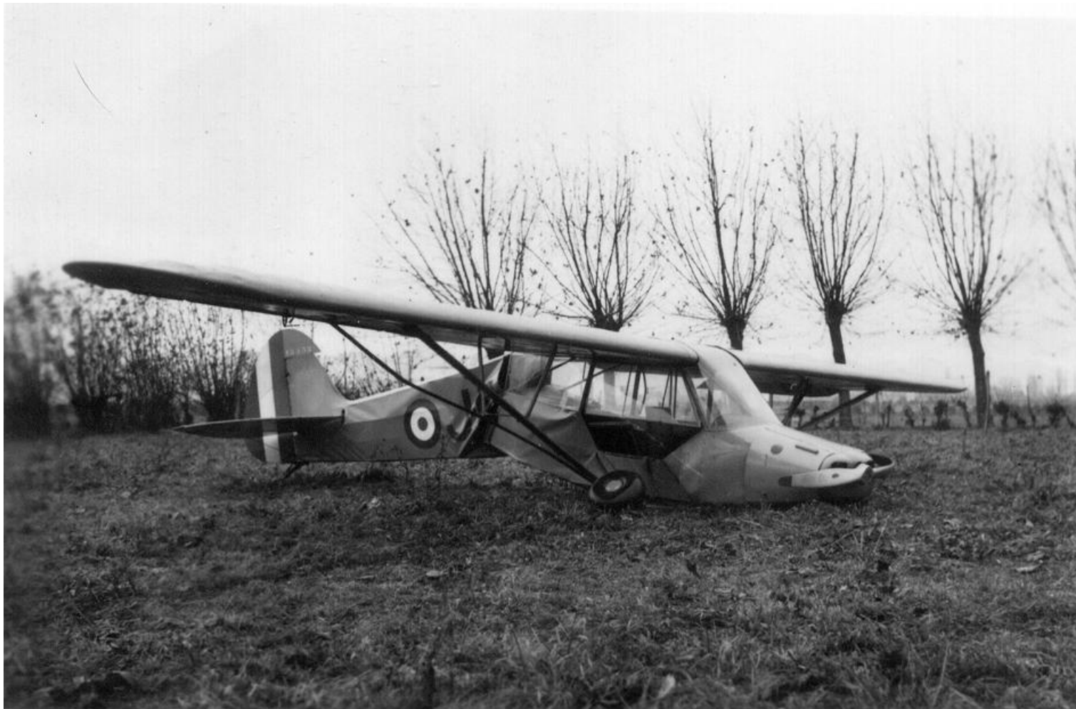
Piper L-18C c/n 18-1332, serial 51-15332/JN, du 2 e GAOA de Baden, en Allemagne