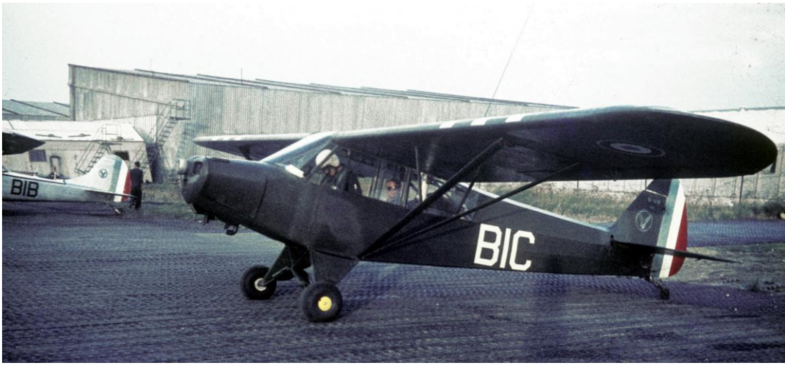
L-18 n° 18-1439/BIC, du 1 er PA de la 2 e DIM, à Guelma en 1959 (photo Marcel Fluet via Alain Crosnier).