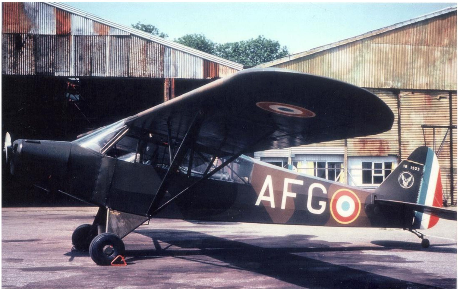
Piper L-18C n°18-1533 en 1961, au GALAT N°7.