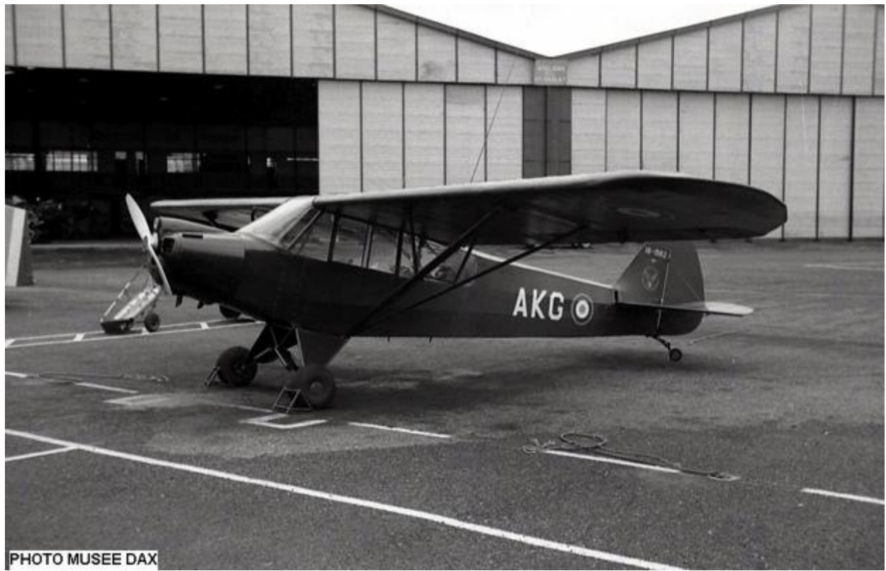
Piper L-18C n°18-1542/AKG de l'ES.ALAT, avec capot moteur modifié à cause du générateur.