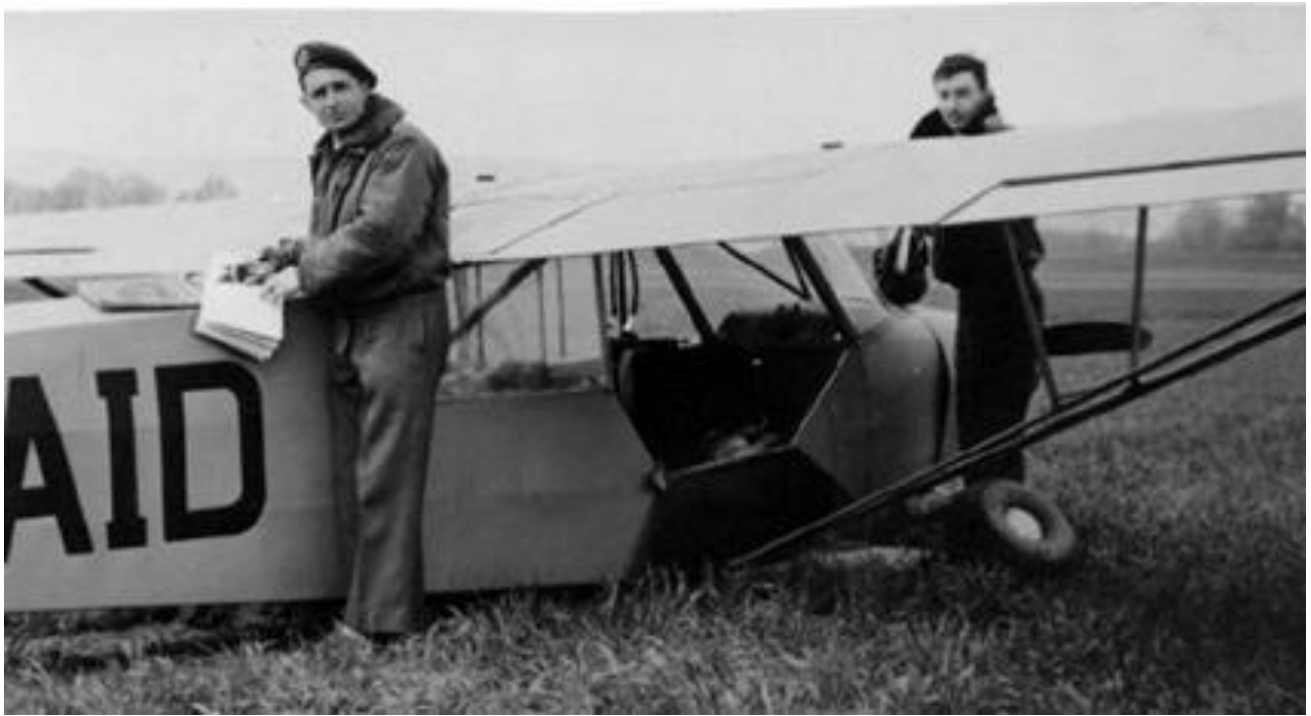
Piper L-18C n°18-1461/AID le 23 avril 1958 du côté de Finthen. Il s'agit d'une version à train escamotable, spécialement mise au point par Jacques Scellos et Yves Le Bec.