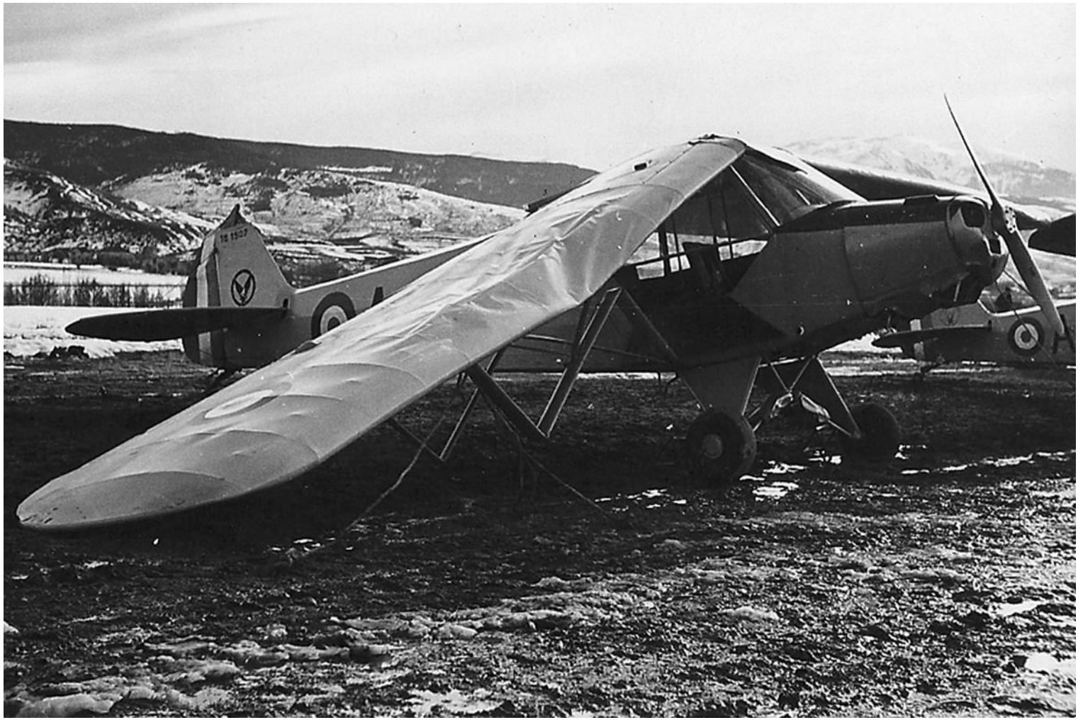
L-18C n° 18-1507/AIF, de l'ES.ALAT, accidenté à Saillagousse, en mars 1961.