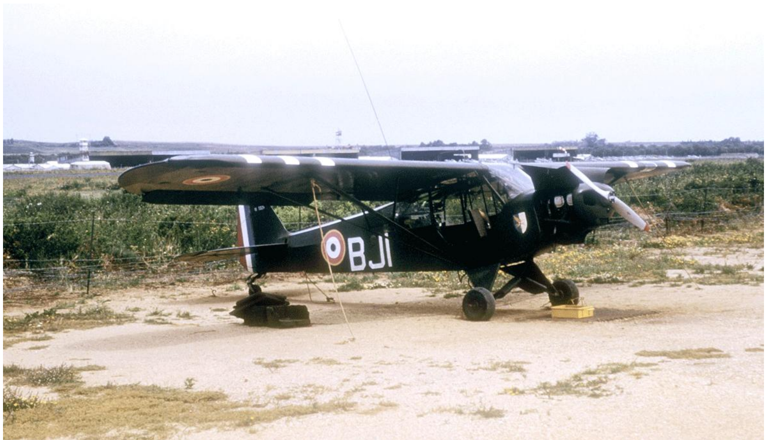
PA de la 7 e DMR, à La Réghaïa en 1958, L-18C n° 18/1420/BJI.