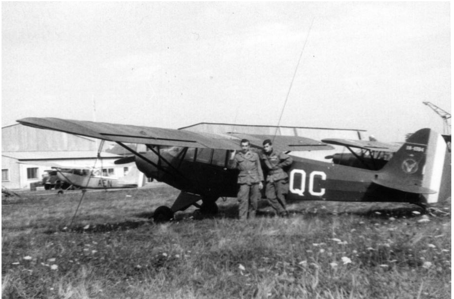
5 e GALAT, Tarbes, entre le 4 et le 12 septembre 1963, Piper L-18C n° 18-1394/AQC.