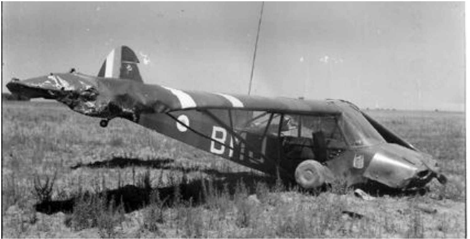
Piper L-18C n° 18-1360/BMJ du PA de la 14 e DI, accidenté le 7 septembre 1957.