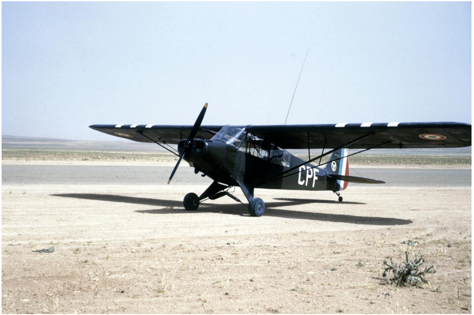
De passage à Géryville en juin 1961, le L-18C n° 18-1365/CPF du 2 e PA ZOS.