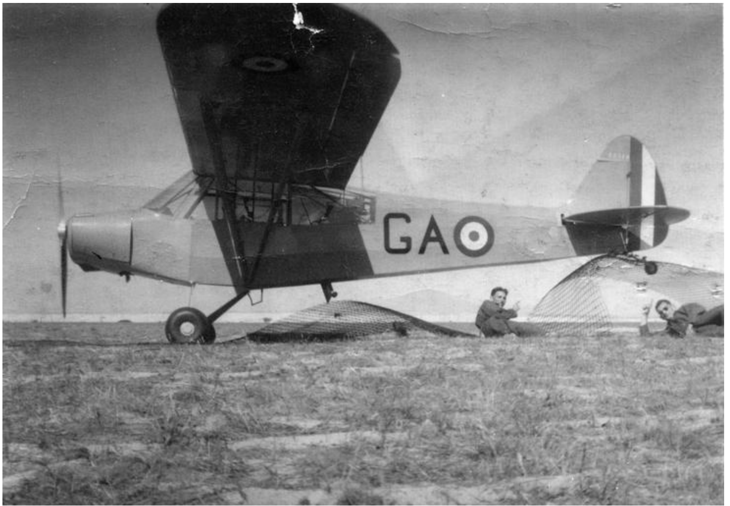
Le 16 juin 1955, le L-18C n° 18-1510/GA, du GAOA N°8 de Dinan, accroché à l'atterrissage, le grillage disposé sur la piste de Biscarosse. Couchés derrière l'appareil, le lieutenant Delboy et le mécanicien Marc Henrard.