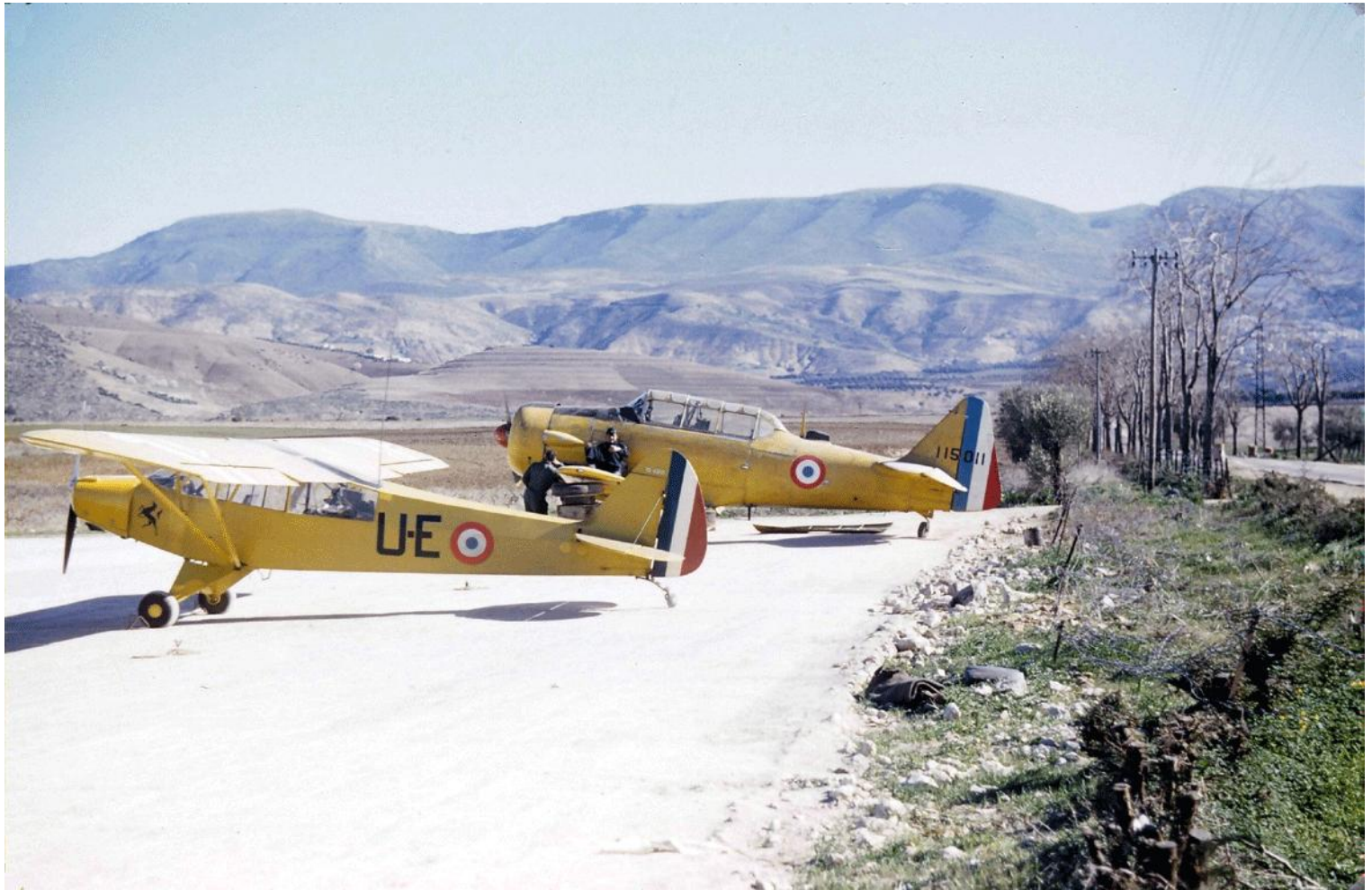
Nédroma en 1956, le L-18C n°18-1438/U-E du PA de la 5 e DB, devant un T-6 de l'EALA 2/71.