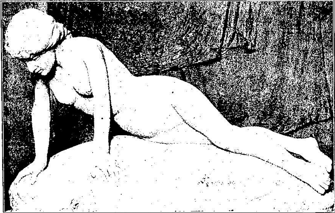
LA « SOURCE »

les statues du théâtre d'Oran, le monument Giraud. Il est officier de l'Instruction publique, chevalier du Cambodge et proposé depuis dix ans pour la Légion d'honneur. Médaille d'honneur des Vétérans 1870-1871.