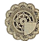
La décoration du drapeau du 1 er zouaves au nom du roi d'Italie

Favorisé par un temps splendide et une température très douce, le 14 juillet a été brillamment fêté à Alger. La revue des troupes de la garnison passée le matin par le général Bertrand, remplaçant le général Bailloud absent, ainsi que le défilé ont soulevé l'enthousiasme du public. Affluence aux tribunes qui présentaient un joli coup d'œil. Au milieu des habits noirs et des uniformes chamarrés les jolies toilettes de nos mondaines jettent la note gaie du plus charmant effet. Remarqué dans la tribune d'honneur :