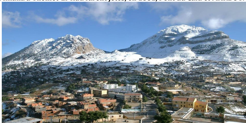
L'OUARSENIS et le village BOU-CAID

En effet le Dahra et l'Ouarsenis, moins longtemps rebelles à la présence française que la Kabylie, ont été, cependant, moins entamés par la colonisation européenne ; aussi bien l'absence de riches vallées comme celle du Sébaou, de riches bassins comme celui de Mila, n'a-t-elle pu que retarder l'arrivée de l'élément colonisateur. L'Ouarsenis compte moins de colons que le Dahra. Dès 1843, par motif stratégique, on avait colonisé Theniet-El-Had. Sur la route de Miliana à Theniet-El-Had furent jetés, en 1881, Pont du Caïd et MARBOT .