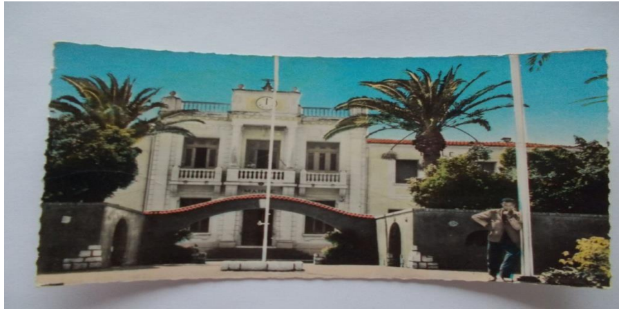
Mairie de LAFFERIERE

TOTAL = 21 553 habitants dont 1 053 français – Superficie : 143 281 hectares.