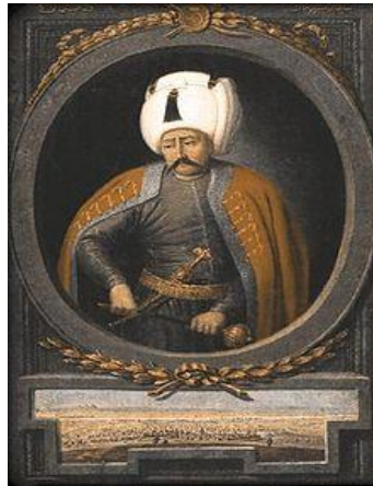
SELIM 1er (1470/1520)