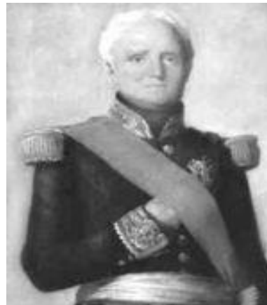
Thomas BUGEAUD (1784/1849)