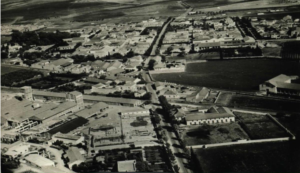
Vue aérienne de LAFFERIE

Après la seconde guerre mondiale, une usine de fabrication de canalisations en béton y est construite (la Socoman, filiale de Pont à Mousson) pour alimenter le grand chantier d'adduction d'eau potable d'Oran.