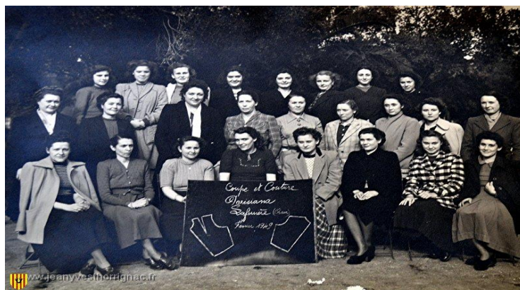
L'école de couture en 1949 à LAFERRIERE

-Dès que le portail LAFERRIERE est ouvert, mentionnez le nom de la personne recherchée sous réserve que la naissance, le mariage ou le décès soit survenu avant une certaine date précisée sur le site.