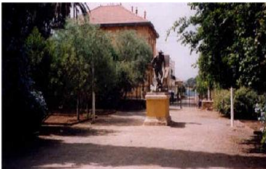
Le Laboureur du jardin public

Année 1902 = 957 habitants dont 524 européens, 85 indigènes et 348 étrangers ; Année 1936 = 4 195 habitants dont 828 européens ; Année 1954 = 5 493 habitants dont 758 européens ; Année 1960 = 5 523 habitants dont 894 européens ;