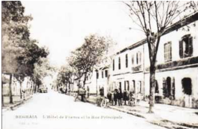
Auteur : M. DUVAL Jules (1859)

1854 Création du tissu urbain de Réghaïa par les autorités françaises Une ville créée par décret du 14 octobre 1854 annexée à la commune de Fondouk.