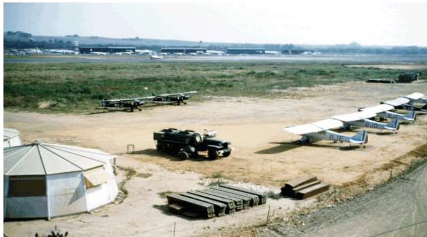
LA-REGHAÏA en 1959