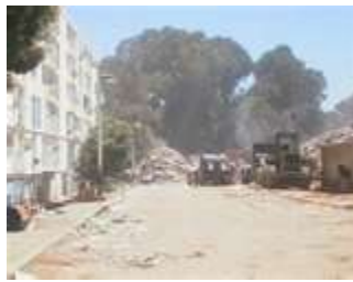
La cité MAFAL après le Séisme de 2004