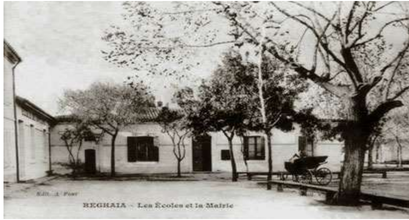
Ecole et Mairie

Des Mahonnais se fixèrent de même à la Réghaïa et à La Rassauta. Où l'on faisait des essais de coton qui donnait de beaux bénéfices au prix commercial le plus réduit.