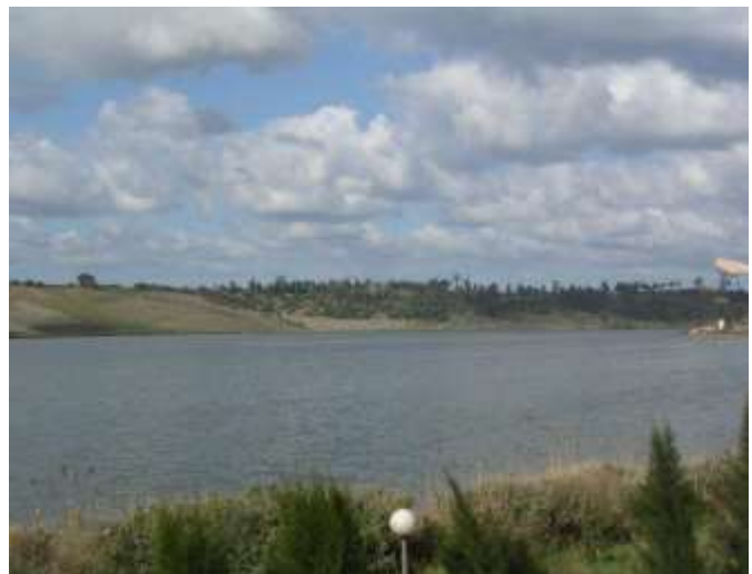
Lac de REGHAÏA

Il y a des sources en abondance, propres à l'irrigation. Le sol est couvert de bois de haute futaie, notamment de forêts de chênes-lièges et d'oliviers sauvages. Des terres à poterie, des carrières de pierres calcaires appellent l'industrie. Des jardins potagers, des vergers, une orangerie, une pépinière, des cultures sont une première amorce à la colonisation » [fin citation Jules DUVAL]