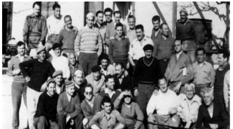
Des membres du Parti communiste algérien, internés dans le camp de Lodi (document non daté).