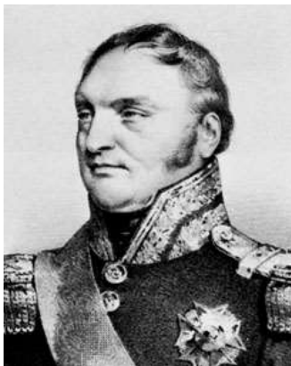
Bertrand CLAUZEL (1772/1842)