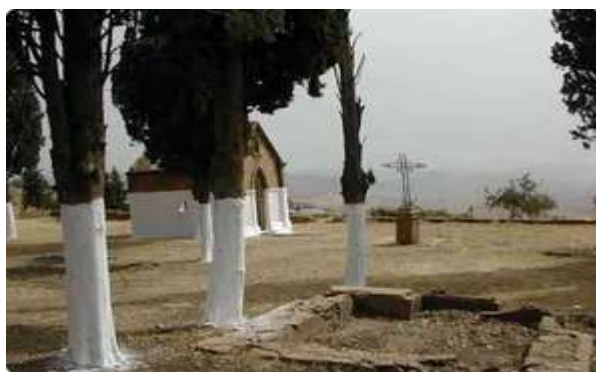
LODI de nos jours.