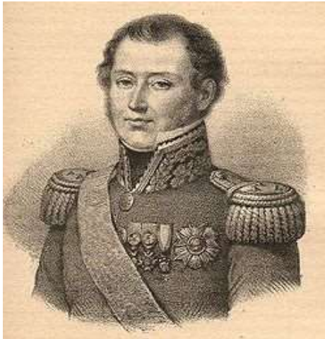
Pierre BERTHEZENE (1775/1847)