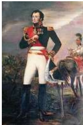
Louis De BOURMONT (1773/1846)