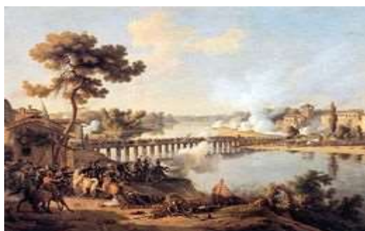
Bonaparte donnant ses ordres à la bataille de LODI par Louis-François Lejeune.

Le nom de Lodi perpétuait le souvenir de la bataille du pont de Lodi de 1796, victoire des Français sur les coalisés qui permit au général Napoléon Bonaparte de s'emparer de Milan lors de la campagne d'Italie.