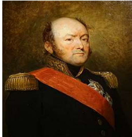
J. Baptiste DROUET D'ERLON (1765/1844)

Le 22 juillet 1834, une ordonnance du roi confie le commandement général et la haute administration des possessions françaises en Algérie à un gouverneur général placé sous les ordres du ministre de la guerre. Le général Drouet d'Erlon est nommé quelques jours après gouverneur général des possessions françaises du Nord de l'Afrique. Mais la situation des enclaves françaises en Algérie est rendue précaire par les ambitions du bey de Mascara, l'émir Abd-El-Kader qui, fort du traité qu'il a conclu avec le général Desmichels le 26 février 1834, étend en 1835 sa domination dans le Titteri, au centre de l'Algérie, depuis le Maroc jusqu'aux confins du beylicat de Constantine.