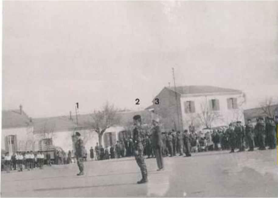
Place de la Mairie à MONTCALM