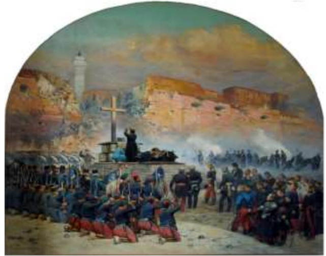
Il a été tué lors de l'assaut sur Constantine.

Sous le nom de haute plaine de Guelma l'on peut réunir les différentes régions agricoles fortement accidentées qu'arrosent les eaux supérieures de la Medjerda, de la Seybouse, et de leurs affluents. Il y eut là, dès le début de la conquête, quelques centres agricoles créés :