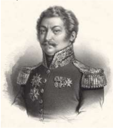
Charles Denys de DANREMONT (1783/1837).