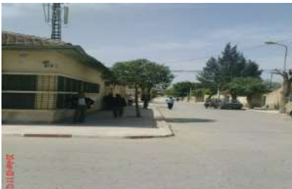
La Poste de MONTCALM

L'arrondissement de CONSTANTINE comprenait 25 localités : AÏN-ABID – AÏN-REGADA – AÏN-SMARA - BIZOT – CHATEAUDUN-DU-RHUMEL – CONDE-SMENDOU - CONSTANTINE - DJEBEL AOUGUEB - DJEMILA – EL-ARIA - EL GUERRAH – EL-MALAH – GUETTAR-EL-AÏCH – HAMMA-PLAISANCE – LE-KROUB - MONTCALM – OUED-ATHMENIA – OUED-SEGUIN – OUED-ZENATI – OULED-RAHMOUN – RAS-EL-AIOUN – RAS-EL-AKBA - RENIER - ROUFFACH - SAINT DONAT –