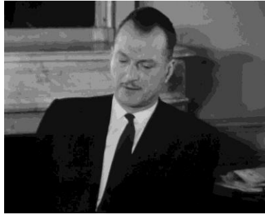
Paul DELOUVRIER (1914/1995) : Délégué général du gouvernement en Algérie de 1958 à 1960.

Enfin comment passer sous silence un autre aspect du problème révélé par Monsieur Paul DELOUVRIER, ancien délégué général du gouvernement en Algérie : http://www.de-gaulle.info/sciencevie.shtml