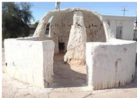
HASSI-MESSAOUD = le puits de Messaoud