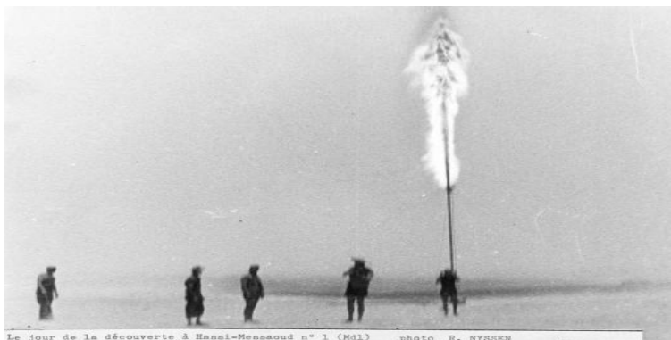
Le jour de la découverte à Hassi-Messaoud n° 1 (Mdl)