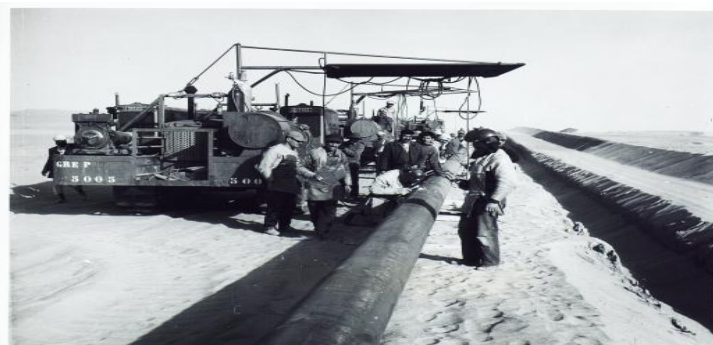
Construction du pipeline entre Hassi-Messaoud et le port pétrolier de Bougie.

A compter de cette date, le pétrole allait être acheminé par wagons citernes, par la voie de chemin de fer reliant Touggourt à Bône.