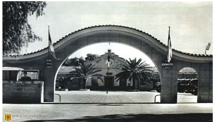
Mairie de PARMENTIER

https://fr.wikipedia.org/wiki/Antoine_Parmentier