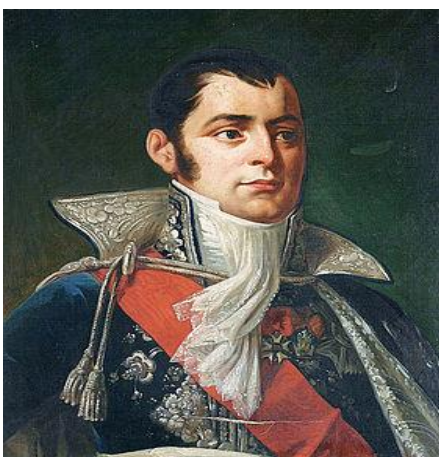
Anne Jean Marie René SAVARY, duc de ROVIGO (1774/1833) http://fr.wikipedia.org/wiki/Anne_Jean_Marie_Ren%C3%A9_Savary