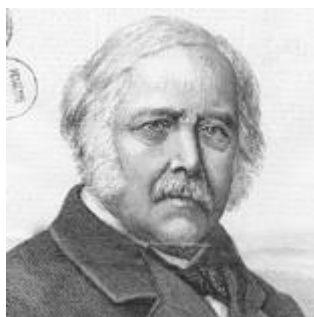
Joseph Othenin Bernard de CLERON, comte d'Haussonville (1809/1884)

Si plus, je vous recommande ce lien : https://fr.wikisource.org/wiki/Les_Alsaciens-