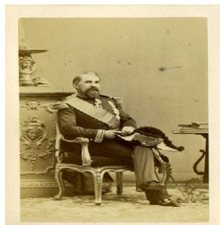
Joseph VANIMI dit YUSUF (1810-1866) http://babelouedstory.com/voix_du_bled/yusuf/yusuf.html