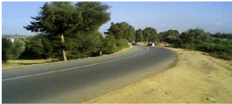
L'arrivée à LA-ROBERTSAU

Le bail avec promesse de location de concession ne fut signé que le 11 février 1875, et le titre de propriété rendu définitif que le 11 septembre suivant, pour une contenance totale de 30 hectares 83 ares, répartis en : lot urbain 15 ares, lot de jardin 20 ares, lot rural de seconde zone 19 ha 36 a, plus un lot pour la culture du tabac d'un hectare et 4 ares »