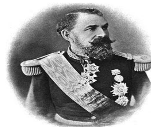
Joseph VANTINI dit YUSUF (1808/1866)

https://fr.wikipedia.org/wiki/Joseph_Vantini