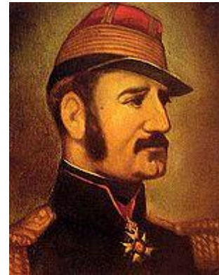
Général Marie-Alphonse BEDEAU (1804/1863)

Le général BEDEAU en 1846, avait signalé à la Commission du peuplement, cette plaine fertile, aux terres riches, véritable nœud de routes à destination de PHILIPPEVILLE, BÔNE, GUELMA et CONSTANTINE. Les ruines importantes qui existaient, démontraient que les Romains, bons juges en matière de colonisation, avaient dû créer, dans cette vallée de l'Oued FENDECK, une colonie florissante. Le général BEDEAU songeait à reprendre la tradition des Légions Augustiennes et à réserver ces terrains aux vieux soldats libérés et à leurs familles de France.