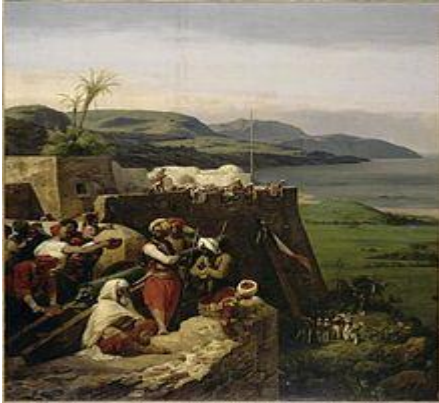
Prise de la casbah de BÔNE le 27 mars 1832

C'est en 1832 que les troupes françaises occupèrent BÔNE définitivement ; 6 ans plus tard, en 1838, sa banlieue était pacifiée et 671 colons officiaient dans des exploitations agricoles nouvellement créées dans des centres de colonisation.