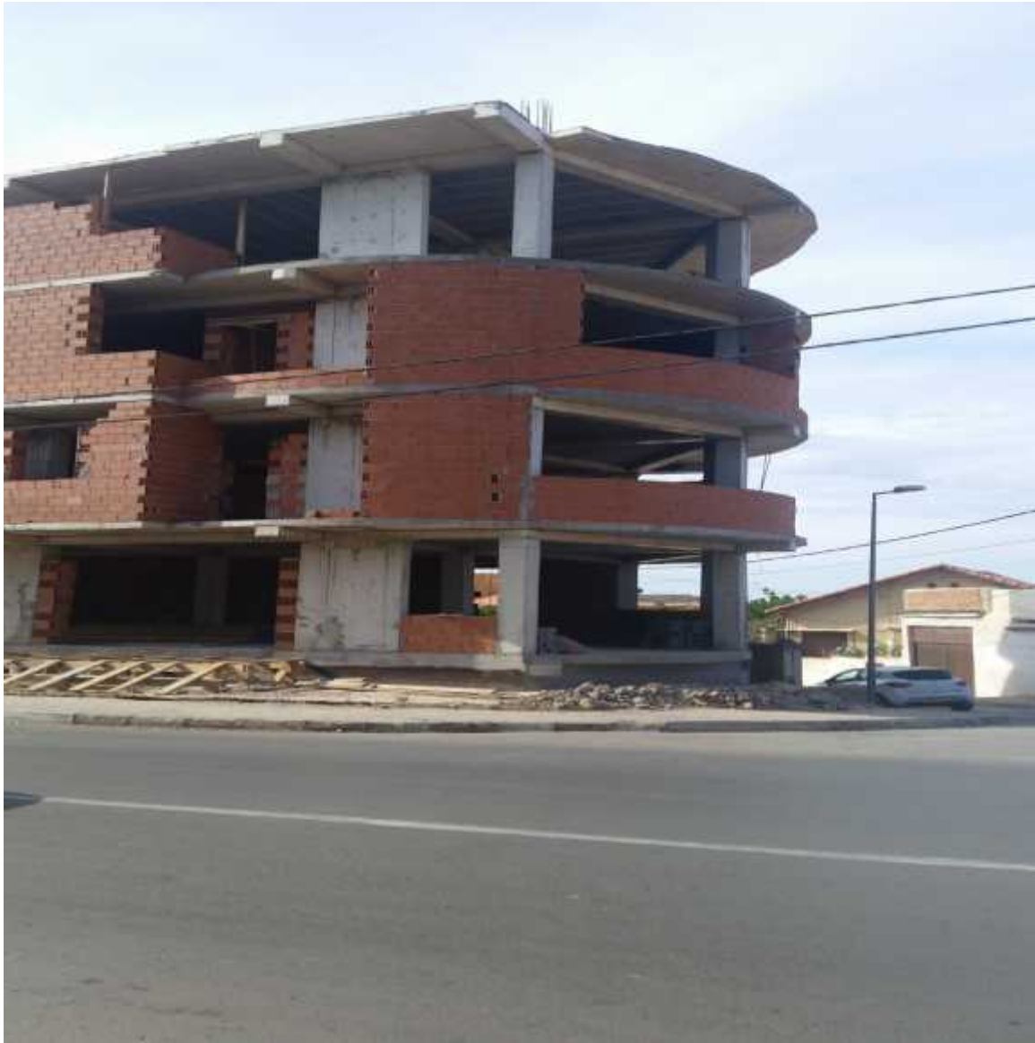
2016 : Le nouvel immeuble en construction à l'emplacement du Belvédère