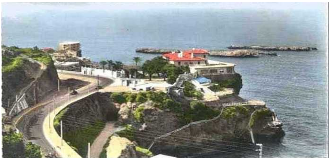
Casino-Pointe PESCADE en 1950

A cette époque la région située à l'Ouest d'ALGER comprise entre les faubourgs de la ville et SIDI-FERRUCH est assez désertique. Il existe une route « carrossable », en bord de mer, jusqu'à la Pointe PESCADE et une ancienne voie romaine, quelque peu réaménagée, sur les collines de la future forêt de BAÏNEM, permet de rejoindre SIDI-FERRUCH. Des faubourgs d'Alger jusqu'à AÏN-BENIAN, GUYOTVILLE n'existe pas encore, nous trouvons un peu d'agriculture et quelques fermiers dont les descendants, pour certains, sont encore là en 2004.