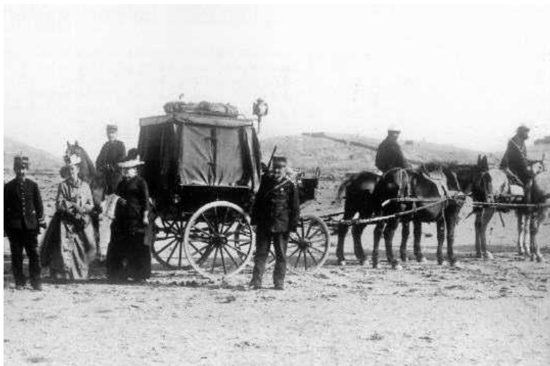
Diligence BÔNE-GUELMA

Désormais son nom restera dans l'histoire de l'Algérie française, marqué sur un coin de la carte comme un signe, parmi tant d'autres, du génie français.