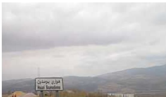
Mohamed Ben Brahim BOUKHAROUB alias Houari BOUMEDIENE (1932/1978)

https://fr.wikipedia.org/wiki/Houari_Boum%C3%A9di%C3%A8ne