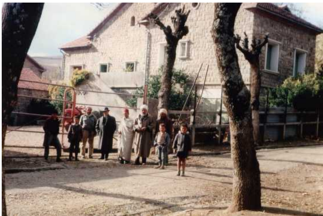
CHEVREUL : Maison MONTSERRET