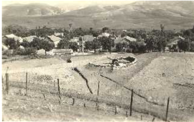
CHEVREUL et le canon du 2 ème RAC

Ecole de garçons d'ARBAOUM à 10 km de CHEVREUL - 2 salles, 2 classes, 82 élèves, un logement de 3 pièces, une cour, un préau de 50 m 2 , 2 cours d'adultes.