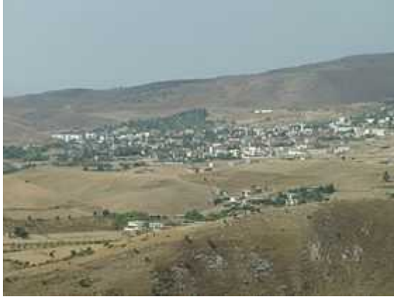
Vue de CHEVREUL

Le centre de CHEVREUL créé le 3 août 1895, ne fut peuplé qu'en 1898, il porte le nom du chimiste CHEVREUL Michel Eugène, connu pour son travail sur les acides gras, la saponification, la découverte de la créatine et sa contribution à la théorie des couleurs. Ces travaux lui valurent la médaille COPLEY en 1857.