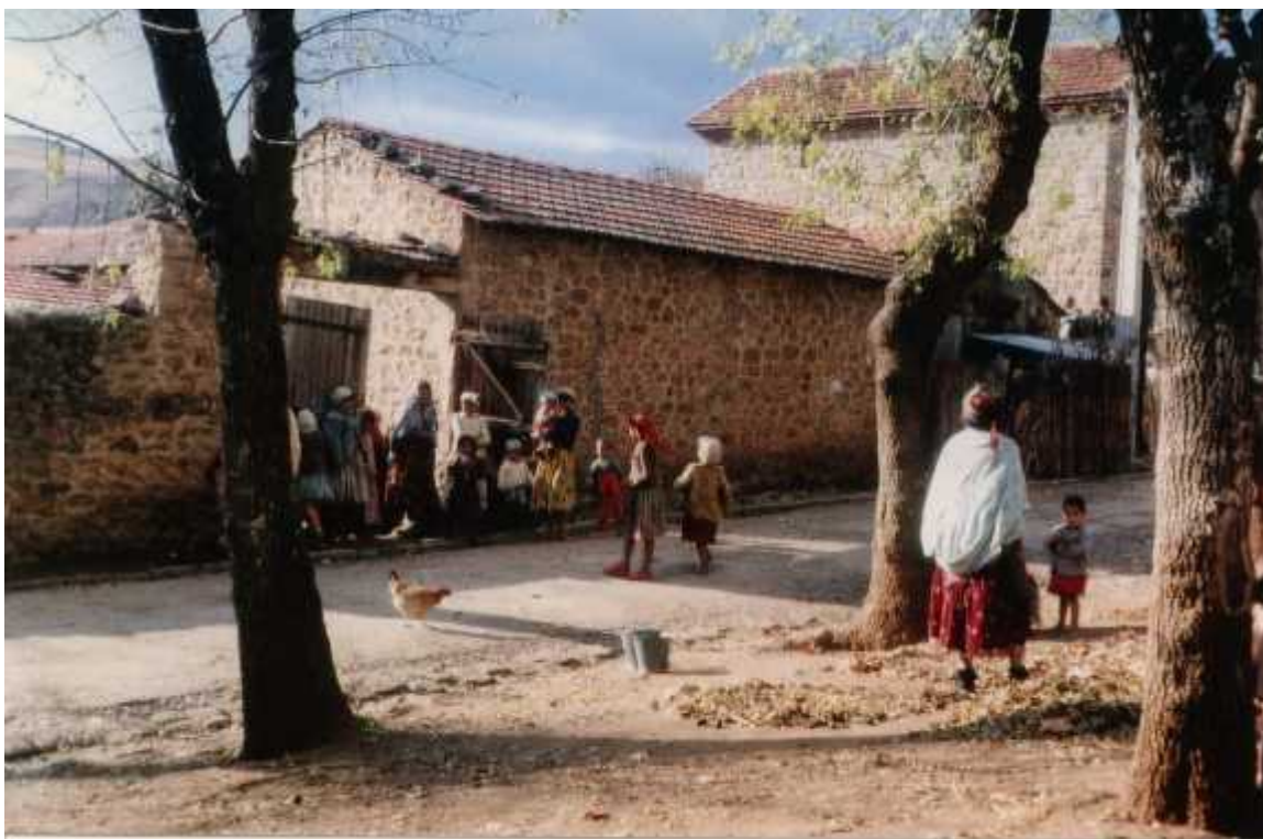
Une ruelle de CHEVREUL

Le département comportait encore à la fin du 19 e siècle un important territoire de commandement sous administration militaire, notamment dans sa partie saharienne. Lors de l'organisation des Territoires du Sud, en 1905, le département fut réduit à leur profit à 87 578 km 2 , ce qui explique que le département de CONSTANTINE se limitait à ce qui est aujourd'hui le Nord-est de l'Algérie.