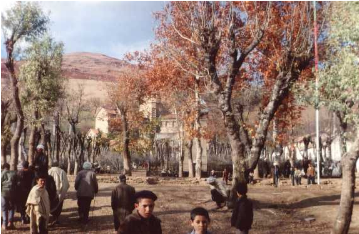
CHEVREUL : La gendarmerie

L'adjoint spécial, aidé de quelques amis, se dispose à mettre le cadavre à l'abri, mais des coups de feu éclatent, tout près. Il faut courir au plus pressé. L'alerte est donnée à la population. Mot d'ordre : se réfugier à la gendarmerie. De partout, les familles se hâtent. Les retardataires essuient des coups de feu. Les révoltés ont, en effet, envahi le village. La gendarmerie ne tarde pas à être cernée.