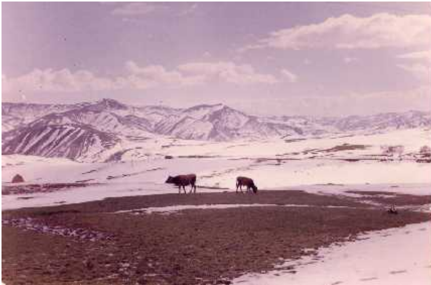
CHEVREUL