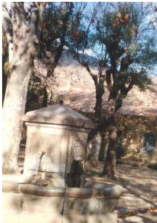
L'abreuvoir et la fontaine du village de CHEVREUL

1925 : Suite au vœu émis par le Conseil général (G.G.) de la création d'une route reliant CHEVREUL à DJEMILA qui permettrait d'ouvrir un périmètre de colonisation, la réponse du G.G. a été négative : « Etant donné la nature accidentée et le peu de valeur des terres, il n'y a pas lieu de poursuivre l'idée d'un périmètre de colonisation. »