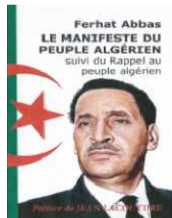
FERHAT ABBAS (1899/1985)

http://www.senat.fr/senateur-4eme-republique/moste-fai-el-hadi0063r4.html