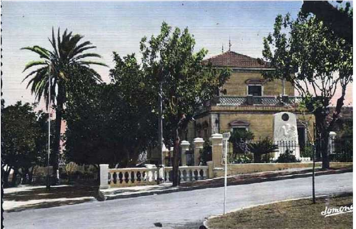
Mairie de TEFESCHOUN

TEFESCHOUN, situé sur la colline, derrière un bois de pins, était essentiellement habité par des viticulteurs d'origine alsacienne. Là se trouvait la mairie.