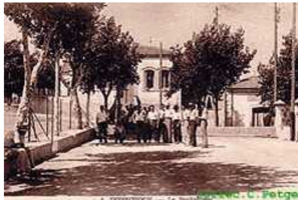
6. TEFESCHOUN. — Le 30 mai 1898. — C. Petger

Un autre petit port de pêche, BOU HAROUN, complétait cette commune. Des intérêts divergents, des origines différentes firent que BOU HAROUN finit par obtenir son indépendance administrative. Il fera d'abord partie de la commune de KOLEA, puis de celle de CASTIGLIONE et fait partie du département d'ALGER. Elle devient une commune de plein exercice le 31 janvier 1898 incluant les villages de TEFESCHOUN , CHIFFALO et BOU HAROUN.