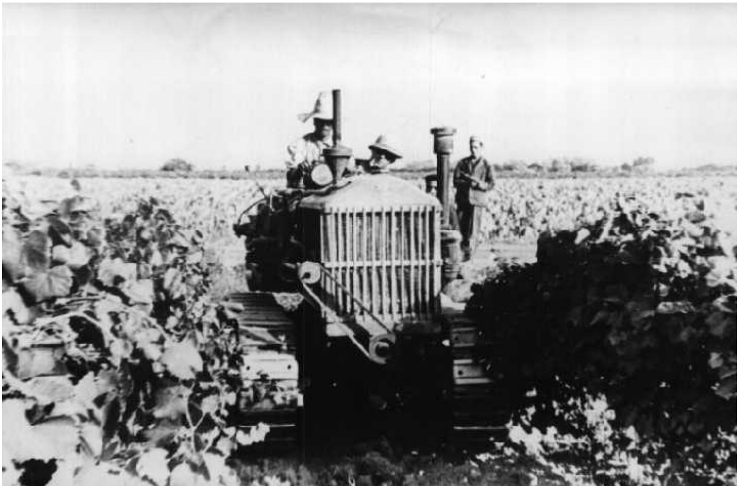
Tracteur dans les vignes

Au début les premiers colons, comme partout dans le Sahel des années 1850 cultivaient fourrages et céréales. Le vignes fut plantée à la fin du siècle et élimina presque complètement les cultures précédentes. Les vins obtenus, rouge en grande majorité titrent entre 10 et 12 degrés (quelquefois plus), étaient appréciés.