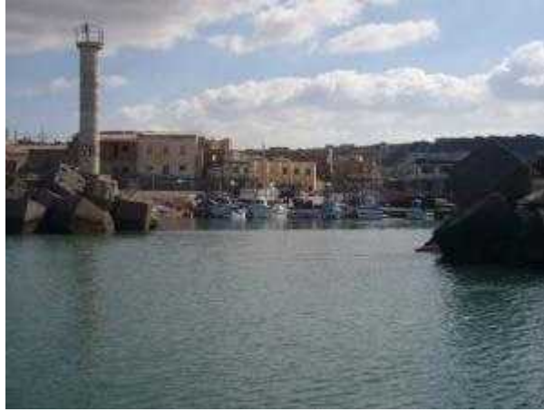
Port de CHIFFALO

TEFESCHOUN, situé sur la colline, derrière un bois de pins, était essentiellement habité par des viticulteurs d'origine alsacienne. Là se trouvait la mairie.