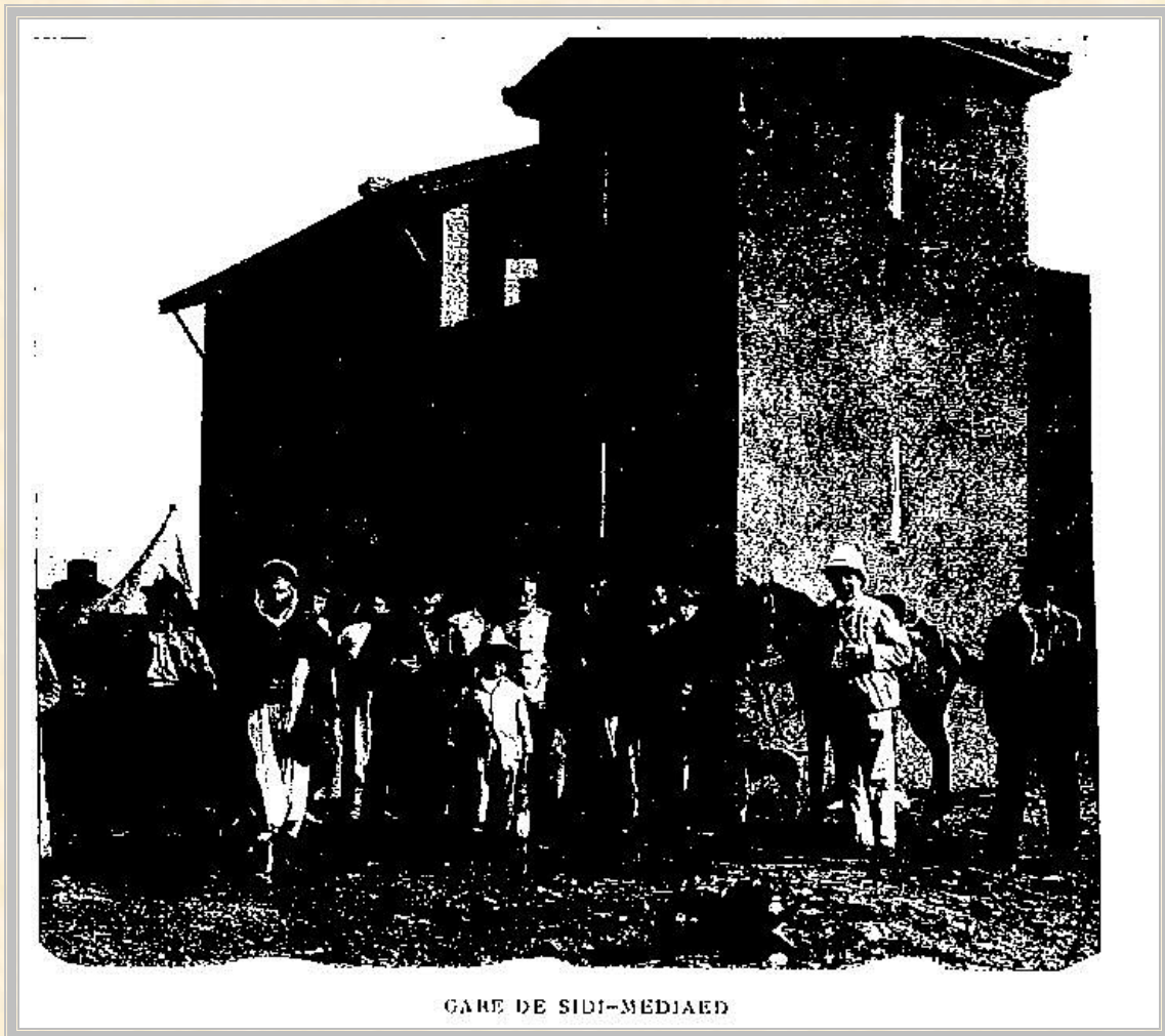
GARE DE SIDI-MEDIAED

« L'Afrique est un paon et le Maroc en est la queue », écrivait un historien arabe. »