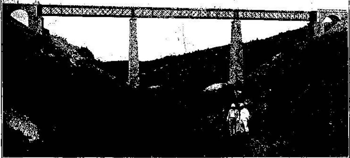
LE GRAND VIADUC DE L'OUED AFAI

Les Travaux de construction de la Ligne Ferrée de Tlemcen à Marnia