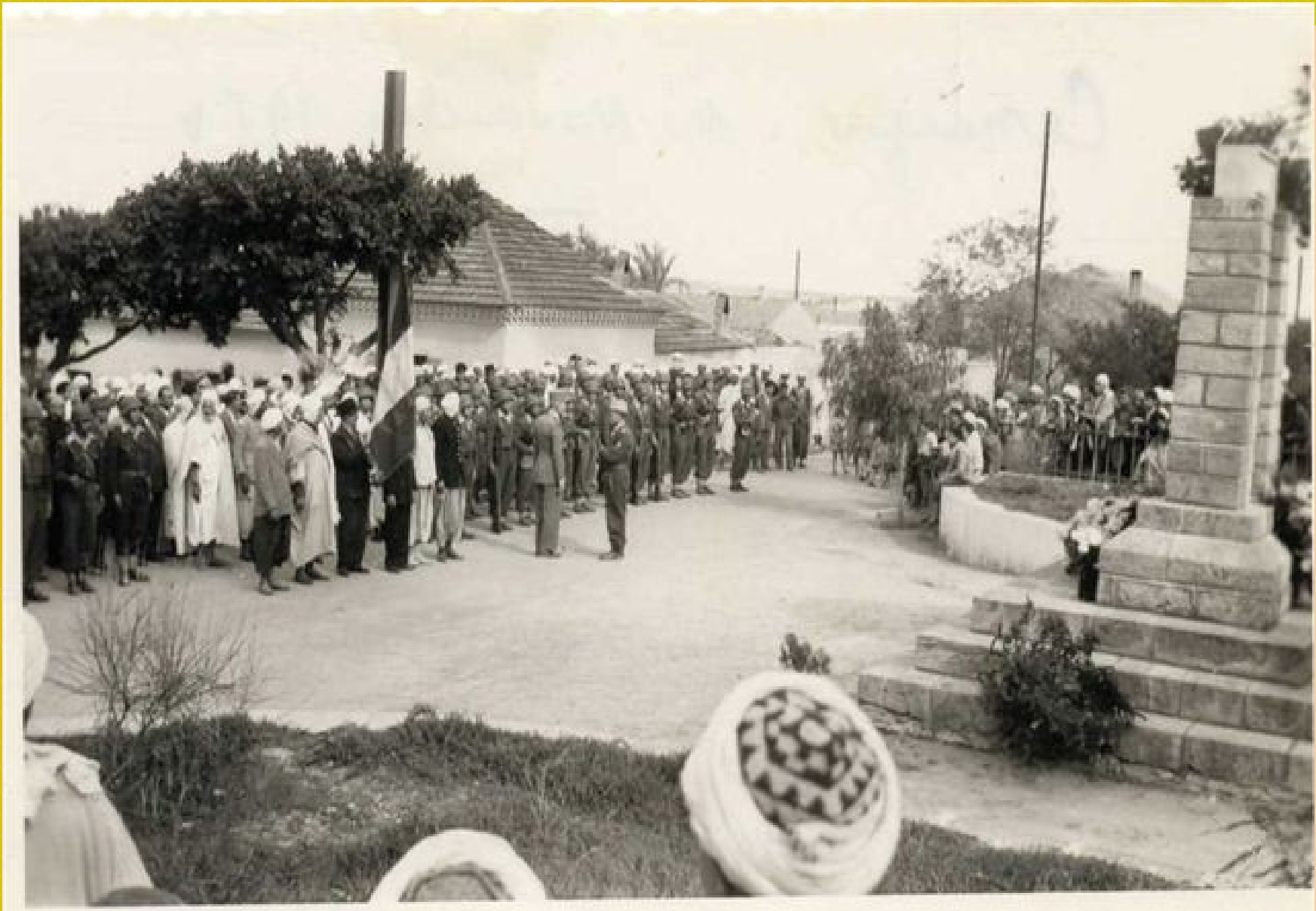
Le monument aux morts – 11 novembre 1954