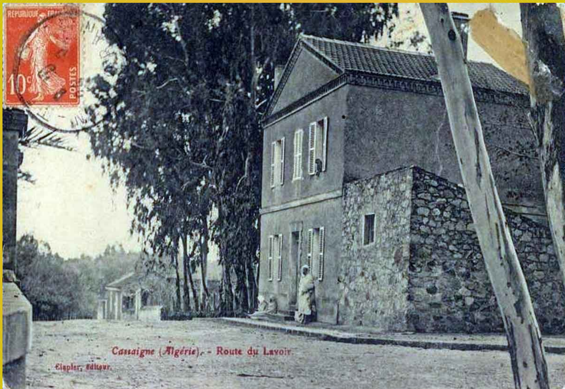
La rue du Lavoir