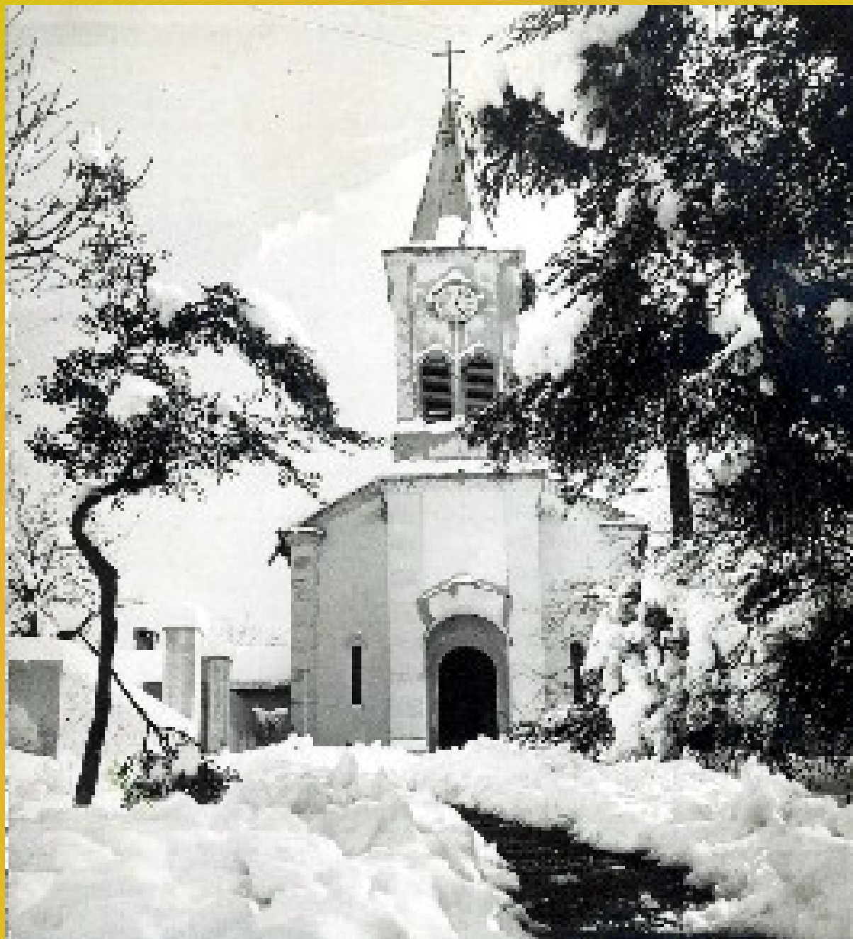
L'ancienne église