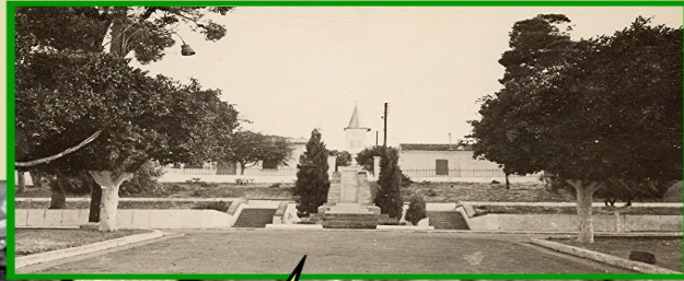
Le monument aux morts et derrière, l'église.