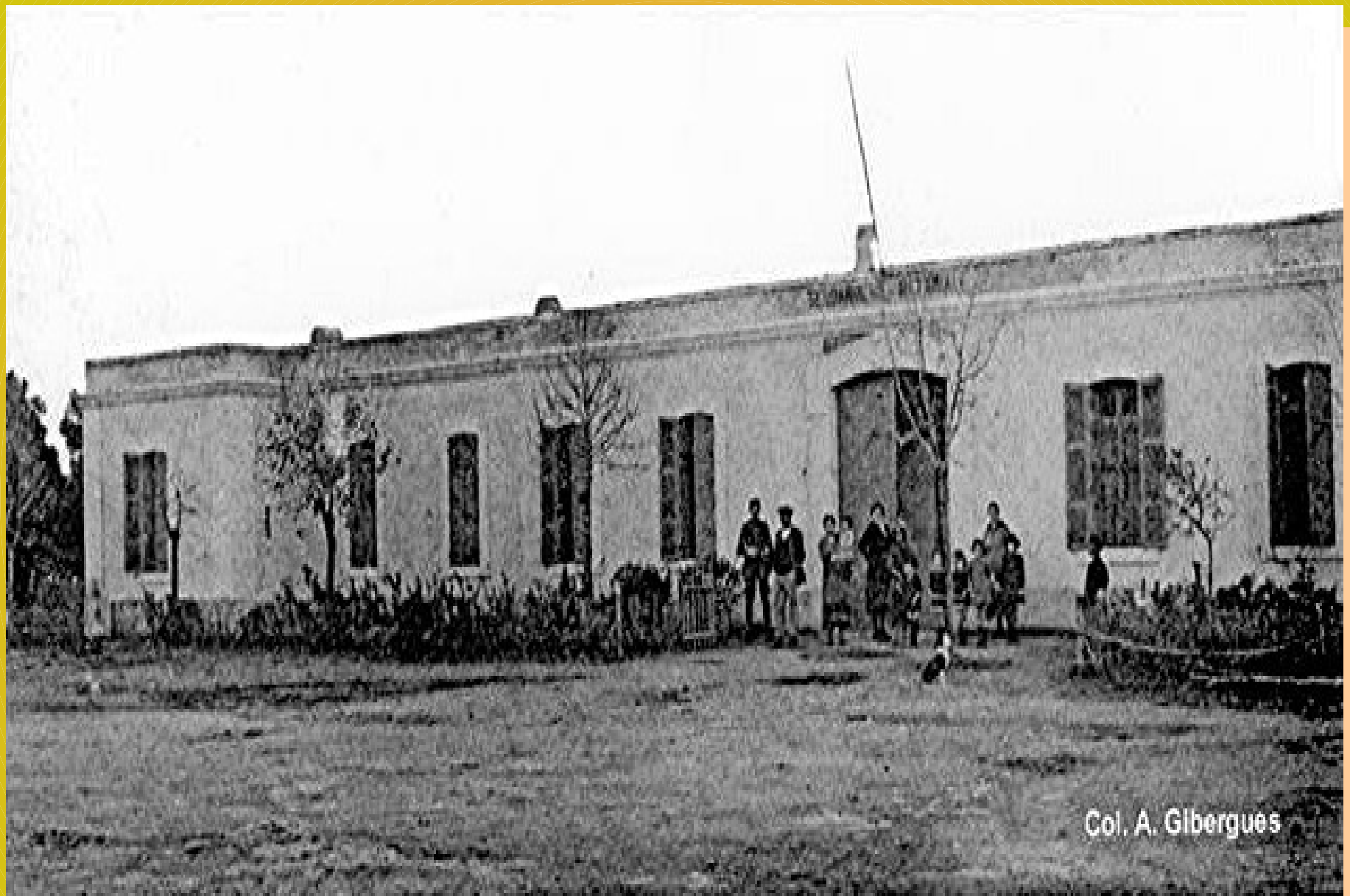
L'ancienne gendarmerie