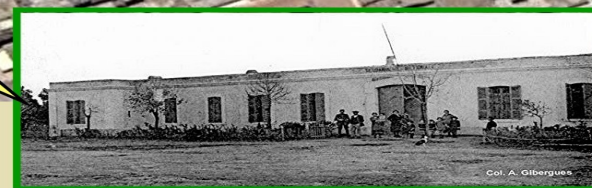
L'ancienne gendarmerie où j'ai vécu.