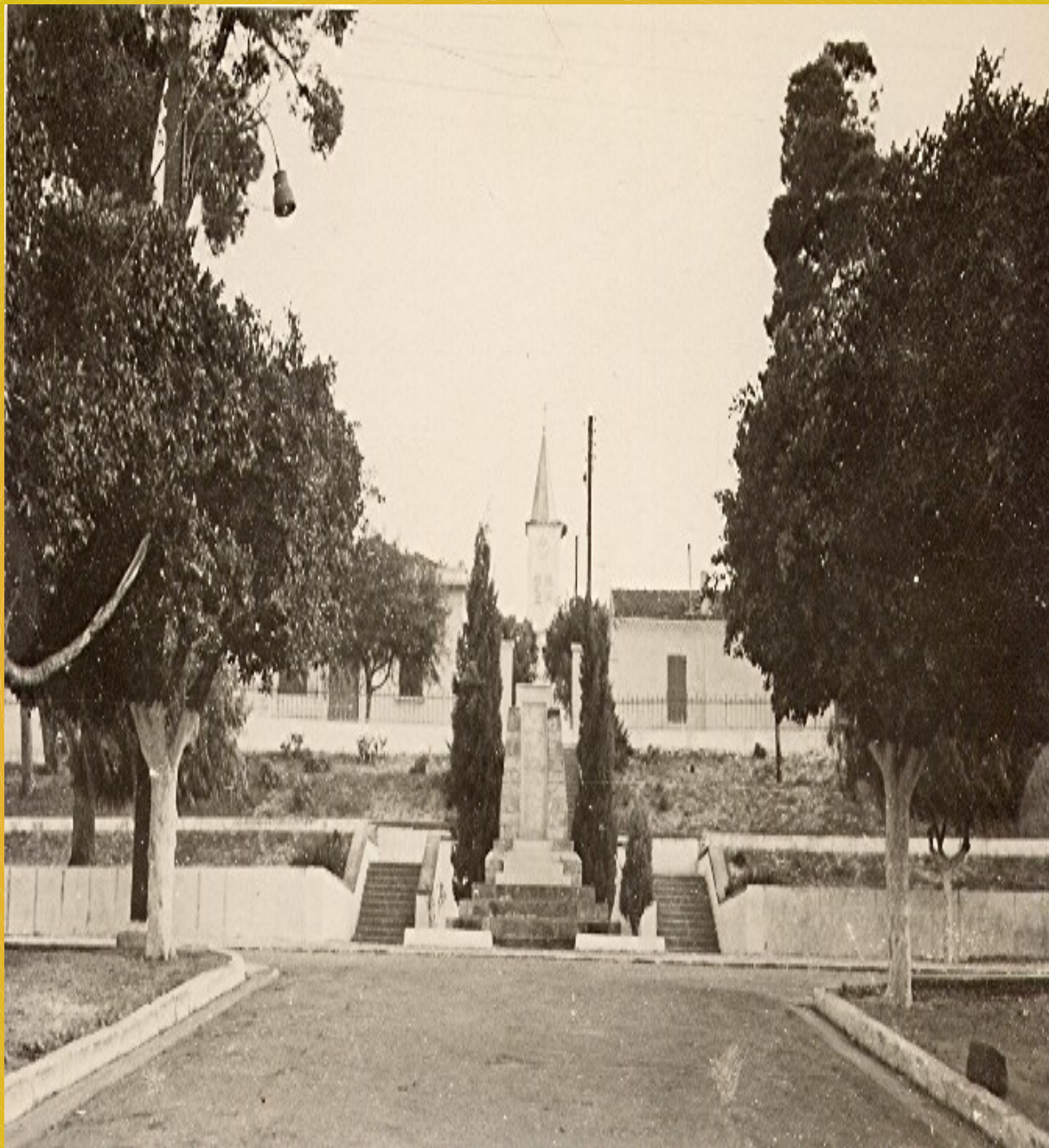
Le monument aux morts ((image du net)