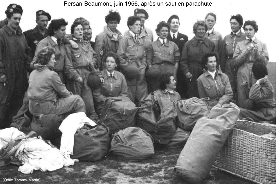
Persan-Beaumont, juin 1956, après un saut en parachute