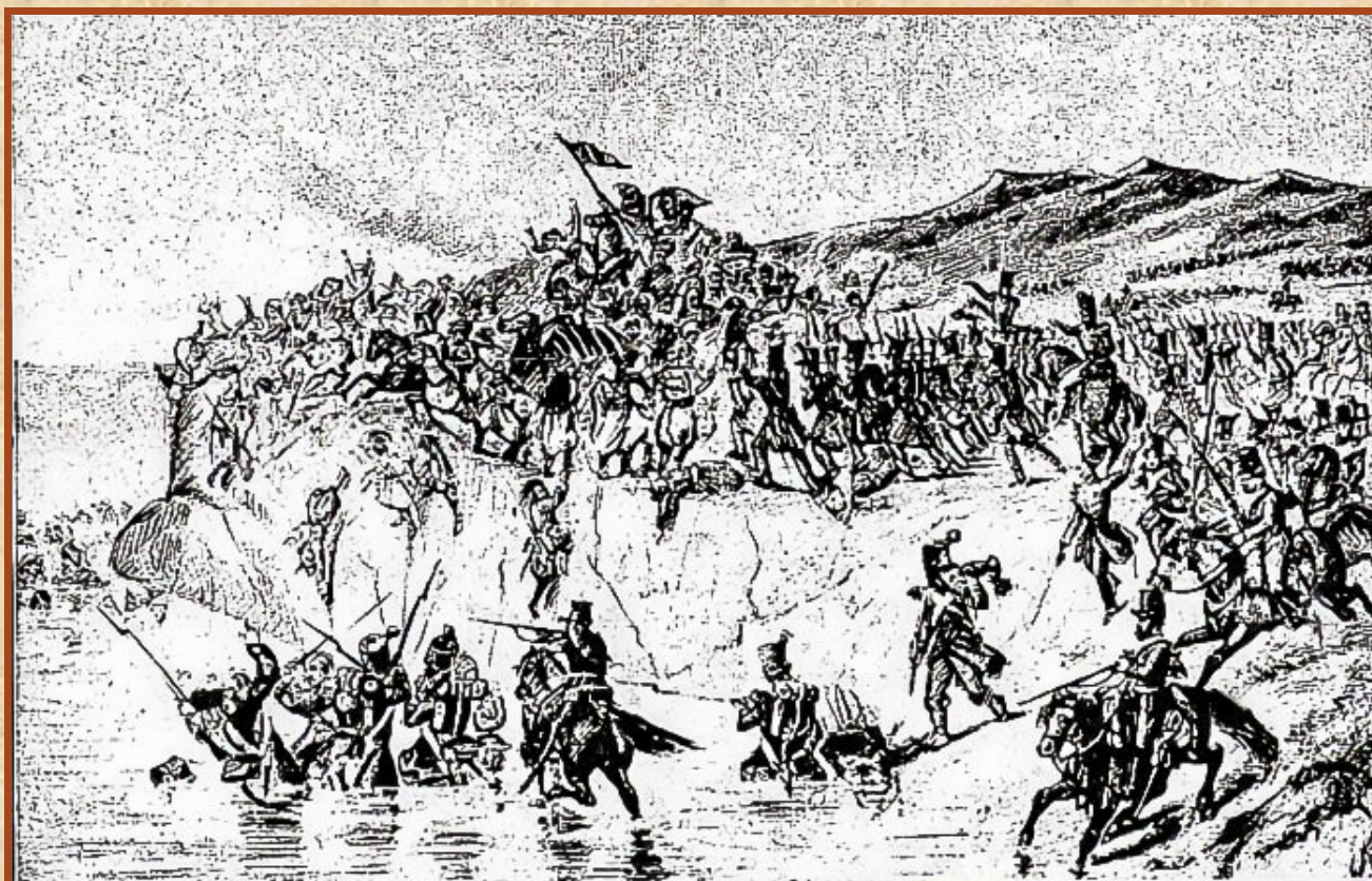
Le combat de la Sikak (reproduction d'un tableau de l'époque)