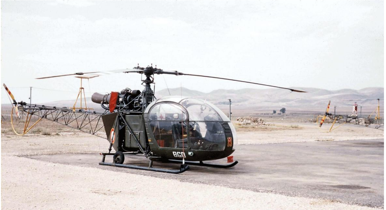
Tébessa, en mai 1959, l'Alouette II du GH N°2, codée BGD. Notez l'insigne peint sur le devant.