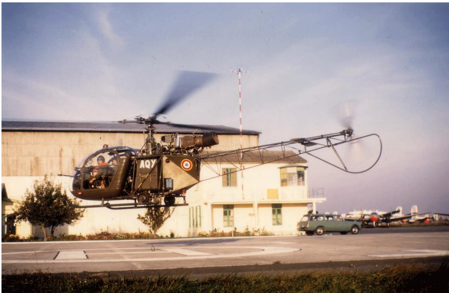
4 e GALAT en 1969, l'Alouette II codée AQY.