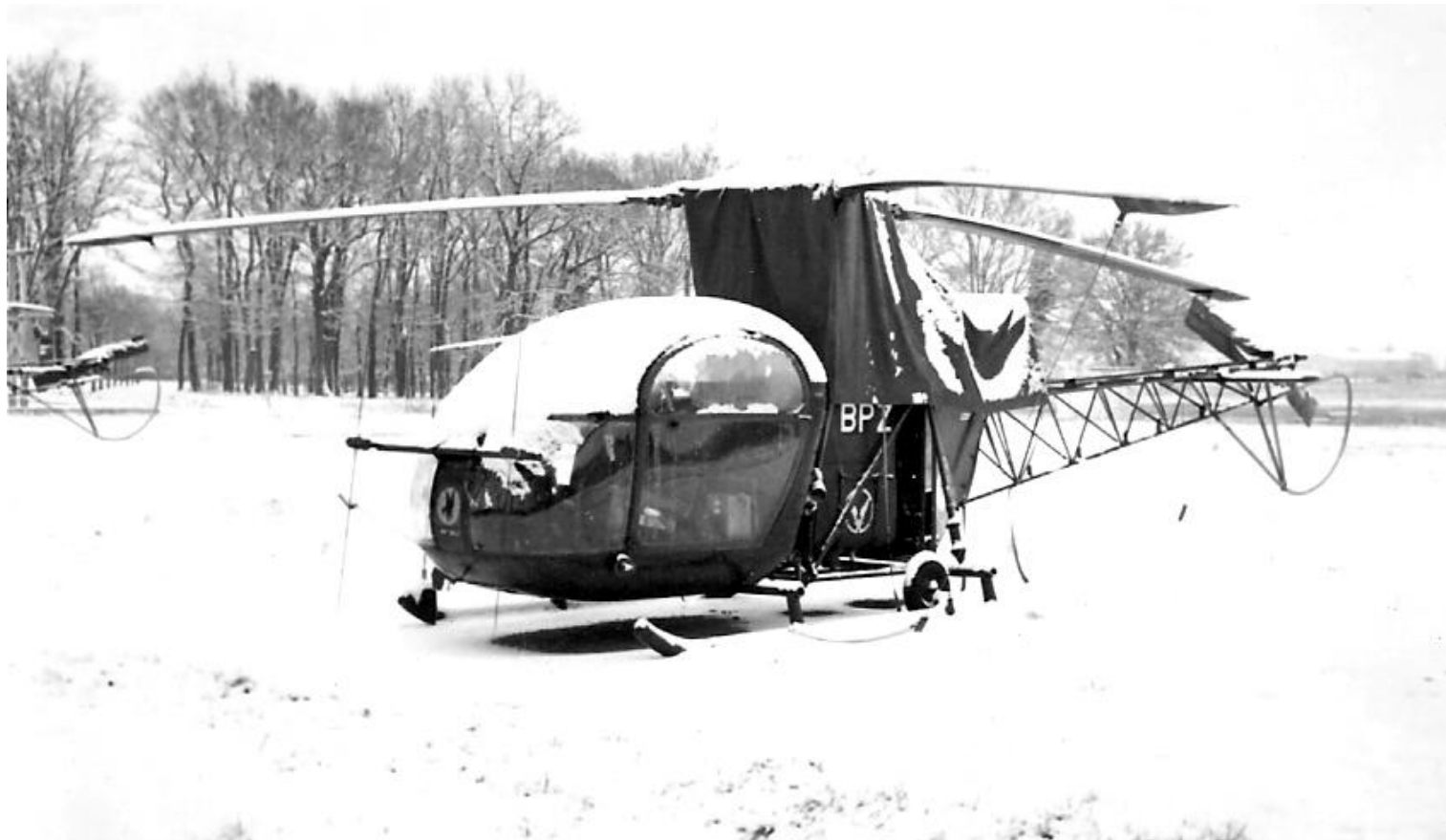
Alouette II du PMAH de la 11 e DLI, à Pau Le Hameau sous la neige, en début d'année 1963.