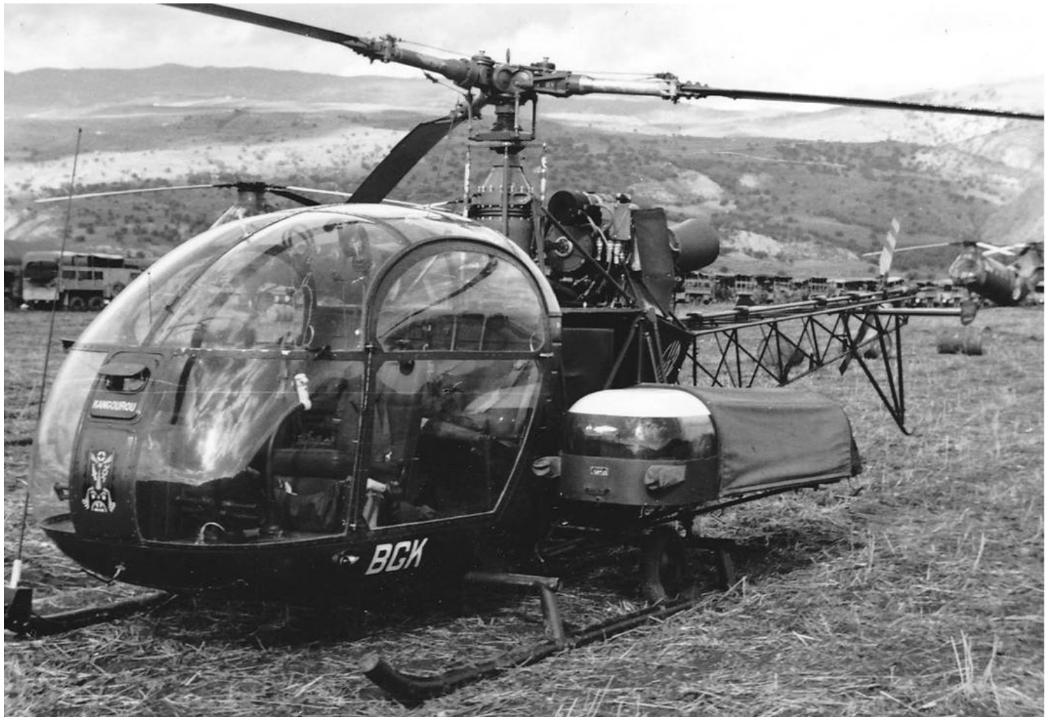
Alouette II codée BGK, du GH N°2, avec son surnom "KANGOUROU" peint en blanc au-dessus de l'insigne. L'appareil est équipé de plateau SIREN pour l'évacuation sanitaire.