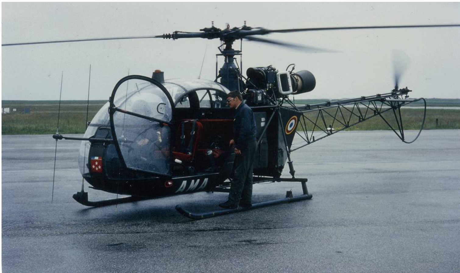
Alouette II, codée AMA, du 2° GALREG, le 17 juin 1978 au Havre. L'appareil porte les 4 étoiles du général.