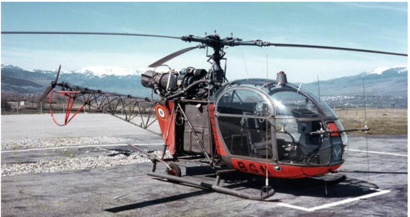
Al II, codée BGN, de l'ES.ALAT, détachée au CVM, à Saillagouse, en 1978.