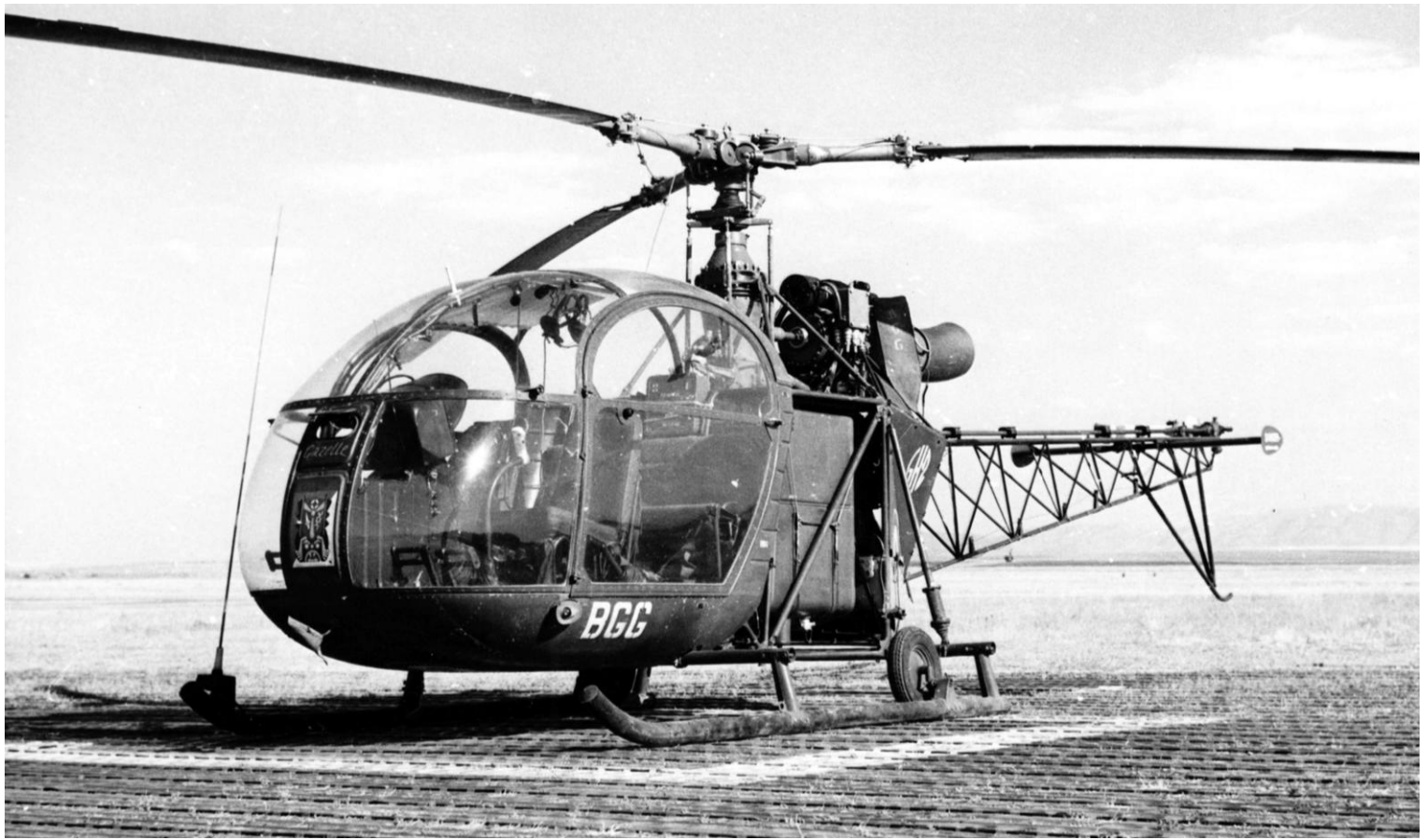
Alouette II surnommée "GAZELLE", codée BGG, du GH N°2, à Sétif en 1961.