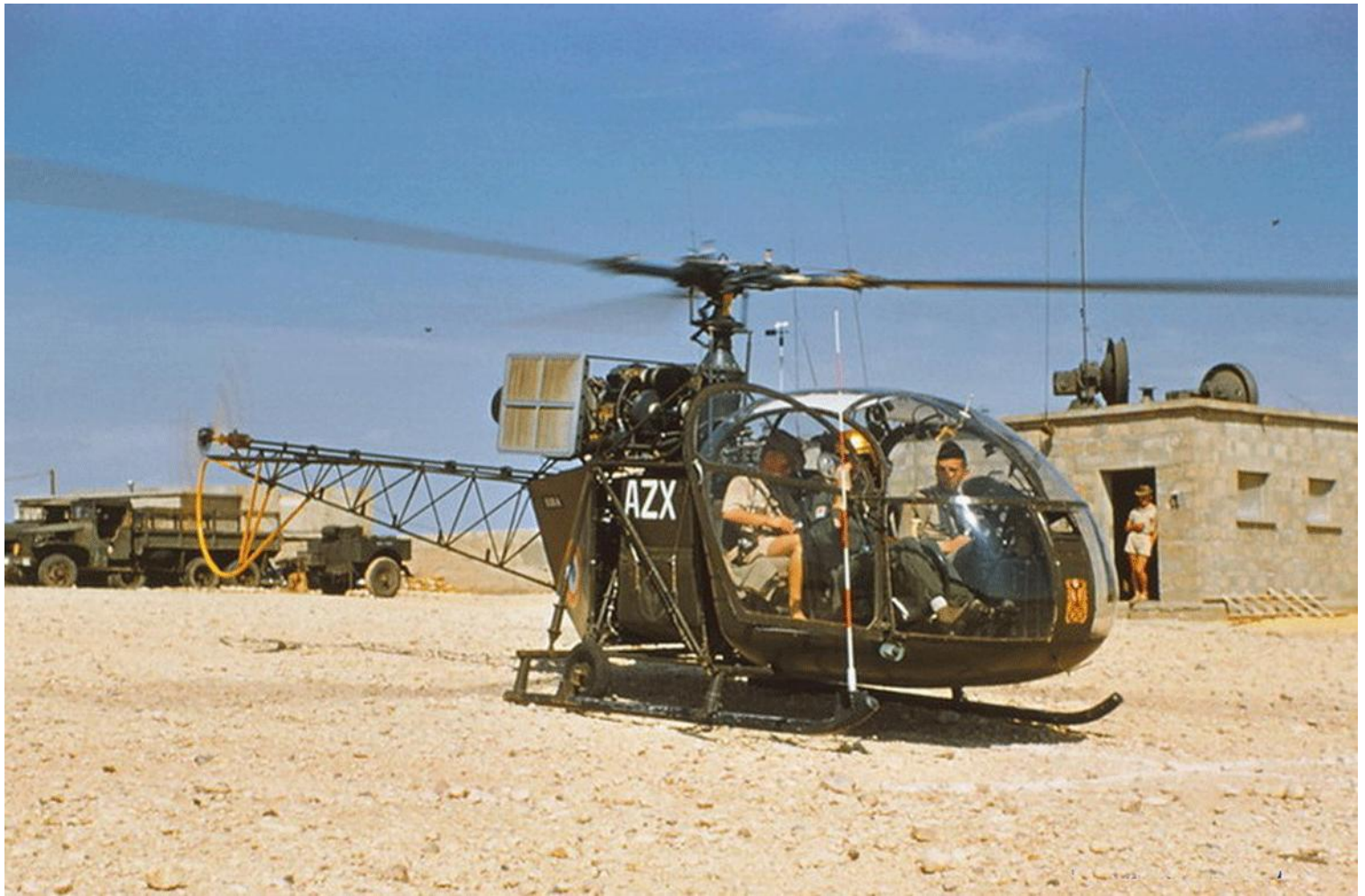
Alouette II du GH N°2, codée AZX. A noter, l'installation de filtres à sable pour voler en zone désertique (photo Charles Ethuin, collection Christian Malcros).