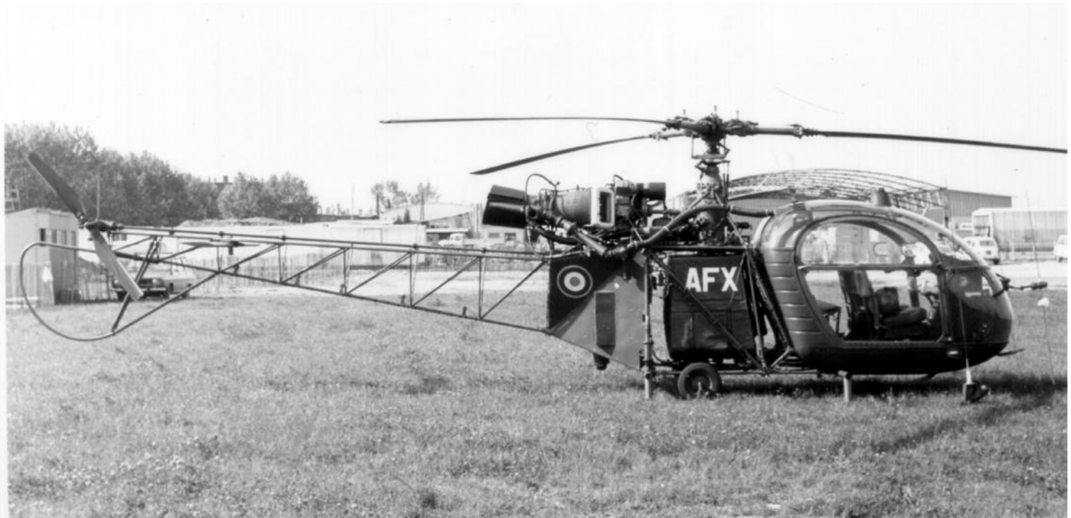
Mai 1973, Alouette II du GALAT 1, codée AFX.