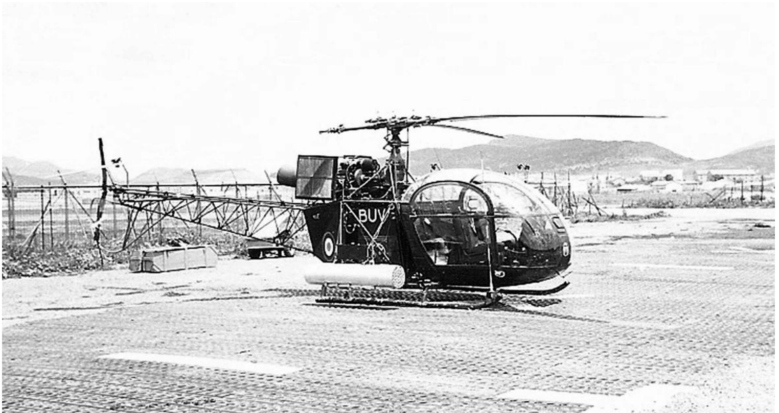
Alouette II du PMAH de la 21 e DI, armée de roquettes SNEB, et équipée de filtres anti-sable, à Batna.