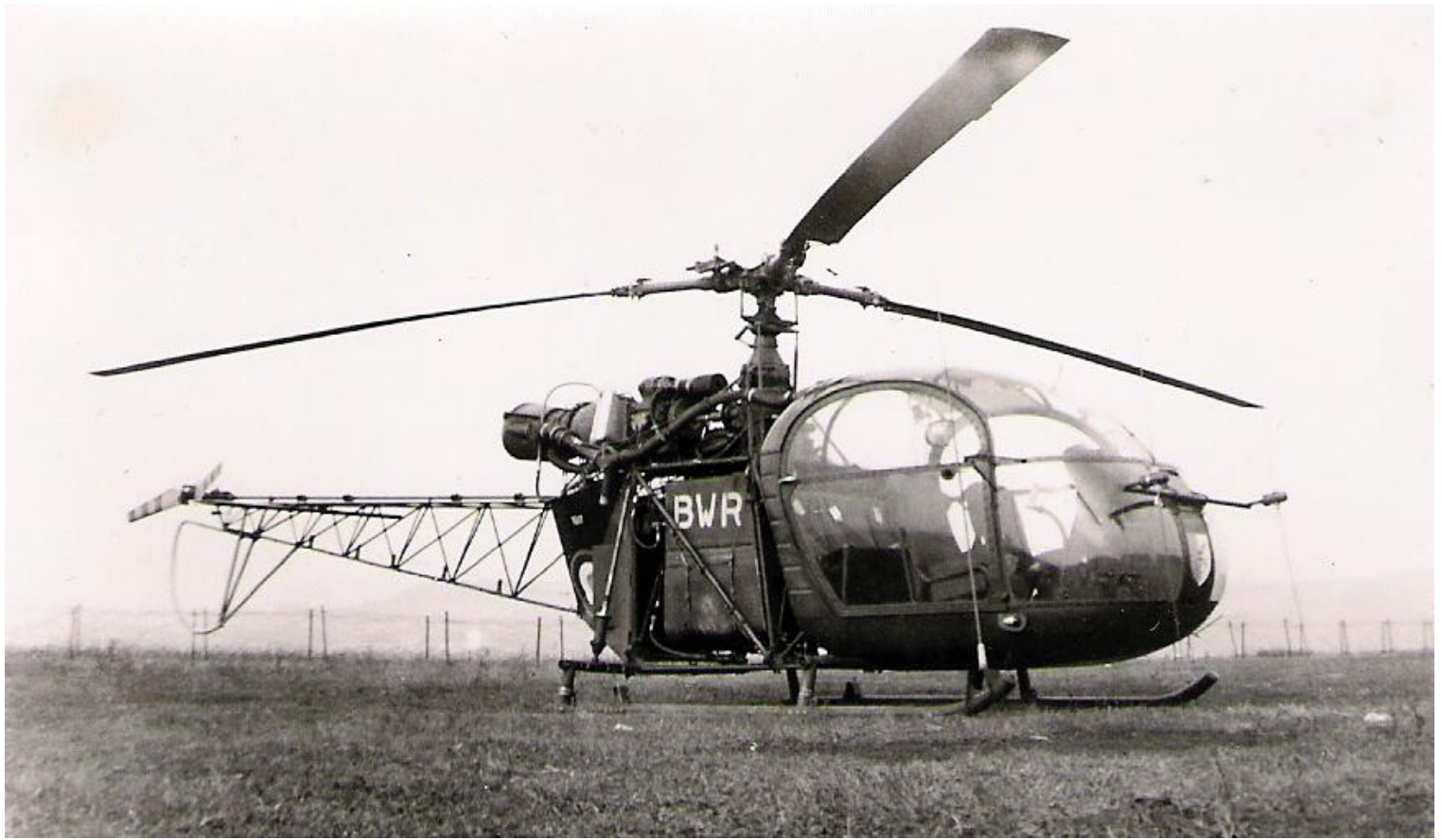
Alouette II codée BWR du Galdiv 7 de passage à Nancy en mars 1964..