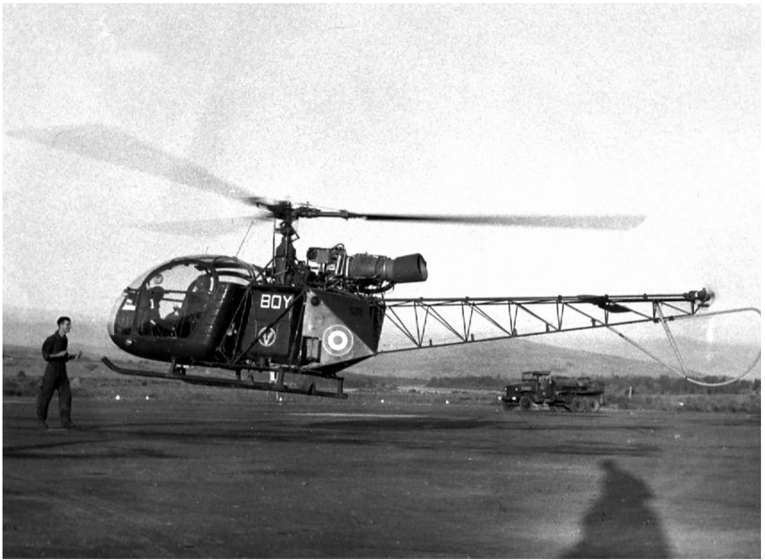
Alouette II, codée BQY, du PMAH de la 27 e DIA, sur le parking de Tizi-Ouzou.