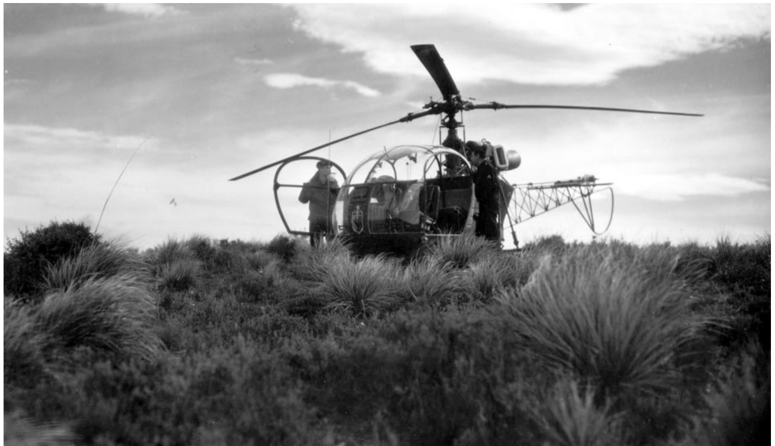
Alouette du PALAT MEK entre 1964 et 1967. Si l'on regarde bien, sur l'avant du plexis, apparaît l'insigne de la Base de Mers el Kebir. (photo Jacky Caron).