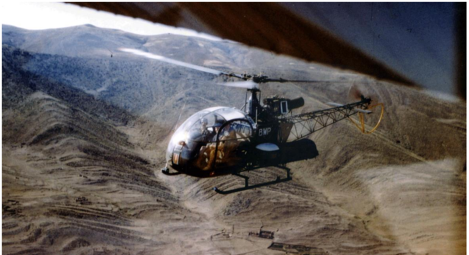
Alouette II, codée BWP, du PMAH de la 11 e DI, en 1961, sur l'Aurès, dans la région de Bou-Hamama.