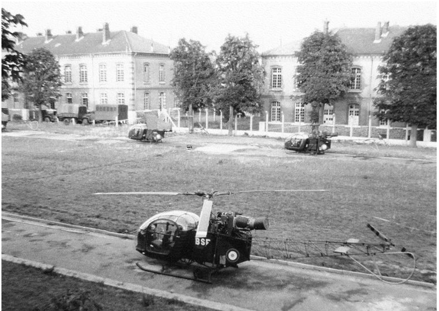
Trois Alouette II, dont celle du premier plan codée BSF, du GE.ALAT à Satory, en 1965.