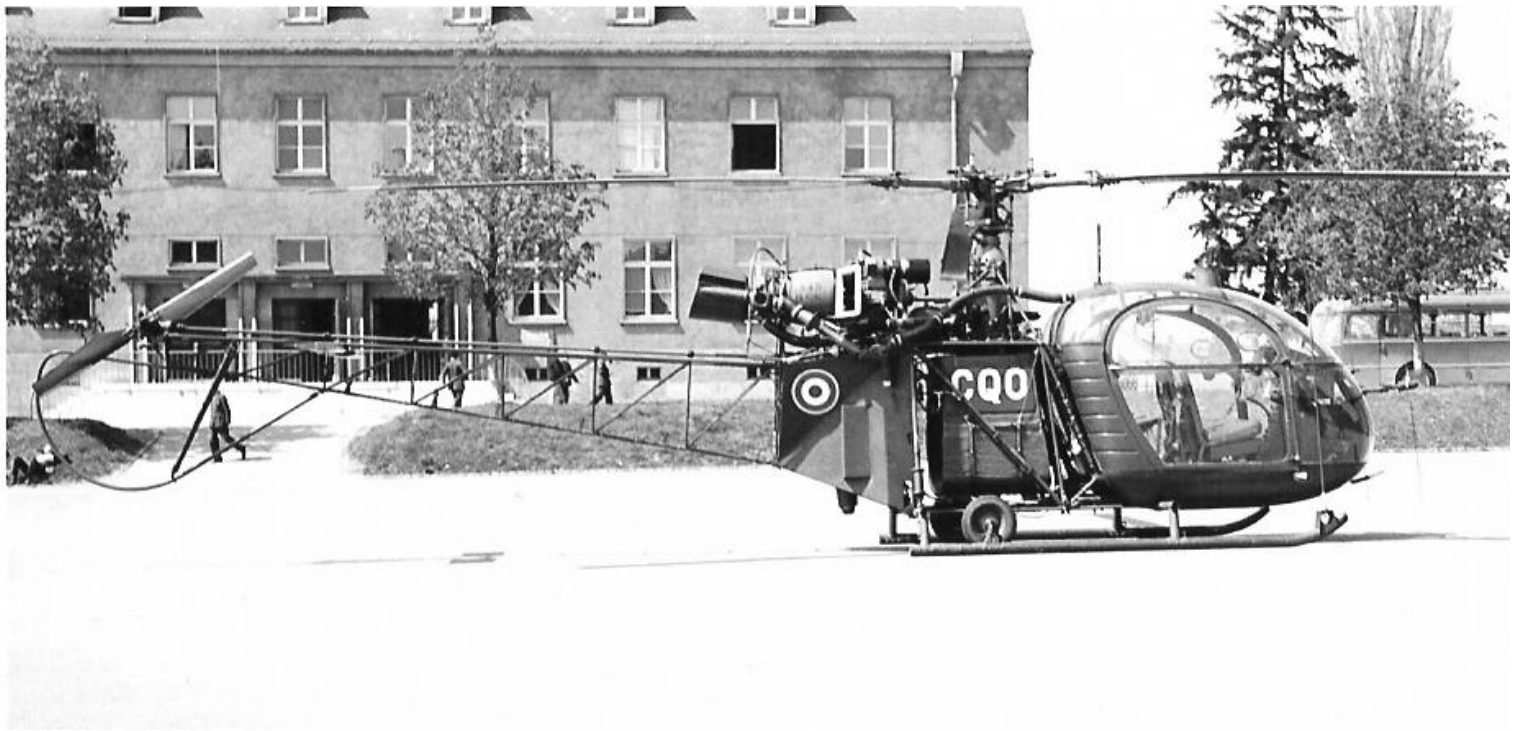
Alouette II du Galdiv 3, codée CQO, le 19 avril 1968 au quartier Bonaparte à Constance (Allemagne), siège à l'époque du 34 e RA...