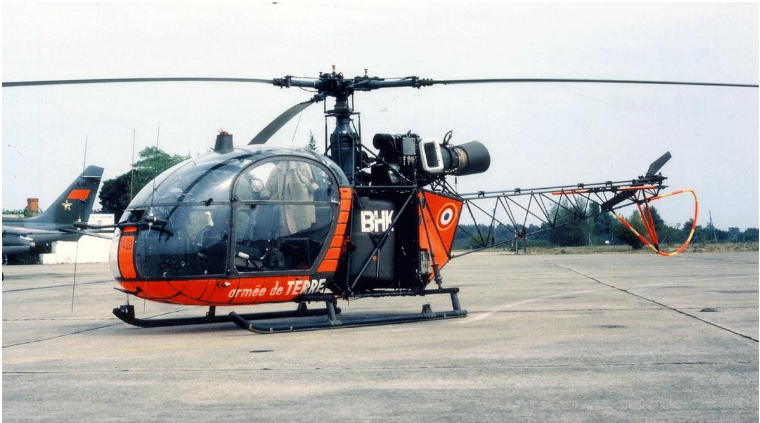
Alouette II n°1400/BHK, de l'ES.ALAT, en août 1984.