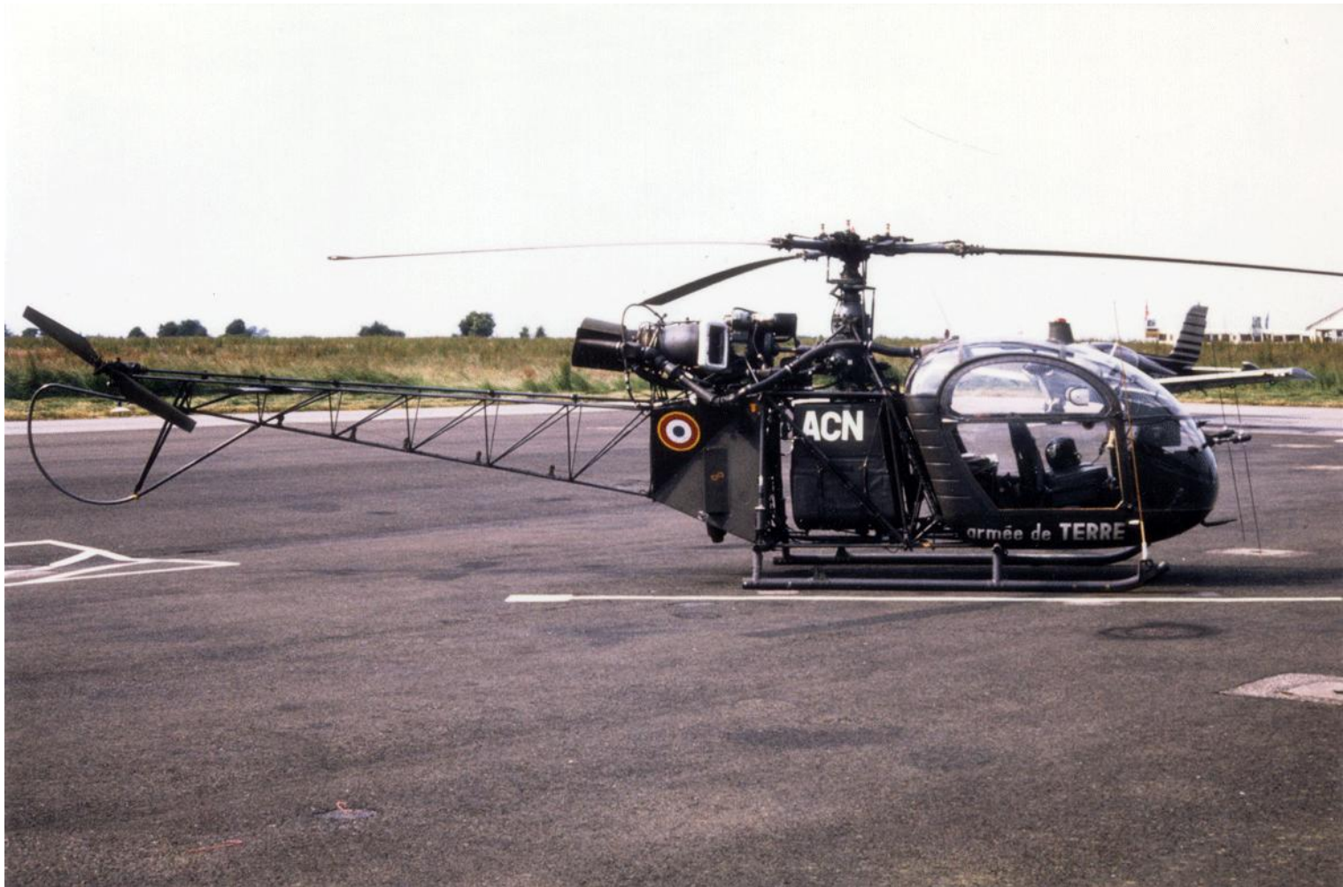
Alouette II n°1355/ACN, du COMALAT, le 16 mars 1983 à Rouen-Boos. (photo Luc Aubin).