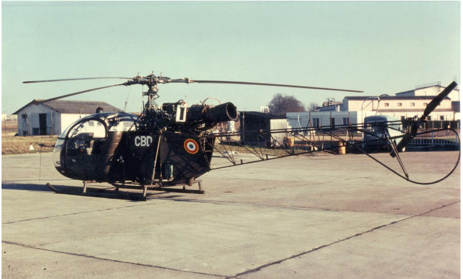
Alouette II n°1399/CBD, de l'EALAT.EAABC, à Poitiers, le 15 janvier 1976.