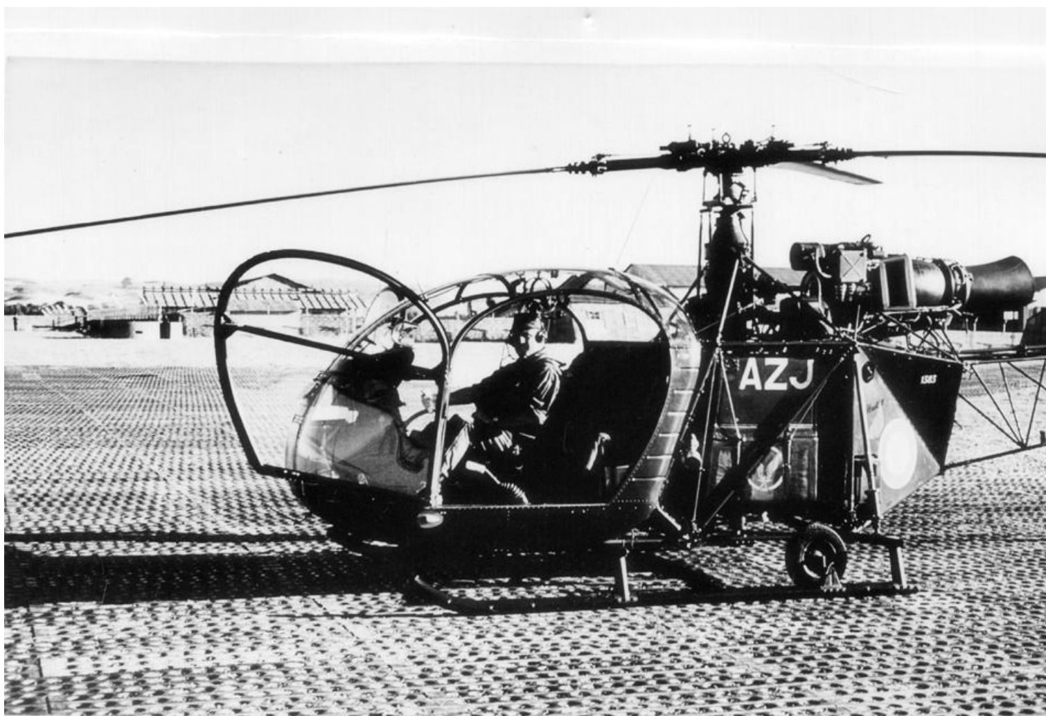
Alouette II n°1383/AZJ du GH N°2 (photo X, collection Christian Malcros).