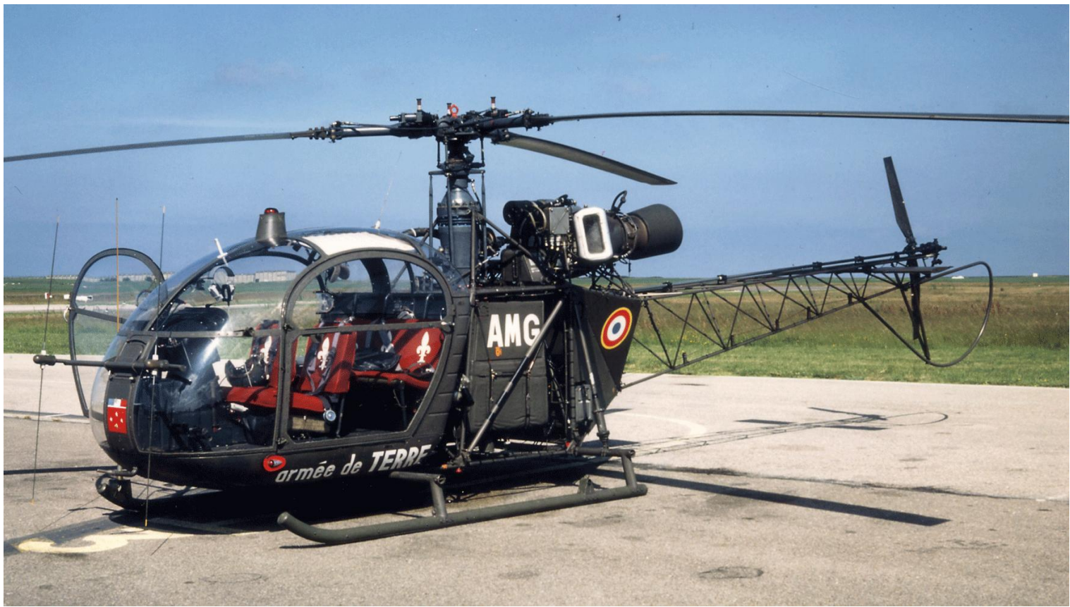
Alouette II n°1386/AMG, du 2 e GHL, en visite au Havre, le 24 juin 1984.