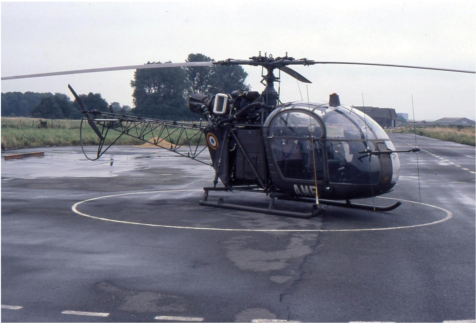
2 e GHL, Lille-Lesquin, 10 septembre 1980, l'Alouette II n°1413/AME.