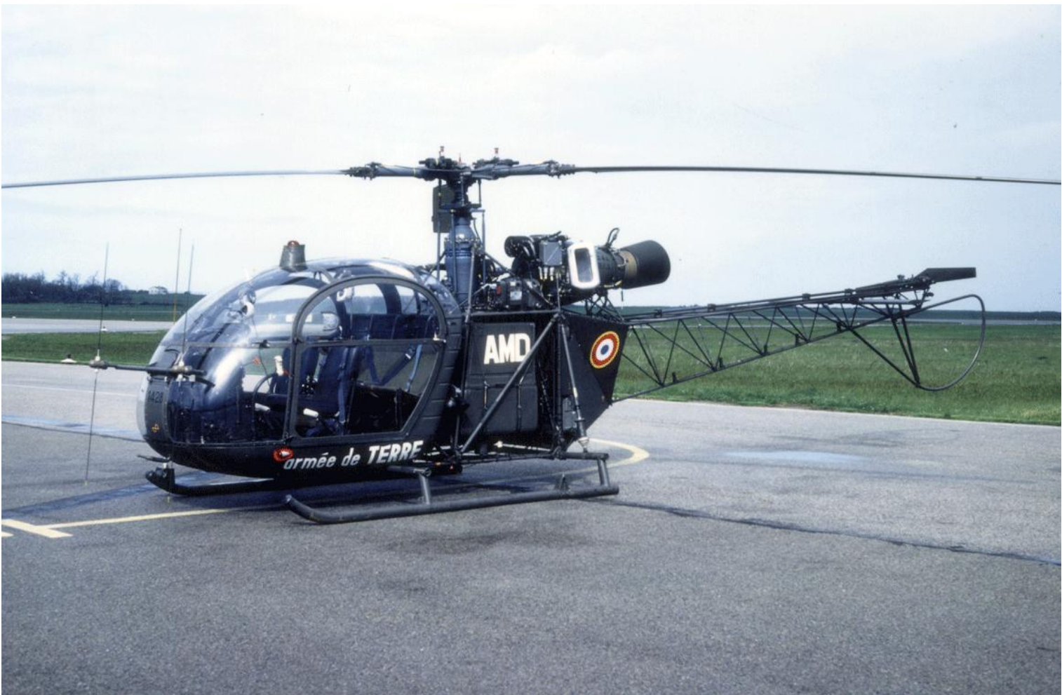
Alouette II n°1428/AMD du 2 e GHL, en transit au Havre le 4 mai 1983.