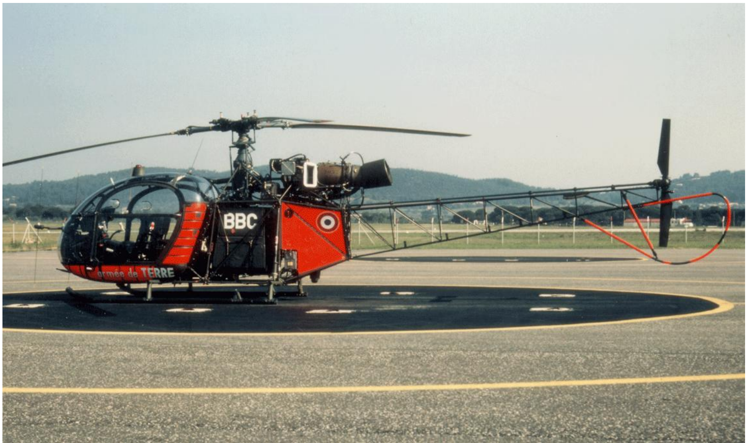
Alouette II n°1344/BBC, de l'EA.ALAT, en 1990, au Luc.