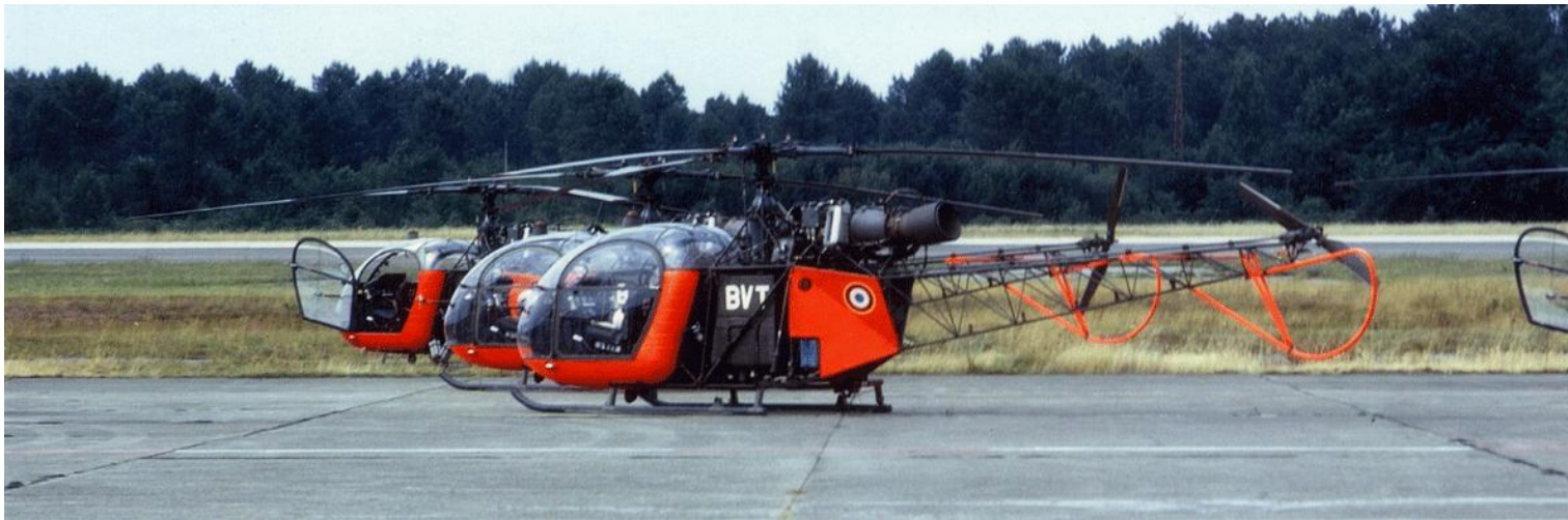
Alouette II n°1369/BVT, de l'ES.ALAT, en juillet 1974, à Mont-de-Marsan.

1369 203M SE3130 ALAT (76) équipée avec lance roquettes 04/04/60 ERM Versailles 17/05/60 AIA Alger Maison-Blanche 15/06/60 ERGM ALAT Chéragas 16/06/60 GH N°2 25/08/62 GALAT N°3 21/12/62 PMAH 4° DIM 22/01/63 ERGM ALAT Montauban 03/01/64 ES .ALAT 23/06/64 ERM Versailles 24/06/64 AIA Clermont-Ferrand IRAN 23/12/64 ERGM ALAT Montauban 10/06/65 ES .ALAT ??? (14/11/67) accidenté le 14/11/67 au 4° échelon. 28/11/67 AIA Clermont-Ferrand réparation 29/02/68 ERGM ALAT Montauban 30/05/65 2° GALAT 19/07/68 GALDIV 4 (05/05/70) (19/05/71) GALDIV 4 CXL 27/09/72 ERM Toul 04/10/72 ERGM ALAT Montauban 04/10/72 AIA Clermont-Ferrand IRAN 13/12/72 ERGM ALAT Montauban 23/01/73 ES .ALAT BVT (07/07/74) (20/07/74) 18/07/77 ERGM ALAT Montauban 18/07/77 AIA Clermont-Ferrand IRAN 05/10/77 ERGM ALAT Montauban 08/02/78 11° GHL AOT 26/09/78 AIA Clermont-Ferrand réparation 4e échelon 02/01/79 ERGM ALAT Montauban 28/09/79 EAABC 10/04/86 AIA Clermont-Ferrand EMJ 01/07/86 ERGM ALAT Montauban 22/02/88 ES .ALAT BFD (../07/90) ES .ALAT BGB (17/03/95) (../07/95) EA .ALAT Dax BFP (22/04/96) (06/03/97) 23/05/97 ERGM ALAT Montauban ../.../.. réformé avec .... heures 1370 204M SE3130 ALAT (77) équipée avec lance roquettes GH N° 2 AZQ (07/06/61) ES .ALAT BVV (03/05/74) accidenté le 03/05/74 à Peyrehorade à la suite d'une autorotation. ERM Bordeaux (18/10/74) réformé le 26/12/74 avec .... heures