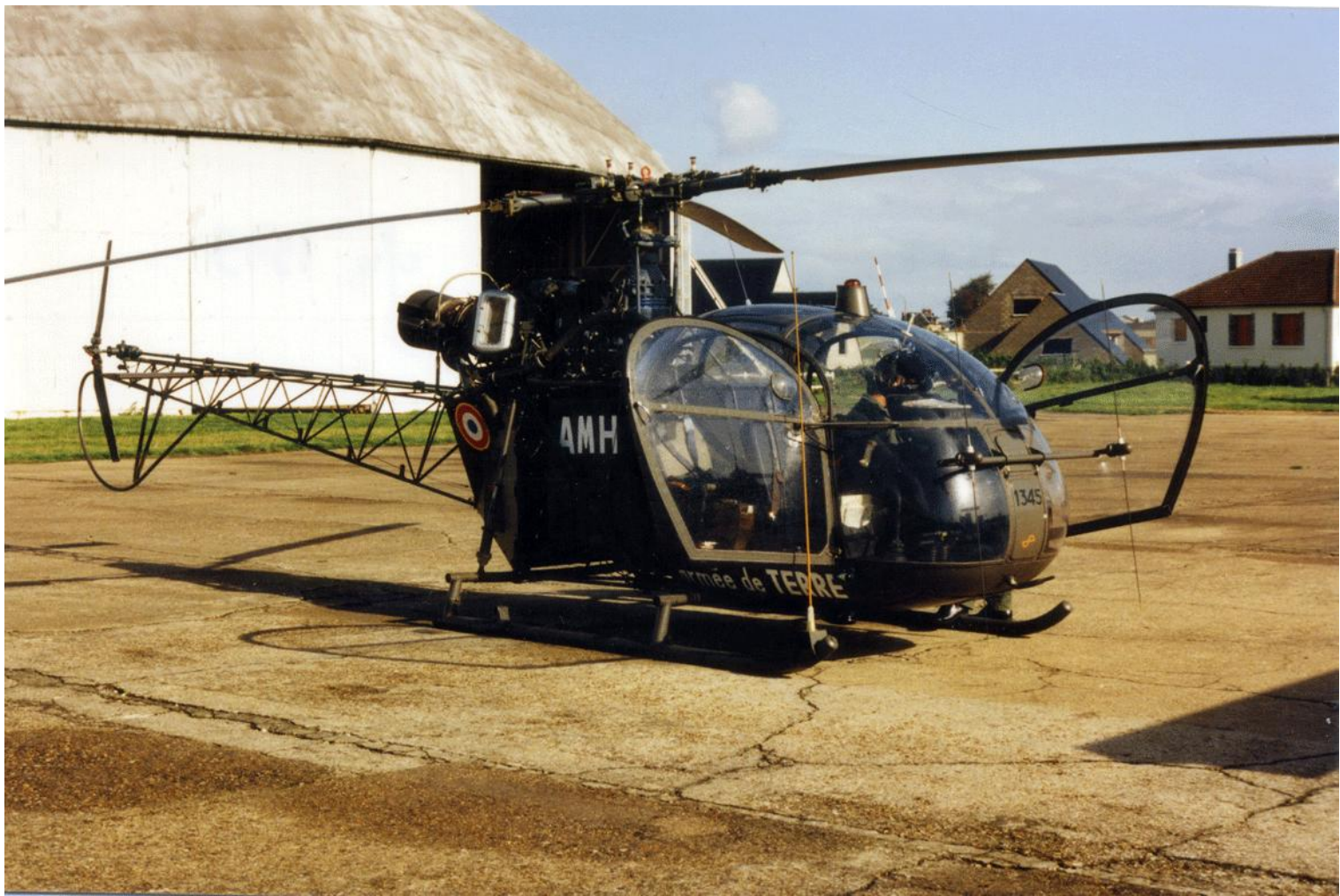
Alouette II n°1345/AMH, du 2 e GHL, le 11 octobre 1983 à Rouen-Boos.