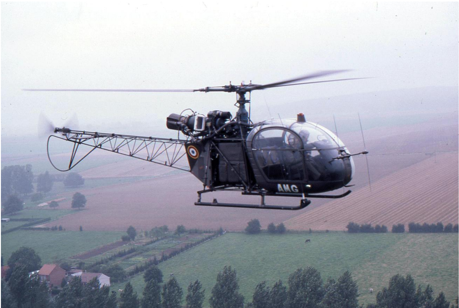
Dans le ciel de Lille-Lesquin, le 10 septembre 1980, l'Alouette II n°1386/AMG du 2 e GHL.