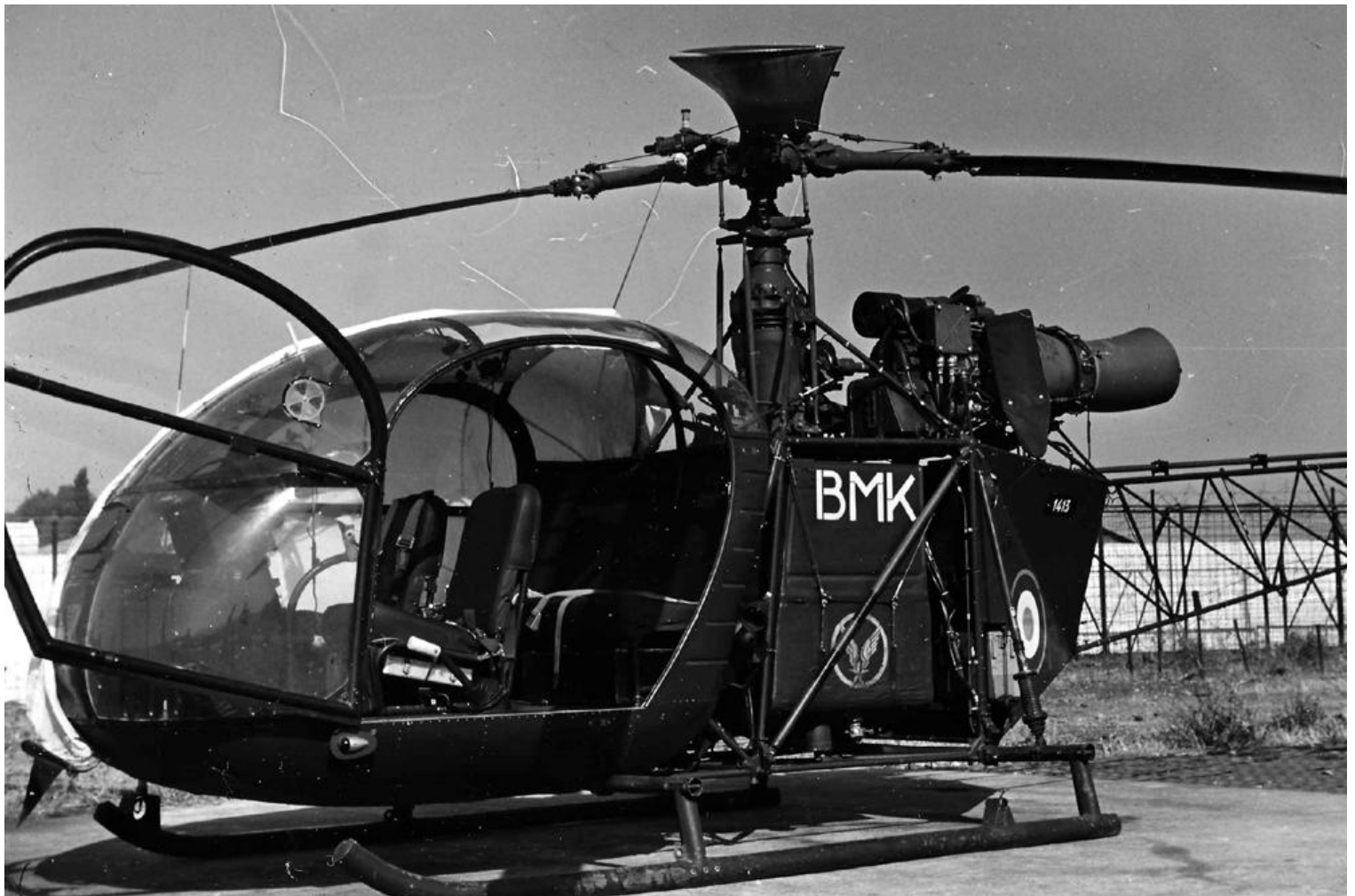
PMAH de la 14 e DI, à Oued-Hamimim en 1961, l'Alouette II n° 1413/BMK.