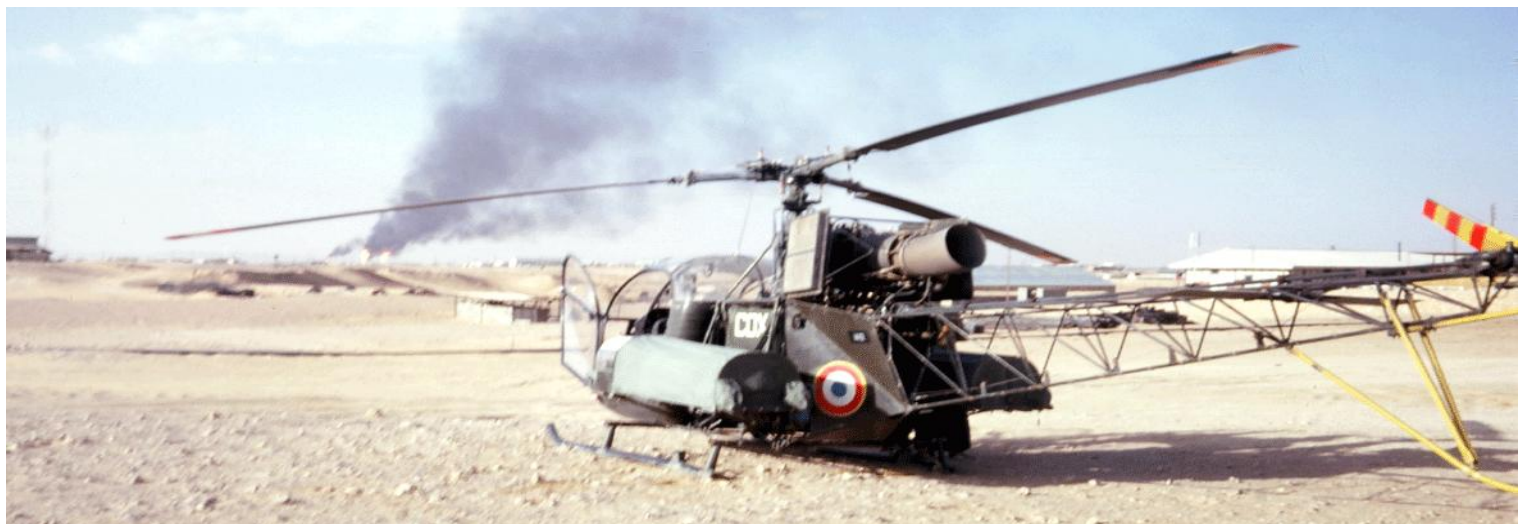
Alouette II n°1412/COX du détachement du 3 e PAZES à Hassi-Messaoud, en juillet 1962. (photo Alain Schlauder).