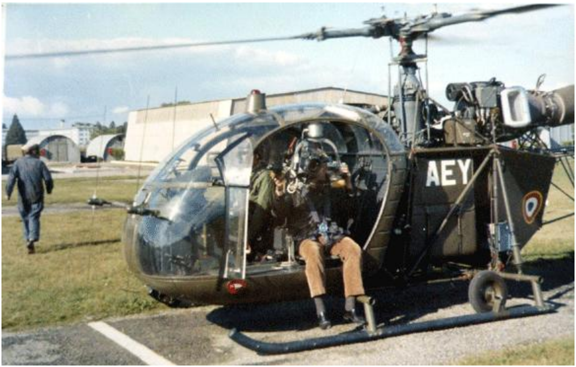
Alouette II n°1359/AEY du 40 e GALAT en 1969 (photo Michel Fouchard).