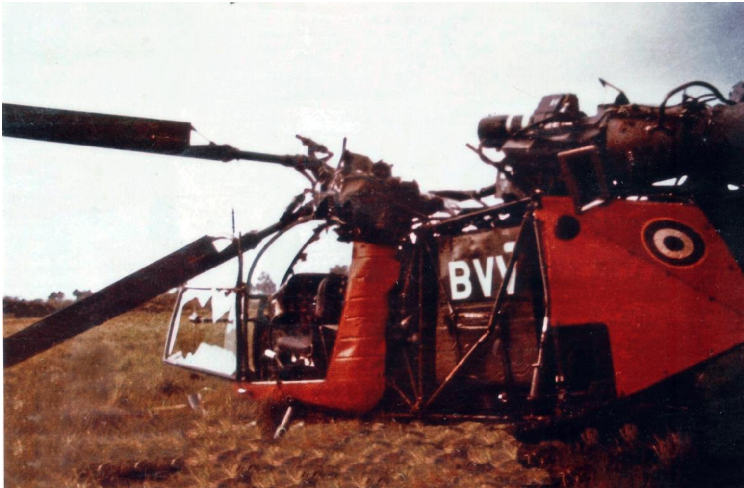
L'Alouette II n°1370/BVV de l'ES.ALAT, après son accident à Peyrehorade, le 3 mai 1974 (photo Hervé Berthou).