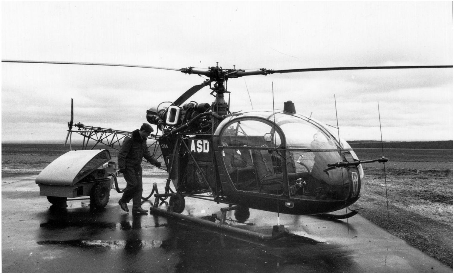
Alouette II n°1384/ASD, du 7 e GALAT, en 1965 à Dijon.