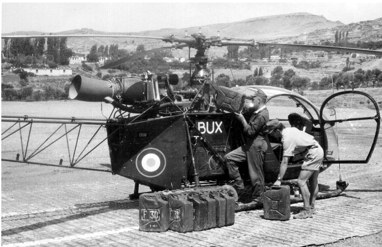
Le plein de F30, tout à la main, pour cette Alouette II n°1386/BUX, du PMAH de la 21 e DI, à Batna en 1960, détachement de Arris.