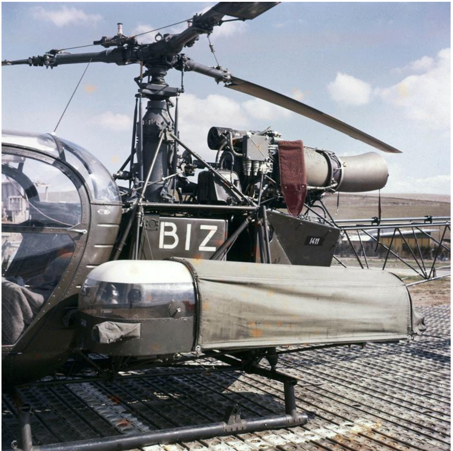
1 er PMAH de la 2 e DIM, détachement de Souk-Ahras en 1960, Alouette II n°1411/BIZ.