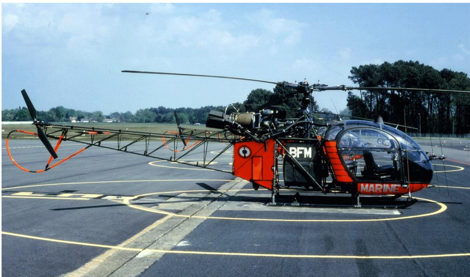
Alouette II n°1343/BFM « MARINE », de l'EA.EALAT Dax, en avril 1997 au Luc.