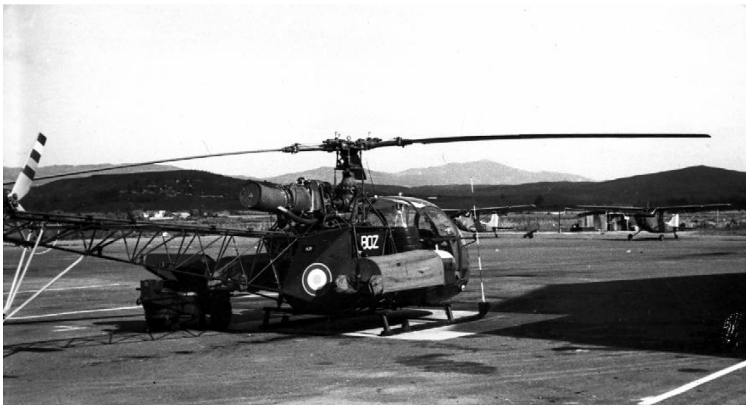
Alouette II n°1429/BQZ du PMAH de la 27 e DIA à Tizi-Orly.