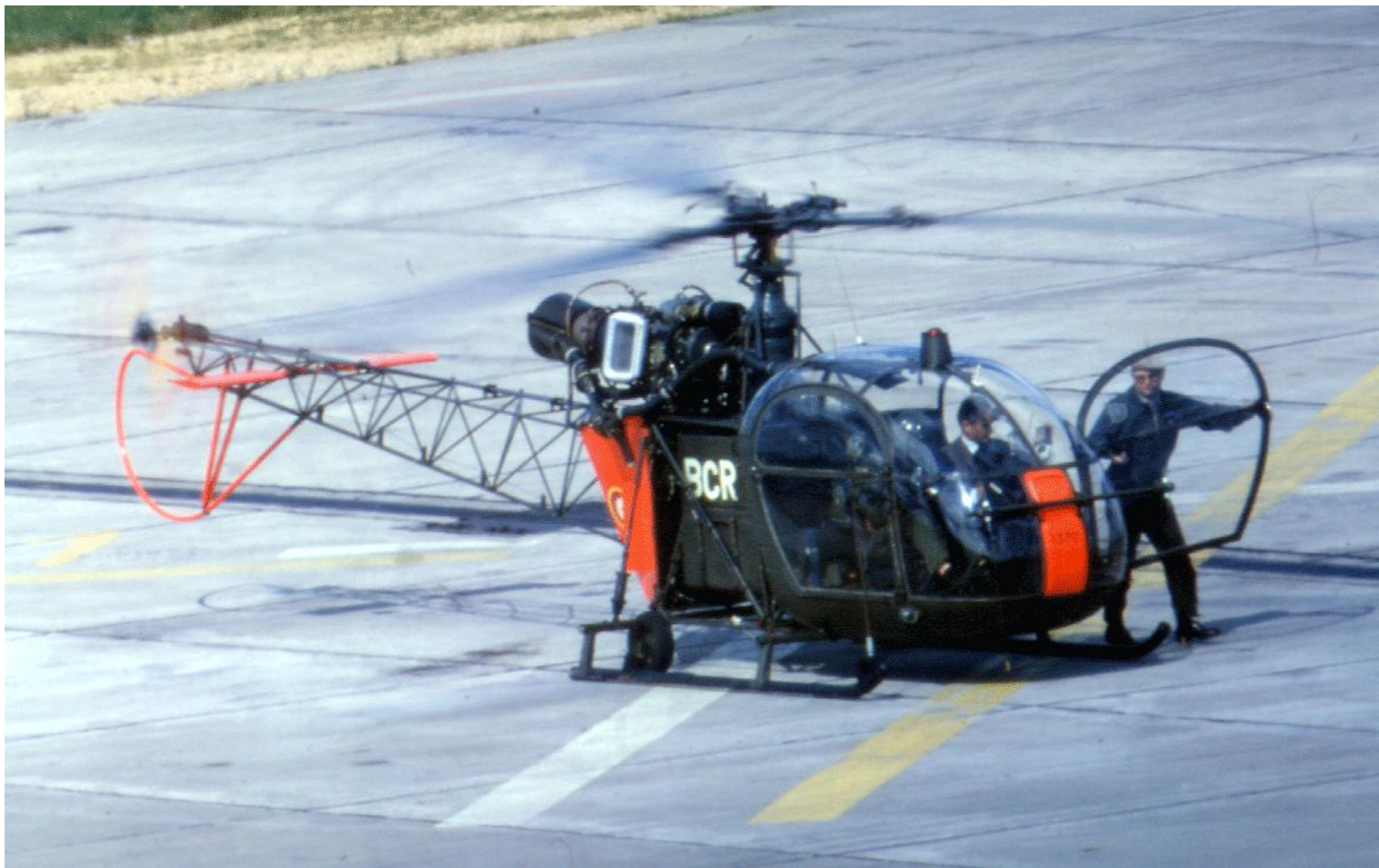
Alouette II n°1370/BCR de l'ES.ALAT, à Mérignac, le 8 juillet 1966.