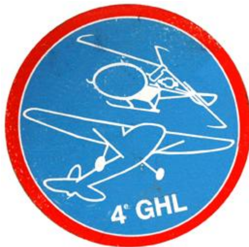
4 e GH