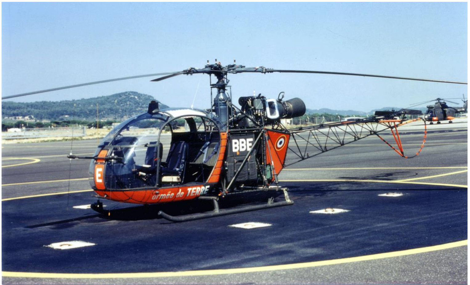
Alouette II n°1412/BBE, de l'EA.ALAT du Luc, en septembre 1995.