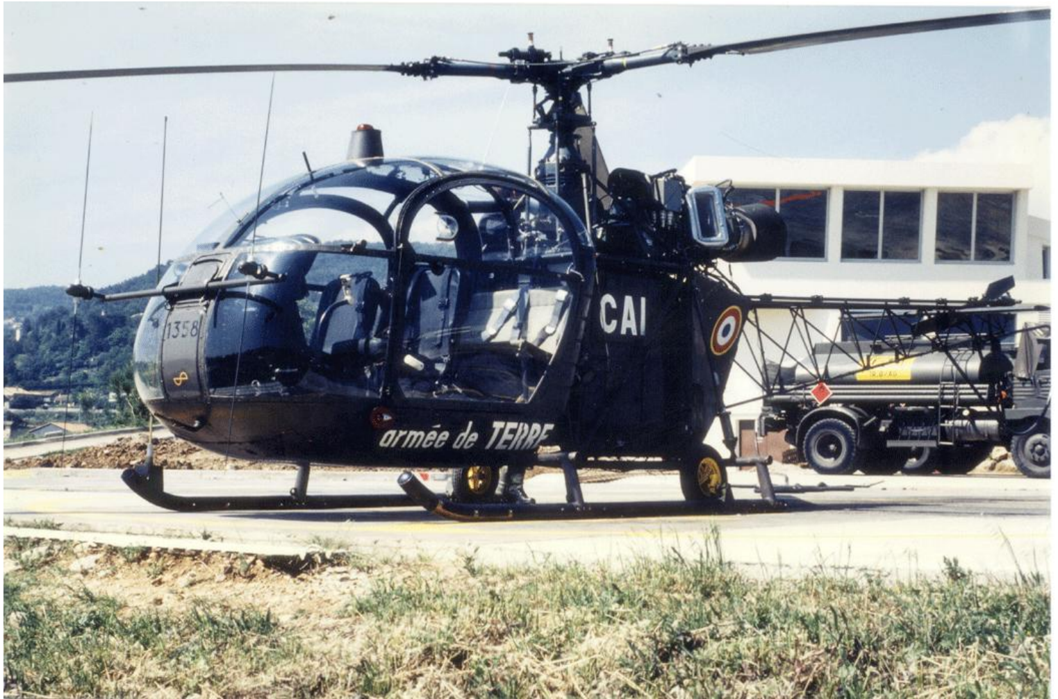
Alouette II n°1358/CAI de l'escadrille ALAT de l'EAA, en juin 1984 à Draguignan.