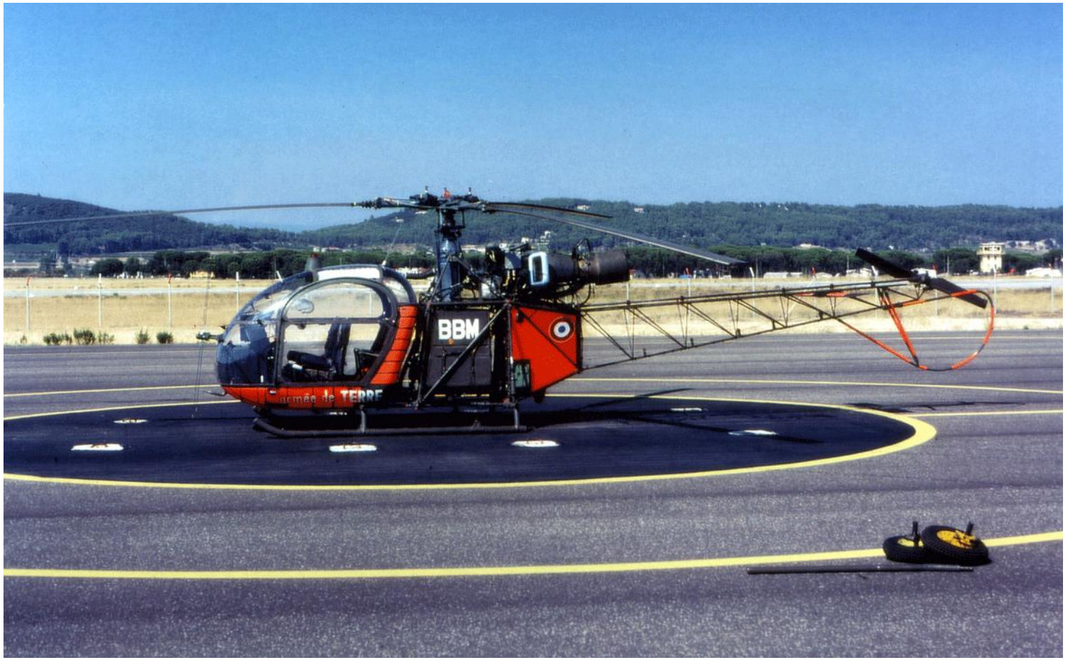
Alouette II n° 1387/BBM, de l'EA.ALAT du Luc en septembre 1985.