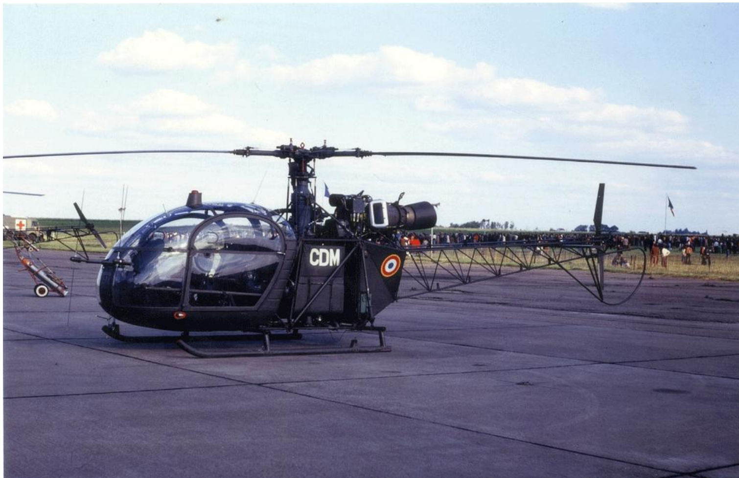
Alouette II n°1371/CDM, de l'escadrille de l'EAT, à Tours en juin 1975.