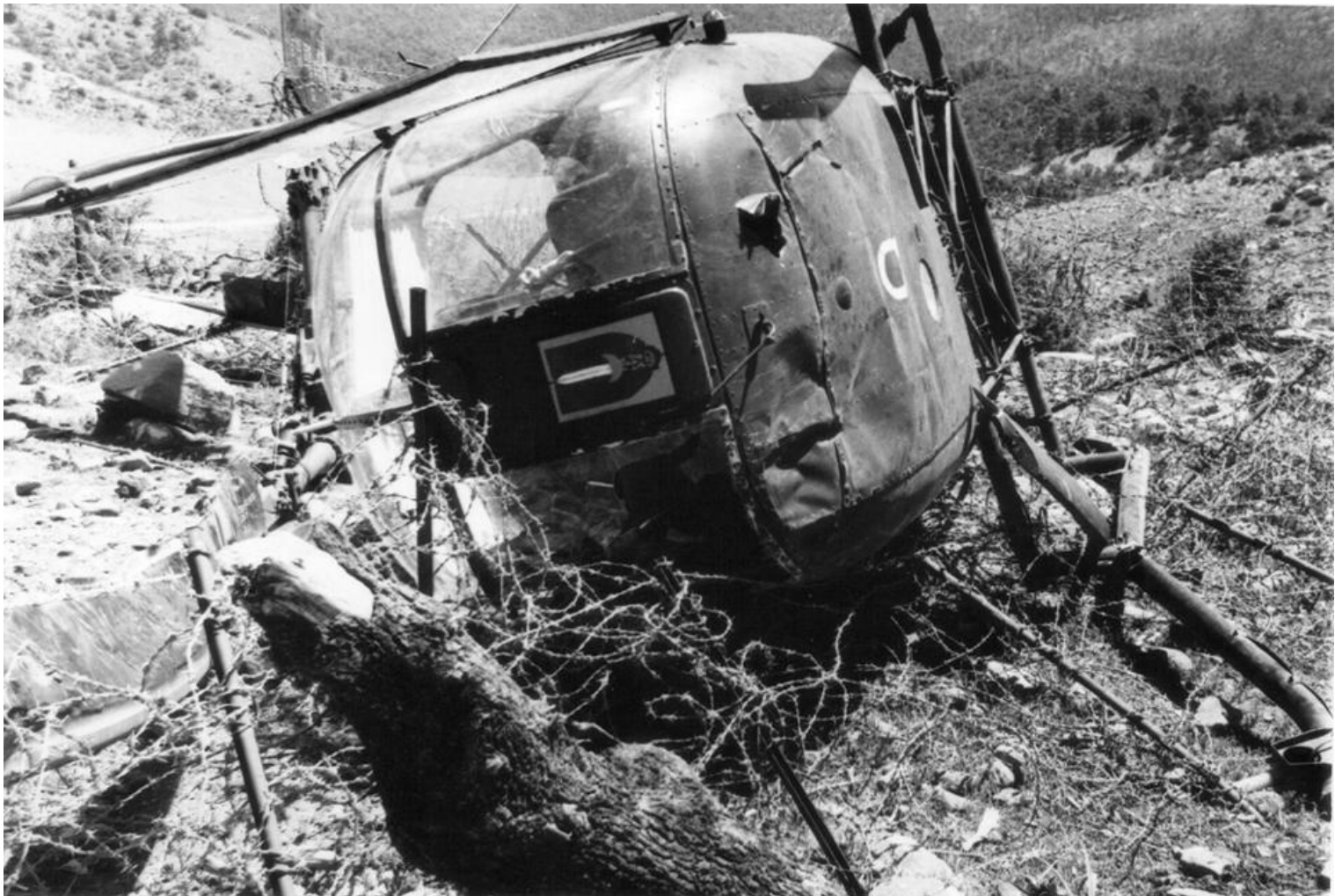
Alouette II n° 1347/BWQ du 2° PMAH/RG, accidentée le 21 mai 1961 près du fort de Gergovie, non loin de Bou-Hamama, dans les Aurès.