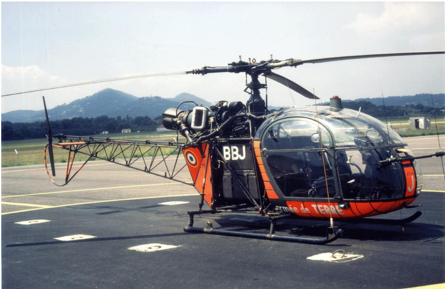
Alouette II n° 1356/BBJ de l'EA.ALAT, au Luc, le 26 mai 1987.