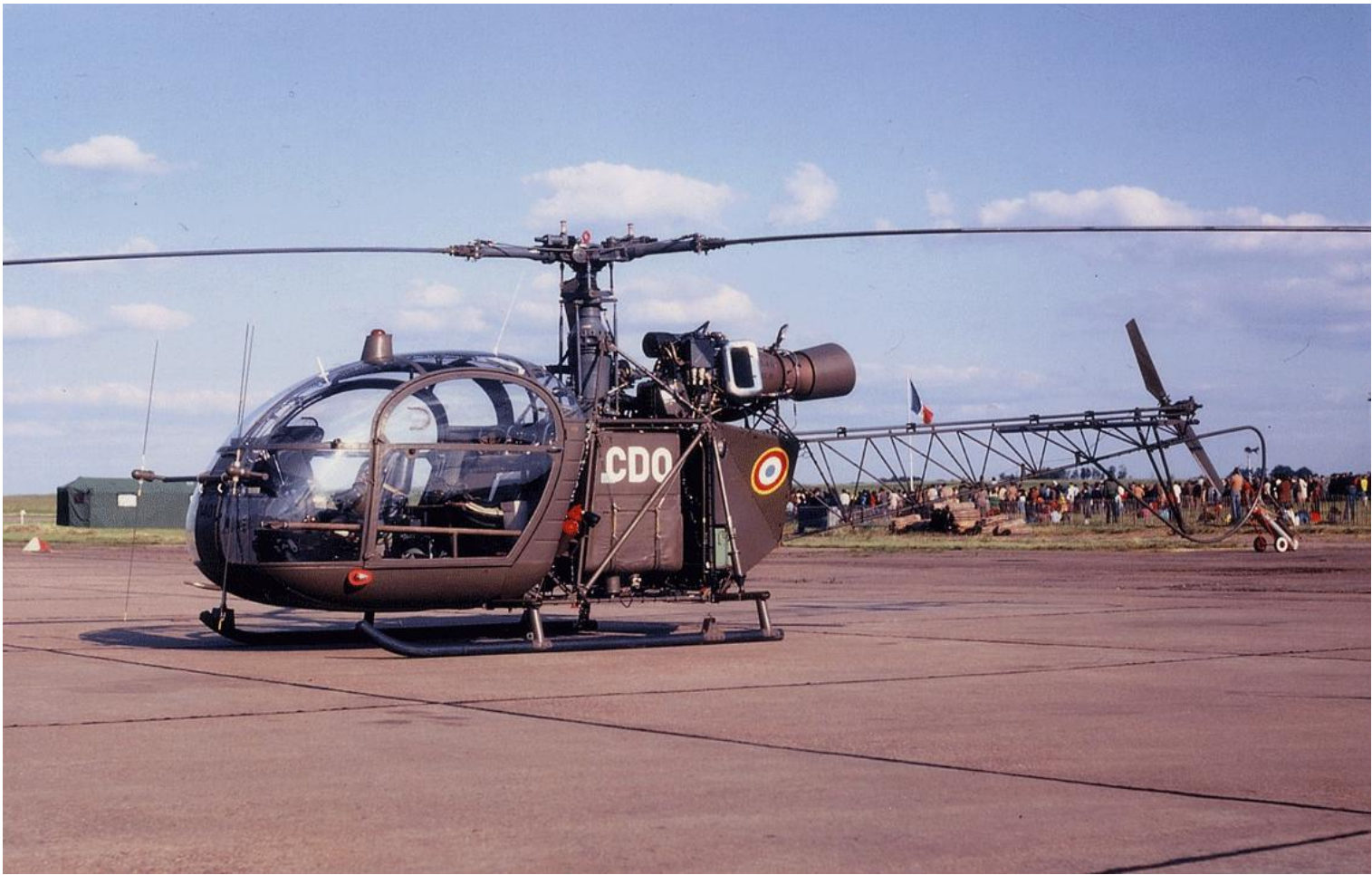
Alouette II n°1401/CDO, de l'E.EAT.