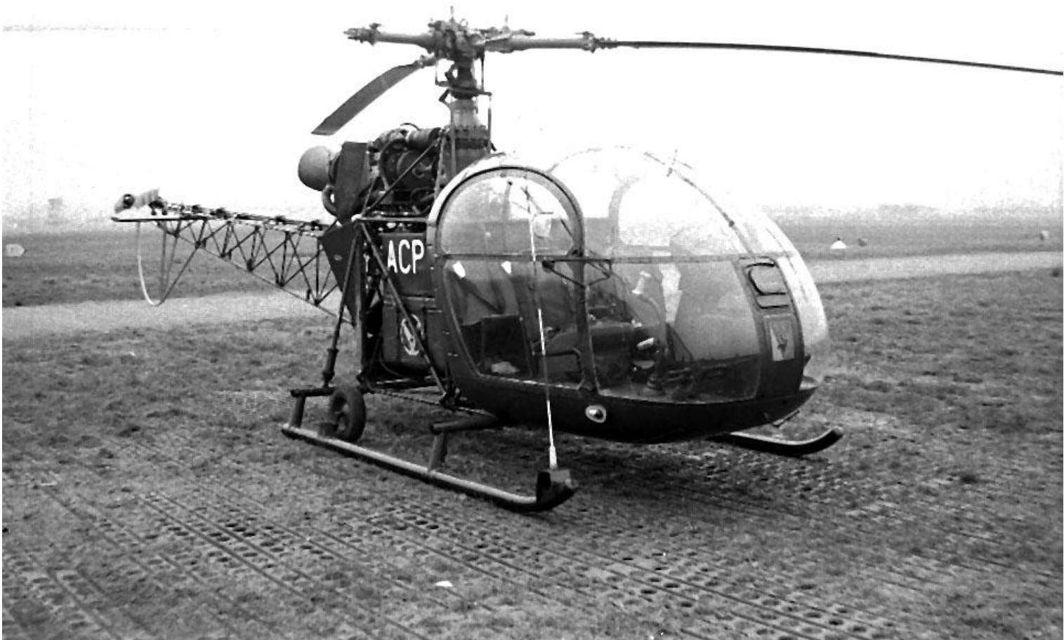
PMAH de la 8 e DI à Essey en avril 1962. Alouette II n°1414/ACP. (photo Georges Engler).