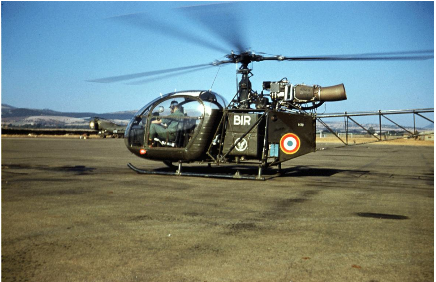
Alouette II n° 1410/BIR, du 1 er PMAH de la 2 e DIM, à Oran La Sénia, début 1963.