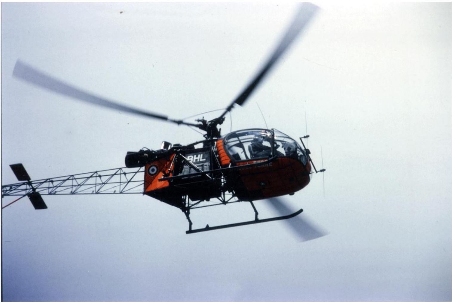
Alouette II n°1427/BHL, de l'ES.ALAT, le 3 août 1987, au Castellet.