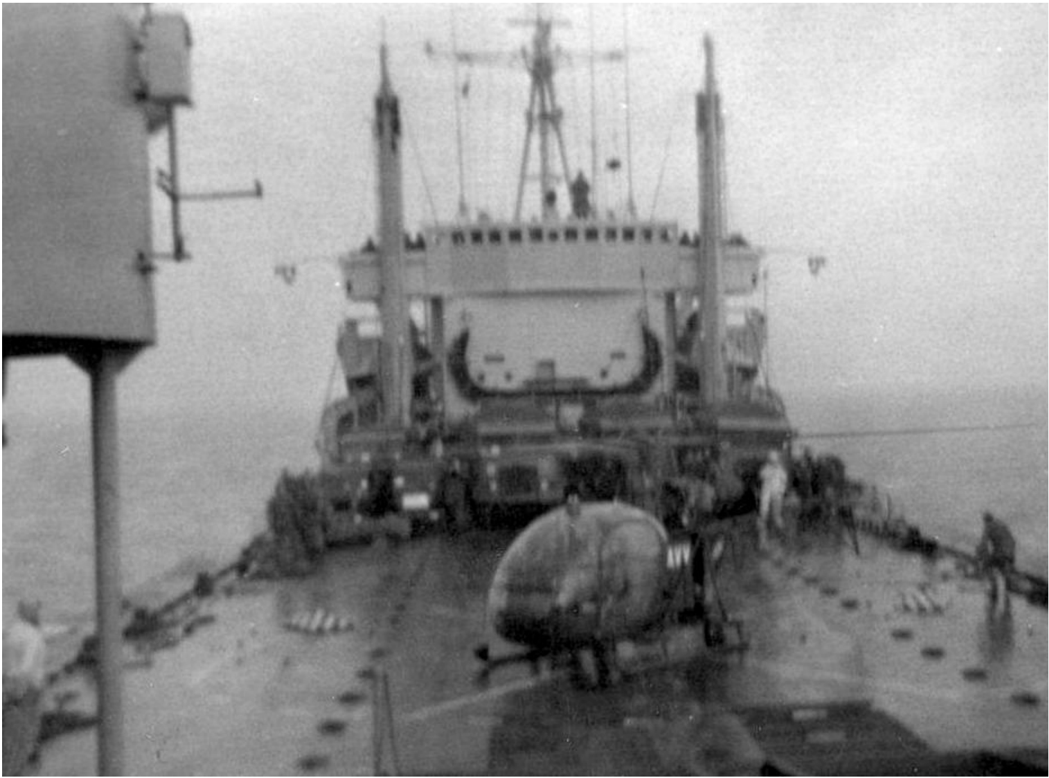
Alouette II n°1400/AVY, de l'EALAT de la 9 e Brigade, sur la Bidassoa le 10 février 1971.