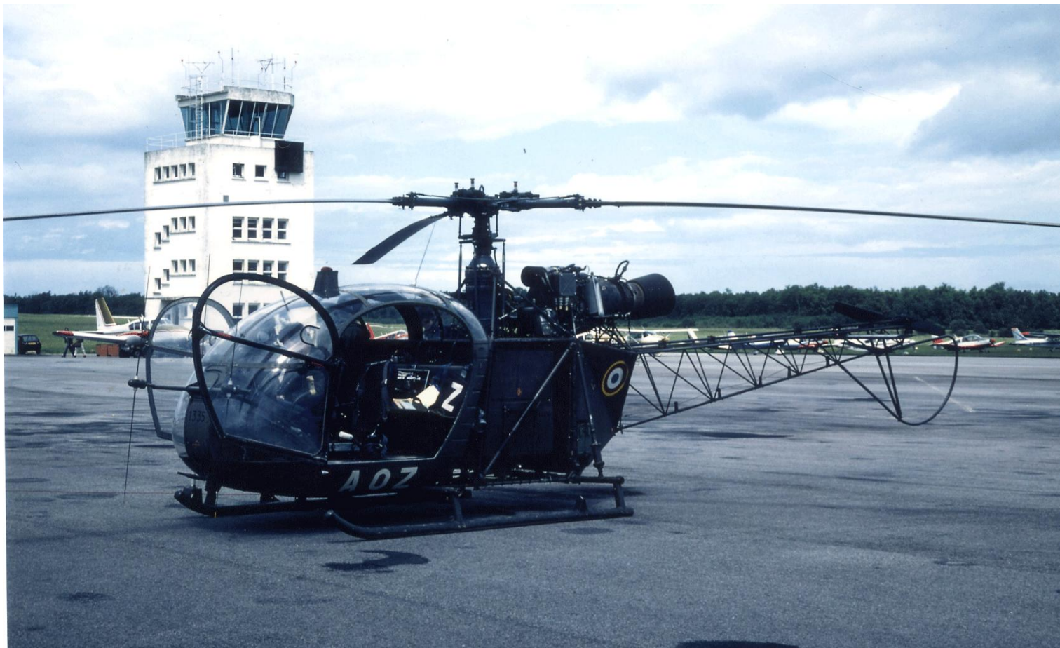
Alouette II n°1335/AOZ, du 11 e GHL, le 24 mai 1981 à Deauville.