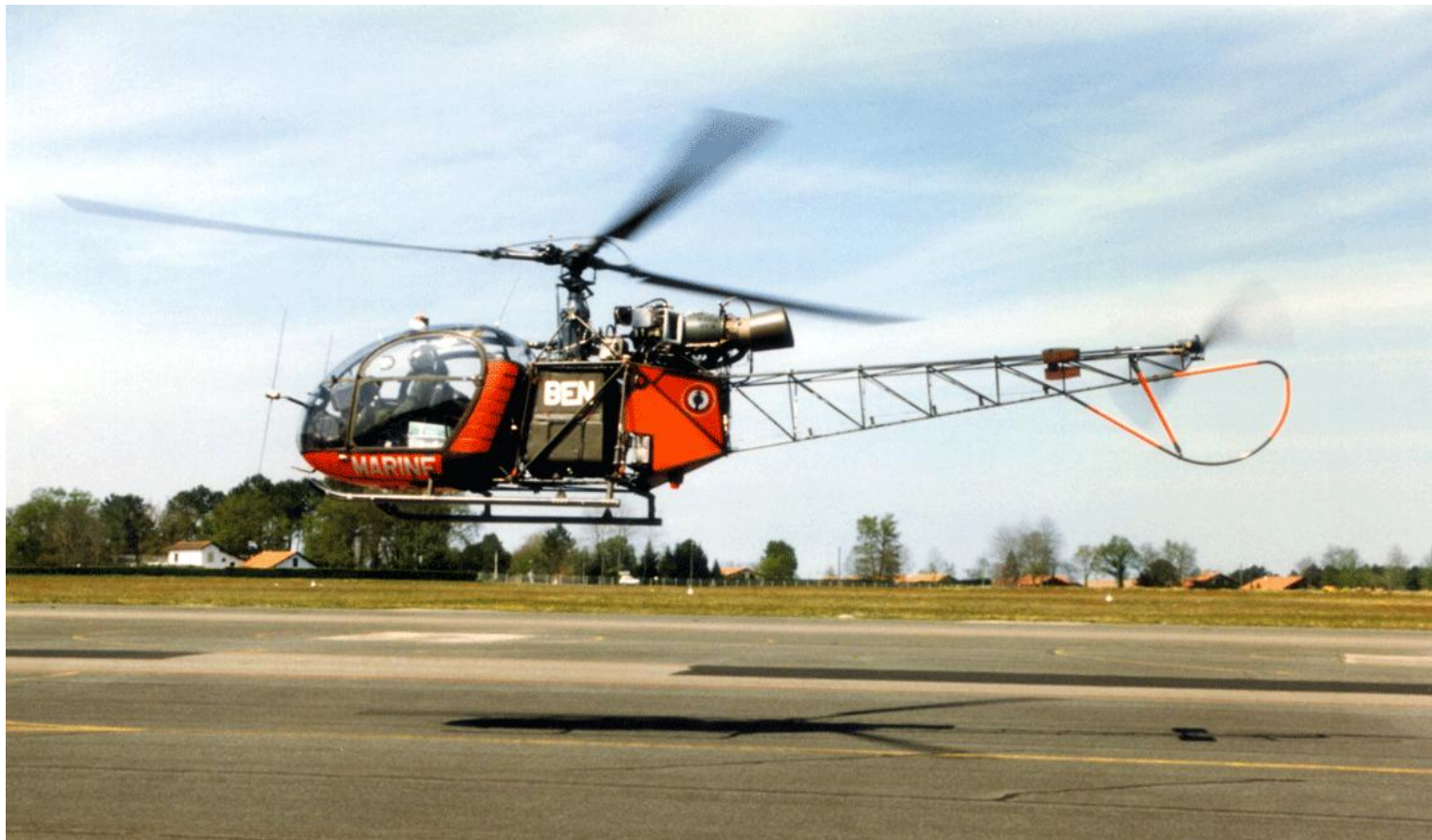
Alouette II n°1382/BEN « MARINE », à Dax, le 12 avril 1996. (photo Christian Malcros).