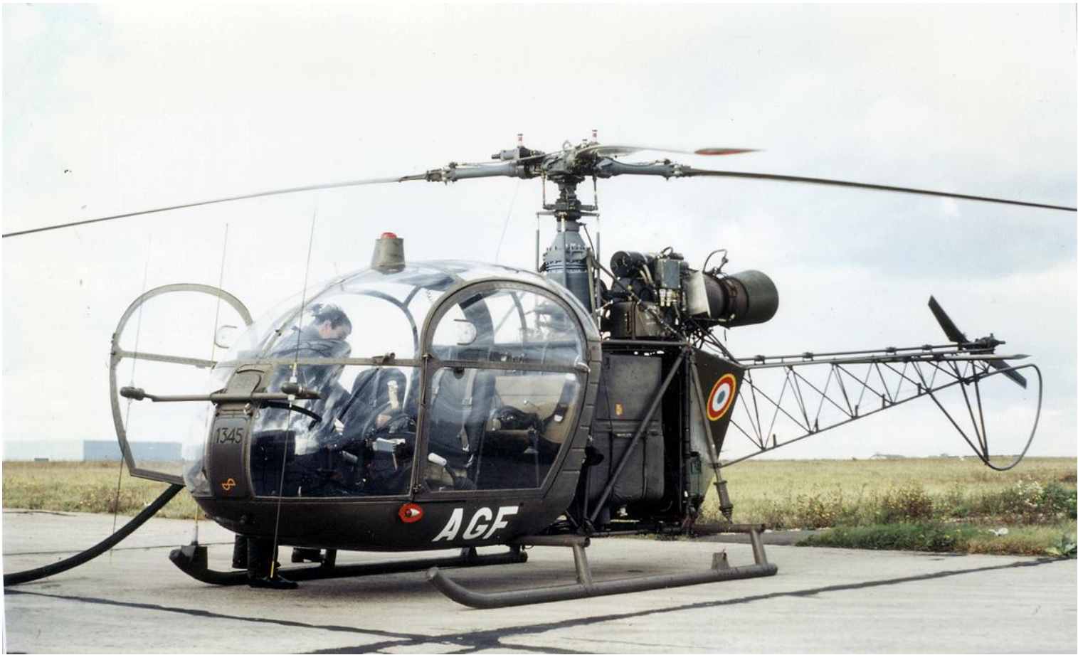
Alouette II n°1345/AGF du 3 e GALREG, le 17 novembre 1977 à Poitiers.