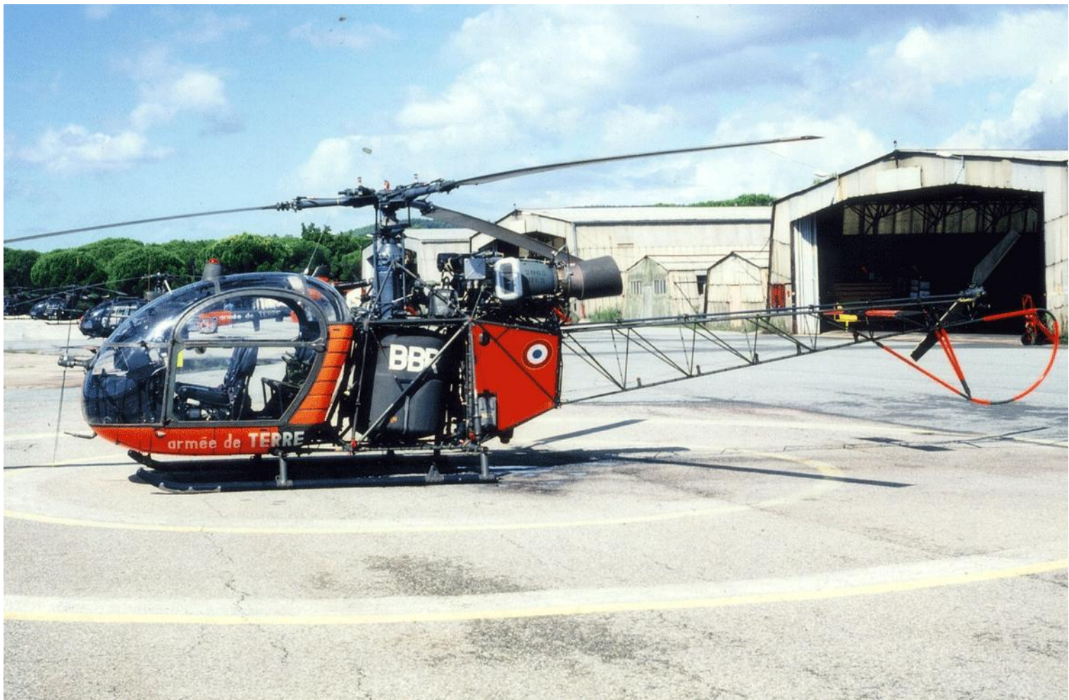
Alouette II n°1346/BBR, de l'EA.ALAT, au Luc, le 24 septembre 1994. (photo X, collection Christian Malcros).