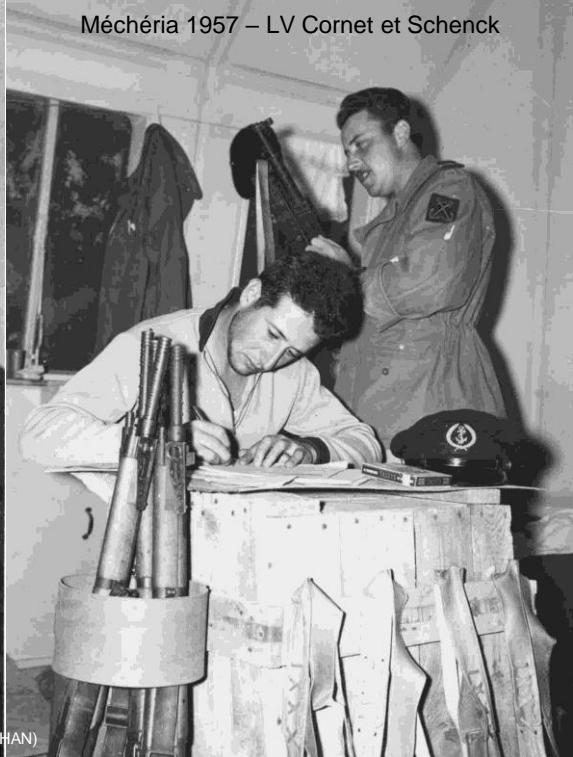
Méchéria 1957 – LV Cornet et Schenck