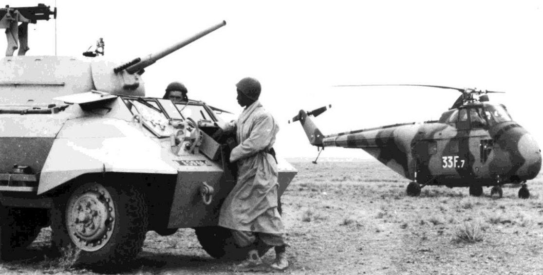
Flottille 33F – H-19 derrière une AMM8