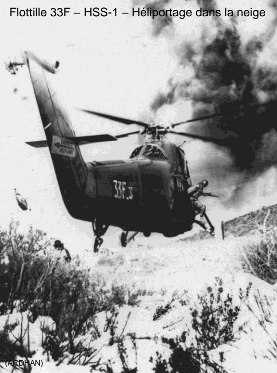
Flottille 33F – HSS-1 – Hélicoptage dans la neige