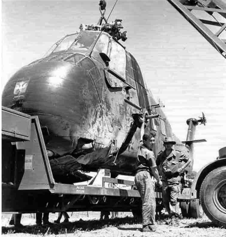
Flottille 33F Récupération d'un HSS-1 accidenté