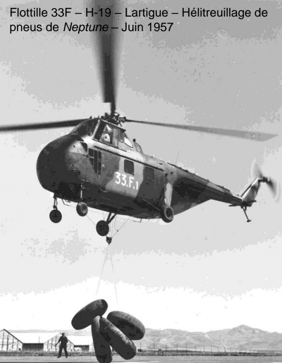
Flottille 33F – H-19 – Lartigue – Hélicoptère de Neptune – Juin 1957