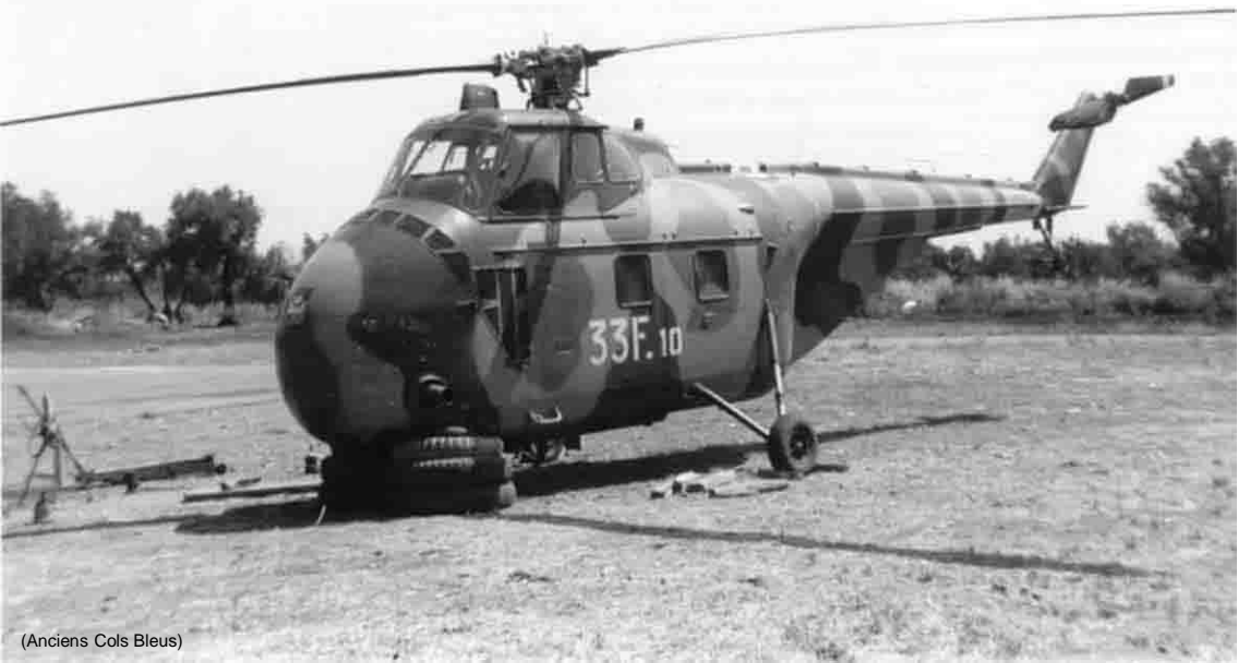
(Anciens Cols Bleus)