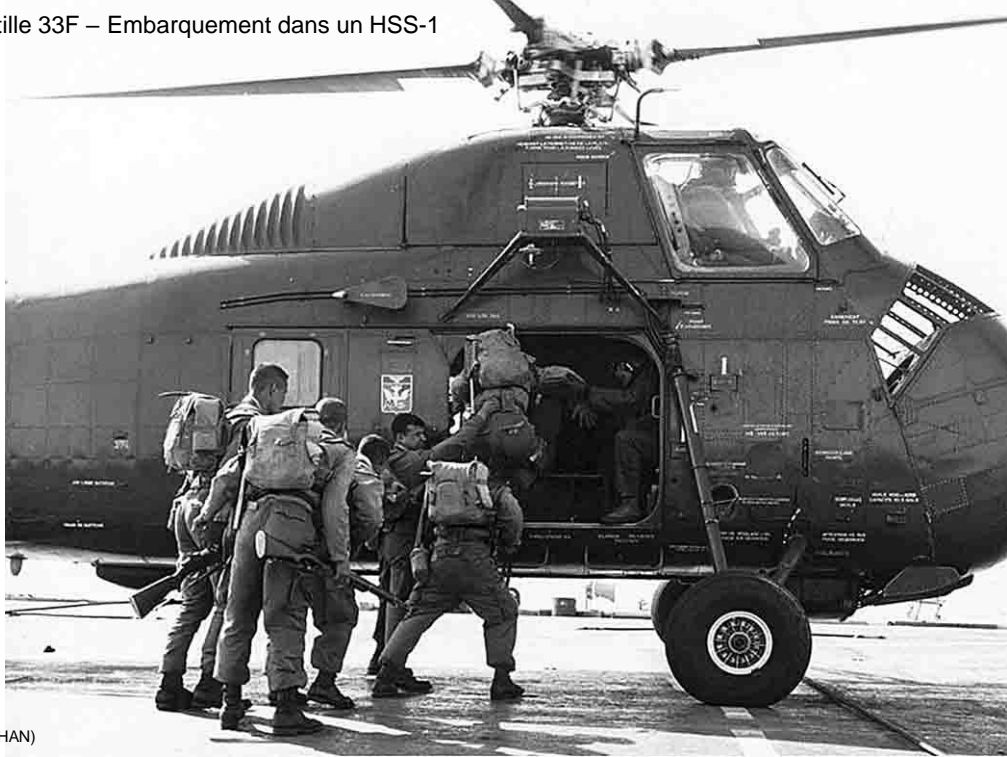
Flottille 33F – Embarquement dans un HSS-1