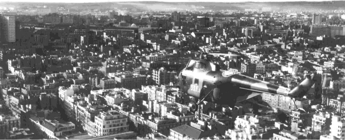
Flottille 33F – H-19 sur Oran, le 11 novembre 1957