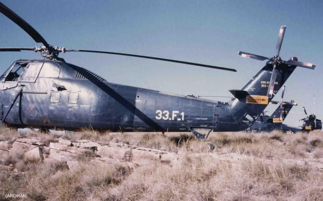
Flottille 33F – HSS-1