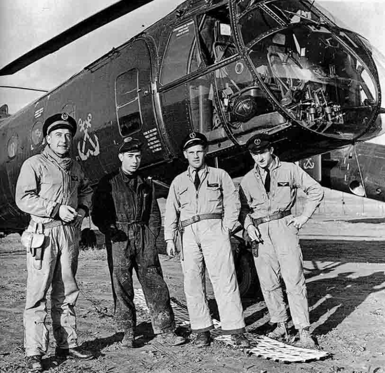
Flottille 31F 31 décembre 1957 Equipage du LV Beau