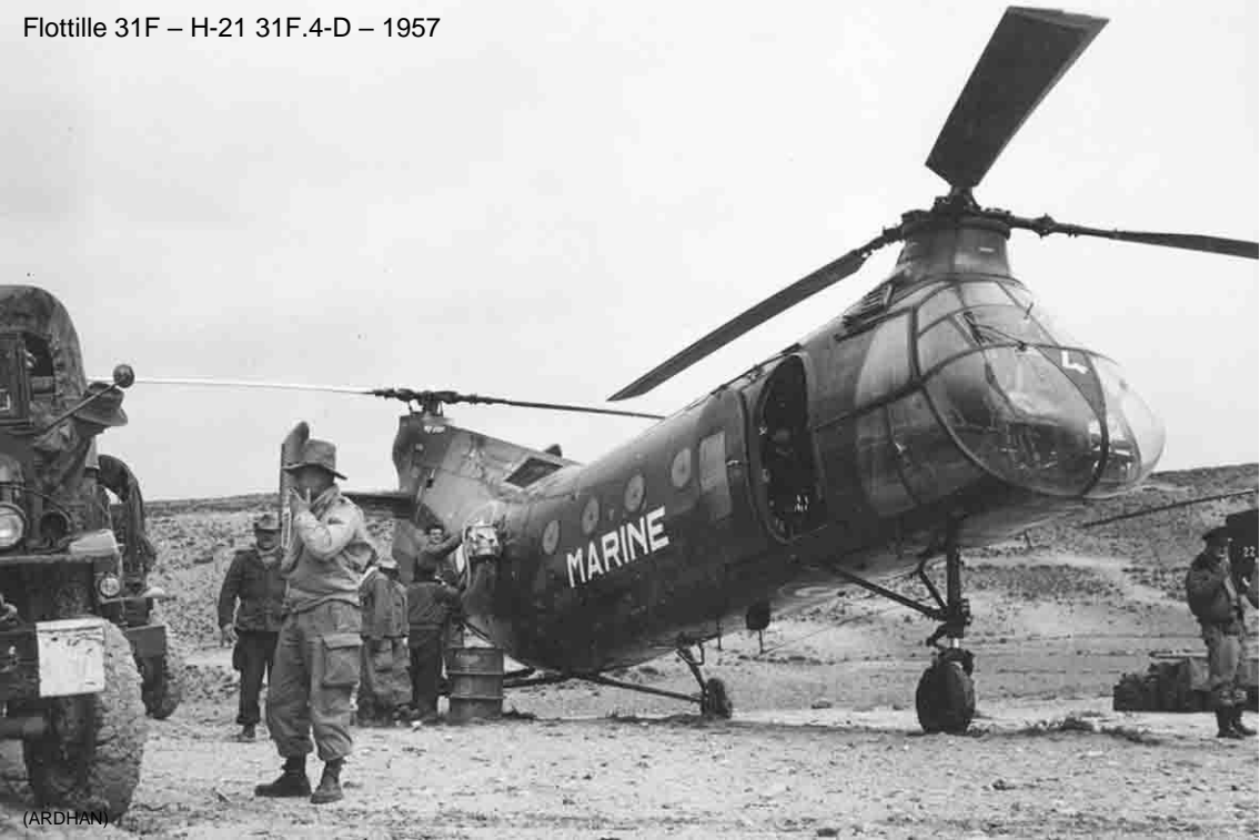
Flottille 31F – H-21 31F.4-D – 1957