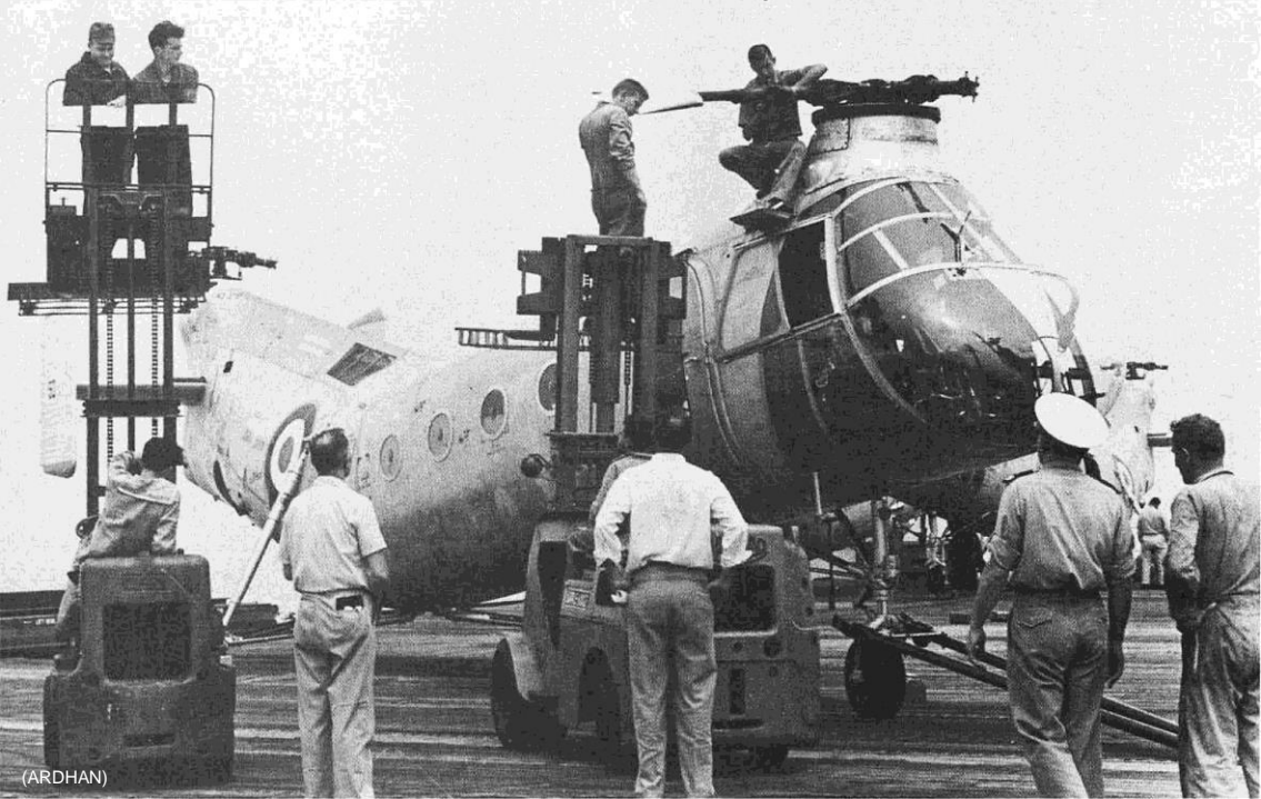
Flottille 31F – Juin 1956 – Sur le Dixmude , arrivée à Alger des premiers H-21 de l'ALAT