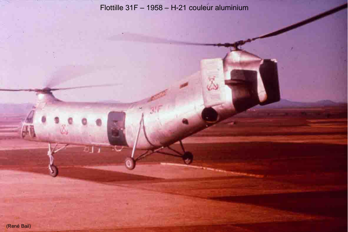
Flottille 31F – 1958 – H-21 couleur aluminium