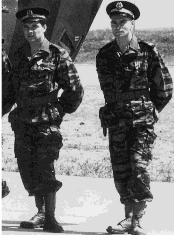
Flottille 31F EV Baudouin et LV Castaignos morts le 17 janvier 1961