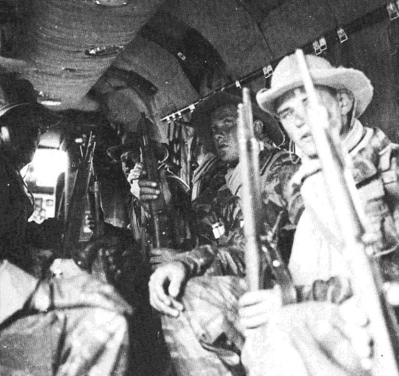
Flottille 31F Légionnaires du 1 er REP