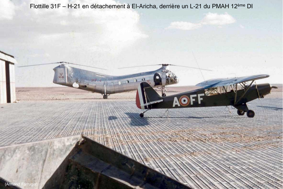
Flottille 31F – H-21 en détachement à El-Aricha, derrière un L-21 du PMAH 12 ème DI