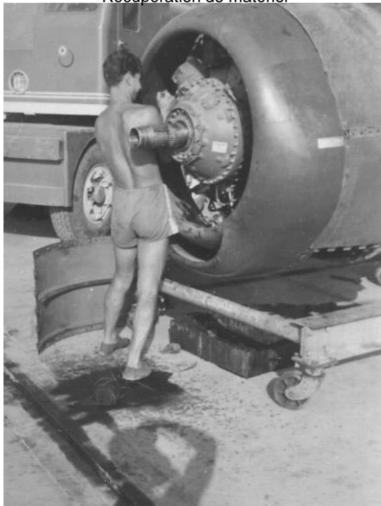
Récupération de matériel