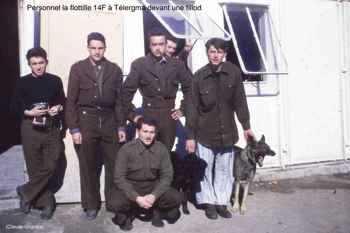
Personnel la flottille 14F à Télérgma devant une fillod