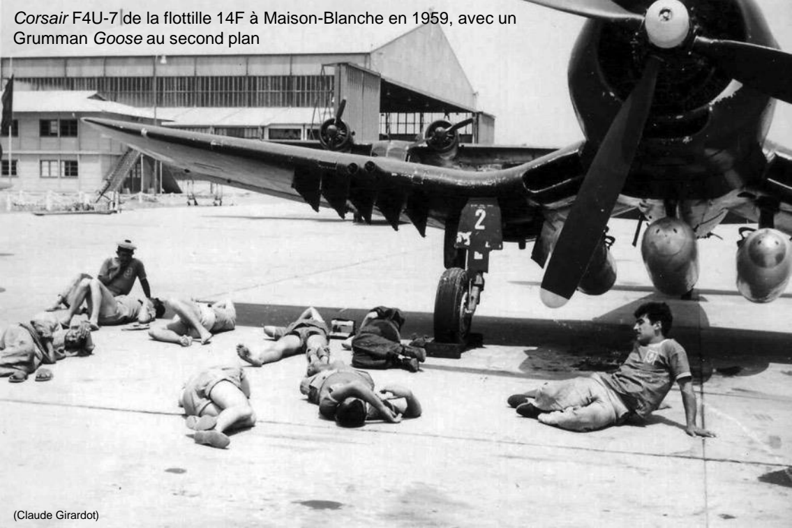
Corsair F4U-7 de la flottille 14F à Maison-Blanche en 1959, avec un Grumman Goose au second plan