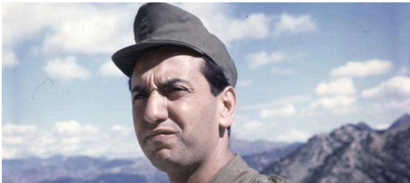
Hocine Aït Ahmed reconnaissait le rôle positif de la colonisation.

Nous n'allons pas écrire ici la biographie d'Hocine Aït Ahmed, l'un des chefs historiques (ce qu'il refusait d'être) du FLN et de l'indépendance algérienne. Cette figure emblématique de la révolution algérienne est décédée le 23 décembre en Suisse, à l'âge de 89 ans. Il sera enterré ce prochain vendredi 1er janvier 2016 à Aïn El Hammam (wilaya de Tizi Ouzou).