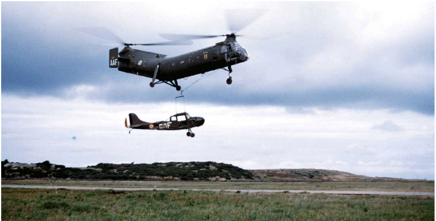
FR75/AAF du GH N°2 en décembre 1958, avec un L-19E du PA de la 14 e DI.

56-2059 15/04/58 marché n° 6327/56 09/06/58 départ de Norfolk sur le transport d'aviation "Dixmude" (RFM n°134) 09/06/58 arrivée à Alger par le transport d'aviation "Dixmude" 09/06/58 GH N°2 AAF 05/01/61 IRAN AIA Maison Blanche avec 903 heures 02/05/61 GH N°2 AAF 31/01/63 14° GALAT AAF 01/05/64 port dr Meknès attente embarquement 03/05/64 retour métropole à Marseille par cargo "Ville de Marseille" 03/05/64 GALAT 14 25/09/64 ERGM Verqailles 11/09/64 OMP préparation IRAN 29/09/64 IRAN Héli Service Marignane avec 793 heures 29/01/65 ERGM Montauban attente convoyage PHC/CEMO ../../65 retour rn Algérie 08/06/65 PHC/CEMO 10/02/65 OMP BEG 25/06/64 stockage jusqu'au 25/09/64 30/08/65 PHC/CEMO BEG 30/06/65 échange GMP 09/02/67 PMAH CB 25/11/66 OMP BEG 18/04/67 PMAH CB 18/04/67 OMP BEG 30/05/67 réformé avec à 299 heures de vol ../05/67 détruit sur place à Colomb Béchar