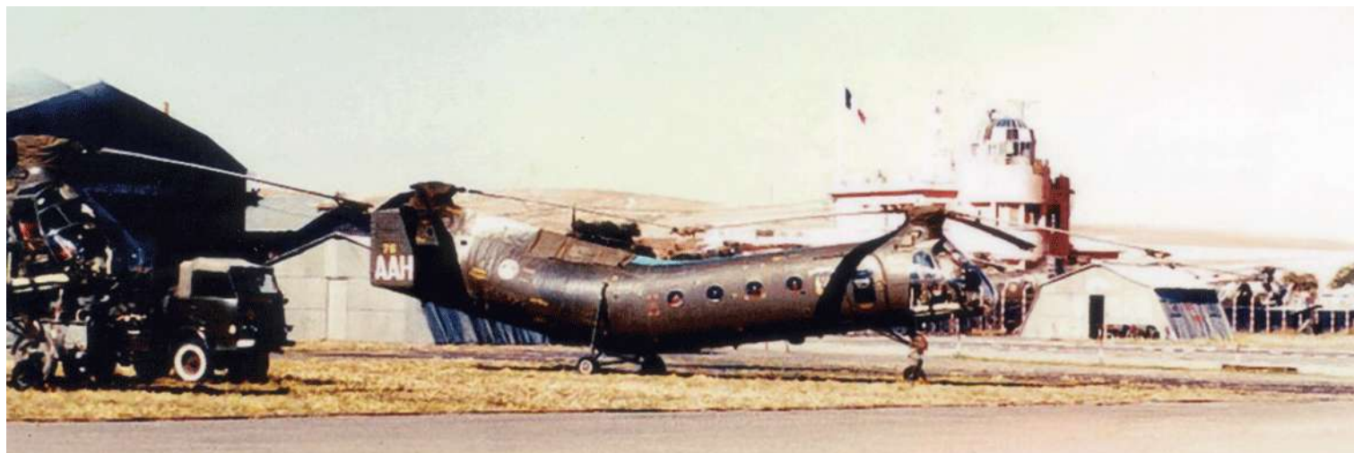
FR76/AAH du GH N°2, à Sétif (photo X, collection Christian Malcros).

FR76 C222 marché n° 6327/56 56-2060 15/04/58 départ de Norfolk sur le transport d'aviation "Dixmude" (RFM n°134) 09/06/58 arrivée à Alger par le transport d'aviation "Dixmude" 09/06/58 GH N°2 AAH 15/02/61 IRAN AIA Maison Blanche avec 882 heures 31/05/61 GH N°2 AAH dégagement de fumée à l'arrière de l'appareil suite à une rupture de cylindre. La machine se repose immédiatement. 20/06/61 accidenté en RX01 F55, en Algérie. Au décollage il se produit un important 31/01/63 14° GALAT AAH ../04/63 retour métropole par voie aérienne Oran, Valencia, Perpignan et Carcassonne ../04/63 ES.ALAT 01/04/63 OMP ../01/64 EA.ALAT 19/12/63 OMP 20/01/64 ERGM Montauban VP 600 26/02/64 EA.ALAT 15/10/64 ERM Versailles 11/09/64 OMP attente IRAN 15/10/64 IRAN Héli Service Marignane avec 702 heures 15/03/65 MC Montauban 12/03/65 OMP stockage 05/06/65 GALAT 14 12/06/67 ERGM Bruz 23/05/67 OMP VP 300 07/07/67 MC Montauban 05/07/67 OMP stockage 25/04/68 3° GALAT 26/06/69 ERGM Bruz 16/06/69 OMP stockée 25/03/70 01/07/70 retiré situation mensuelle 29/07/70 réformé avec 595 heures de vol 17/04/70 DM n° 16318 DCMAT/ALAT/1 pour mise en place par l'ERGM de Bruz de la cellule de l'appareil au 39° RI à Rouen.