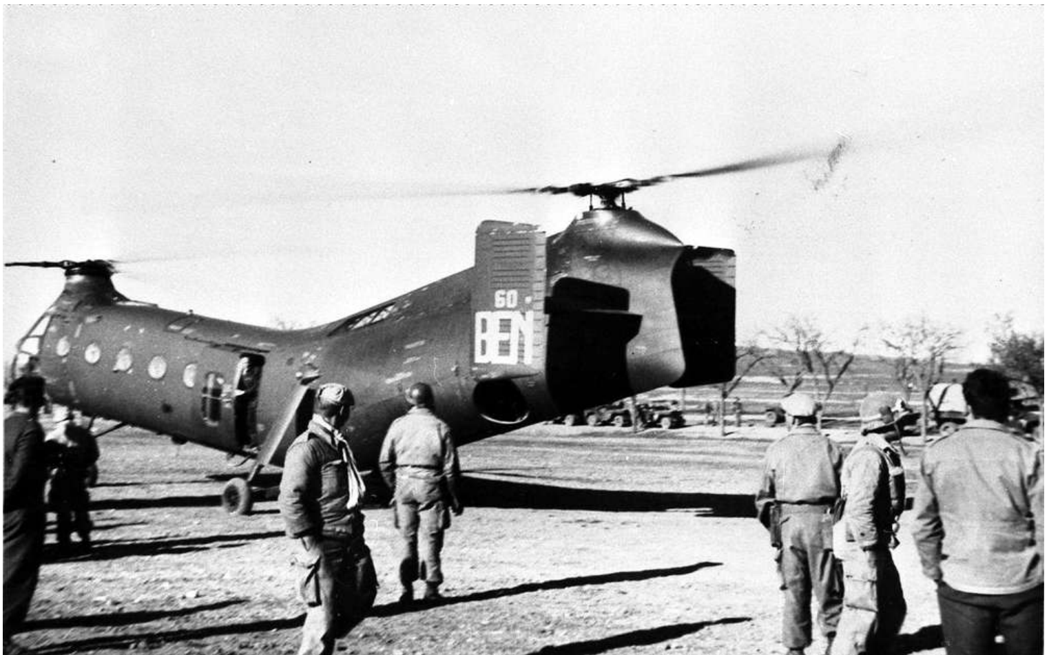
FR60/BEN du GH N°2.

FR60 C206 marché n° 6327/56 56-2044 01/10/57 départ de Norfolk sur le transport d'aviation "Dixmude" (RFM n°239) 08/11/57 arrivée à Alger par le transport d'aviation "Dixmude" 08/11/57 GH N°2 BEN 19/06/60 Au cours d'une séance d'autorotation, la queue de l'appareil heurte le sol. Jack arraché, déchirure de la cellule. 19/06/60 CRALAT 4 e échelon 20/06/60 IRAN AIA Maison Blanche avec 895 heures 30/11/60 GH N°2 BEN 08/06/62 endommagé par un orage de grêle à Khenchela. GH N°2 BEN 01/02/63 14 e GALAT BEN ../10/63 retour métropole pour IRAN via Oran, Valencia et Perpignan 21/10/63 ERM Versailles attente IRAN 02/12/63 IRAN Héli Service Marignane avec 675 heures 18/03/64 GE .ALAT 23/03/64 OMP BST 15/02/65 ERM Versailles travaux divers 19/03/65 GE .ALAT BST 00/09/65 ESAM 02/08/65 OMP MDL 25/01/66 ESAM Bourges tôlerie 22/03/66 ESAM MDL 06/06/66 ERM Valence version 8 radio 22/09/66 ESAM MDL 18/08/67 ESAM Bourges VP 450 heures + échange cylindres 4 et 5 22/09/67 ESAM MDL 15/11/67 ERGM Montauban tôlerie 05/12/67 ESAM MDL 12/02/68 ERGM Montauban VP 100 heures + échange GMP 12/03/68 ESAM MDL 18/09/69 ERGM Bruz 12/09/69 OMP stockage 01/07/70 retiré situation mensuelle 29/07/70 réformé avec 2167 heures de vol 17/04/70 DM n° 16318 DCMAT/ALAT/1 pour mise en place par l'ERGM de Bruz de la cellule de l'appareil au 41 e RI à Rennes