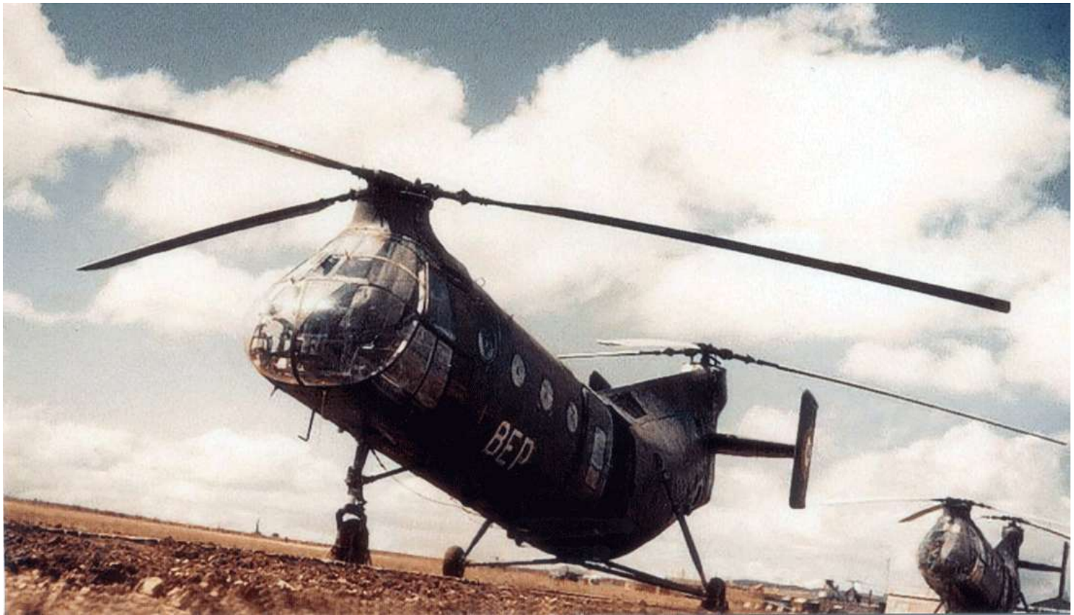
FR62/BEP du GH N°2.

56-2046 01/10/57 marché n° 6327/56 08/11/57 départ de Norfolk sur le transport d'aviation "Dixmude" (RFM n°239) 08/11/57 arrivée à Alger par le transport d'aviation "Dixmude" 08/11/57 GH N°2 BEP 31/12/59 accidenté. Au cours d'un posé, un rocher caché par l'herbe provoque la rupture du fitting droit. Reversé à Héli-Service à Alger. 31/12/59 rapatriement + attente 10/03/60 Héli Service Maison Blanche 4 e échelon après accident 29/04/60 AIA Maison Blanche attente IRAN 06/05/60 IRAN AIA Maison Blanche avec 588 heures 02/09/60 GH N°2 BEP 17/12/62 accidenté à In Amguel. En fin de mission l'appareil rejoint son terrain lorsqu'il se produit une panne du GMP. L'équipage réussit à poser la machine en autorotation mais un incendie important se déclare suite à l'éclatement du cylindre n°5, maîtrisé par le pilote puis par les pompiers de la base. 31/01/63 14° GALAT BEP ../07/63 retour métropole nia Oran, Valencia et Perpignan ;:;:07/63 ERM Versailles 19/06/63 OMP attente IRAN 25/07/63 IRAN Héli Service Marignane avec 777 heures 08/12/63 MC Montauban 10/12/63 OMP stockage 15/06/64 GALAT 14 10/06/64 OMP 24/08/65 ERM Valence 05/08/65 OMP stockage 17/05/68 réformé avec 1585 heures de vol 17/05/68 vendu aux ferrailleurs par décision 115/ALAT DRM5J pour la somme de 1 502 471 francs (7 497 330 en 1990)