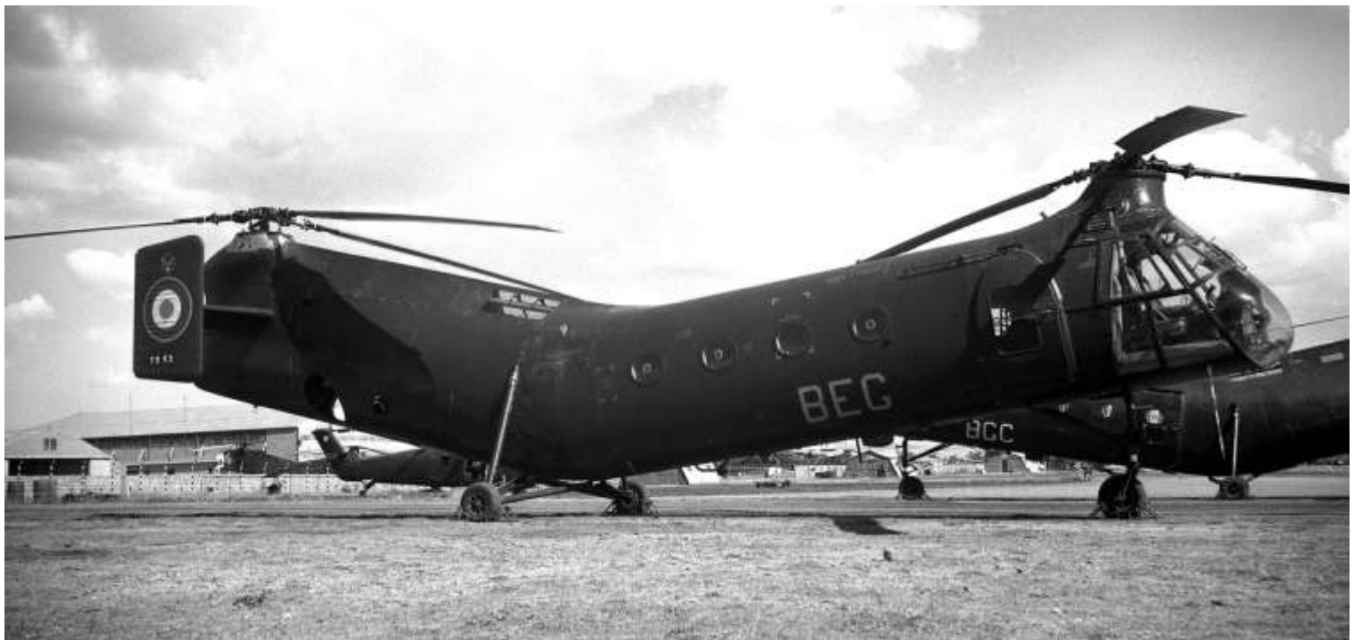
FR53/BEG du GH N°2, le 16 octobre 1961, à Sétif.