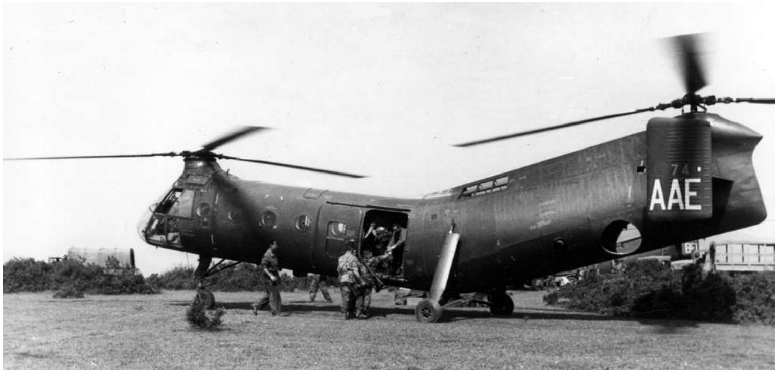
FR74/AAE du GH N°2, le 18 mai 1959, en opération à Hammam-Meskoutine.