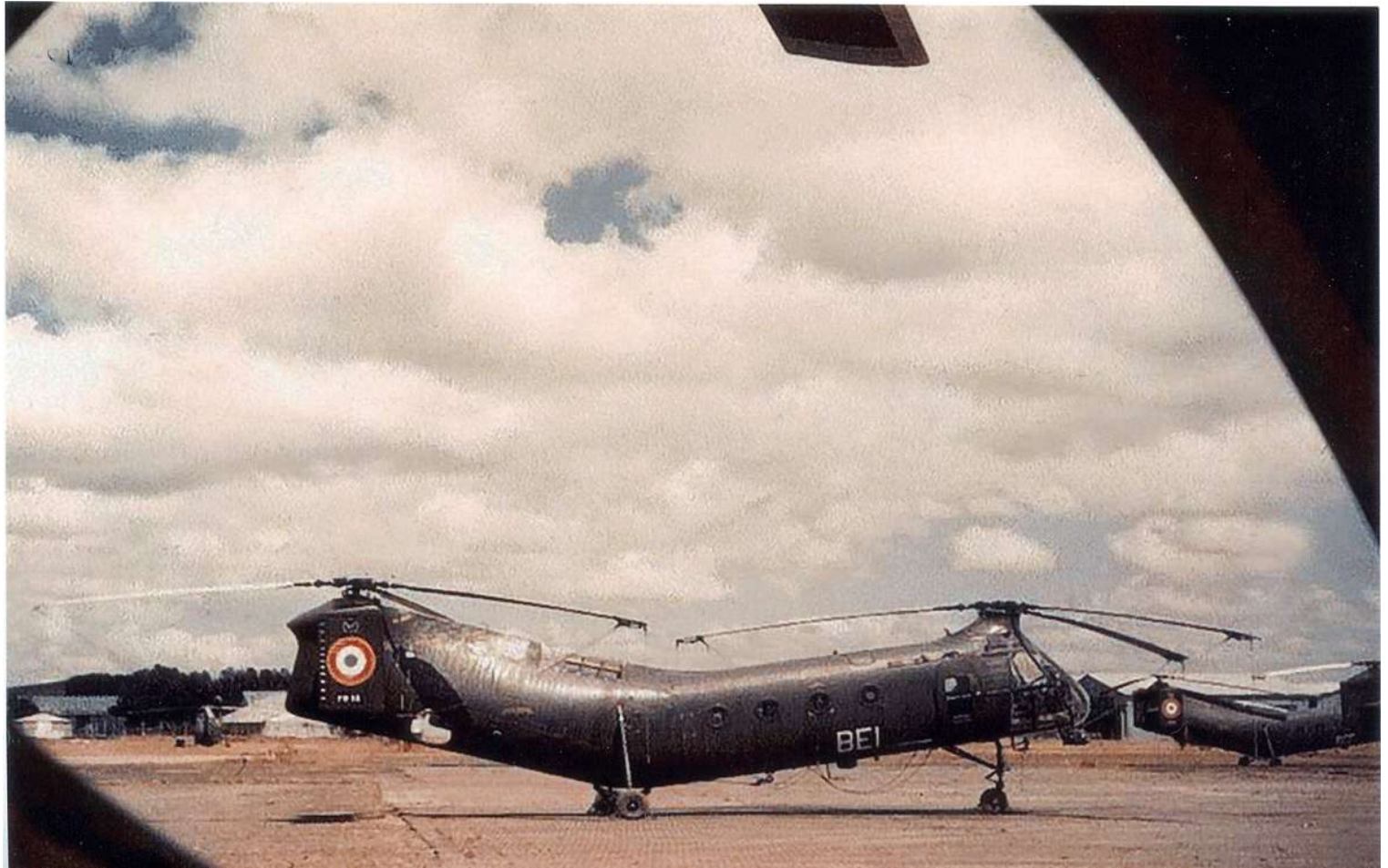
FR55/BEI du GH N°2.