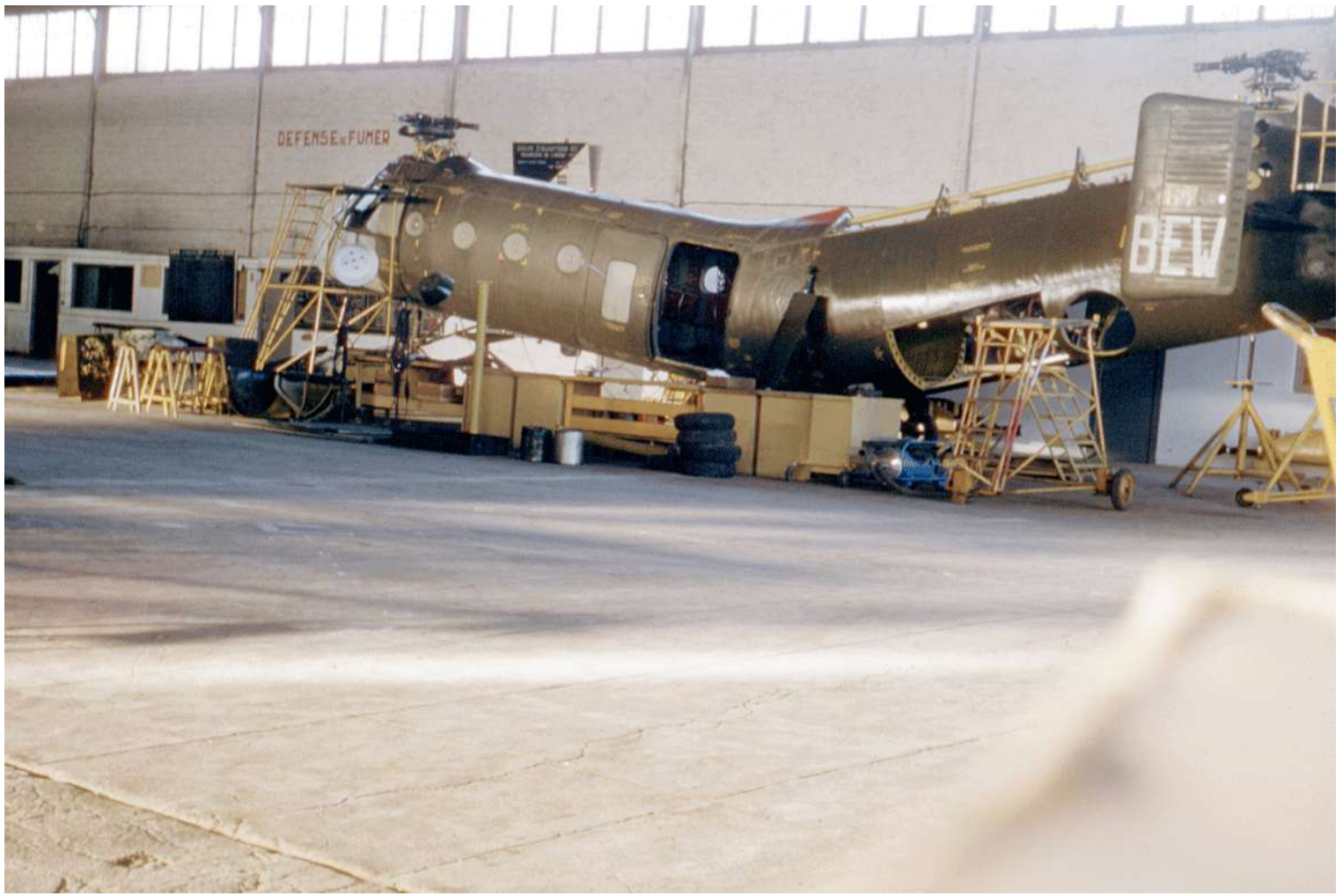
FR67/BEW, du GH N°2 à Sétif, en 1958/1959.