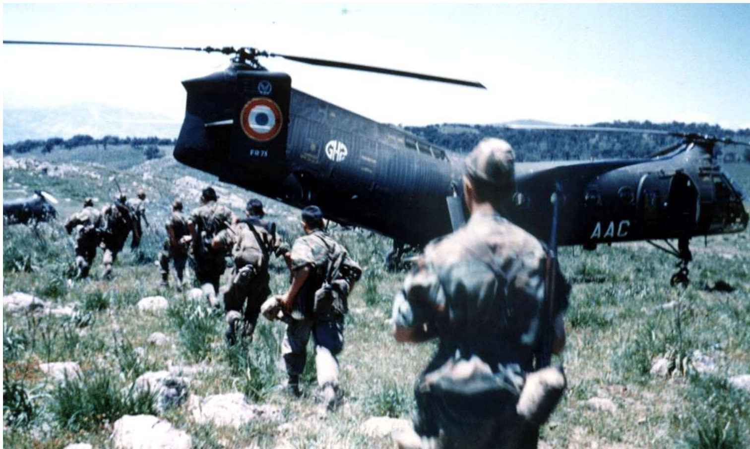
FR73/AAC du GH N°2, en opération dans les Aurès en 1959.