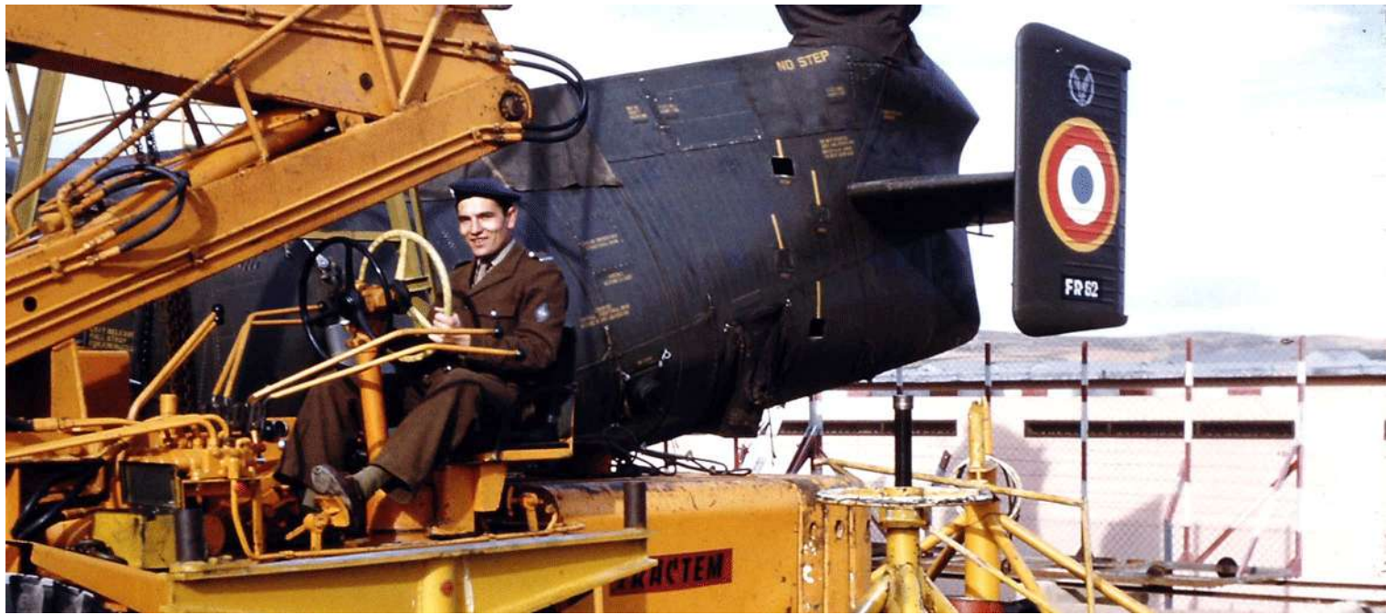
FR62/BEP en 1960 à la 674 e CRALAT