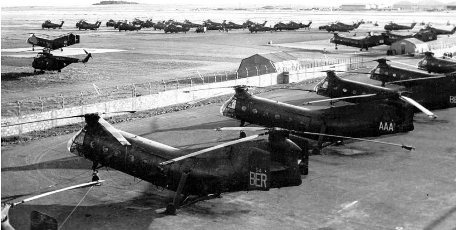
FR64/BER et FR71/AAA du GH N°2 au parking à Sétif.