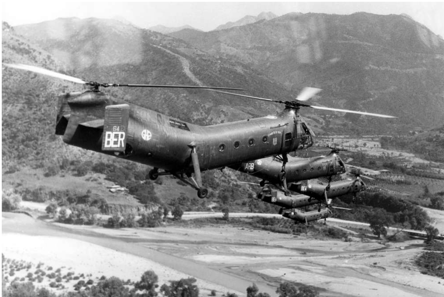
FR64/BER du GH N°2, dans le vallée de la Suomam, en 1958.