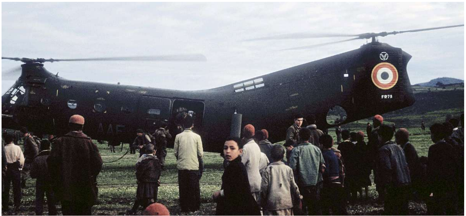
FR75/AAF du GH N°2, en février 1960, à Tamalous.