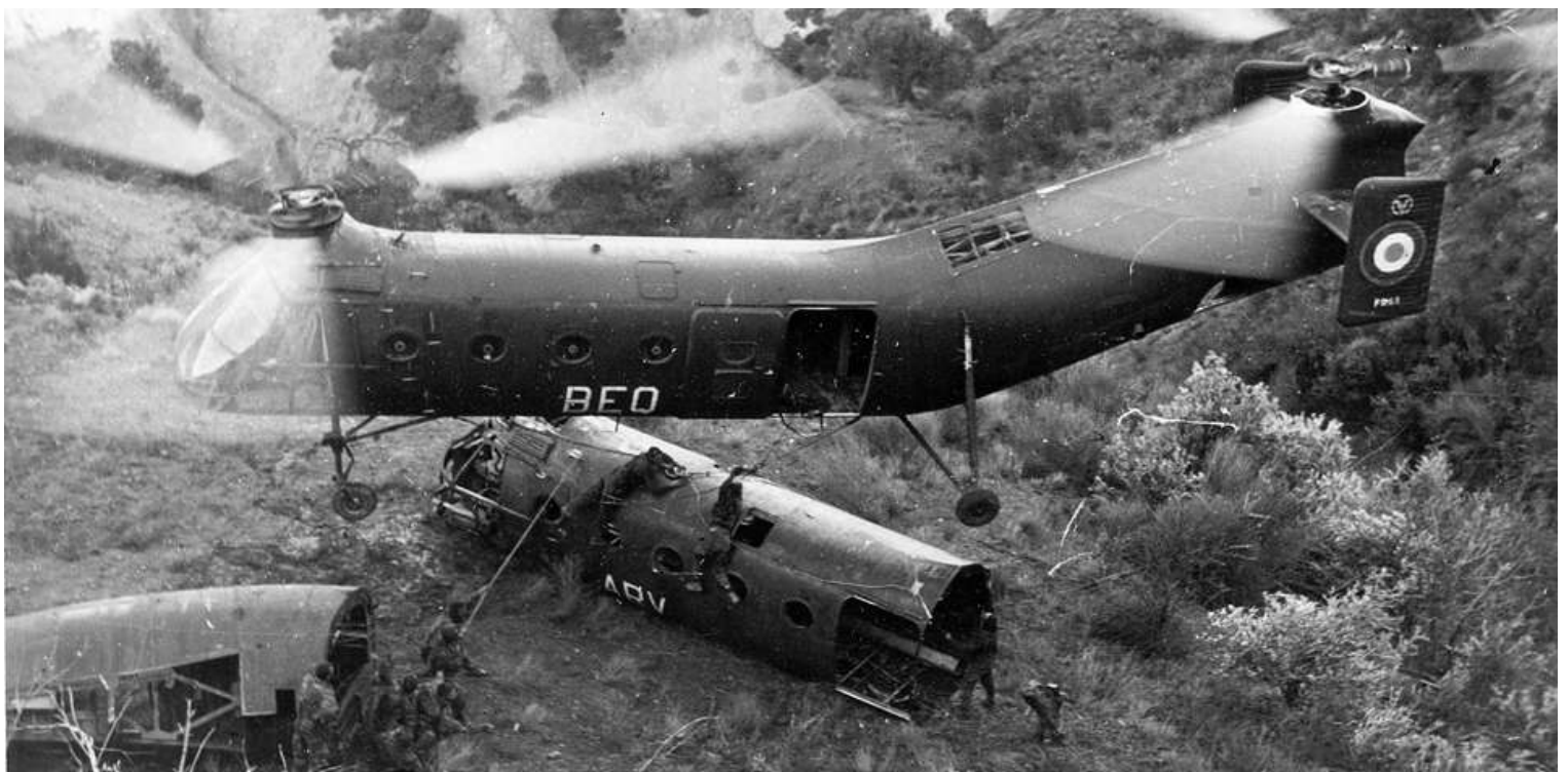
FR63/BEQ du GH N°2 au secours de la banane FR25/ARV, accidentée, le 26 décembre 1961.