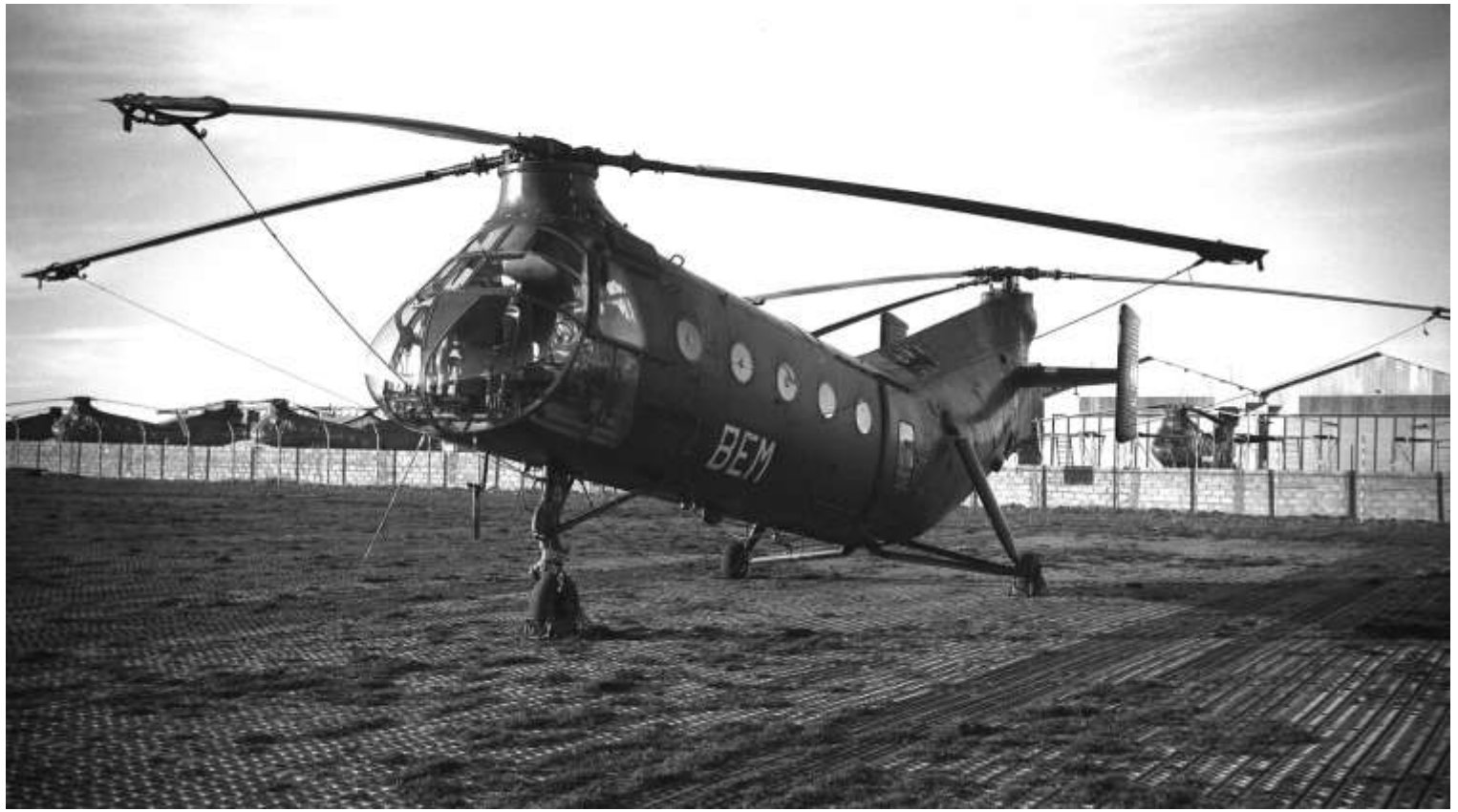
FR59/BEM du GH N°2, le 1 er janvier 1960, à Sétif (photo Bernard Chenel).