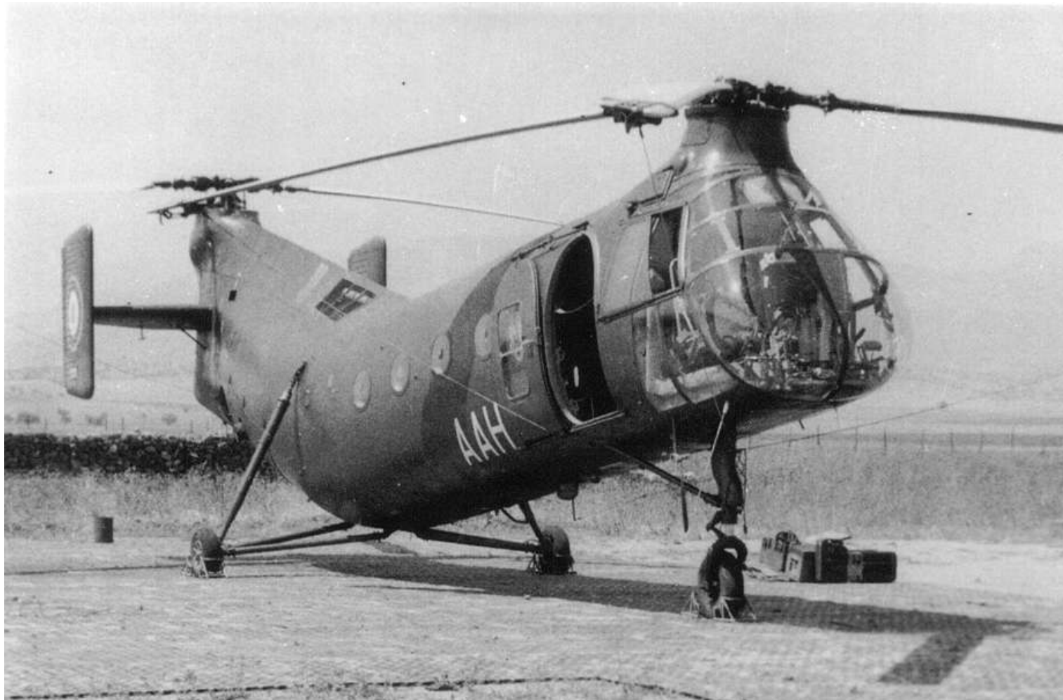
FR76/AAH du GH N°2, à Millesimo en mars 1960 ou 1961.