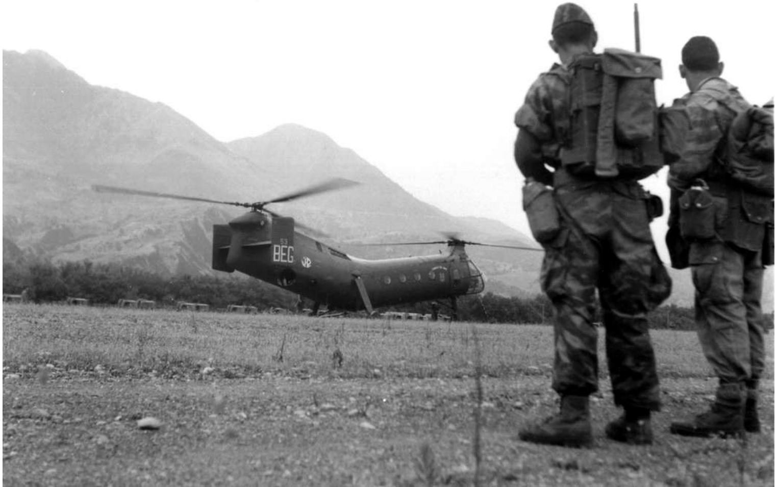
FR53/BEG du GH N°2, en opération dans le Nord-Constantinois, en 1959.

17/05/68 vendu aux ferrailleurs par décision 115/ALAT DRM5J pour la somme de 1 502 471 francs (7 497 330 en 1990)