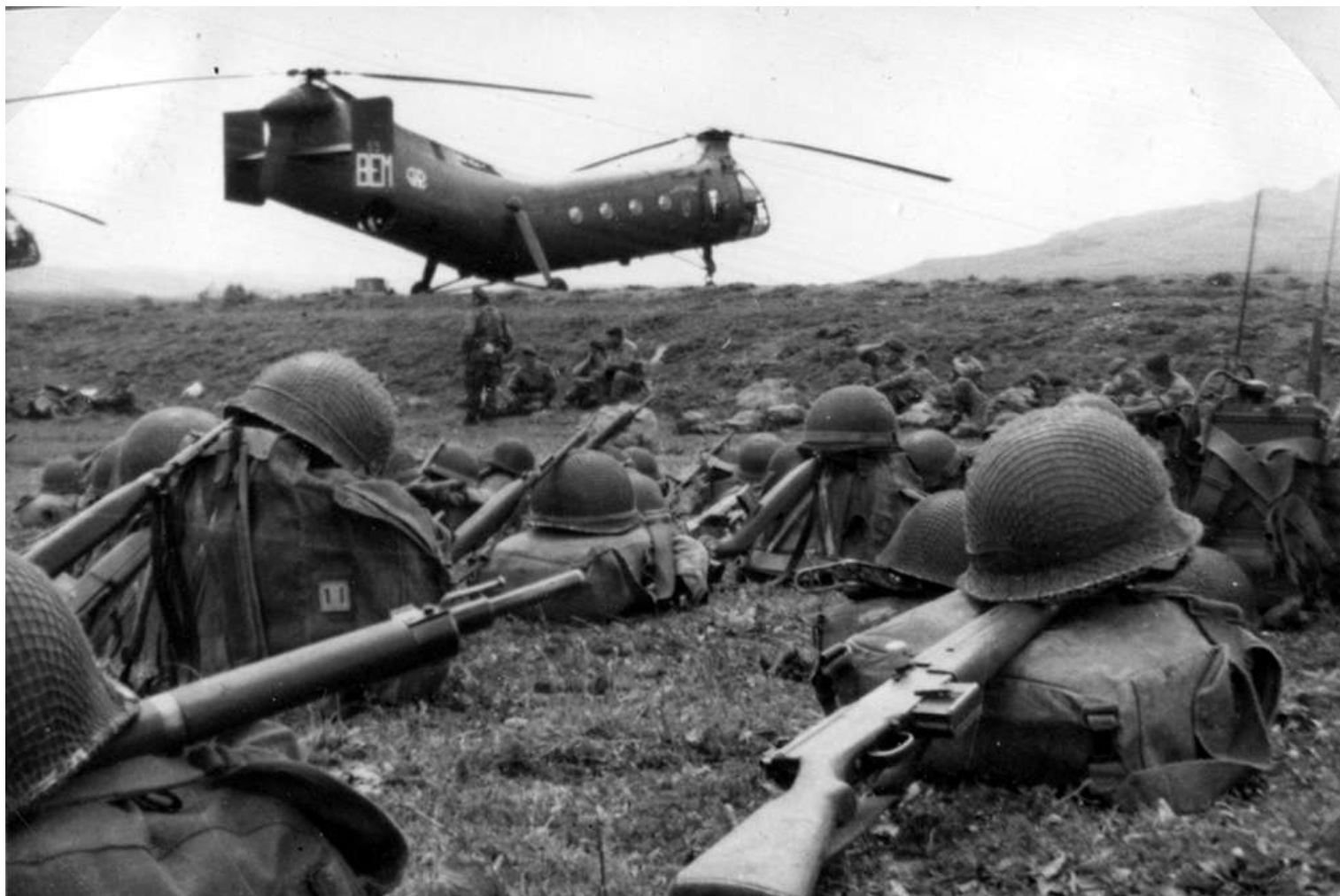
FR59/BEM du GH N°2, à Souk-Ahras en 1959. DIH en zone d'embarquement.

56-2043 01/10/57 marché n° 6327/56 08/11/57 départ de Norfolk sur le transport d'aviation "Dixmude" (RFM n°239) 08/11/57 arrivée à Alger par le transport d'aviation "Dixmude" GH N°2 BEM 15/09/60 IRAN 02/12/60 GH N°2 BEM ../../60 GH N°2 AAS 01/02/63 14 e GALAT AAS 29/06/63 accidenté en Algérie au Djebel Murdjadjo. Au cours d'une mission ops. de transport de commandos, le pilote tente, sans y parvenir, d'afficher 2700 tr/min pour atterrir. Jugeant que l'appareil s'enfonce dangereusement il se dirige en virant vers une clairière en contrebas. Durant ce virage, le rotor arrière et la dérive gauche heurtent les arbres mais l'équipage réussit à poser la machine sur ses roues. 03/07/63 accidenté 26/08/63 réformé avec .... heures de vol