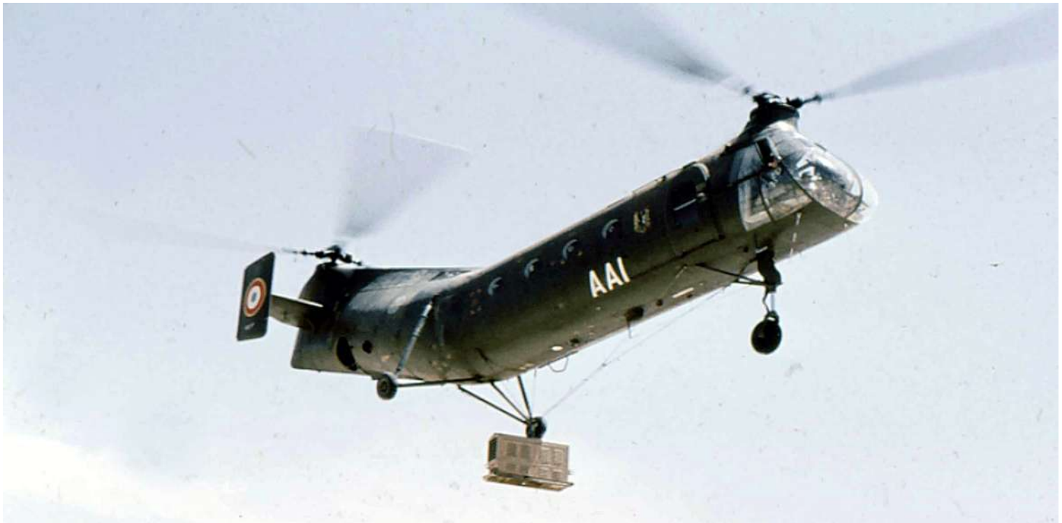
FR77/AAI du GH N°2.