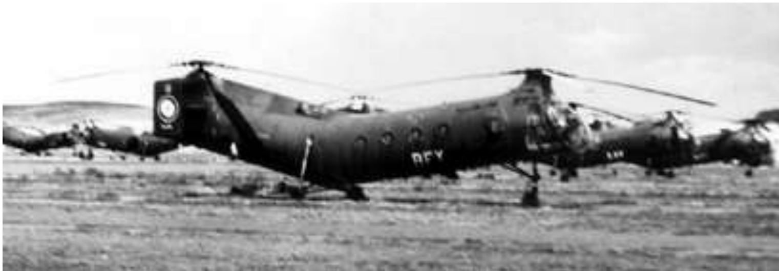
FR69/BEY du GH N°2.

56-2053 01/10/57 marché n° 6327/56 08/11/57 départ de Norfolk sur le transport d'aviation "Dixmude" (RFM n°239) 08/11/57 arrivée à Alger par le transport d'aviation "Dixmude" GH N°2 BEY IRAN AIA Maison Blanche avec 1053 heures GH N°2 BEY AIA Maison Blanche 4 e échelon GH N°2 AAD 14 e GALAT AAD 31/01/63 14 e GALAT AAD 30/03/63 675 CRALAT 10/04/63 14 e GALAT AAD EH 1 ../05/63 14 e GALAT ARE 10/02/64 14 e GALAT ARS relève PHC/CEMO à In Amguel 23/03/64 14 e GALAT ARS 07/05/64 port de Mers-el-Kébir attente embarquement 15/05/64 retour métropole par cargo "Sainte Hélène" 16/05/64 14 e GALAT 01/06/64 GALAT 14 23/09/64 ERGM Bruz VP 100 07/12/64 GALAT 14 ARE 01/09/65 3 e GALAT 11/10/65 ERGM Bruz 28/09/65 OMP mise en condition IRAN 22/10/65 ERGM Montauban attente IRAN 25/10/65 IRAN Héli Service Marignane avec 574 heures 05/05/66 MC Montauban 09/05/66 OMP stockage 11/01/67 3 e GALAT 01/07/68 ERGM Bruz VP 300 27/08/68 3 e GALAT ../../68 MC Bruz stockage 04/10/68 3 e GALAT 19/09/68 OMP ARJ 26/01/70 MC Bruz 17/12/69 OMP stockage 27/02/70 ERGM Bruz VP 500 + échange GMP 20/04/70 MC Bruz 17/12/69 OMP stockage 26/05/70 ERGM Montauban 19/05/70 OMP attente mise en place MAE 19/05/71 réformé avec 1095 heures de vol ../05/71 Cession gratuite au Musée de l'Air En dépôt à Dax avec code AAD vue 29/05/2010