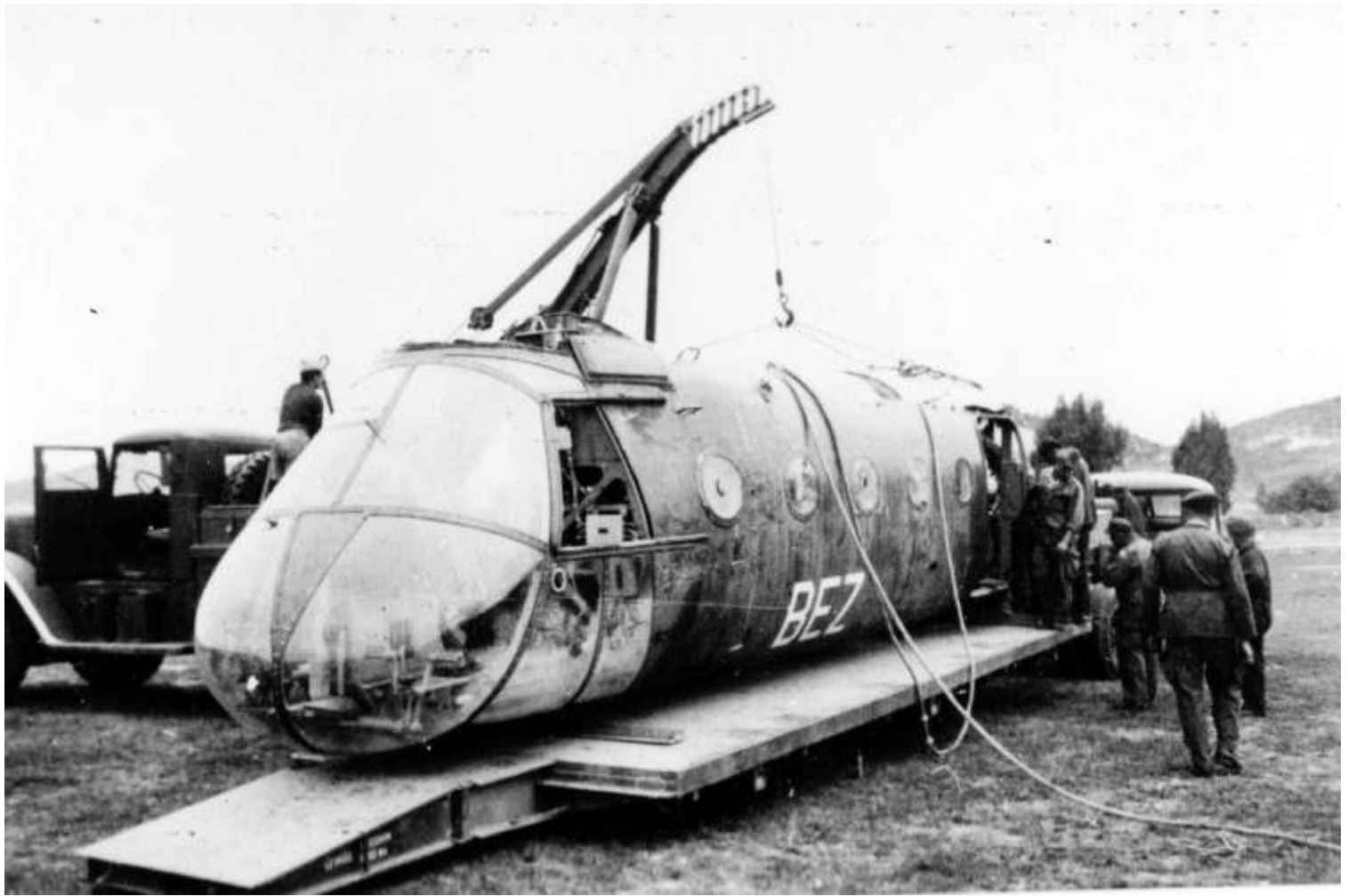
FR70/BEZ. Accidenté à El Milia, le 15 mai 1960. Au posé sur une DZ, l'appareil heurte une souche avec son train droit. Le train arraché, l'appareil se couche sur le côté droit. Reversé à l'AIA.