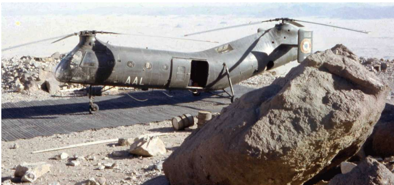
H-21 n° 55/AAL du 14 e GALAT, à In-Amguel Tan-Affela, en 1963.