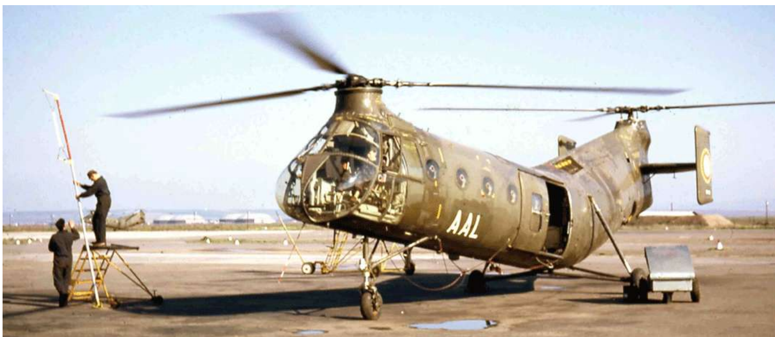
H-21 n° FR55/AAL du 14 e GALAT à Oran, en 1963, lors de la VP 100 heures.