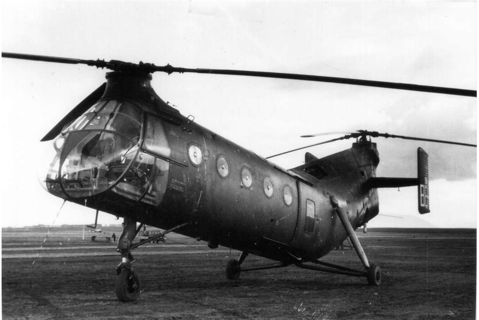
FR54/BEH du GH N°2

03/09/59 réformé avec .... heures de vol