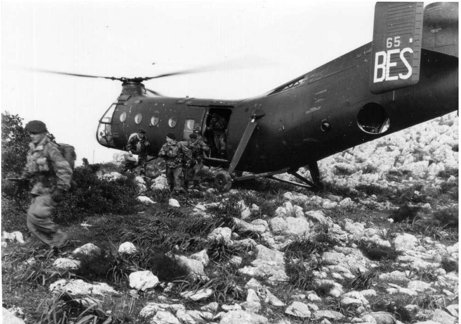
FR65/BES du GH N°2, le 10 avril 1958, au nord de Guelma.