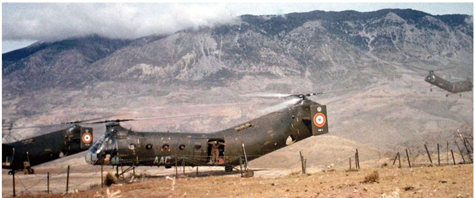
FR73/AAC du GH N°2, devant le djebel Babor dans le secteur de Kerrata.