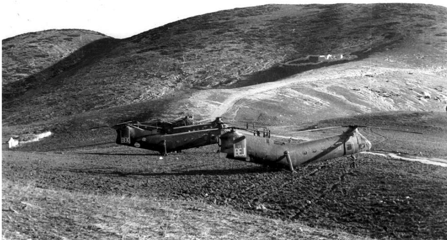
FR56/BEJ du GH N°2, en opération dans le Constantinois (photo Jean de Lapersonne).