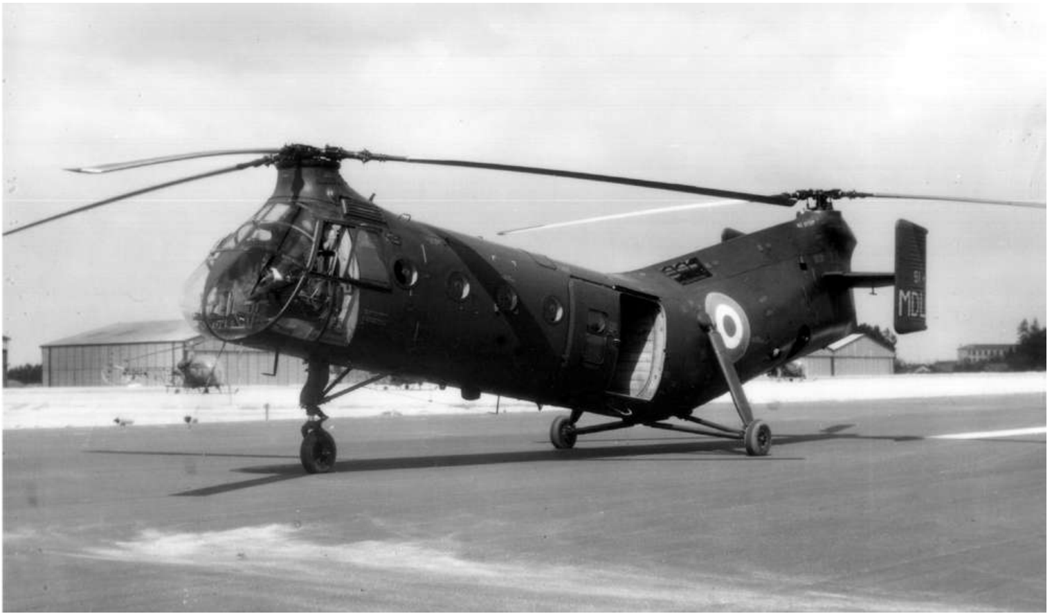
FR51/MDL de l'ESAM.