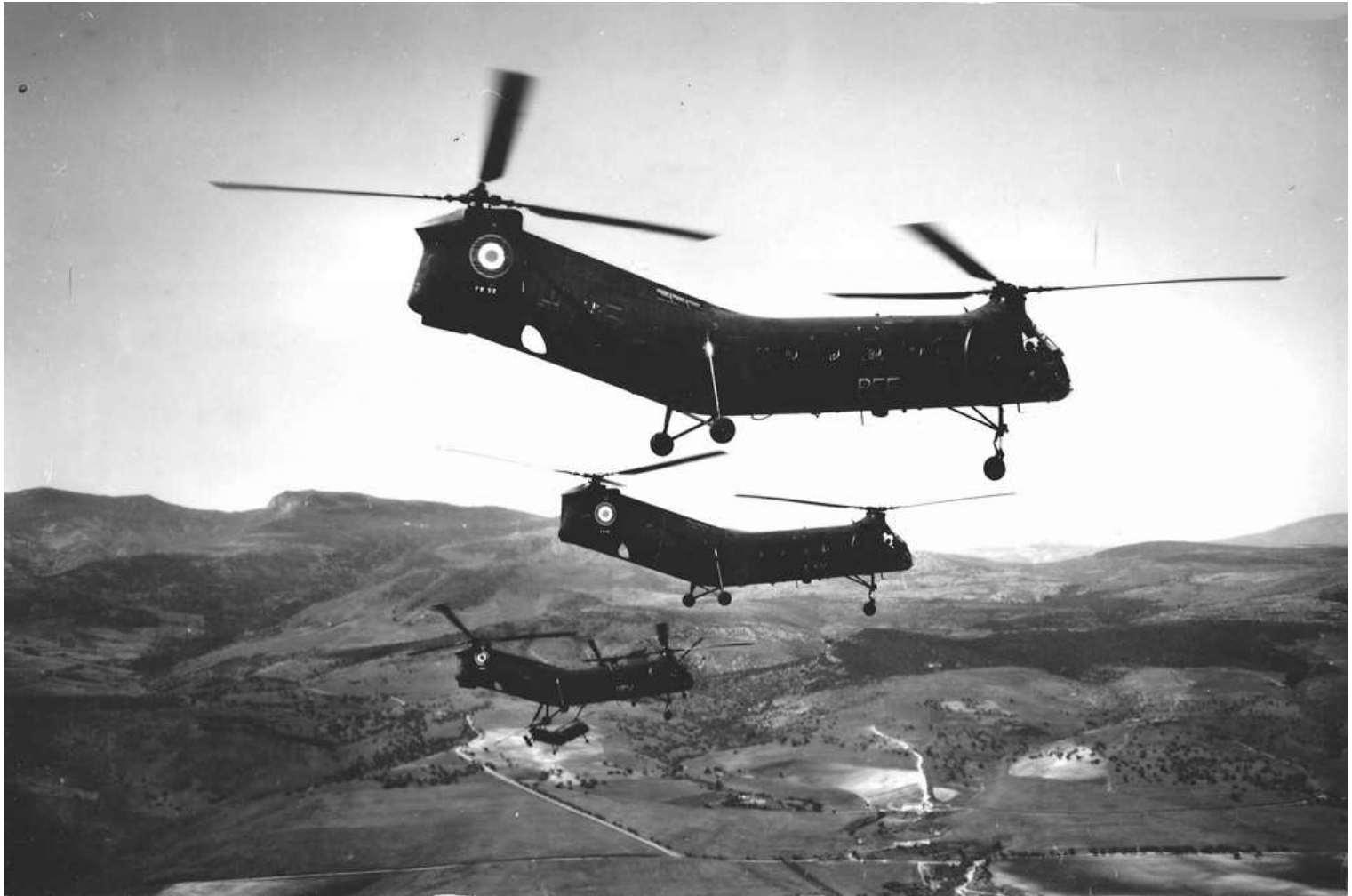
FR52/BEF du GH N°2, à Guelma en juin 1962.

marché n° 6327/56 aménagement, à la SNCASO, en détachement chez Vertol, de panneaux pour sortir les réservoirs montés sur chaîne et les remplacer par des réservoirs auto-étanches départ de Norfolk sur le transport d'aviation "Dixmude" (RFM n°164) arrivée à Alger par le transport d'aviation "Dixmude" 14/06/57 GH N°2 BEF 15/07/57 GH N°2 BEF 15/07/57 GH N°2 BEF 15/06/60 IRAN AIA Maison Blanche avec 926 heures 27/10/60 EA.ALAT .../.../61 GH N°2 BEF GH N°2/EHR 08/01/63 retour métropole via SBA, Oran, Valencia, Perpignan et Carcassonne ../01/63 ES.ALAT 17/01/63 OMP 21/02/63 ERM Versailles 08/02/63 OMP attente IRAN 21/03/63 IRAN Hélic Service Marignane avec 587 heures + réparation 24/07/63 ES.ALAT 26/07/63 OMP 08/02/63 Versailles 26/07/63 ES.ALAT 22/01/64 EA.ALAT 19/12/63 OMP 24/08/65 ERM Valence 05/06/65 OMP stockage 17/05/68 réformé avec 1709 heures de vol 17/05/68 vendu aux ferrailleurs par décision 115/ALAT DRM5J pour la somme de 1 502 471 francs (7 497 330 en 1990)