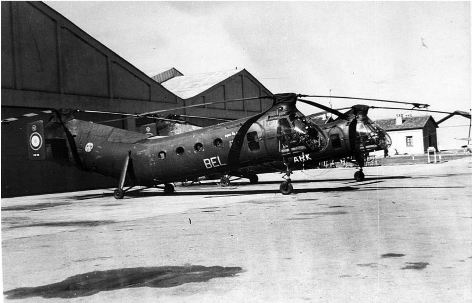
FR58/BEL du GH N°2 devant les hangars de la 674 e CRALAT à Sétif (photo Pierre Tabart).

56-2042 01/10/57 marché n° 6327/56 08/11/57 départ de Norfolk sur le transport d'aviation "Dixmude" (RFM n°239) 08/11/57 arrivée à Alger par le transport d'aviation "Dixmude" GH N°2 BEL 01/05/59 échange GMP 02/05/59 GH N°2 BEL 05/12/60 IRAN AIA Maison Blanche avec 1001 heures 16/03/61 GH N°2 BEL 17/02/62 accidenté à Sétif, alors que l'appareil vient de décoller le moniteur, alerté par une odeur de brûlé, s'aperçoit que le cargo est envahi de fumée et décide de se poser immédiatement. Pendant la descente, le GMP s'arrête et l'atterrissage s'effectue en autorotation. Malgré une lutte contre l'incendie immédiatement entreprise, toute la partie arrière de la machine est détruite par le feu suite à la rupture du fût de cylindre n°5. 17/02/62 récupération de l'appareil après accident 27/03/62 AIA Maison Blanche 4 e échelon après accident ../../62 GH N°2 BEL 31/01/63 14 e GALAT BEL ../02/63 retour métropole via SBA, Oran, Valencia et Perpignan ../02/63 ERM Versailles attente IRAN 15/02/63 IRAN Hélic Service Marignane avec 300 heures + 4 e échelon 19/10/64 ERGM Bruz 14/11/64 GALAT 14 23/10/64 OMP 24/08/65 ERM Valence 05/08/65 OMP 17/05/68 réformé avec 1597 heures de vol 17/05/68 vendu aux ferrailleurs par décision 115/ALAT DRM5J pour la somme de 1 502 471 francs (7 497 330 en 1990)