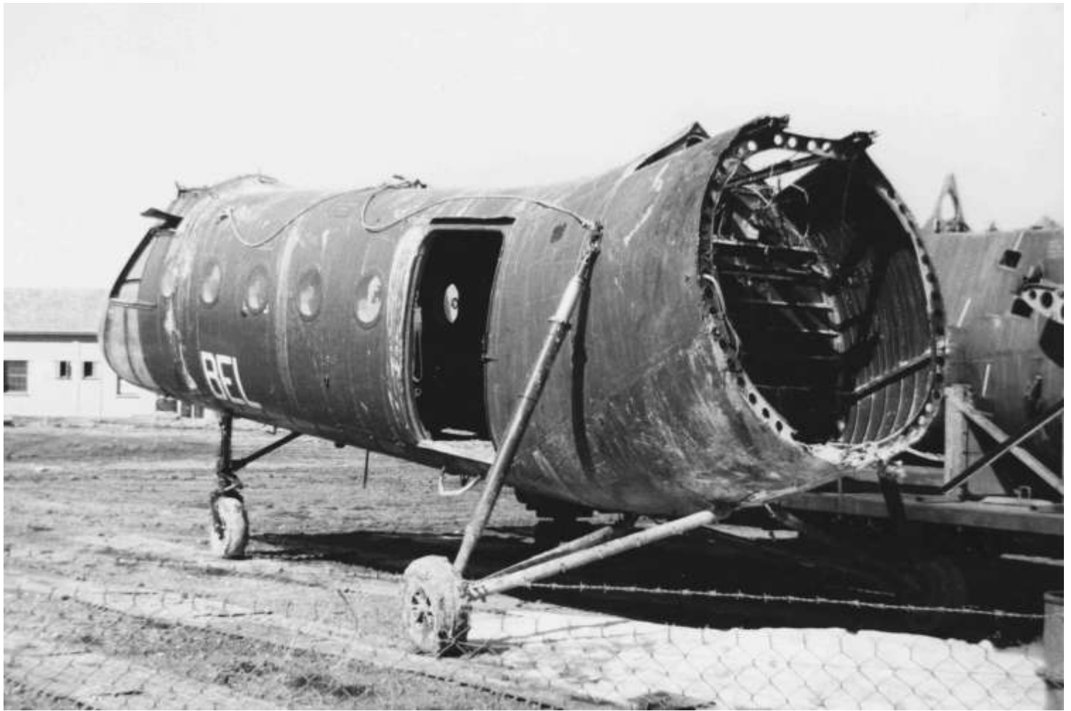
Récupération du H-21 n° FR58/BEL du GH N°2 le 18 février 1962.