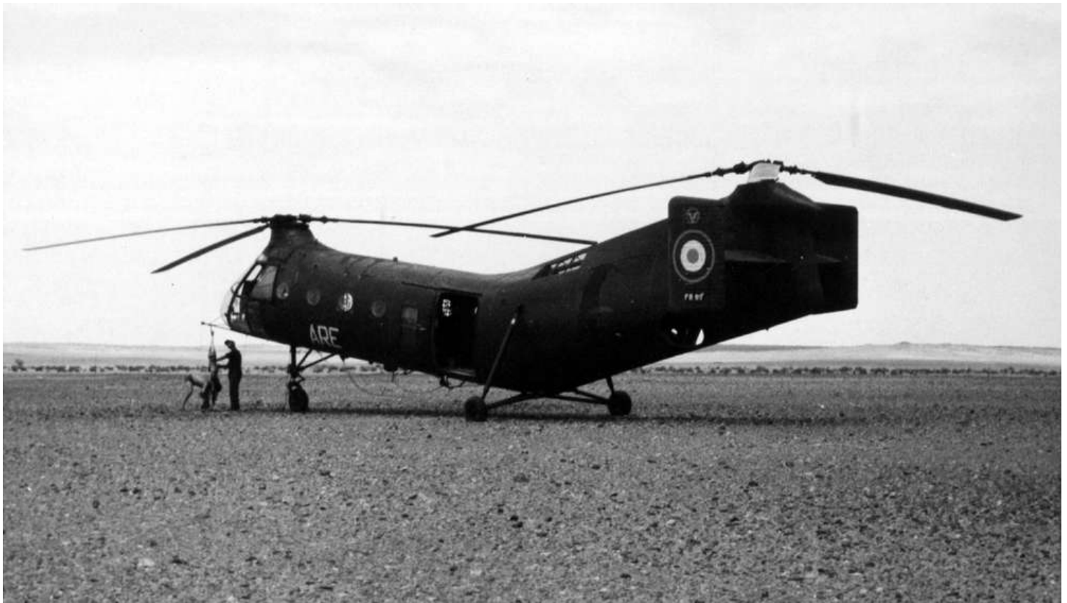
Devant le FR69/ARE, à In-Amguel, en 1963, dépeçage d'une gazelle.