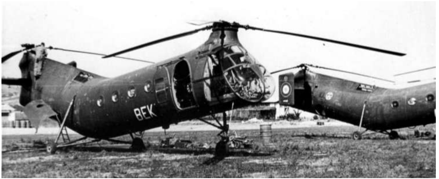
FR57/BEK du GH N°2 (photo X, collection Christian Malcros).