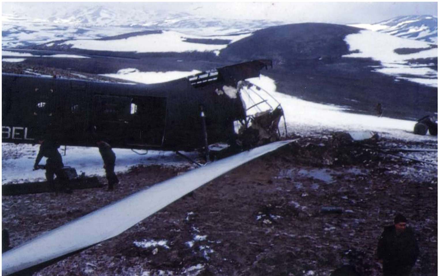
Récupération du FR58/BEL, le 18 février 1962, au nord de Sétif.