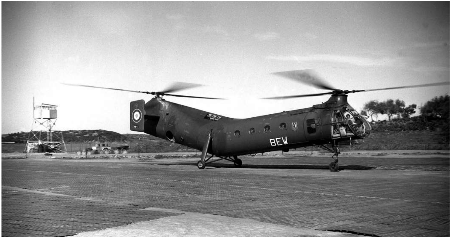
FR67/BEW du GH N°2, à Djidjelli, le 4 mars 1960.