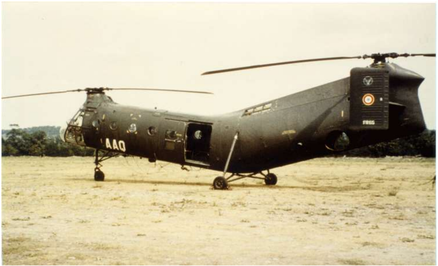
FR65/AAQ, au GALAT 15.