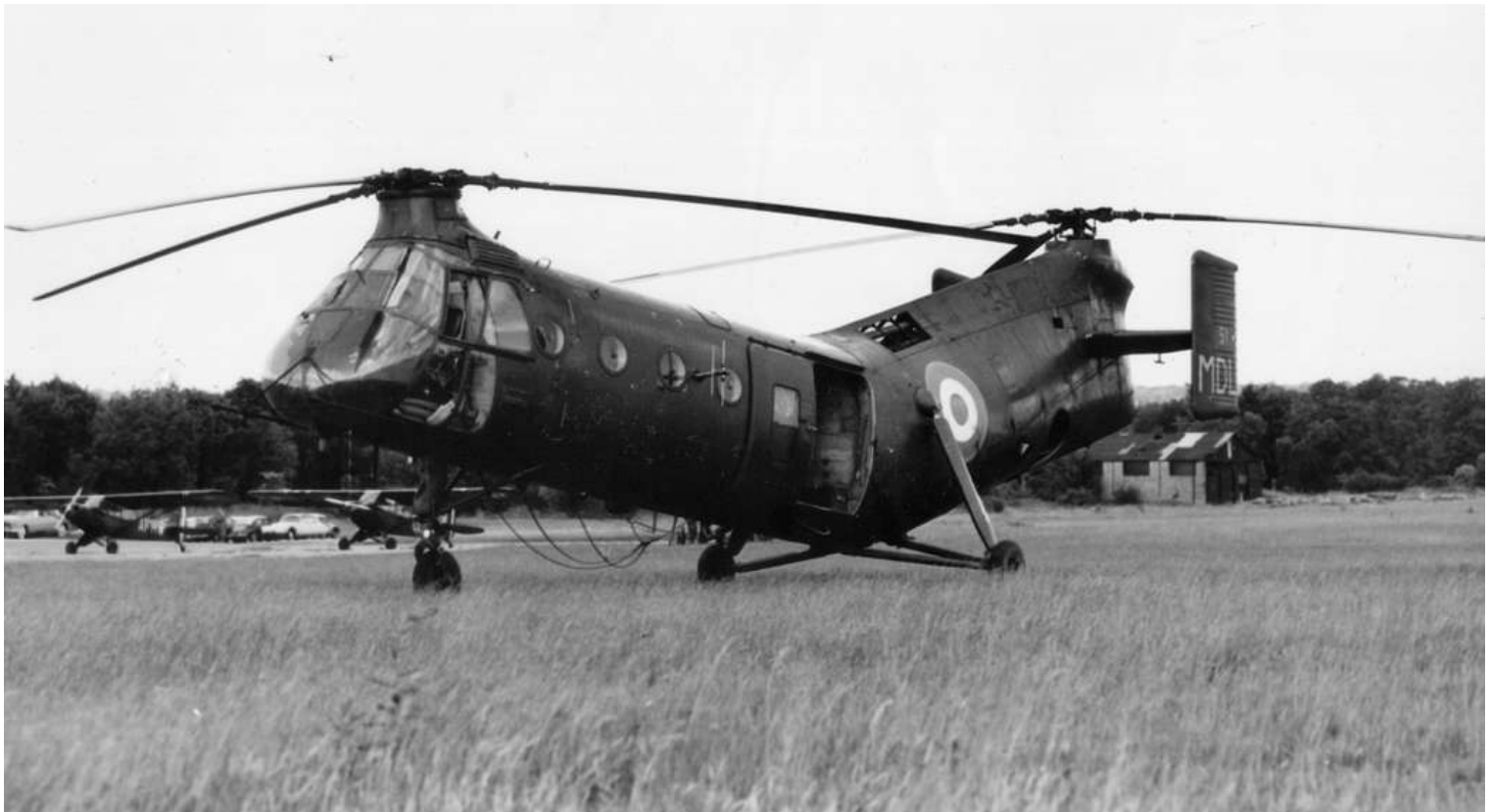
FR51/MDL de l'ESAM, en visite à Buc.

AIA : Atelier Industriel de l'Air. DZ : Dropping Zone (zone de poser) .EMJ : Entretien Majeur. ERGM : Etablissement de Réserve Générale du Matériel. ERM : Etablissement Régional du Matériel. Evasan : Evacuation Sanitaire GMP : Groupe Moto Propulseur. IRAN : Inspect and Repair As Necessary (Entretien Majeur), OMP : Ordre de Mise en Place, SBA : Sidi-bel-Abbès, VP : Visite Périodique. FR01 = n° appareil français. B148 = n° Vertol 53-4398 = USAF serial number 8 000 108 = n° matériel français