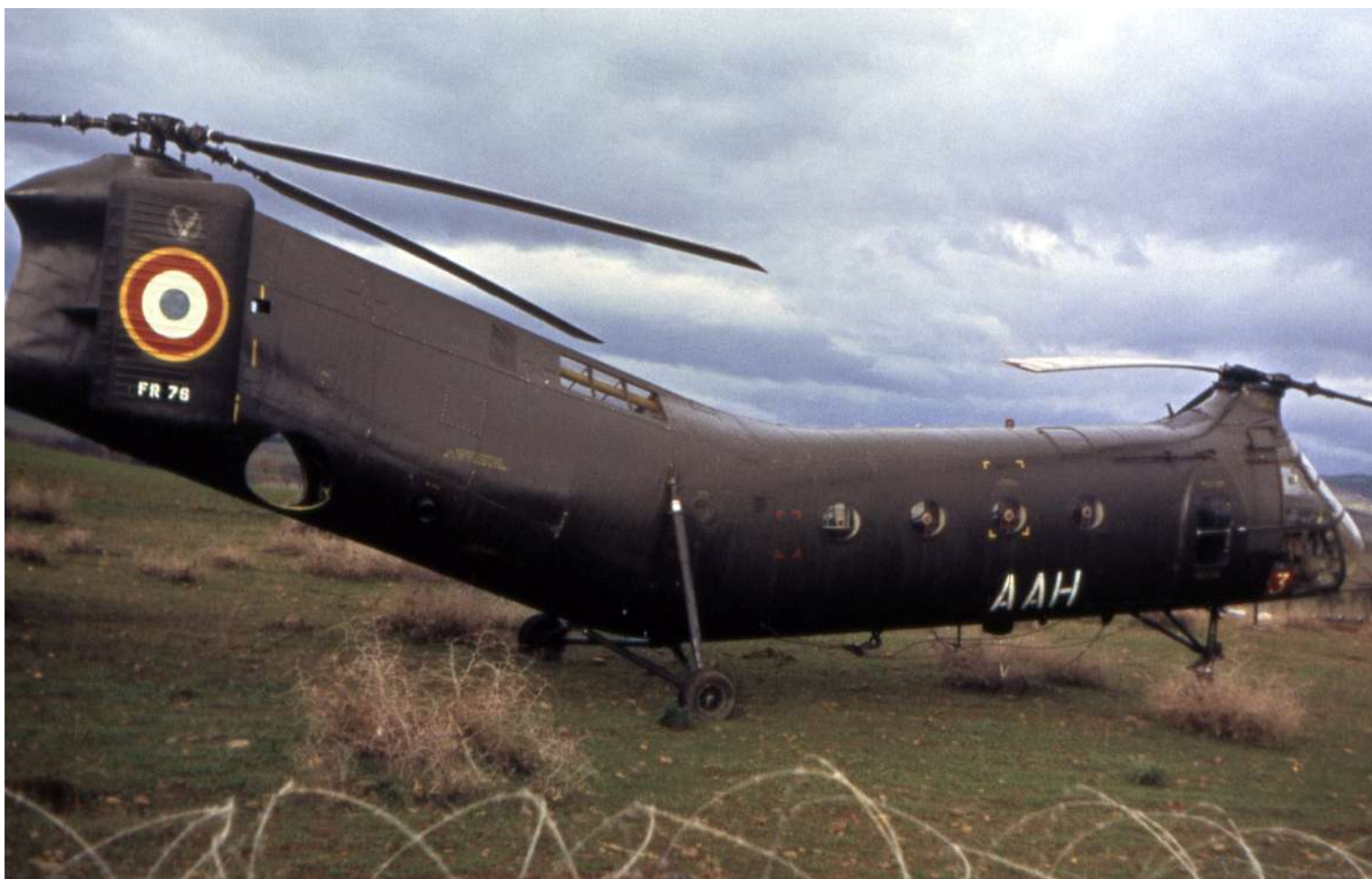
FR76/AAH du GH N°2.