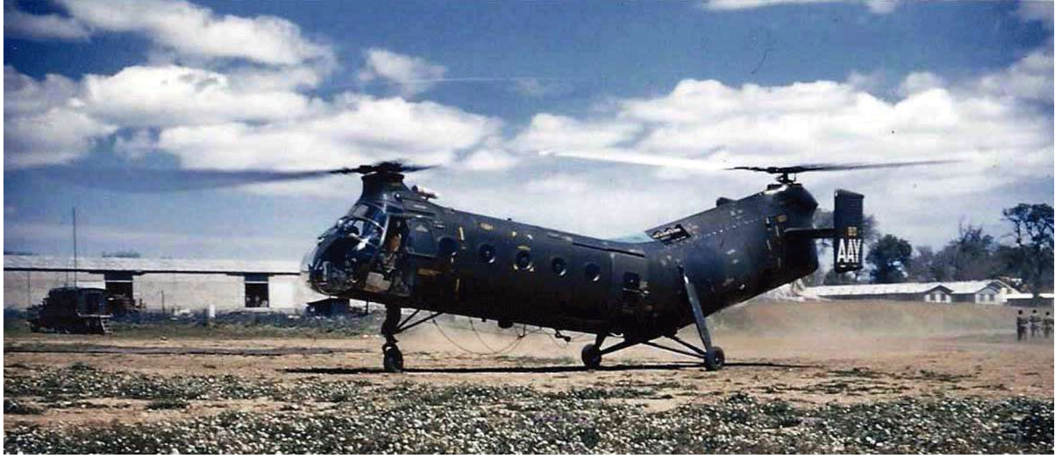
FR80/AAV du GH N° 2, en 1959 à Khenchala.

FR80 C226 marché n° 6327/56 56-2064 15/04/58 départ de Norfolk sur le transport d'aviation "Dixmude" (RFM n°134) 09/06/58 arrivée à Alger par le transport d'aviation "Dixmude" 09/06/58 GH N°2 AAV 19/12/60 IRAN avec 832 heures 28/03/61 GH N°2 AAV dévers. Le pilote affiche 21/08/61 accidenté en PY57 8384 en Algérie. L'appareil posé dérape sur une DZ en la puissance mais ne peut contrer le dérapage et empêcher le rotor arrière et la dérive gauche de toucher un arbuste. 31/01/96 14° GALAT AAV ../12/63 retour métropole pour IRAN via Oran, Valencia et Perpignan ../12/63 ERM Versailles 15/11/63 OMP attente IRAN 11/12/63 IRAN Hélic Service Marignane avec 864 heures 01/04/64 Montauban 06/04/64 OMP stockage 22/09/64 EA. ALAT 11/09/64 OMP 26/08/65 ERM Valence 05/08/65 OMP stocké 17/05/68 réformé avec 127 heures de vol 17/05/68 vendu aux ferrailleurs par décision 115/ALAT DRM5J pour la somme de 1 502 471 francs (7 497 330 en 1990)