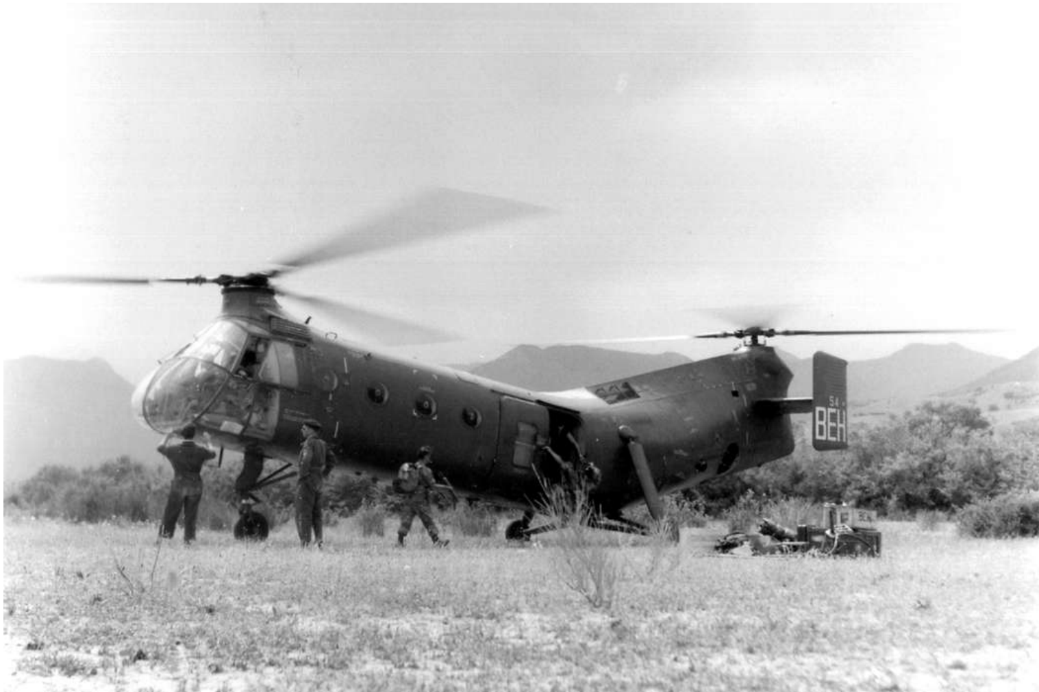
FR54/BEH du GH N°2. Hélicoptage dans le Nord-Constantinois, en 1959.