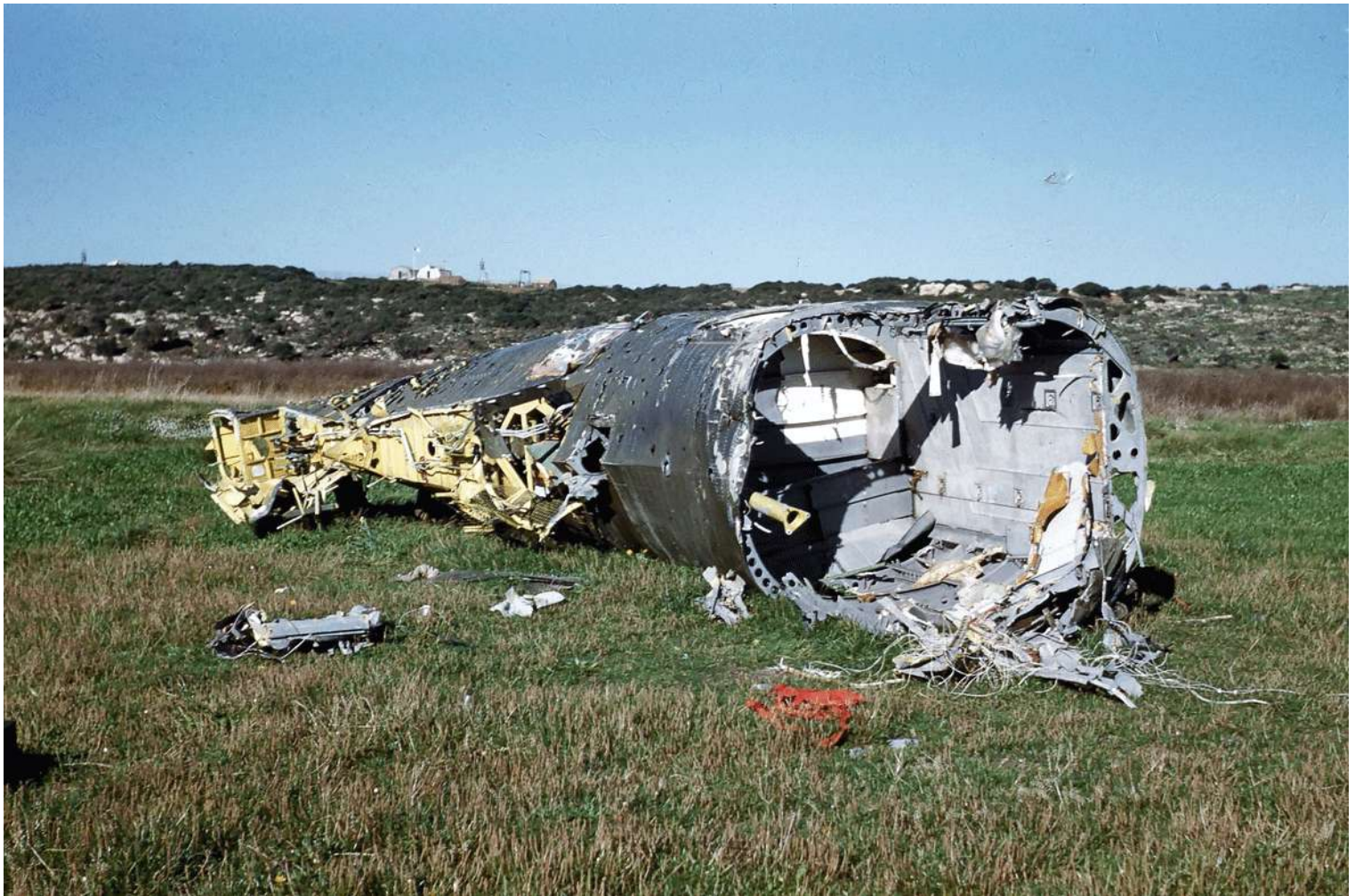
FR79/AAM, les restes de l'appareil, crashé en mer le 12 juillet 1961, renfloué par un navire de la Marine Nationale et déposé sur le terrain de Djidjelli.

../../62 réformé avec .... heures de vol