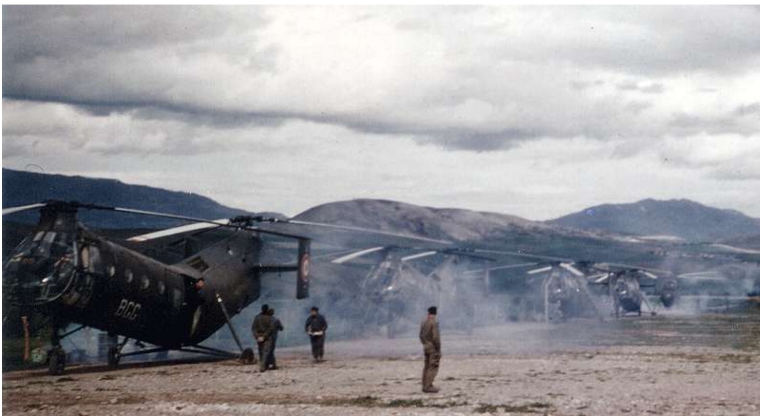
FR65/BGG du GH N°2 en 1961.