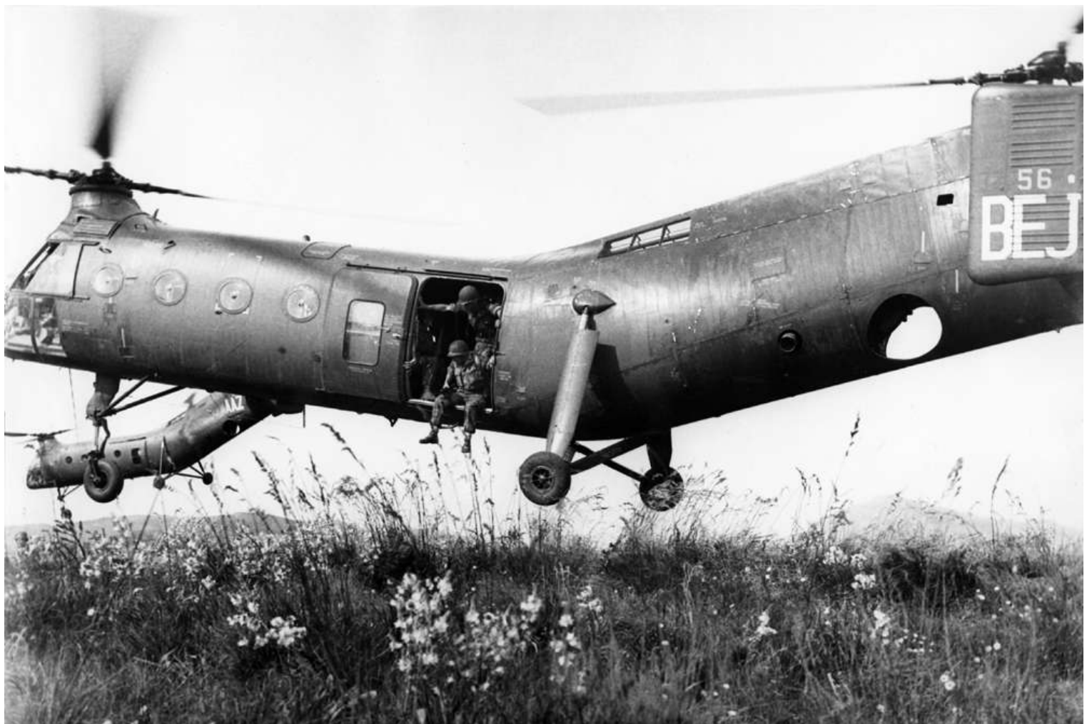
FR56/BEJ du GH N°2.

marché n° 6327/56 départ de Norfolk sur le transport d'aviation "Dixmude" (RFM n°239) arrivée à Alger par le transport d'aviation "Dixmude" GH N°2 BEJ accidenté. Au posé le train heurte un rocher. Train arrière gauche arraché. rapatriement + attente 4 e échelon + IRAN avec 719 heures BEJ AIA Maison Blanche GH N°2/EHR BEJ retour métropole via SBA, Oran, Valencia, Perpignan et Carcassonne ES.ALAT 17/01/63 OMP BEJ ERM Versailles 04/06/63 OMP attente IRAN IRAN Hélic Service Marignane avec 785 heures MC Montauban 19/10/63 OMP stockage GALAT 15 AAP MC Montauban 05/08/65 OMP stockage 3 e GALAT 28/09/65 OMP SVR 3e GALAT VP 100 + échange GMP 3 e GALAT MC Montauban 10/05/66 OMP stockage 40 e GALAT 29/11/66 OMP MC Montauban perte 01/07/69 retiré situation mensuelle réformé avec 2111 heures de vol sauvegardé à l'EAI à Montpellier (06/11/69)