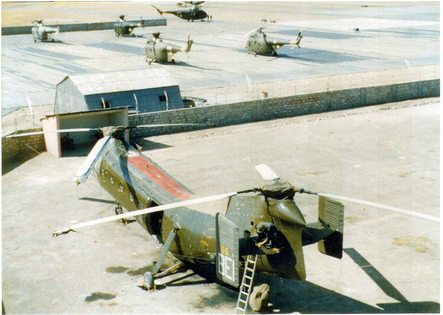
FR55/BEI du GH N°2, à Sétif.