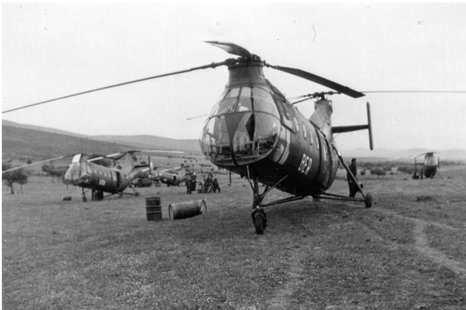
FR64/BER, du GH N°2, dans le Constantinois (photo collection Jean-Pierre Ulrich).