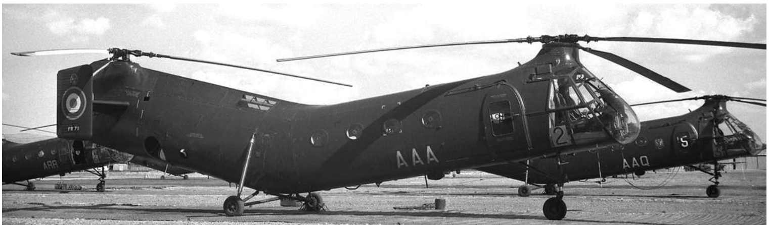
FR71/AAA du GH N°2, le 16 octobre 1961 à Sétif.