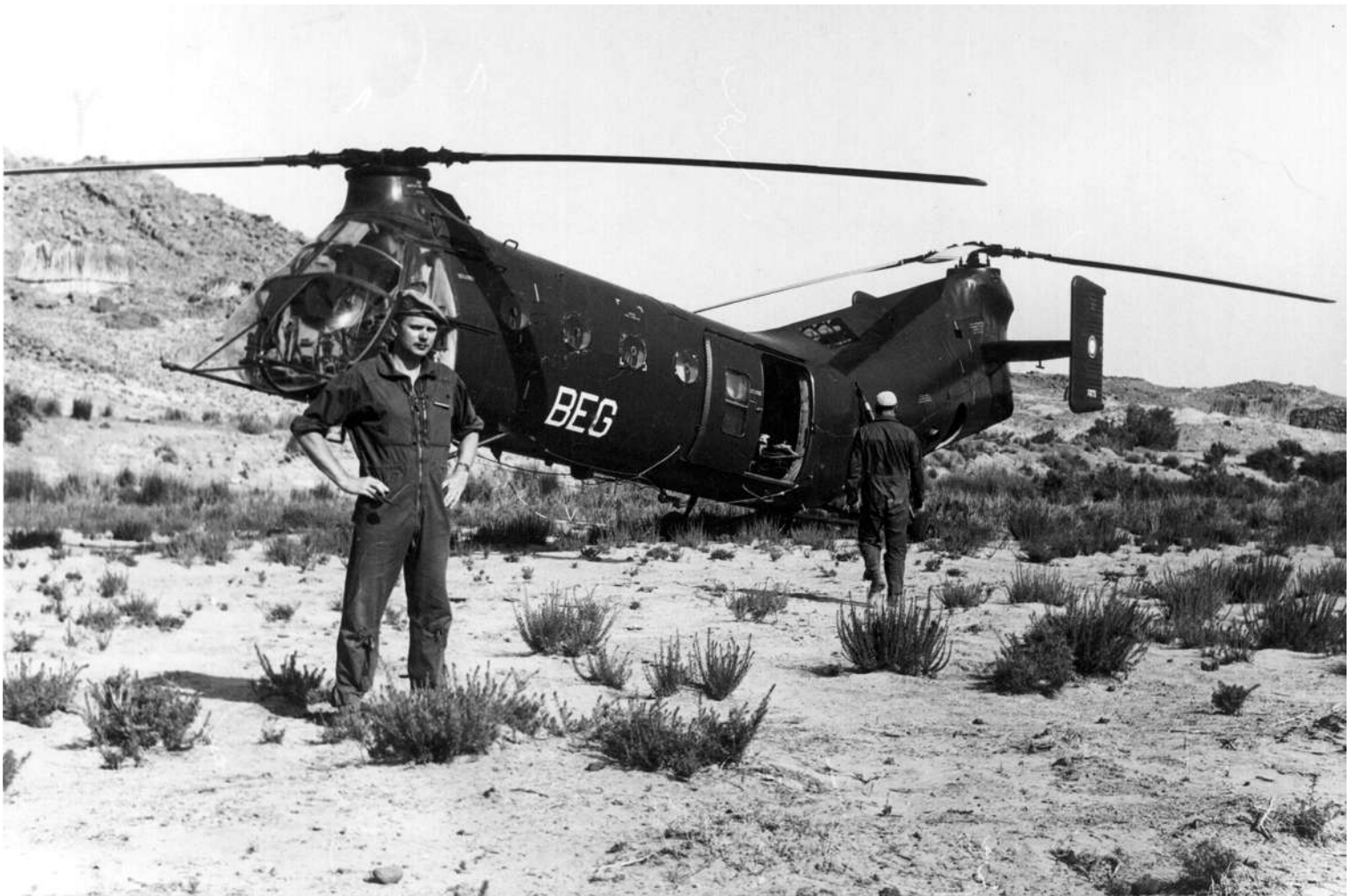
FR75/BEG du CEMO, à In-Ecker.