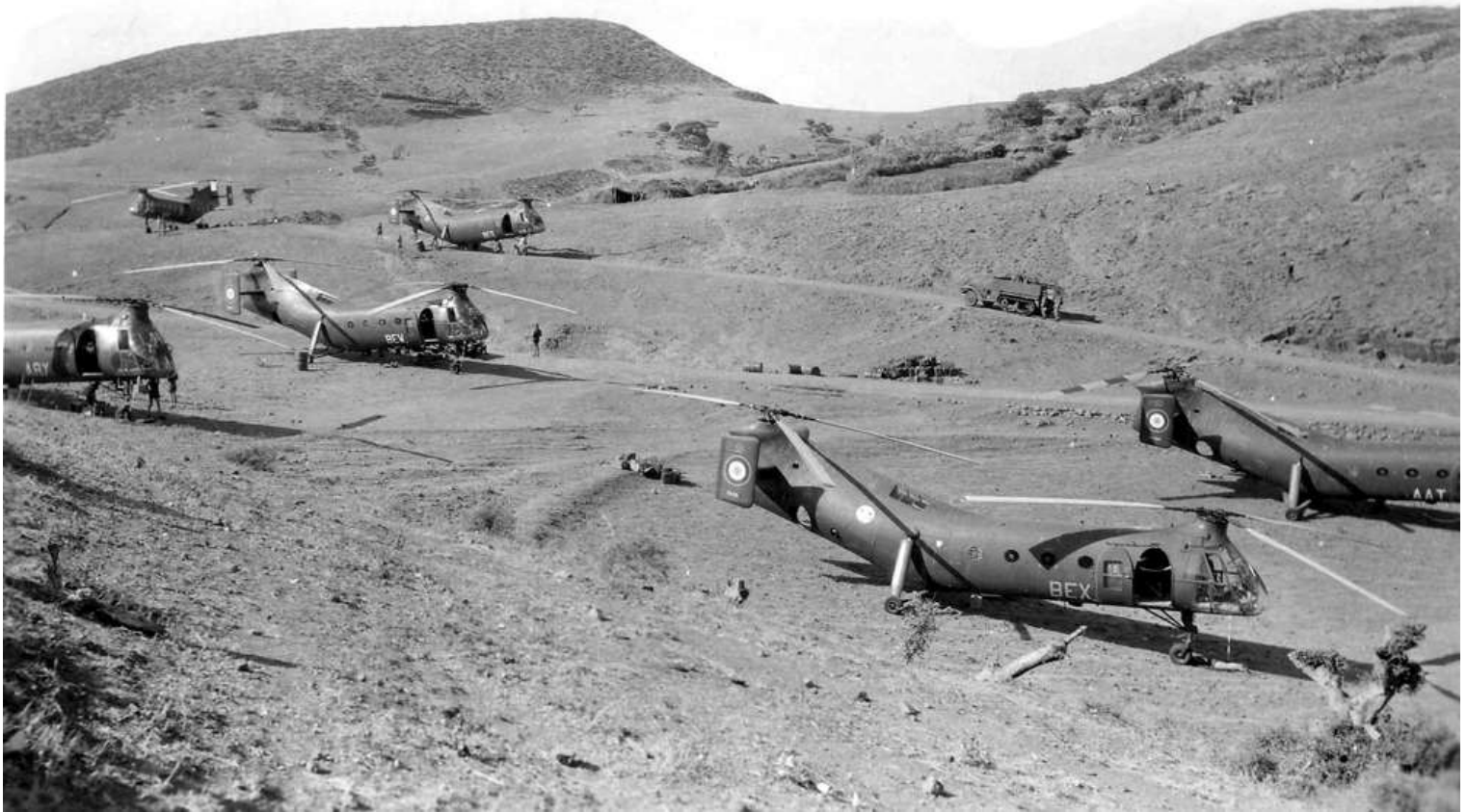
FR68/BEX du GH N°2, en opération à Guelma, le 30 novembre 1961.