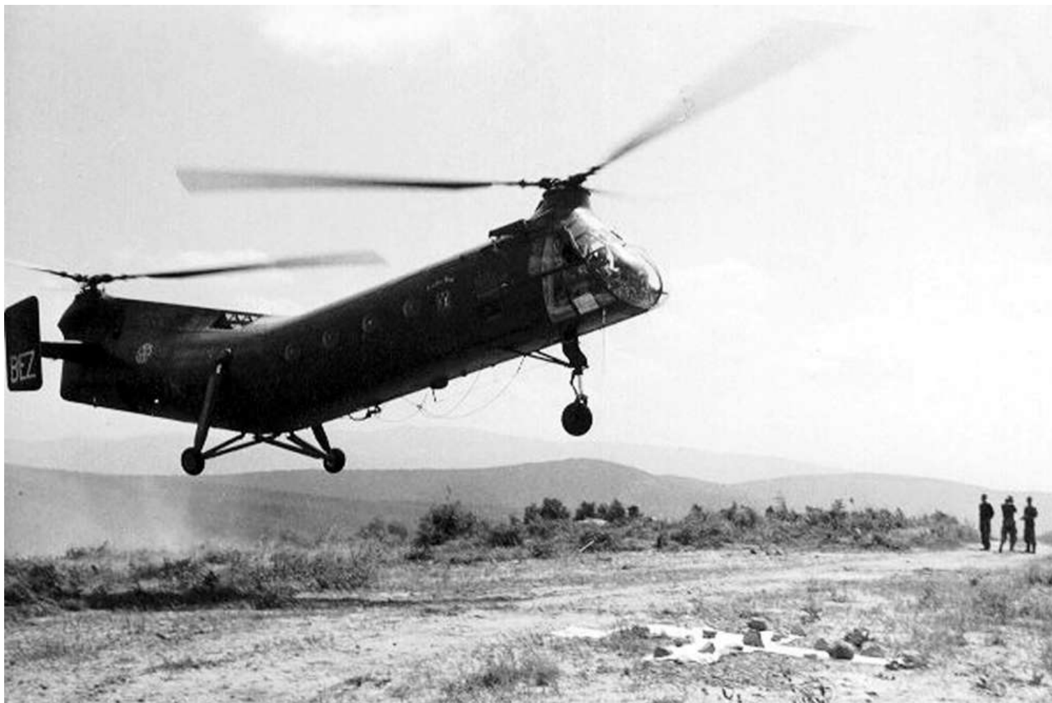
FR70/BEZ du GH N°2 à Raz-El-Ayoun en 1958.

FR70 C216 marché n° 6327/56 56-2054 15/04/58 départ de Norfolk sur le transport d'aviation "Dixmude" (RFM n°134) 09/06/58 arrivée à Alger par le transport d'aviation "Dixmude" 09/06/58 GH N°2 BEZ 15/05/60 accidenté à El Milia. Au posé sur une DZ, l'appareil heurte une souche avec son train droit. Le train arraché, l'appareil se couche sur le côté droit. 16/05/60 674 CRALAT rapatriement + attente 17/06/60 AIA Maidon Blanche 4 e échelon suite accident 20/06/52 GH N°2 BEZ 31/01/63 14 e GALAT 14/04/63 accidenté à Igli. En cours de vol l'équipage entend un bruit sec suivi de l'arrêt du GMP suite à la rupture de la soupape d'échappement du cylindre n°1. L'autorotation est conduite dans les dunes pour limiter les dégâts mais le train avant est arraché et deux pales du rotor avant se brisent sur des épineux. ../06/63 retour métropole 08/05/63 ERM Versailles attente 4 e échelon + IRAN 27/06/63 IRAN Héli Service avec 117 heures 29/07/64 GALAT 14 30/07/64 OMP ARF ../03/66 MC Montauban 17/05/66 OMP stockage 05/04/66 ERM Valence version 8 radio 21/04/66 MC Montauban dtockage ../01/68 3 e GALAT 09/01/68 OMP 19/06/68 MC Bruz 13/05/68 OMP stockage 24/01/69 3 e GALAT 21/01/69 OMP 05/02/70 ERGM Bruz 17/12/69 OMP stockage 01/07/70 retiré situation mensuelle 29/07/70 réformé avec 588 heures de vol 17/04/70 DM n° 16318 DCMAT/ALAT/1 pour mise en place par l'ERGM de Bruz de la cellule de l'appareil au 409 e BS à Dinan