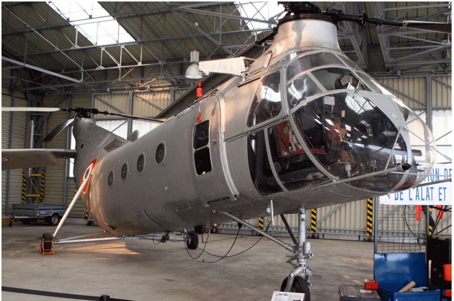
FR69/AAD, vue à Dax, le 29 mai 2010 (photo Christian Malcros).