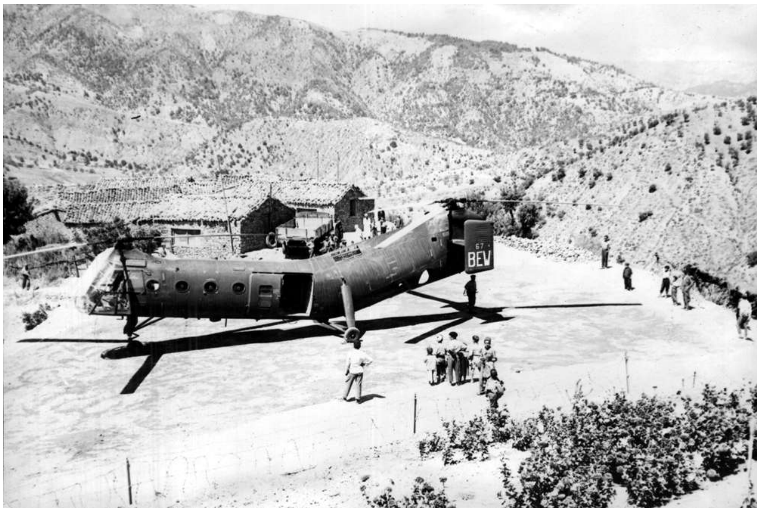
FR67/BEW. 3 septembre 1958, le général Gilles, madame et mademoiselle Gilles (sa femme et sa soeur), les lieutenants de La Ferrière et Le Tocquier. A Tébessa au 20 e Dragon (?).

FR67 C213 marché n° 6327/56 56-2051 01/10/57 départ de Norfolk sur le transport d'aviation "Dixmude" (RFM n°239) 08/11/57 arrivée à Alger par le transport d'aviation "Dixmude" 08/11/57 GH N°2 BEW 03/04/60 accidenté. Au retour d'une mission de nuit, l'appareil se range sur le parking au moteur. Jeu de pales arrière détérioré par suite d'un engrenage de nuit avec le FR85. 13/05/60 GH N°2 BEW 05/04/61 IRAN AIA Maison Blanche avec 935 heures 27/07/61 GH N°2 BEW ../../62 GH N°2 AAV 31/01/63 14 e GALAT AAV ../01/64 retour métropole pour IRAN via Oran, Valencia et Perpignan 10/01/64 GALAT 15 mutation administrative non eddectueée 11/01/64 ERM Versailles attente IRAN 20/01/64 IRAN Héli Service Marignane avec 581 heures 08/06/64 MC Montauban 09/06/64 OMP stockage 20/11/64 GALAT 14 16/10/64 OMP 01/02/65 ERGM Bruz application FR 1584 B 22/04/65 GALAT 14 02/05/66 ERM Valence version 8 radio 17/05/66 GALAT 14 27/06/66 ERGM Bruz échange GMP + réparations 01/08/66 GALAT 14 03/04/67 ERGM Bruz 17/03/67 OMP VP 300 03/05/67 MC Bruz 23/05/67 OMP stockage 24/07/67 3 e GALAT 05/07/67 OMP 01/12/67 retiré situation mensuelle 27/12/68 ERGM Bruz attente élimination 15/01/69 MC Montauban 20/11/68 OMP attente élimination 25/03/70 réformé avec 599 heures de vol