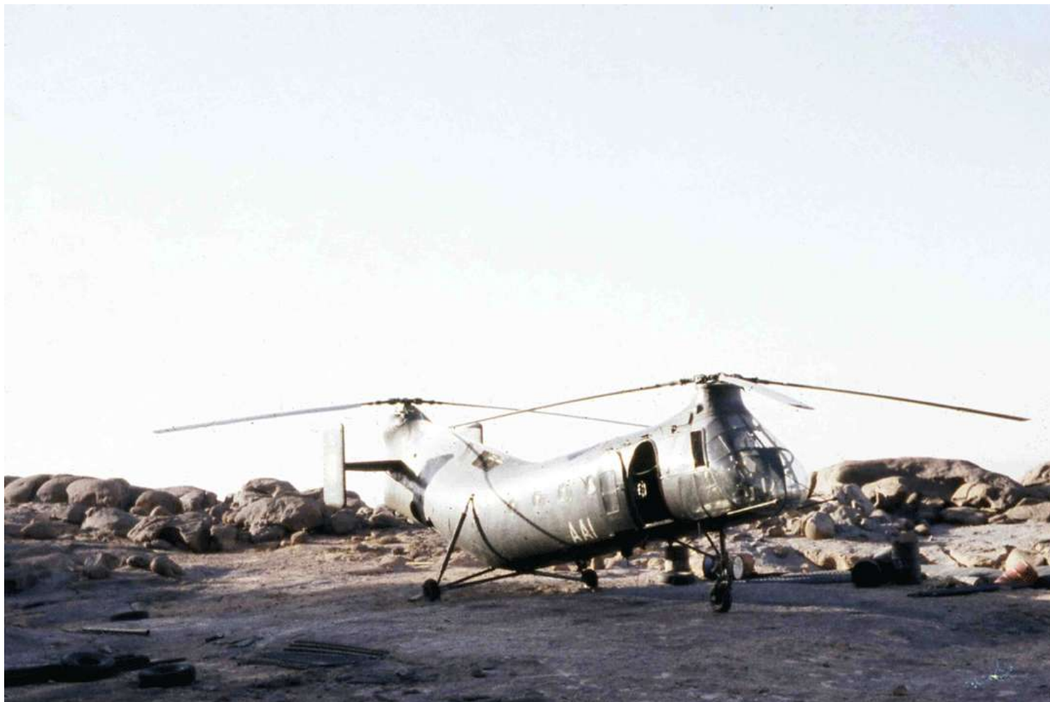
H-21 n° FR77/AAI du 14 e GALAT en 1963 à In-Amquel.