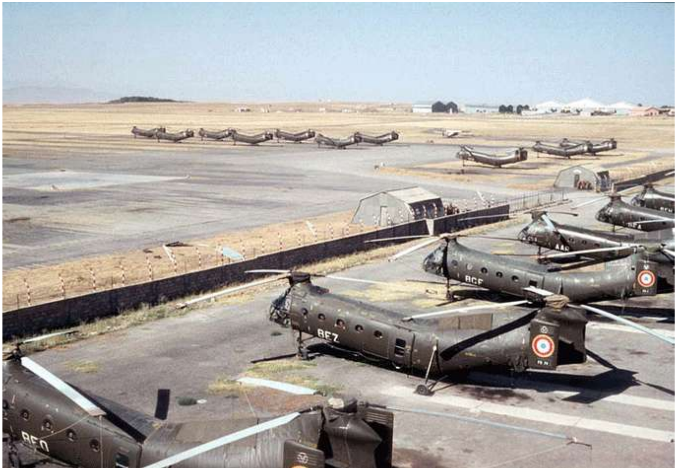
FR70/BEZ du GH N°2, sur le parking d'Ain-Arnat, en octobre 1962.