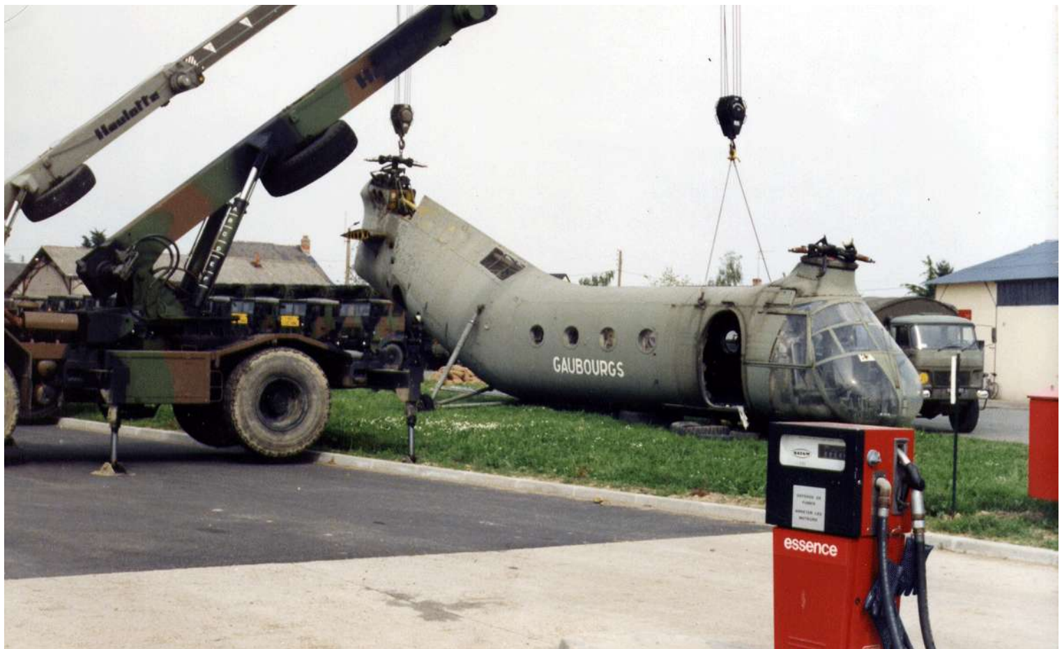
FR63. 4 mai 1992, départ de l'EAG d'Angers, de la Banane destinée au musée de Dax.