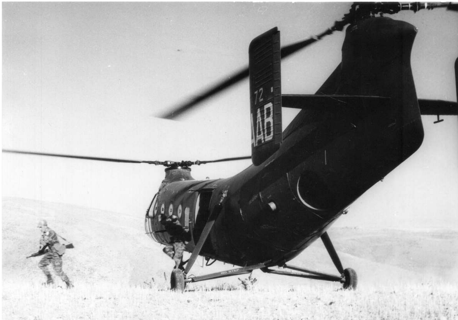
Le FR72/AAB du GH N°2 déposant des commandos.

56-2056 15/04/58 marché n° 6327/56 09/06/58 départ de Norfolk sur le transport d'aviation "Dixmude" (RFM n°134) 09/06/58 arrivée à Alger par le transport d'aviation "Dixmude" 16/06/58 GH N°2 AAB MARINE (non pris en compte) 31 F 31.F-6 .. /09/58 rendu ALAT GH N°2 AAB 12/04/59 accidenté à 70% dans la région de Souk-Ahras au poste de Namman Zaid. En finale d'approche sur une DZ ops. le co-pilote commet une erreur de pilotage. Le premier pilote ne peut rattraper l'appareil au cours du posé et le couche pour limiter l'accident ». La partie AV prélevée pour reconstruire n° FR 42. 05/05/59 réformé avec .... heures de vol