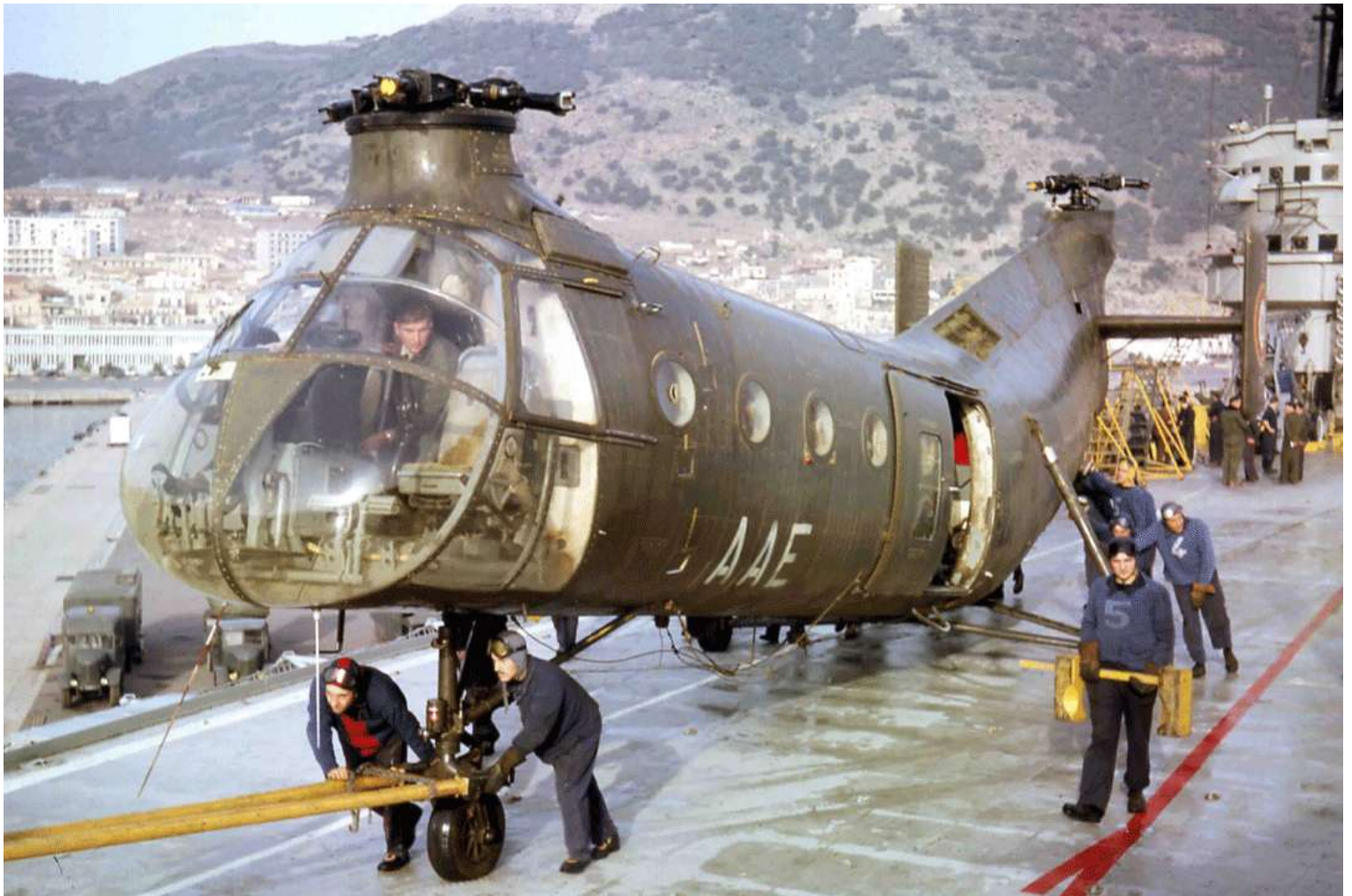
H-21 n°74/AAE, du 14 e GALAT, à bord du porte-avions "Arromanches". Le navire appareille le 14 janvier 1964 de Mers-el-Kébir à destination de Toulon où il arrive le lendemain.