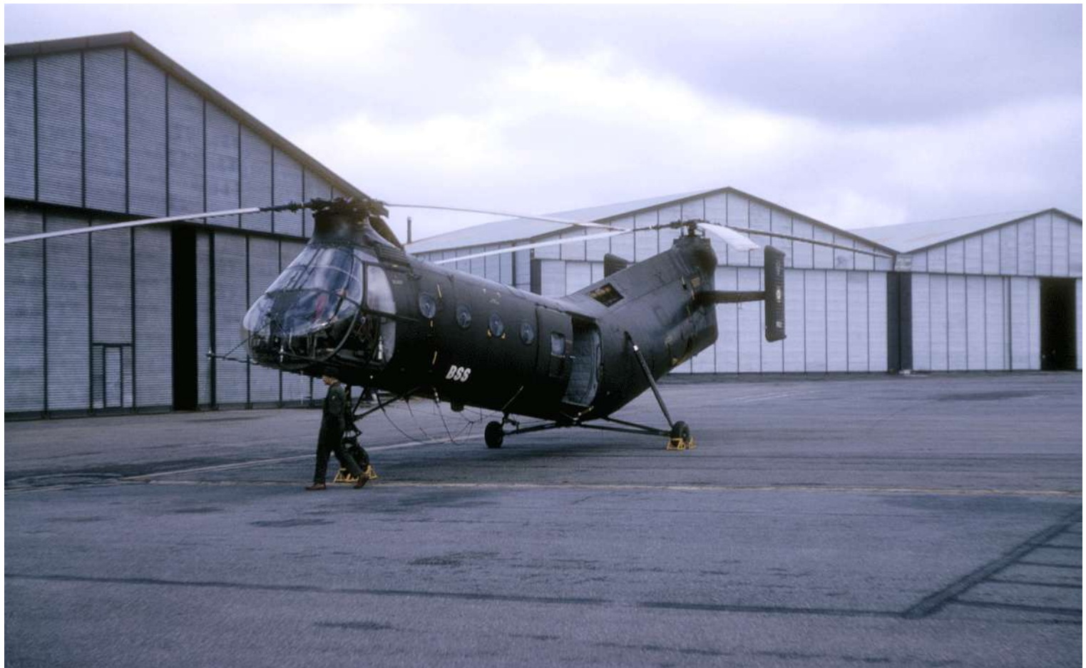
FR51/BSS, en 1965 à Dax.