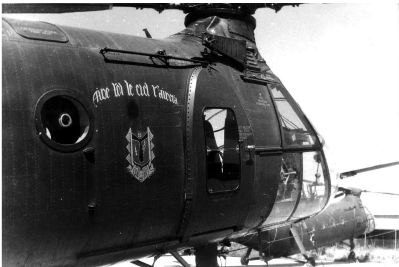
FR55/BEI du GH N°2 "Aide toi le Ciel t'aidera".