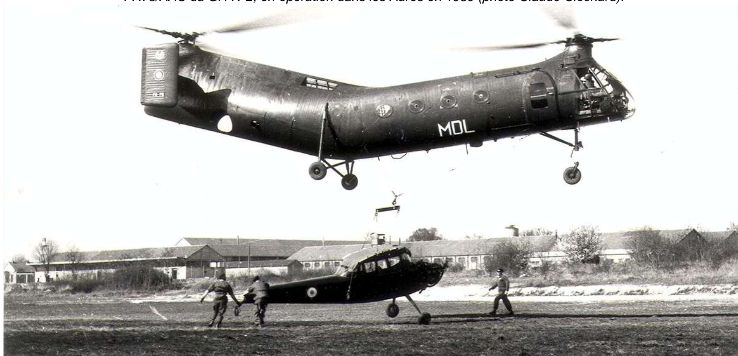
FR73/MDL transportant sous élingue un Cessna L-19E, à Bourges.