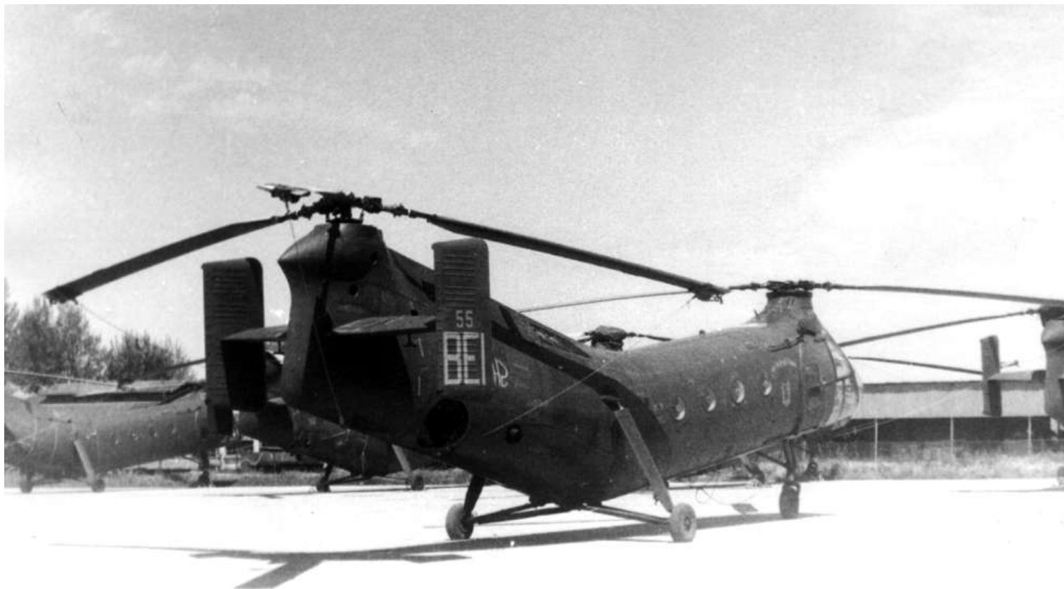
FR55/BEI du GH N°2.