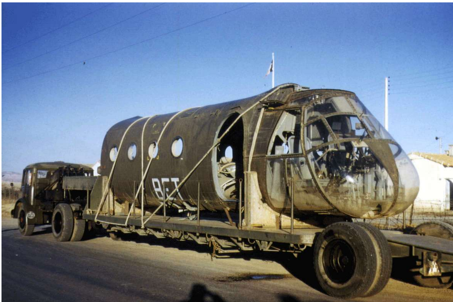
FR66/BET. Transport sur Alger de la cellule de l'appareil accidenté. Il est étonnant qu'après un tel crash on ait aucune idée des circonstances ni trace d'une quelconque clôture d'enquête.