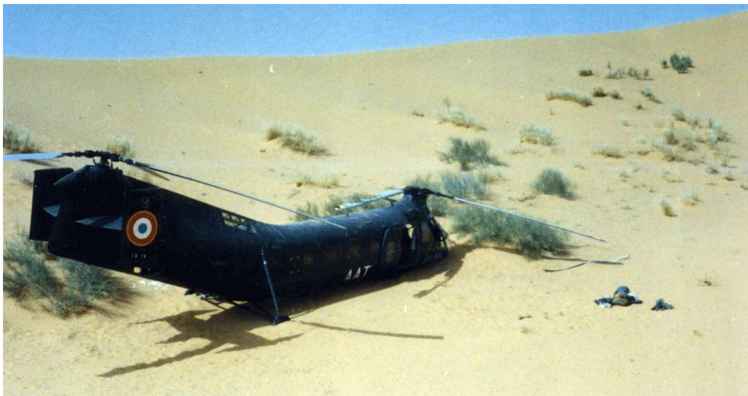
Banane FR78/AAT, de l'UIH de Colomb-Béchar du GH N°2, le 14 avril 1963, accidentée près d'Igli, dans le grand erg occidental.