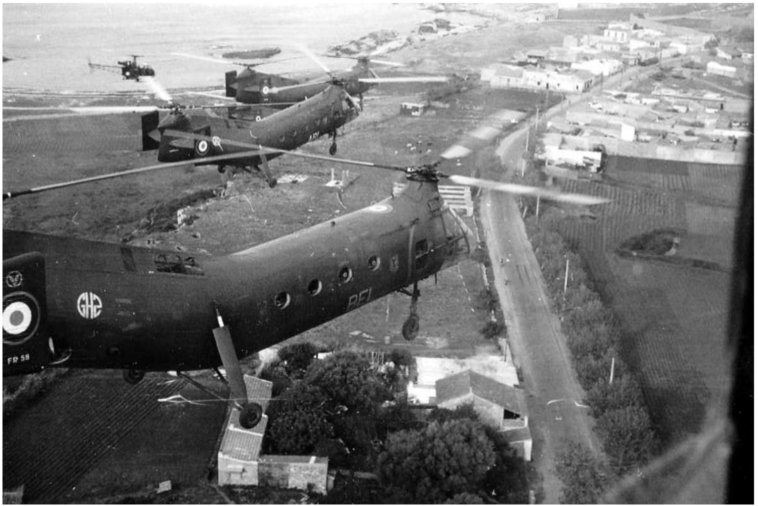
FR58/BEL du GH N°2 à Djidjelli.