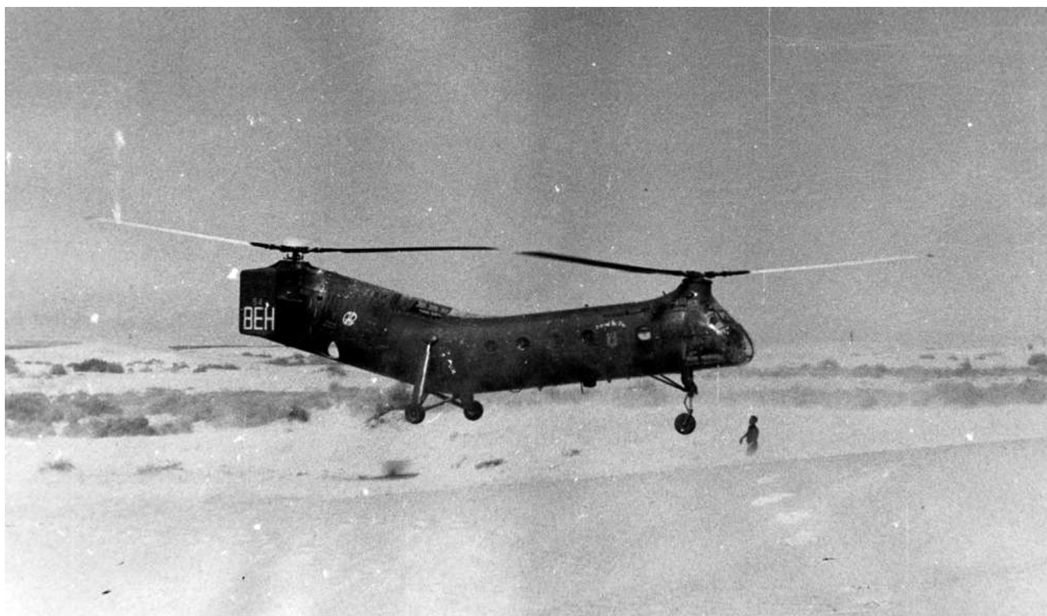
FR54/BEH, du GH N°2, dans le Constantinois. La photo pourrait avoir été prise pendant la campagne d'expérimentation des pales métalliques prêtées par la société Vertol et qui ont conduit au crash de la machine en juillet 1959.