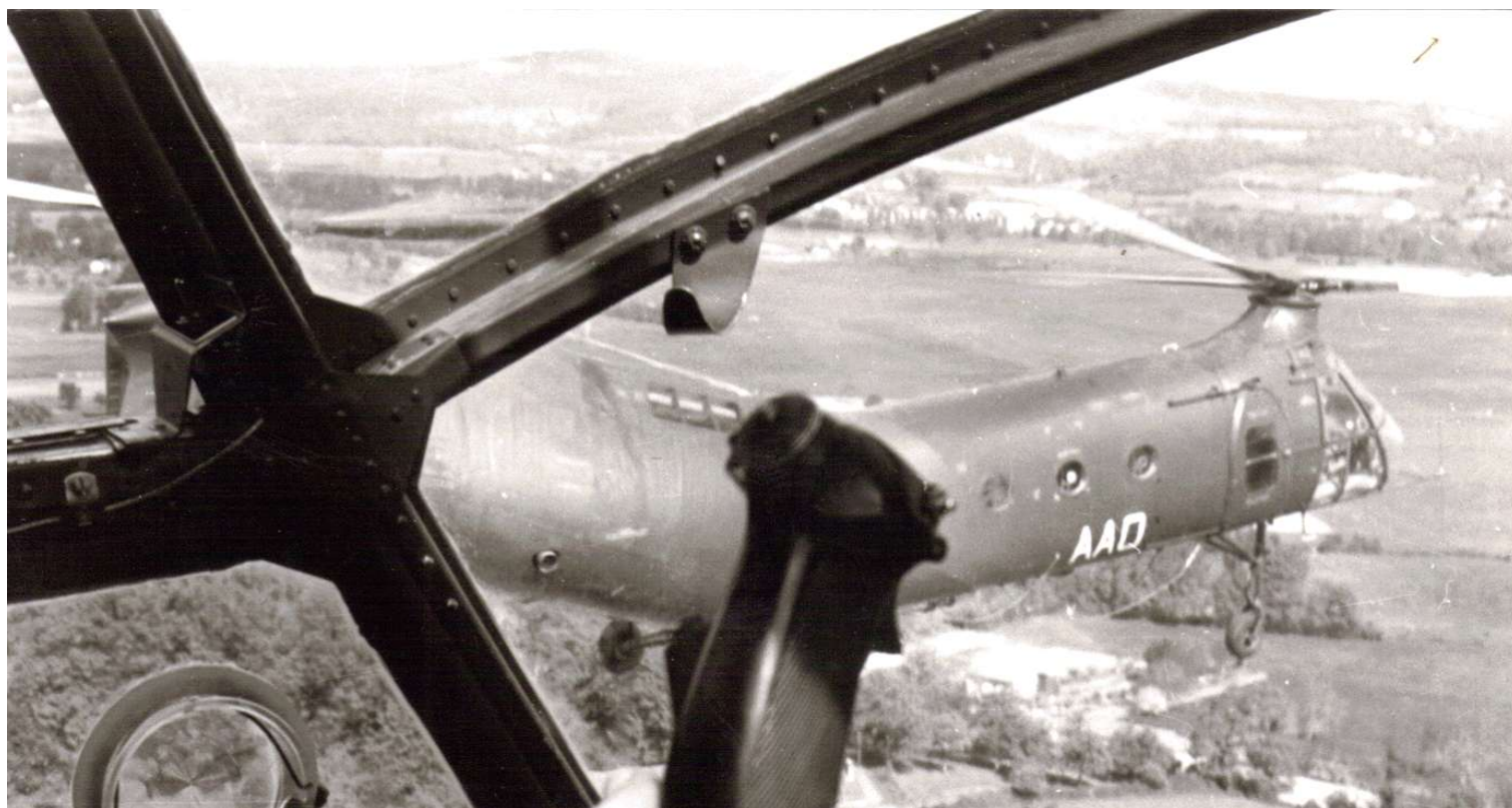
FR77/AAO, du GALAT 15, le 18 avril 1964 près de Dax.