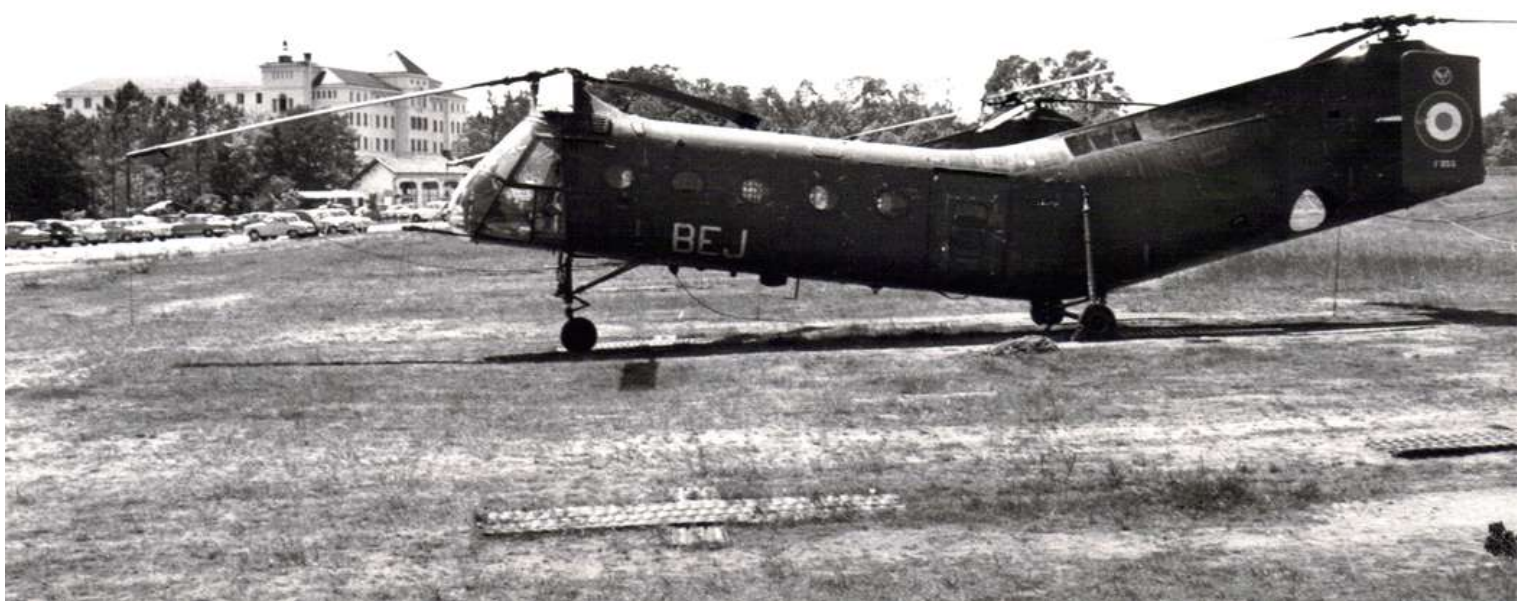
FR56/BEJ à Dax (photo X, collection Christian Malcros).