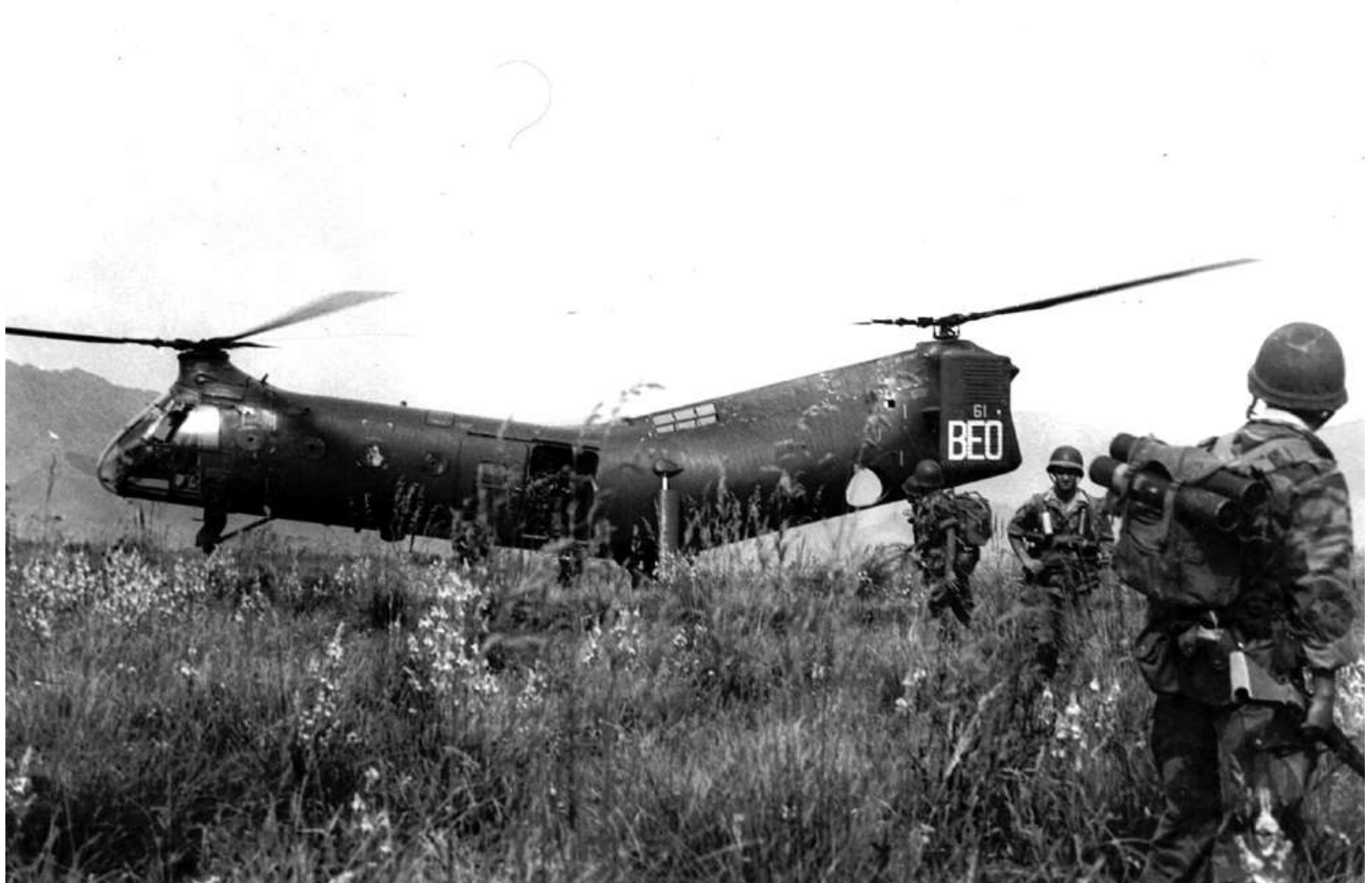
FR61/BEO du GH N°2.

56-2045 01/10/57 marché n° 6327/56 08/11/57 départ de Norfolk sur le transport d'aviation "Dixmude" (RFM n°239) 08/11/57 arrivée à Alger par le transport d'aviation "Dixmude" 08/11/57 GH N°2 BEO 00/09/59 IRAN AIA Maison Blanche avec 825 heures 28/12/60 GH N°2 BEO 28/12/60 GH N°2 AAO 12/04/63 14° GALAT AAO 15/01/64 arrivée à Toulon à bord du porte-avions "Arromanches" venant de Mers-el-Kébir 18/01/64 GALAT 15 10/01/64 OMP AAO 12/05/64 ERM Versailles 15/04/64 OMP attente IRAN 12/05/64 IRAN Héli Service Marignane avec 700 heures 16/10/64 MC Montauban 10/10/64 OMP stockage 18/11/64 GALAT 14 28/09/66 ERGM Bruz VP 300 + &change GMP 16/11/66 MC Montauban 28/11/66 OMP stockage 27/02/68 3° GALAT 19/01/68 OMP 24/01/69 ERGM Bruz 21/01/69 OMP VP 500 + &change GMP 14/02/69 MC Bruz 08/03/69 OMP stockage 07/05/69 3° GALAT 25/03/69 OMP 01/09/69 ERGM Bruz 29/09/69 OMP 01/07/70 retiré situation mensuelle 29/07/70 réformé avec 2122 heures de vol 17/04/70 DM n° 16318 DCMAT/ALAT/1 pour mise en place par l'ERGM de Bruz de la cellule de l'appareil à l'E-EAABC Saumur