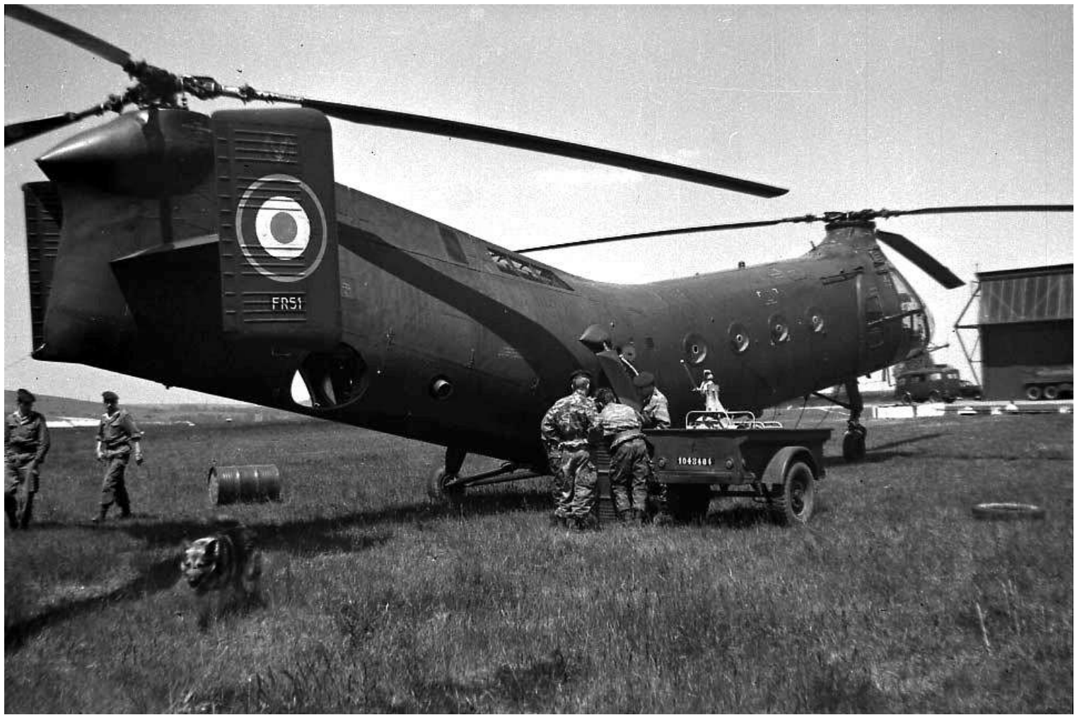
FR51/BSE, du GE-ALAT à Essey en 1962/63.