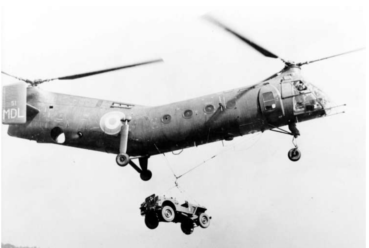
Bourges, ESAM, H-21 FR51/MDL.