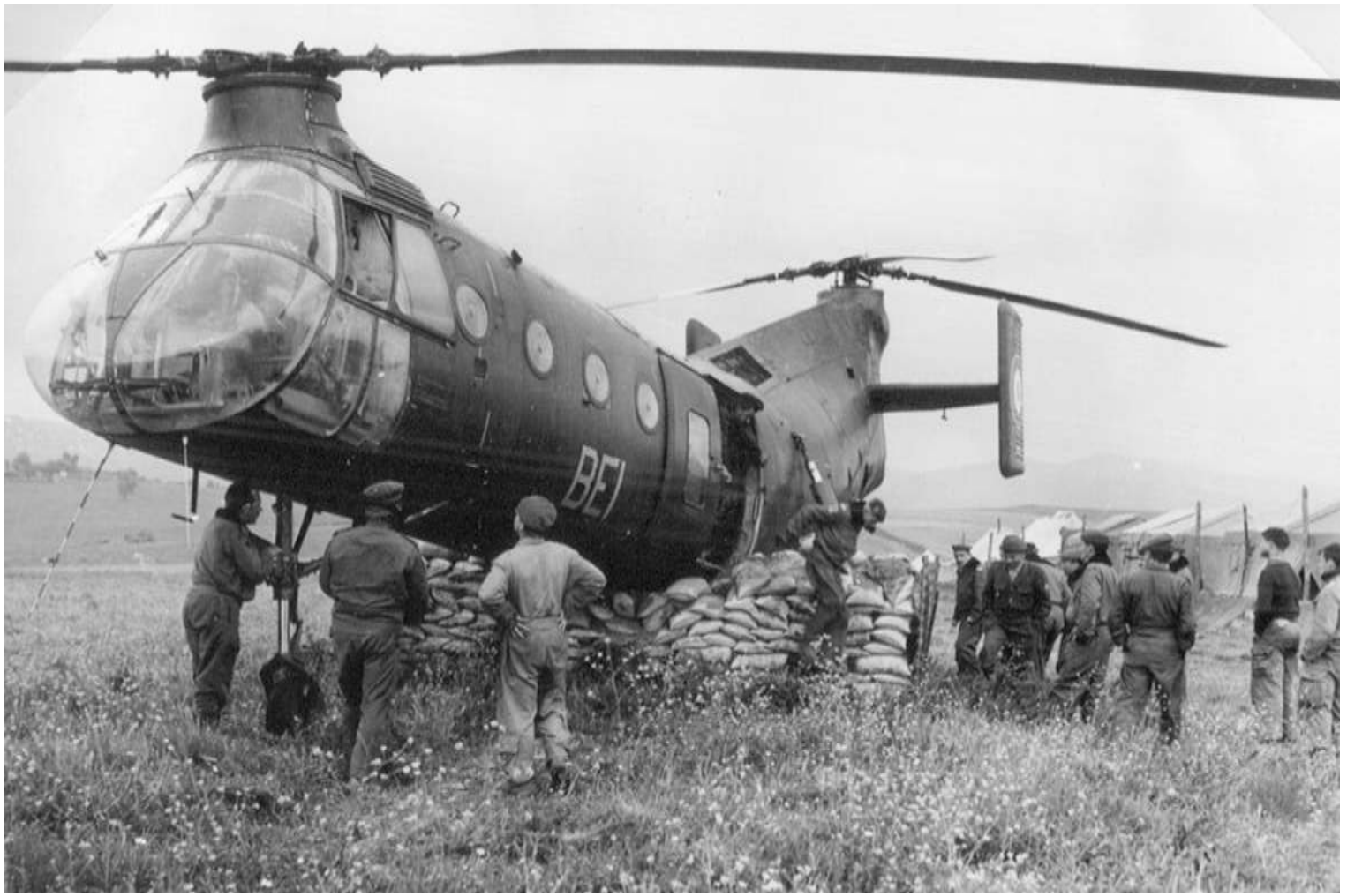
FR55/BEI. Souk-Ahras, 9 avril 1960, atterrissage sur berceau.