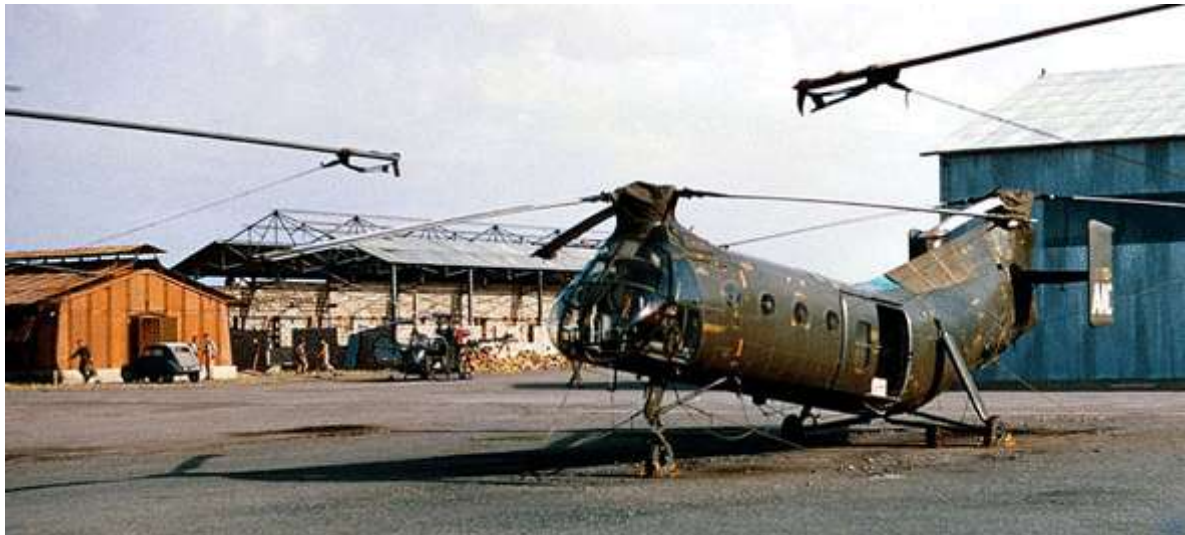
FR73/AAC du GH N°2.

FR73 C219 marché n° 6327/56 56-2057 15/04/58 départ de Norfolk sur le transport d'aviation "Dixmude" (RFM n°134) 09/06/58 arrivée à Alger par le transport d'aviation "Dixmude" 09/06/58 GH N°2 AAC 04/10/58 accidenté au cours d'un posé de commandos sur une DZ, le train principal est arraché par un rocher. Remis en état par le 3 e échelon. Remis en service le 6 janvier 1959. 04/10/58 3 e échelon après accident 06/01/59 GH N°2 AAC 24/06/60 IRAN AIA Maison-Blanche avec 603 heures 18/11/60 GH N°2 AAC GH N°2/EHR 08/01/63 retour métropole pour IRAN via SBA, Oran, Valencia et Perpignan ../01/63 ERM Versailles 17/01/63 OMP attente IRAN 30/01/63 IRAN Héli-Service Marignane avec 595 heures 05/06/63 accidenté au quartier du Valat aux Milles. 26/06/63 ESAM 05/07/63 OMP MDL 20/03/64 ERM Versailles échange GMP, VP, réparations radio 10/07/64 ESAM MDL 28/07/64 ESAM Bourges VP 100 01/09/64 ESAM MDL 30/09/64 ESAM Bourges échange booster pump et pales 21/11/64 ESAM MDL 08/07/65 ESAM Bourges VP 200 14/09/65 ESAM MDL 16/09/65 ERM Valence 03/08/65 OMP attente stockage 30/11/65 ERM Valence 05/11/65 OMP stockage 17/05/68 réformé avec 329 heures de vol 17/05/68 vendu aux ferrailleurs par décision 115/ALAT DRM5J pour la somme de 1 502 471 francs (7 497 330 en 1990)