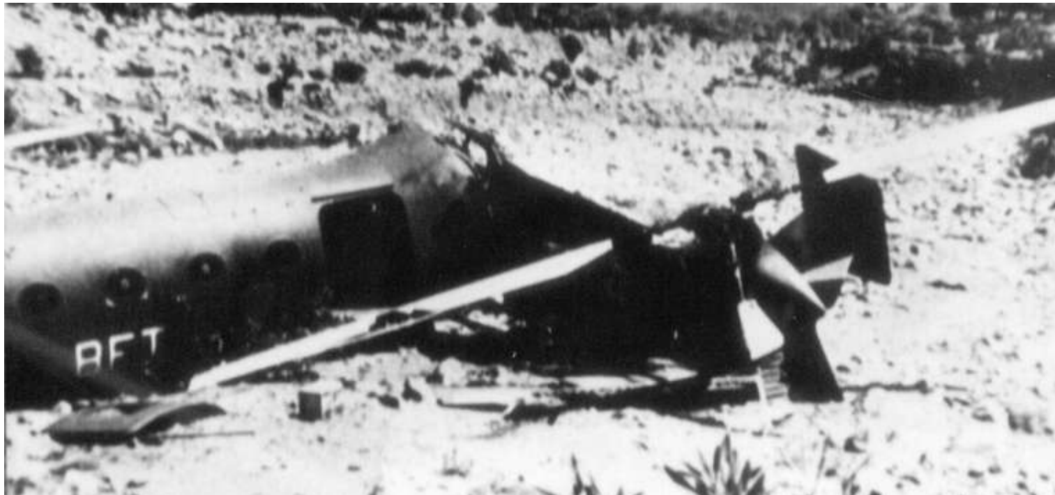
FR66/BET, accidenté le 16 mai 1961.