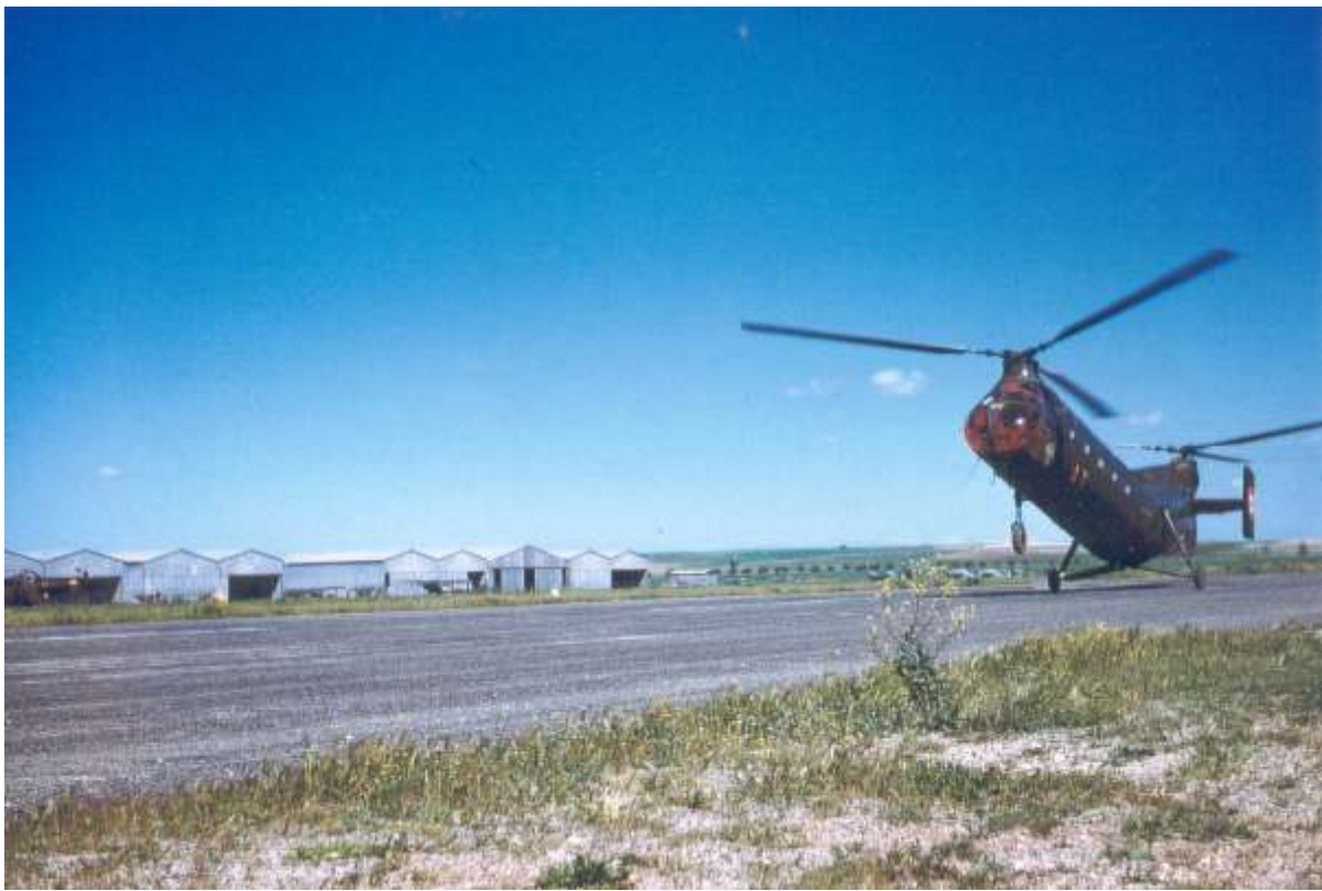
La FR 53 codée AT vue au décollage de l'EA.ALAT de Sidi-Bel-Abbès en 1960. La machine effectue un décollé-roulé sur la piste en dur. Comme les autres machines de l'école, le B de l'indicatif est supprimé. Notez, dans le poste de pilotage les panneaux oranges destinés à l'entraînement au Vol Sans Visibilité.