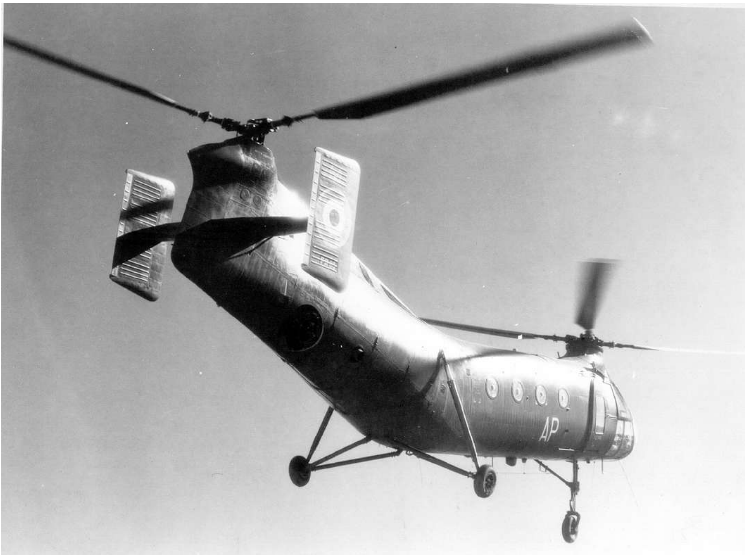
FR65/AP, de l'EA.ALAT à Sidi bel Abbès, en 1961.