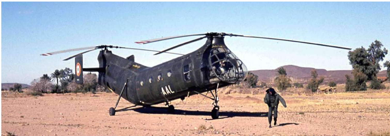
H-21 n° FR55/AAL du 14 e GALAT, à In-Amguel, en 1963.