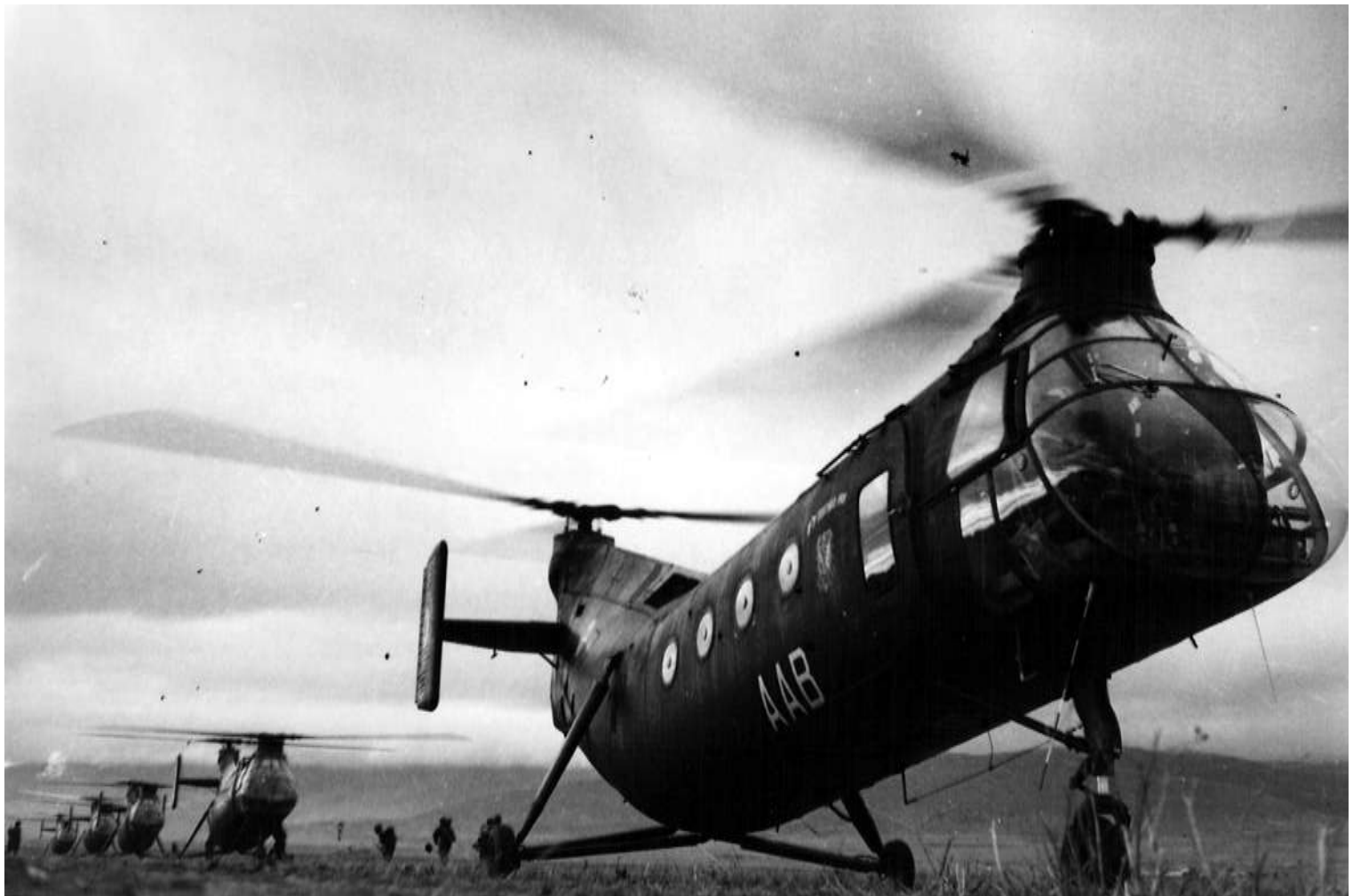
FR74/AAB du GH N°2, lors d'une opération dans le Constantinois, en 1958.