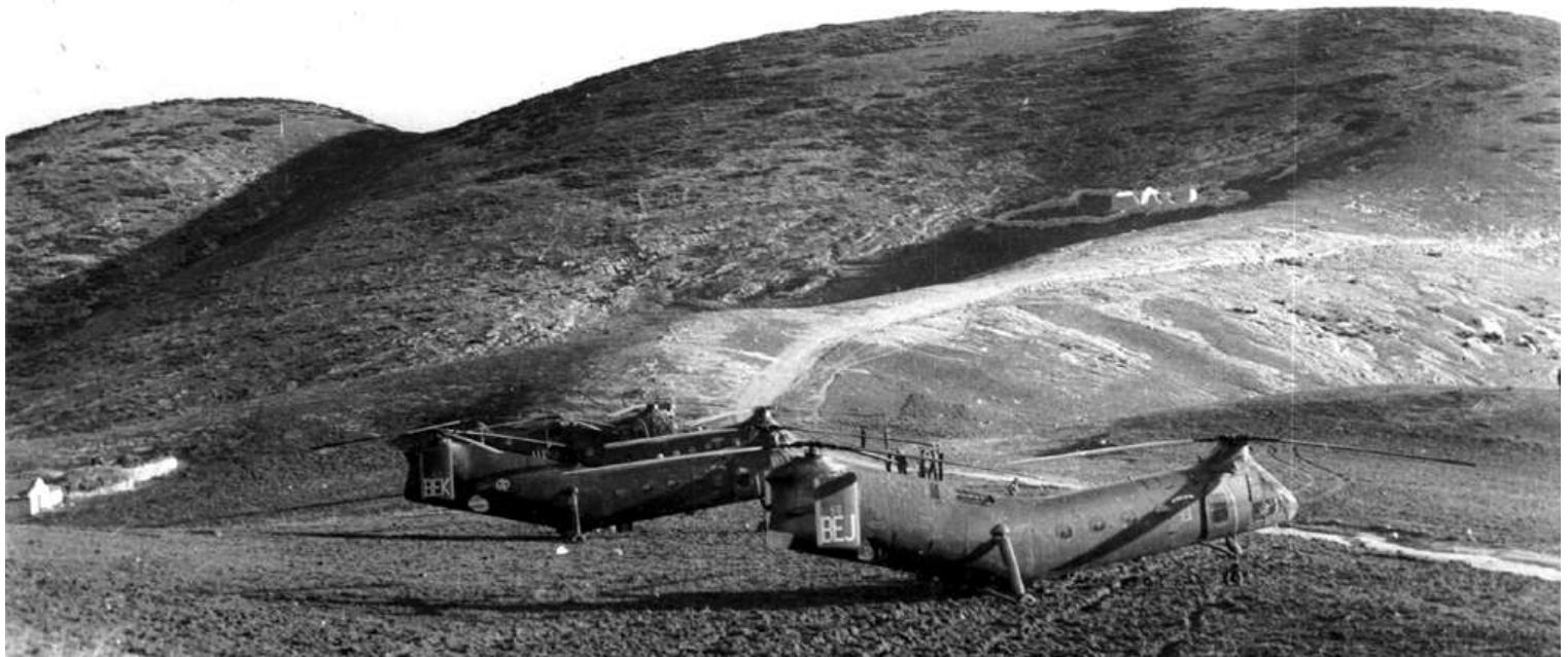
Au second plan, le FR57/BEK du GH N°2, en opération dans le Constantinois.