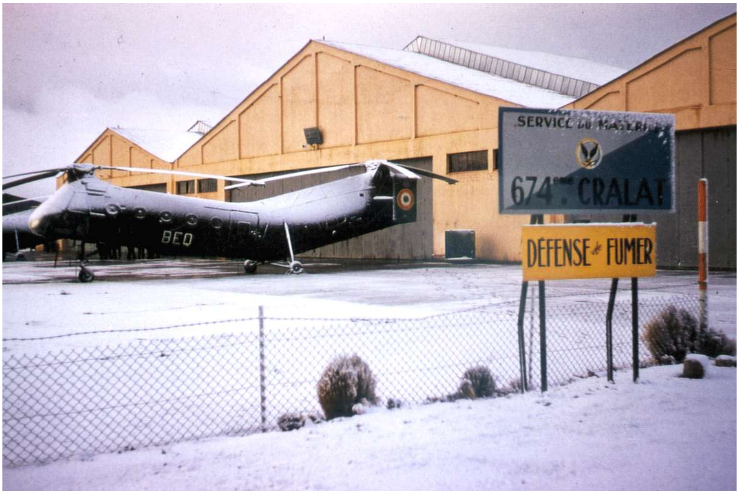
FR63/BEQ. A Sétif, durant l'hiver 1961/1962, à la 674 e CRALAT.